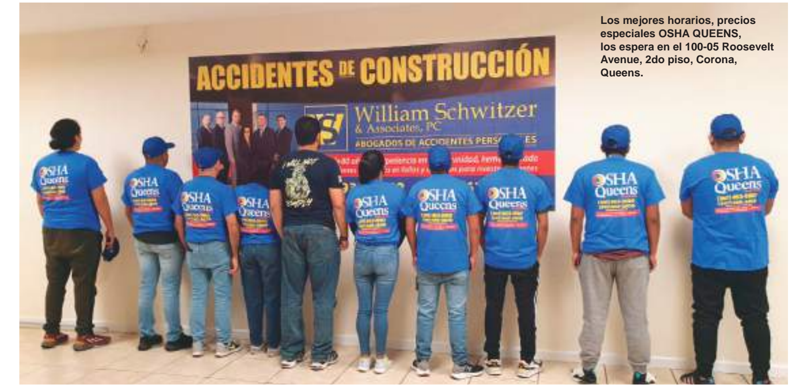
Los mejores horarios, precios especiales OSHA QUEENS, los espera en el 100-05 Roosevelt Avenue, 2do piso, Corona, Queens.

nuestros trabajadores de la construcción en todas sus necesidades y requerimientos, porque nos preocupamos por su bienestar y estamos con Uds. para servirlos con esmero, respeto y eficiencia.