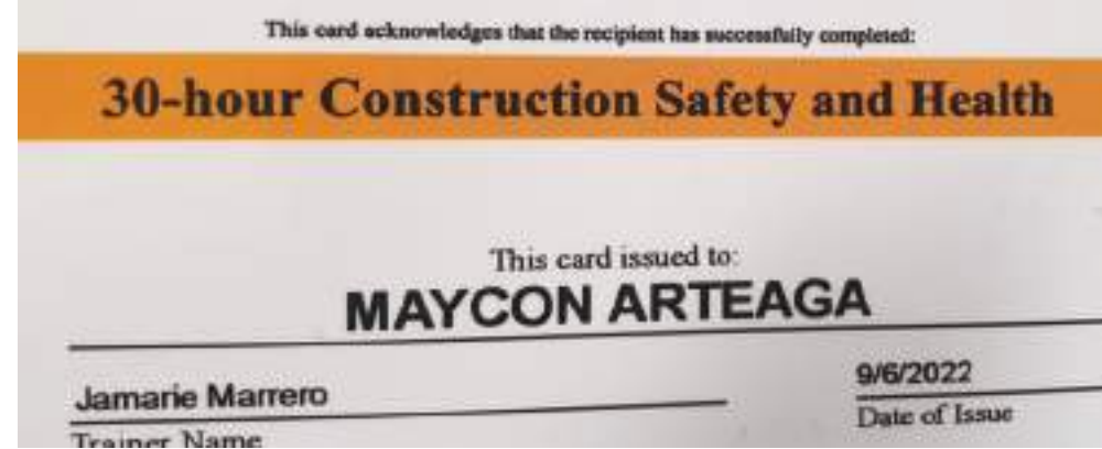
Las tarjetas de Osha Ud. las puede obtener sin problemas, en su idioma y al mejor precio, OSHA QUEENS, 100 - 05 ROOSEVELT AVENUE, 2DO PISO.

"OSHA QUEENS", No es simplemente una escuela de capacitación, es un centro de ayuda comunitaria para