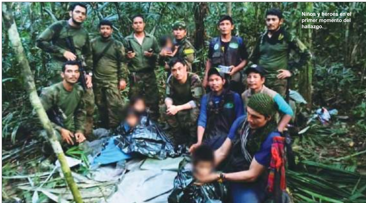
Niños y héroes en el primer momento del hallazgo.

El fotógrafo y profesor de la Universidad Nacional de Colombia, admite que durante estos 40 días los niños fueron vulnerables: el alimento es escaso y la relación