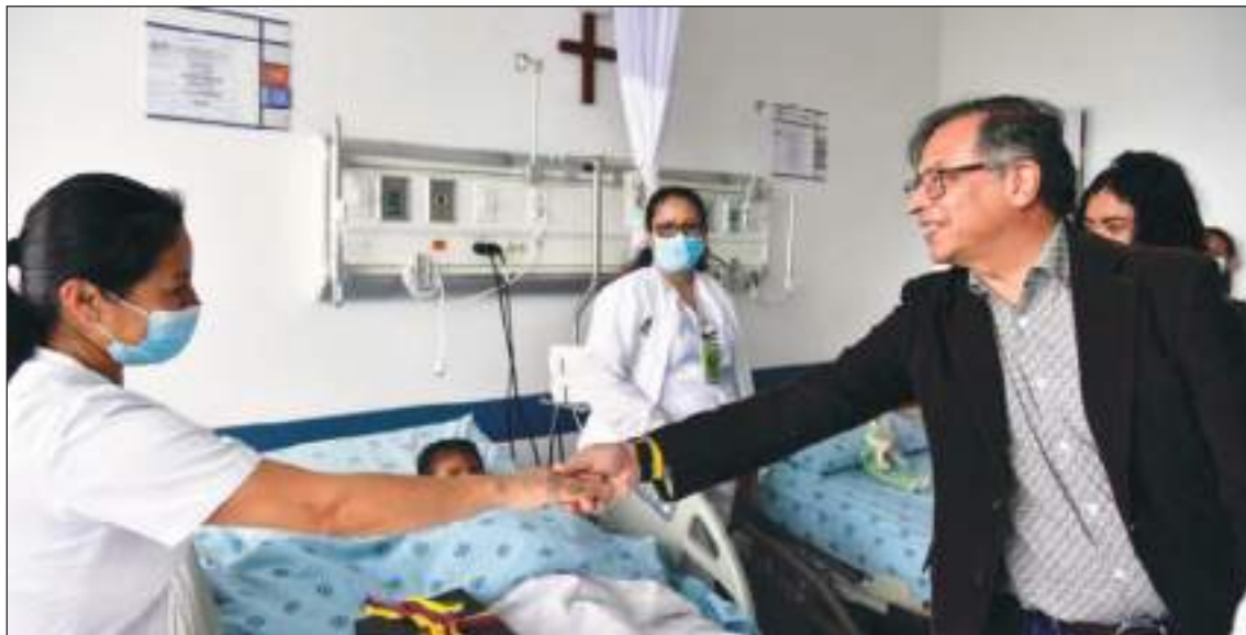
El presidente colombiano Gustavo Petro, estuvo visitando a los niños indígenas.

No es que se pierdan, porque están en su entorno, pero sí están a la deriva, sin saber que van a regresar a su resguardo. Y eso es o porque no se sabe el camino, o porque los dueños de ese espacio, los espíritus de la selva, deciden que no es el momento de volver.