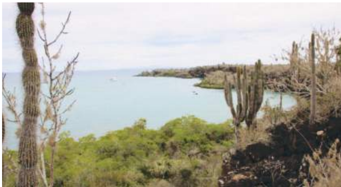
El archipiélago de Galápagos está situado a unos 1.000 kilómetros al oeste de las costas continentales ecuatorianas y fue declarado en 1978 como patrimonio natural de la humanidad por la Unesco.

El Gobierno explicó que el directorio del Galápagos Life Fund tiene once miembros, de los que ocho son ecuatorianos y tres extranjeros, con fondos que provienen de fundaciones y "no implica en absoluto el uso de fon-