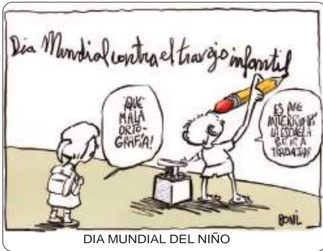
DIA MUNDIAL DEL NIÑO