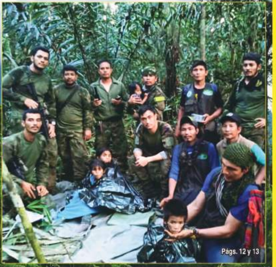
Págs. 12 y 13

La selva los cuidó y lograron sobrevivir