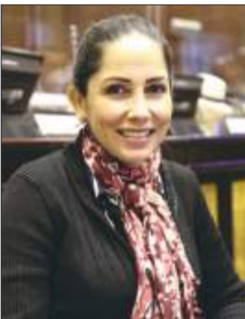
Teniendo en cuenta la coyuntura política en Ecuador, Luisa González tendría gran chance de ganar.

por cumplir, por lo que sus derechos políticos están suspendidos, a lo que agrega que el delito por que se lo condenó, lo inhabilita, perpetuamente, para aspirar a cargo público. Ni de broma el Consejo Nacional Electoral podría inscribirlo".