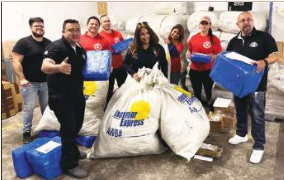
Juntos en equipo llenando el contenedor con destino a Guayaquil “Va Por Ti Ecuador”.