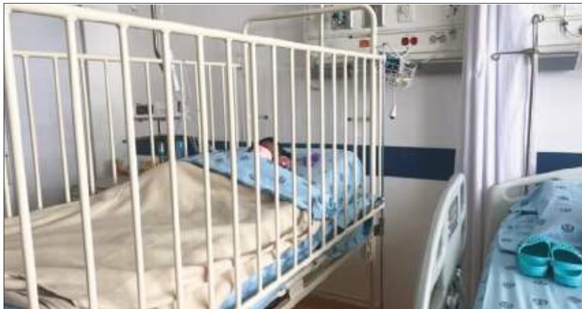
Después de 40 días de sufrimiento, finalmente pudieron dormir en una cómoda cama.