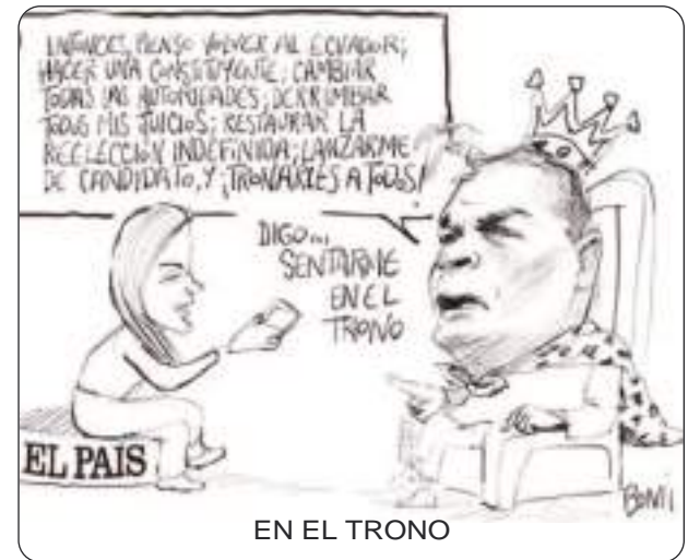
EN EL TRONO