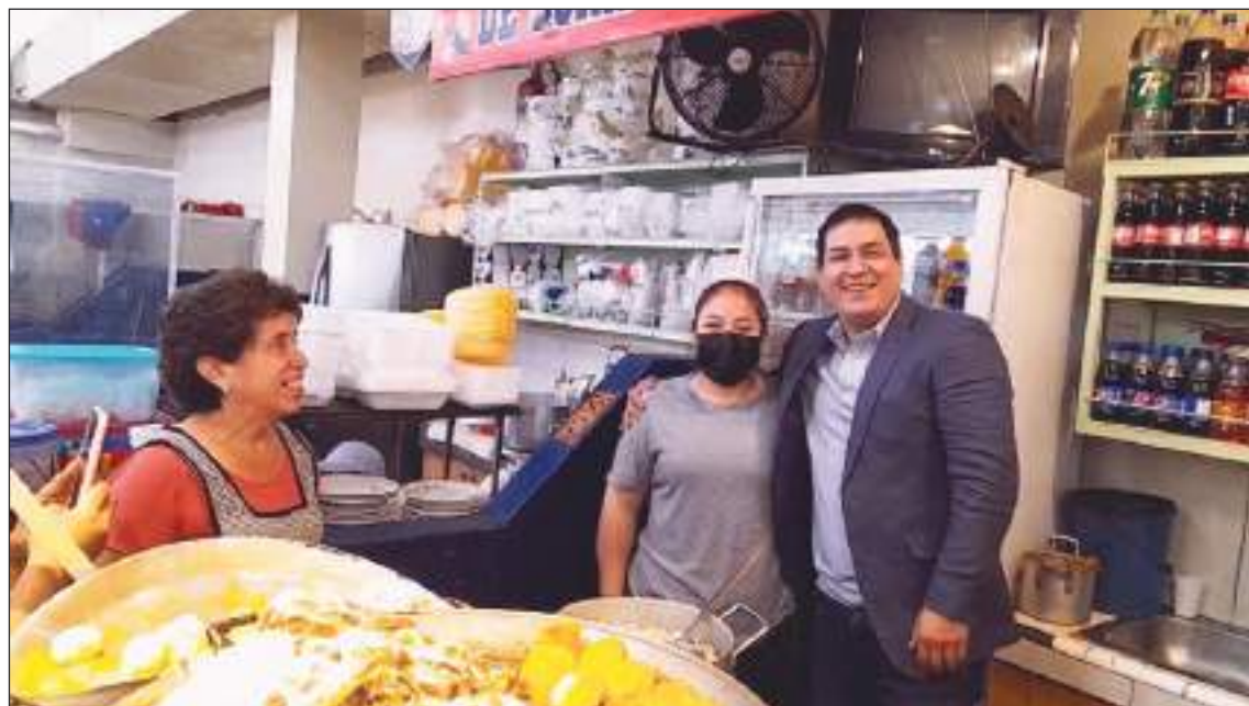
Arauz aprendió bastante en la pasada campaña y ahora ya empezó a trabajar para la nueva contienda.

Las autoridades que salgan elegidas de estos comicios completarán el periodo 2021-2025, interrumpido por la "muerte cruzada" decretada el pasado mayo por el actual presidente, el conservador Guillermo Lasso, que optó por disolver la Asamblea Nacional (Parlamento) y forzar esta cita electoral cuando el Legislativo se disponía a debatir y votar su destitución.