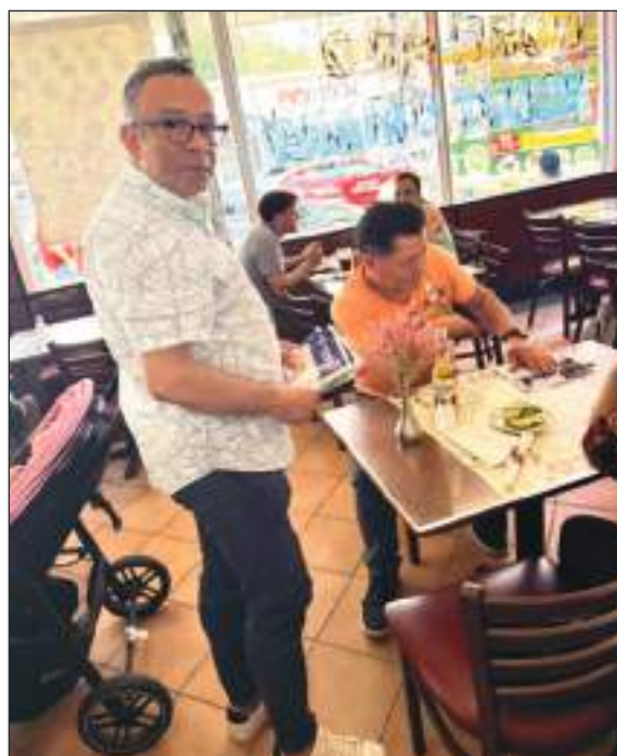
Una parada en el restaurante Hornado Ecuatoriano entregando flyers para la inscripción y poder ejercer el derecho al voto telemático.