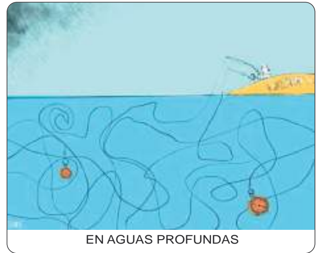
EN AGUAS PROFUNDAS