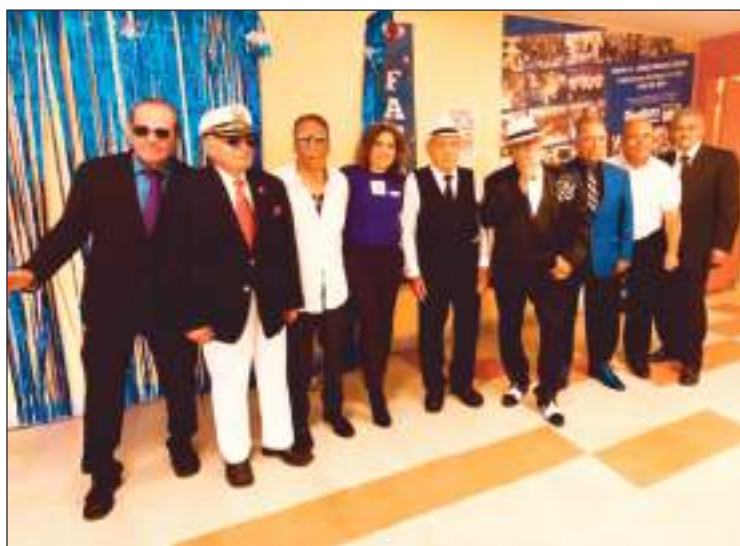
Los padres de Diana H Jones fueron festejados a lo grande.

Ecuador News les quiere desear muchas felicidades y que cumplan muchos años más al servicio de la comunidad.