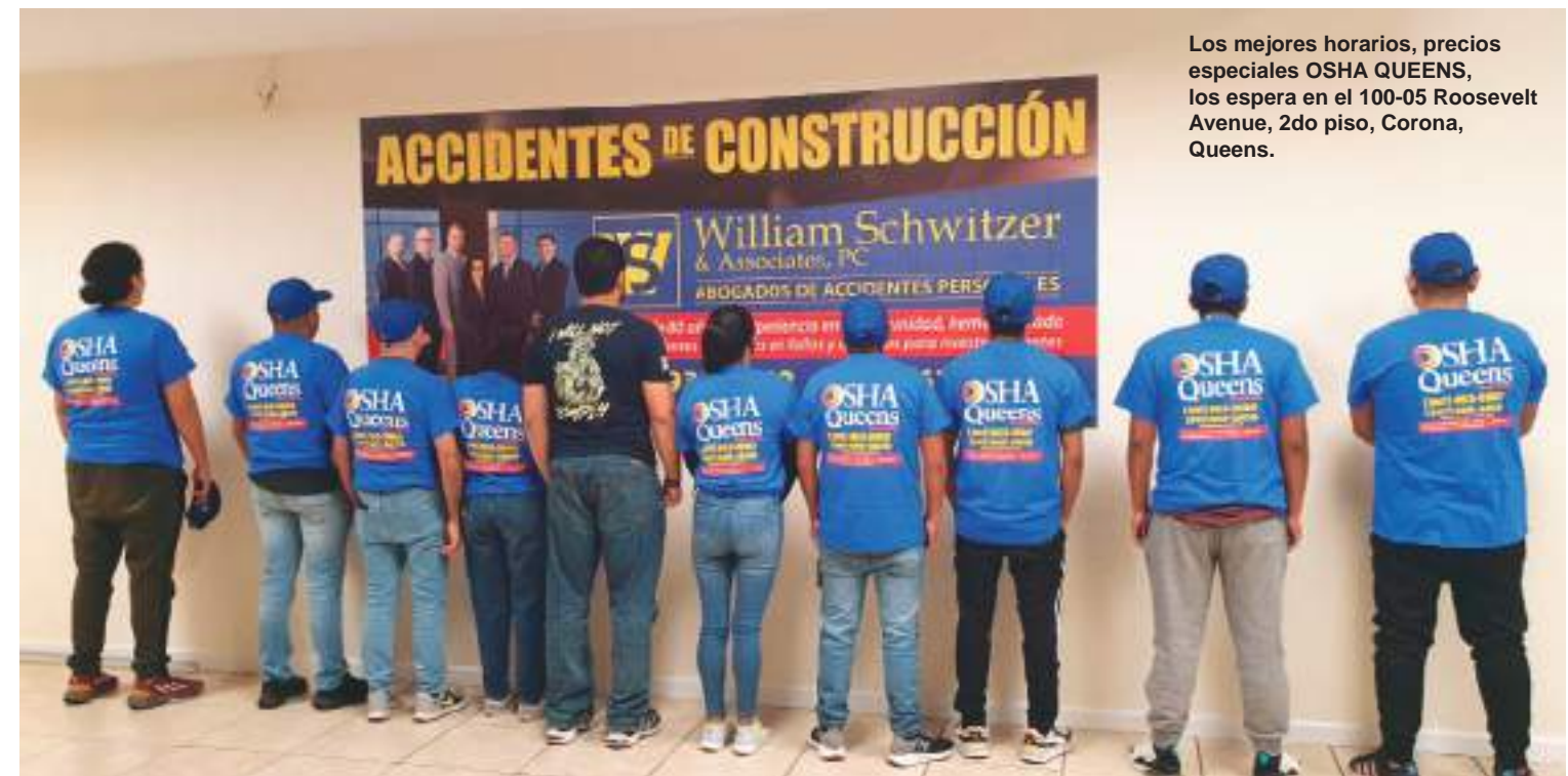
Los mejores horarios, precios especiales OSHA QUEENS, los espera en el 100-05 Roosevelt Avenue, 2do piso, Corona, Queens.

nuestros trabajadores de la construcción en todas sus necesidades y requerimientos, porque nos preocupamos por su bienestar y estamos con Uds. para servirlos con esmero, respeto y eficiencia.