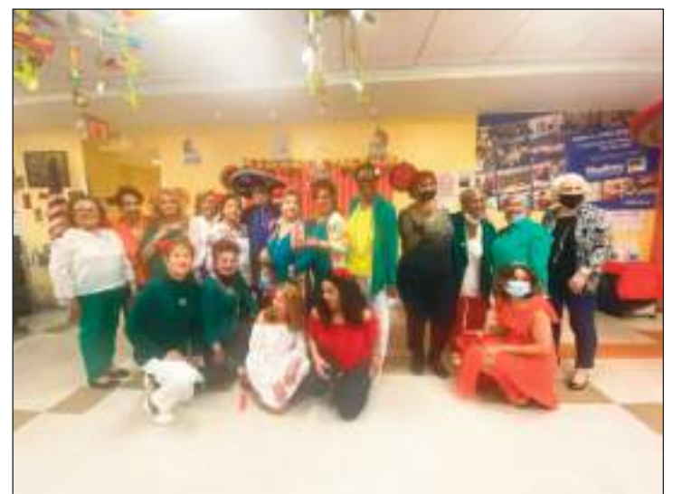
La camaradería se sintió en la feria de la amistad.