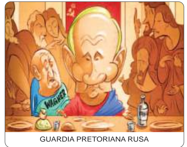
GUARDIA PRETORIANA RUSA