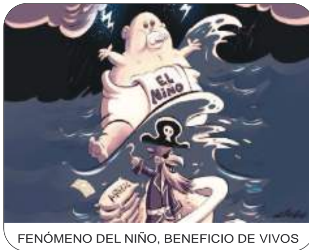
FENÓMENO DEL NIÑO, BENEFICIO DE VIVOS