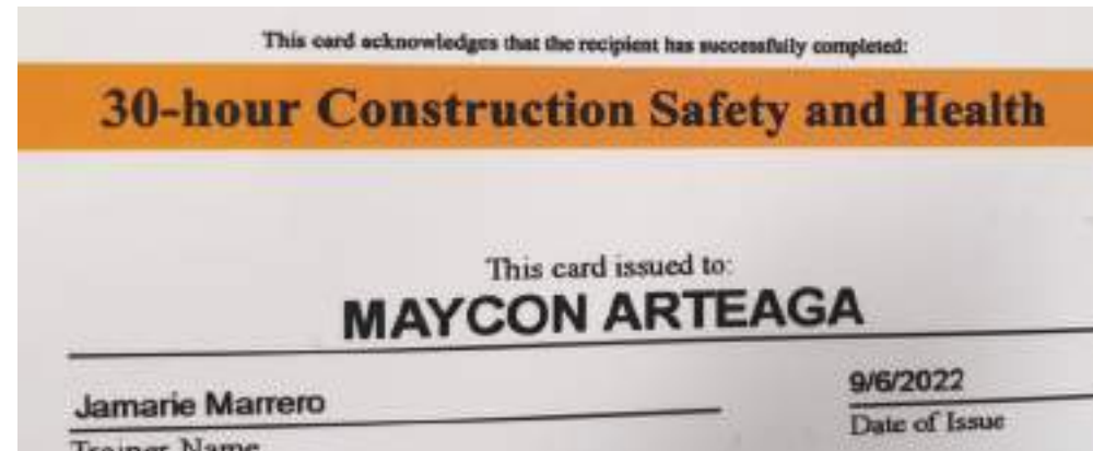
Las tarjetas de Osha Ud. las puede obtener sin problemas, en su idioma y al mejor precio, OSHA QUEENS, 100 - 05 ROOSEVELT AVENUE, 2DO PISO.

"OSHA QUEENS", No es simplemente una escuela de capacitación, es un centro de ayuda comunitaria para