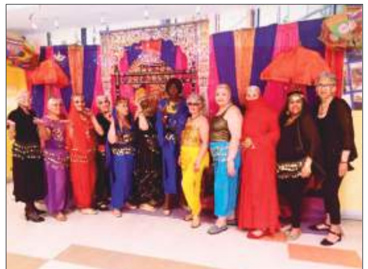
Se disfrutó mucho en la noche árabe, se pudieron apreciar lindos trajes.