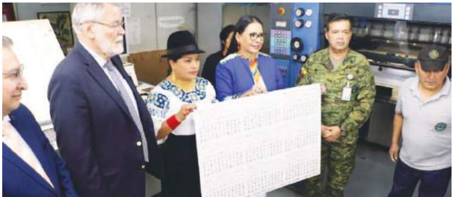
Diana Atamaint, presidenta del CNE, señaló que están listas las boletas para elegir asambleístas en siete provincias

Atamaint aseguró que el Ministerio de Economía y Finanzas ya les entregó 55,88 millones de dólares para los contratos que permitirán garantizar la organización de las elecciones. No obstante, precisó que todavía están pendientes los recursos para la contratación de personal el día de los sufragios, entre ellos los coordinadores de recinto y personas para el simulacro.