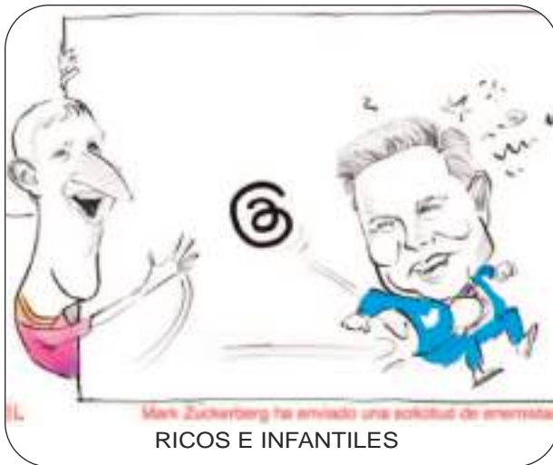
RICOS E INFANTILES