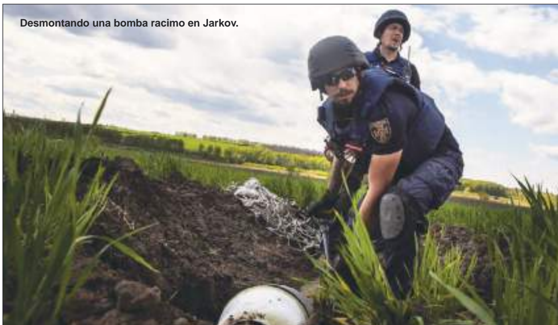
Desmontando una bomba racimo en Jarkov.

Es por eso que para Bloch, la clave está en que la sociedad civil siga abocada a exigirles a los organismos internacionales y nacionales “la rendición de cuentas por parte de los Estados en el cumplimiento de sus obligaciones en virtud de los tratados”.