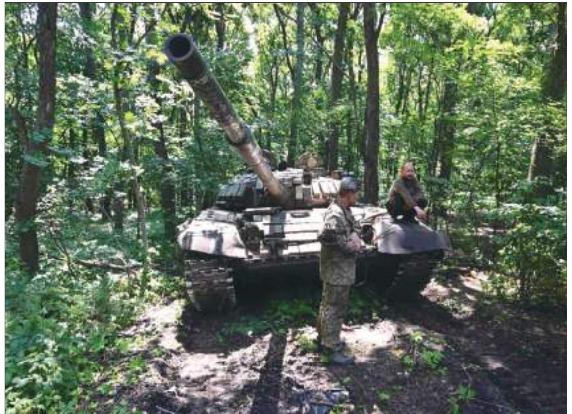
En Ucrania, como en todas las guerras, se usan todo tipo de armas, pero lo de las bombas racimo no se entiende.

Las bombas de racimo violan un conjunto de normas -como no atacar civiles o el principio de proporcionalidad- y convenciones que forman parte del Derecho Internacional Humanitario, que busca