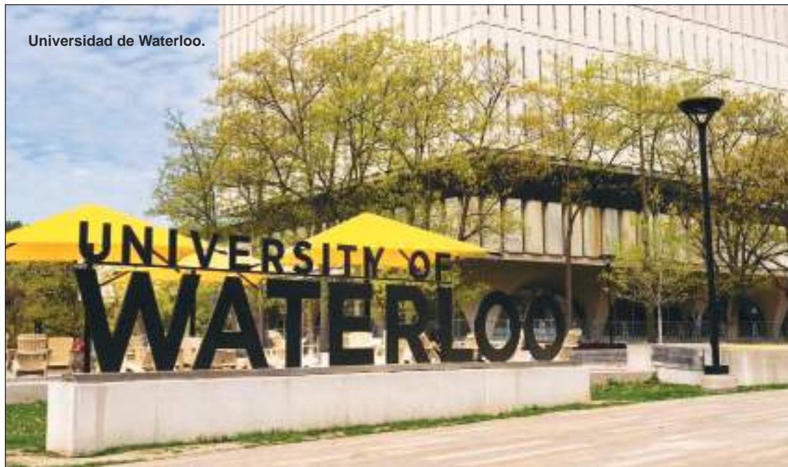
Universidad de Waterloo.

“En este caso, ese odio se convirtió en violencia, cambiando para siempre la vida del profesor y dos estudiantes que fueron atacados, así como la vida de todos los estudiantes que asistieron a su clase de estudios de género”.