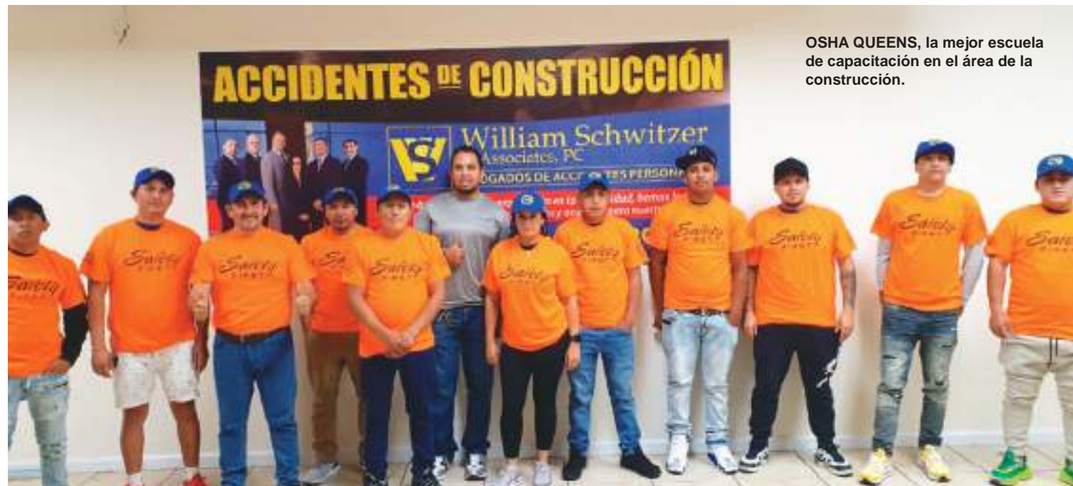
OSHA QUEENS, la mejor escuela de capacitación en el área de la construcción.