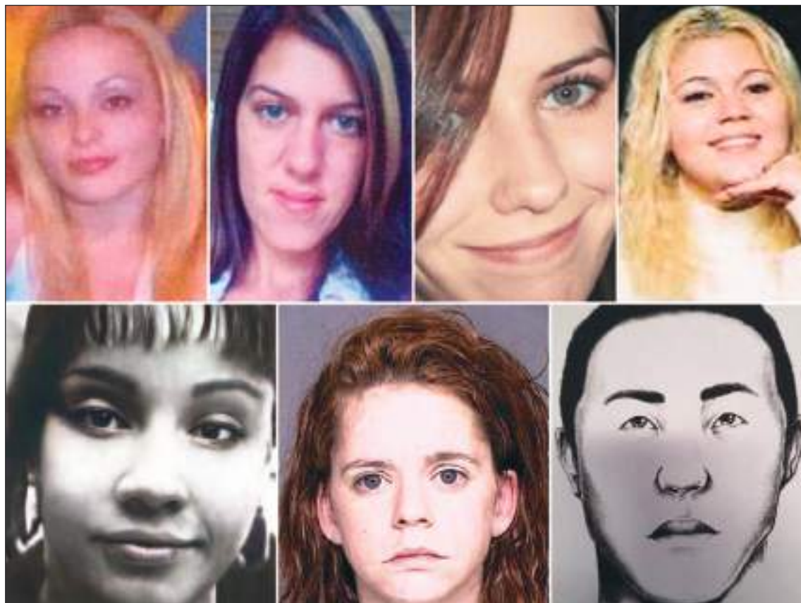
Parte de las mujeres que fueron engañadas primero y asesinadas luego, por un asesino serial que se escondía en la fachada de un hombre de familia, trabajador y respetuoso. Pudo más su perversión.

Hay varias anotaciones suyas de la época de los crímenes, que describen su manera de ser solitaria y extraña. Se dice que no hablaba con nadie en el vecindario. Pero se quejaba, por ejemplo cuando escribió una especie de actualización meteorológica: "Nevó, llegó a las 13 pulgadas. No me gusta cuando otros no mueven los vehículos cuando viene el arado (sic). Siempre tengo más nieve para palear". Se refiere a la animadversión que sentía por quienes no colaboraban con la limpieza cuando el