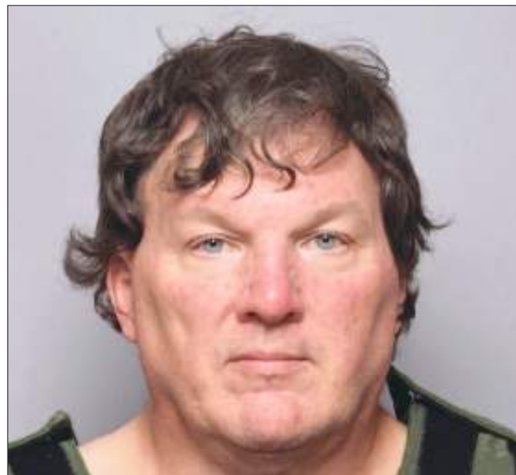
Rex Heuermann es el sindicado de tan atroces crímenes.

El misterio atrajo los titulares nacionales y mundiales durante muchos años y los asesinatos sin resolver fueron el tema de la película de Netflix de 2020 "Lost Girls". Se trata de una desesperada