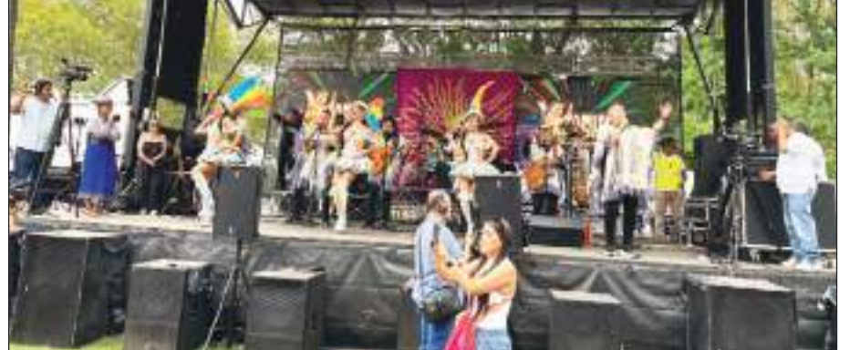
Los Kjarkas fueron los invitados especiales de este festival del Inti Raymi.