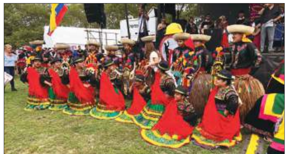
Grupo folclóricos de todas partes se hicieron presentes.