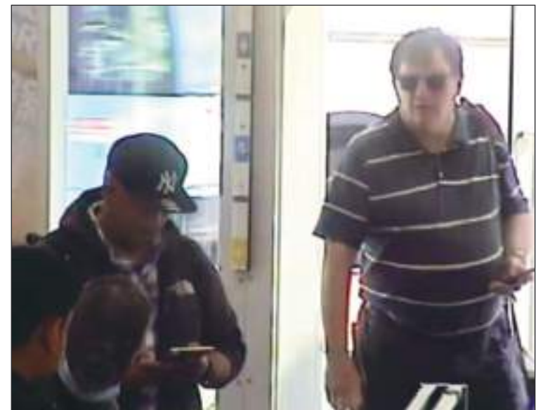
Los investigadores lo sorprendieron en varias ocasiones comprando tiempo para celulares desechables que usaba para sus propósitos.

“Básicamente, nunca tuvimos ningún contacto con él... viviendo aquí 22 años y nunca le dijimos ni una palabra”, dijo, aunque se apresuró a señalar que “una manzana podrida no echa a perder al grupo” de una “gran manera”. vecindario.”