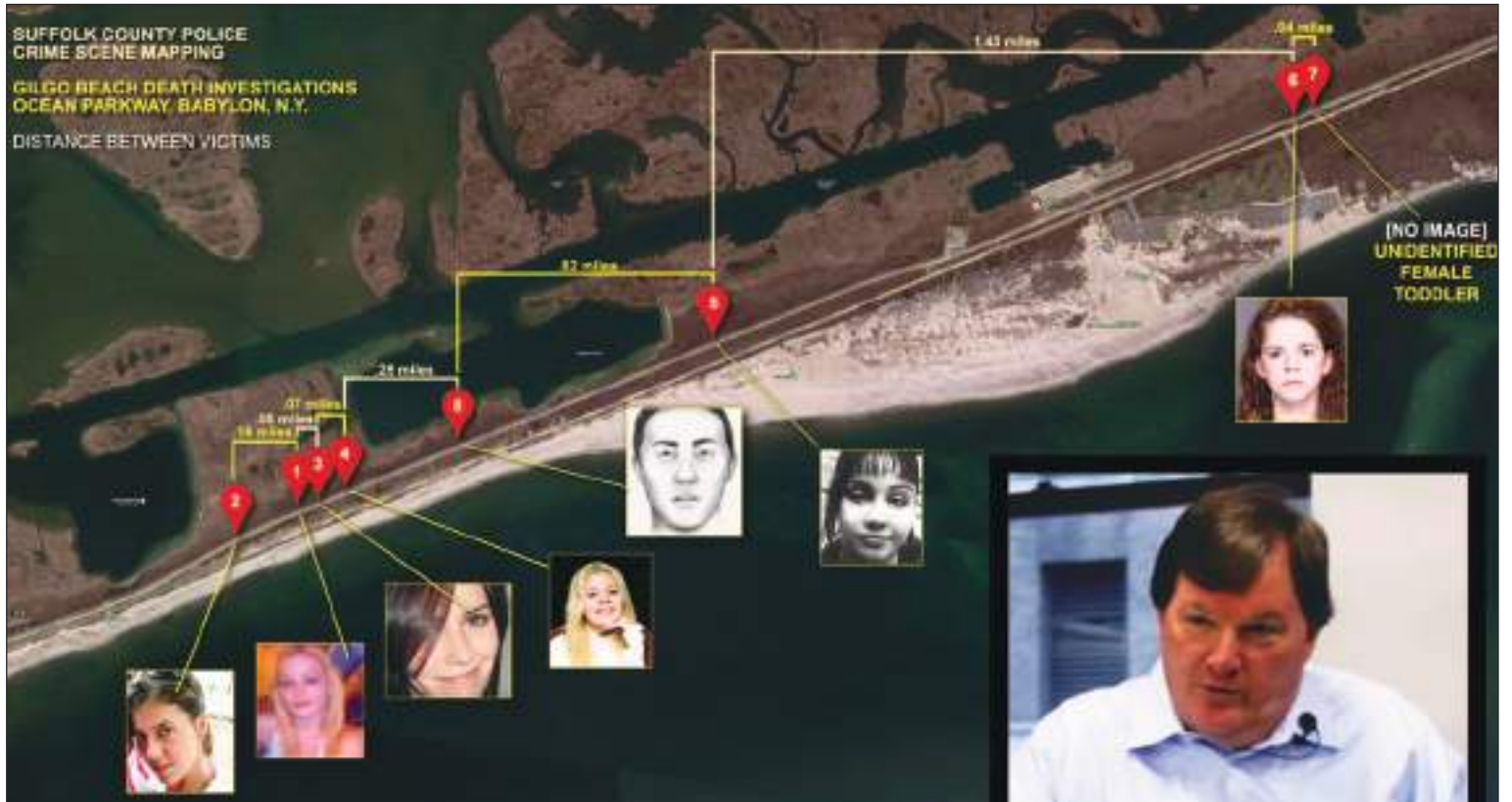
La ruta de la muerte que los investigadores encontraron antes de acusar a Rex Heuermann de tan terribles asesinatos en Long Island.