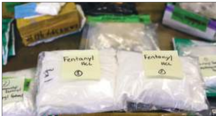
Mucho fentanilo se incauta, pero el consumo sigue creciendo.

A pesar de todo, la nueva canciller mexicana, Alicia Bárcena, estuvo en el encuentro para adherirse a la nueva coalición. El contenido de su participación no se ha hecho público de momento.