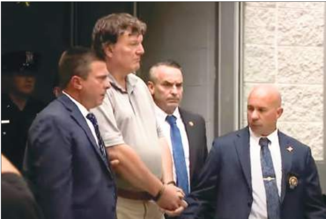
Finalmente Rex Heuermann fue detenido y conducido al banquillo de los acusados.