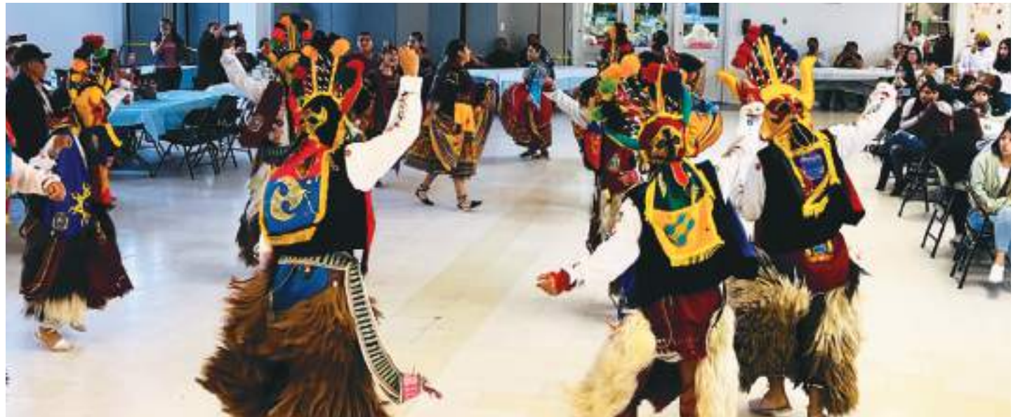
Danzas de nuestro Ecuador en la ciudad de Plainfield, para celebrar el Primer Grito de Independencia del 10 de agosto de 1809.