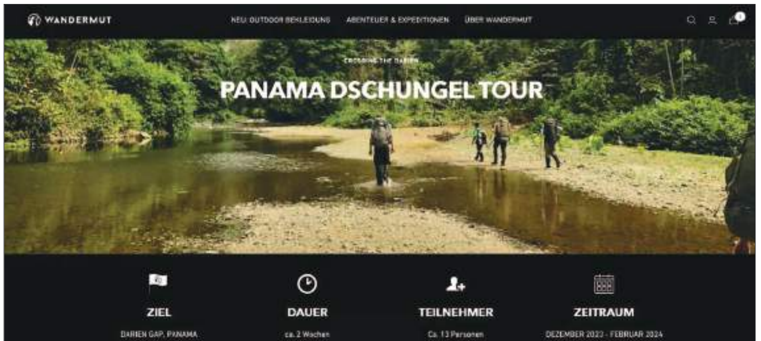
Página web de la empresa alemana que ofrece paquetes turísticos a quien quiera trasegar por la peligrosa ruta del Tapón del Darién.

“Nuestra organización es testigo del sufrimiento de los migrantes en su paso por la difícil selva del Darién. Se exponen a peligros geográficos, enfermedades y distintos tipos de violencia. Es un sufrimiento extremo en un