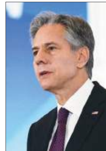
El secretario de Estado de Estados Unidos, Antony Blinken.

El Gobierno de Xi Jinping ya negó categóricamente en abril pasado estar detrás de la exportación de pre-