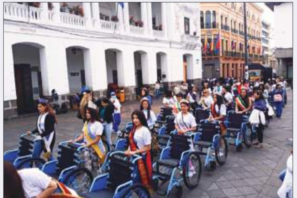
Las reinas de diferentes lugares se hicieron presentes para ayudar en la entrega de las sillas de ruedas. Una actividad importante que merece total reconocimiento.