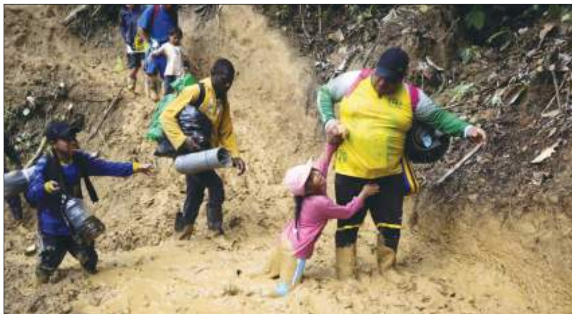
Es terrible para un padre cuando debe enfrentar no solo a la naturaleza sino a las solicitudes de sus hijos.

“Prepárate para la aventura de tu vida”, es uno de los eslóganes que se puede leer en la página ofi-