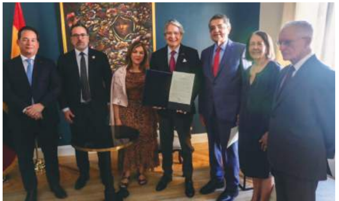
Sergio Ramírez junto al presidente de Ecuador, Guillermo Lasso y demás funcionarios ecuatorianos.

"Para mí es un honor entregarle la nacionalidad ecuatoriana, como un reconocimiento al luchador, al escritor genial, Premio Cervantes e inspiración para la libertad y la democracia. Este reconocimiento, también es una expresión de respeto y hermandad hacia los nicaragüenses, de manera especial, a los más de 90 ciudadanos a los que el régimen les arrebató su