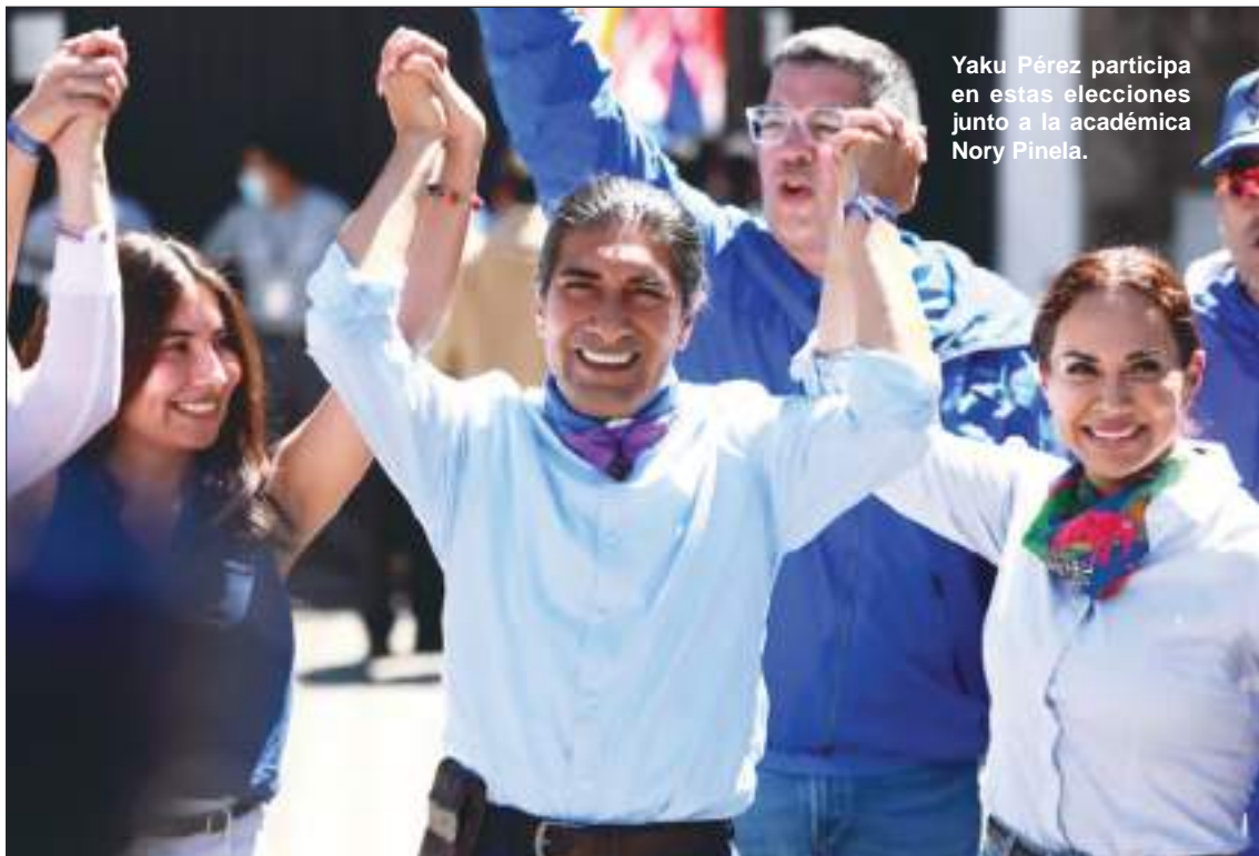
Yaku Pérez participa en estas elecciones junto a la académica Nory Pinela.

Esa es una prioridad, porque implica prevenir el colapso climático y el calentamiento global, una apuesta a futuro.