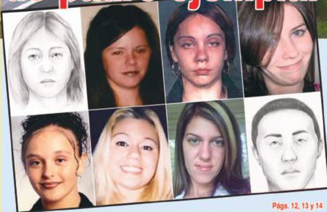
Págs. 12, 13 y 14