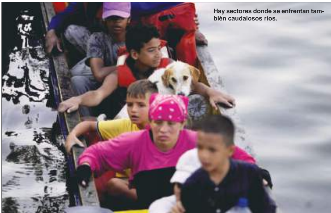
Hay sectores donde se enfrentan también caudalosos ríos.

Lo uno es una opción de ocio y lo otro es una necesidad.