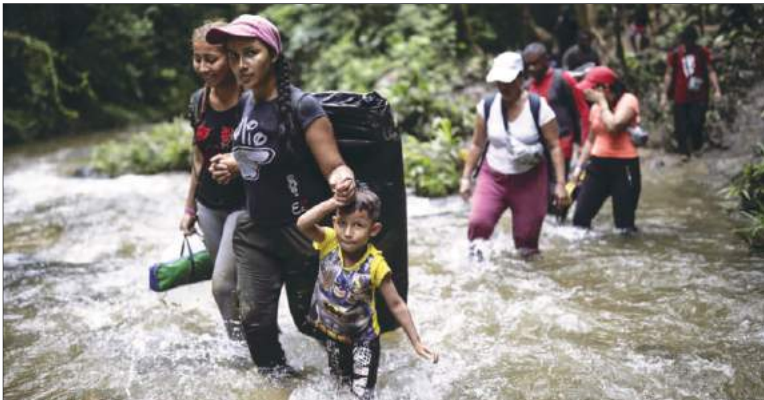
Una ruta tortuosa en donde muchos jóvenes y aún niños pequeños arriesgan sus vidas en busca del Sueño Americano.

Este año se espera que crucen por el Darién 400.000, lo que casi duplicaría los datos de 2022, que