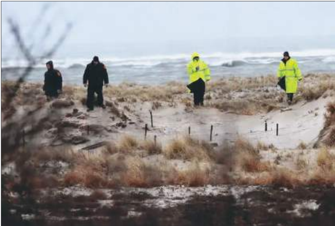
Durante muchos años las autoridades han seguido buscando más víctimas.