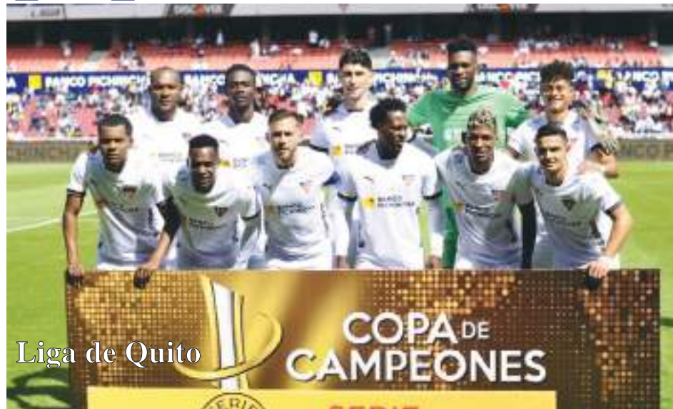
Liga de Quito

Su presentación ha levantado expectativas en todo el país. Calidad tiene, pero ya tiene una edad avanzada