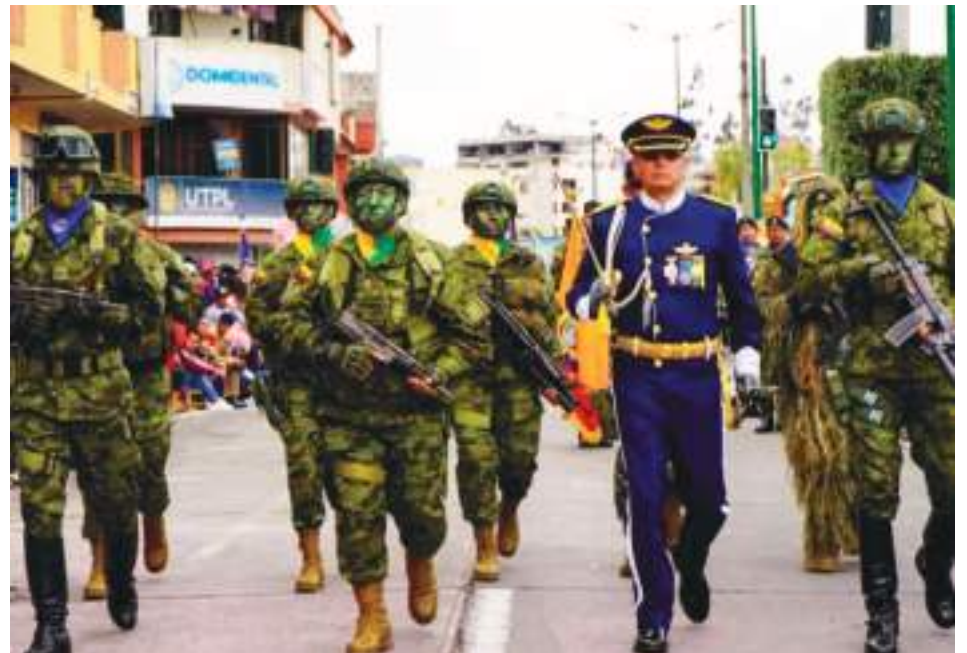
El Ejército ecuatoriano se hizo sentir con su gallardía, durante este hermoso desfile.