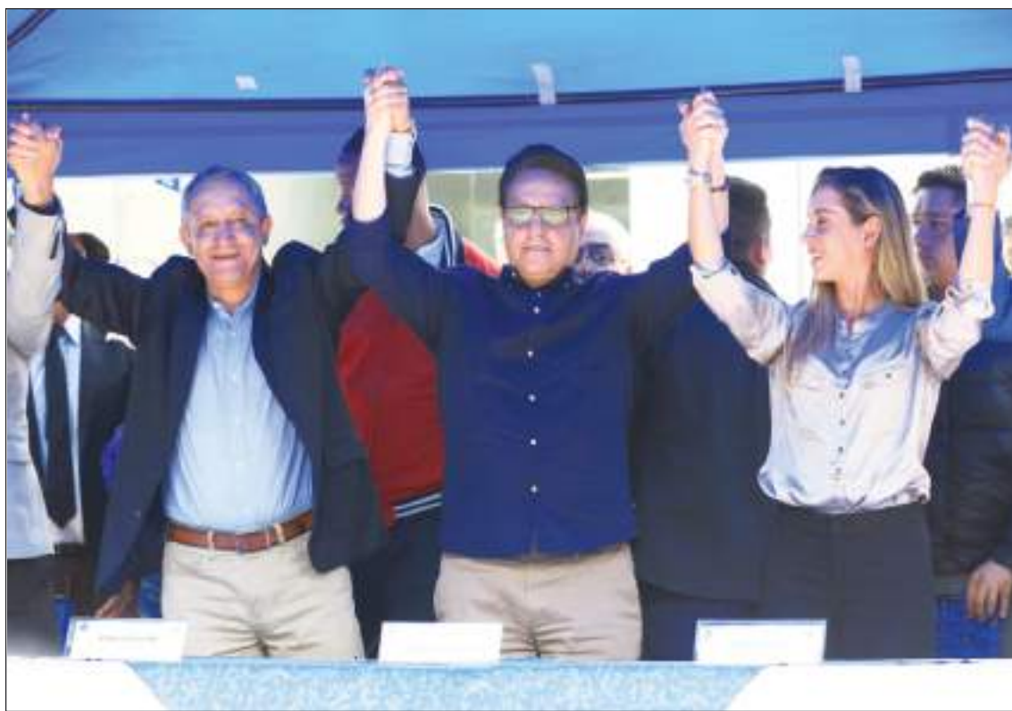
Fernando Villavicencio en uno de sus recorridos de campaña electoral para las elecciones anticipadas 2023.