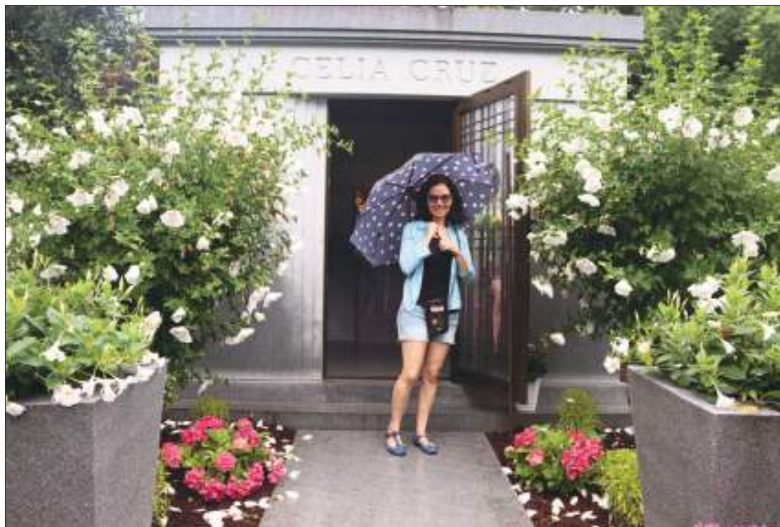
Muchos seguidores de Celia aprovecharon la ocasión para la foto del recuerdo.

se fue”, señala el fotógrafo, uno de los pocos que guarda una copia de la llave del panteón donde está la cubana y su esposo.