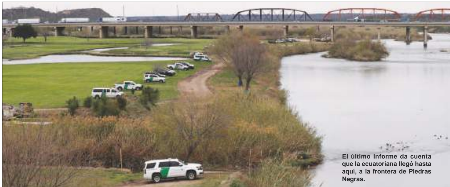
El último informe da cuenta que la ecuatoriana llegó hasta aquí, a la frontera de Piedras Negras.

Cualquier información que pueda ayudar a dar con el paradero de esta ecuatoriana se guardará absoluta reserva y pueden llamar o enviar mensajes por WhatsApp al +1 631 408 1994 o a las redes sociales de 1800migrante.com