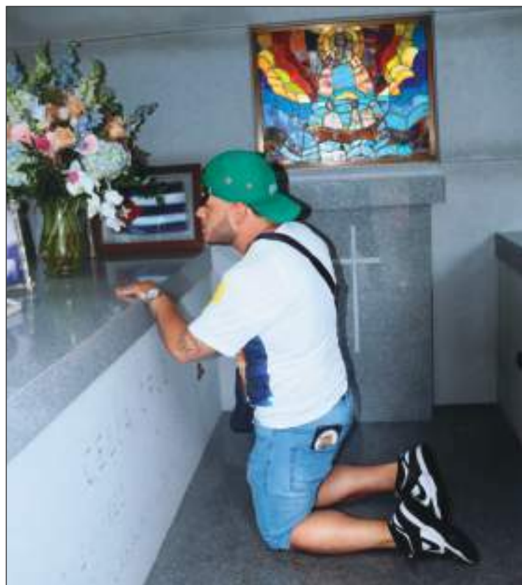
Otro seguidora de Celia Cruz eleva una oración por su descanso eterno.

“El destino ha querido que todavía no sea mi momento y por eso estoy hoy aquí en el homenaje que se le está brindando a Celia por el tiempo transcurrido desde que