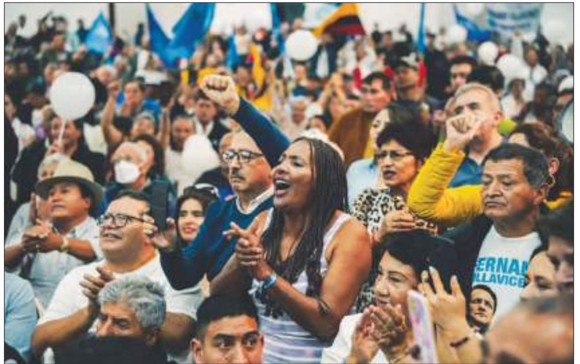
Seguidores de Fernando Villavicencio en una reciente correría del candidato.