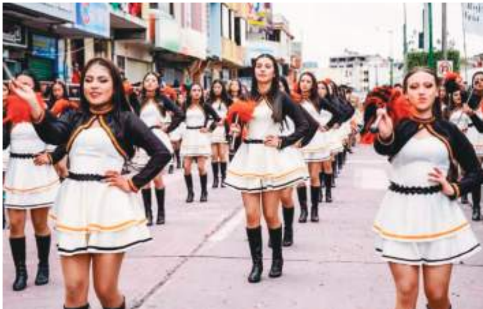
La unidad educativa José Ordoñez, gritó con entusiasmo "que viva Pelileo".