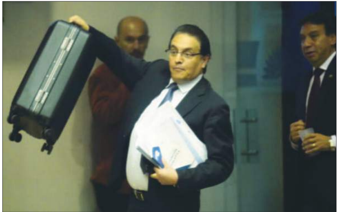
El entonces asambleísta Fernando Villavicencio abandona el Pleno, durante la sesión para decidir sobre el juicio político a Guillermo Lasso. “Hagan lo que les dé la gana. Yo me voy”, dijo.

Villavicencio dijo que comparte «la felicidad relativa del 90% de ecuatorianos» tras la disolución de la Asamblea, a la que calificó