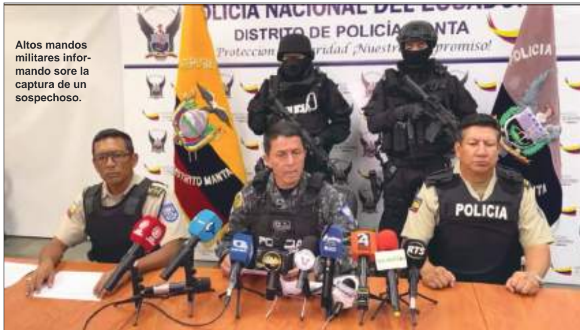
Altos mandos militares informando sobre la captura de un sospechoso.