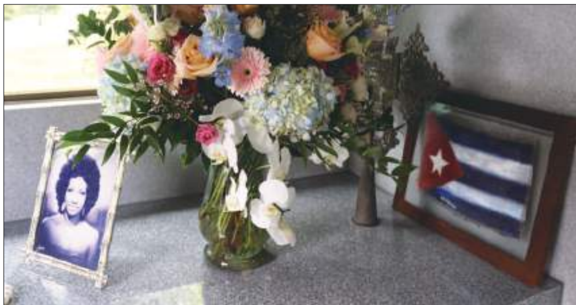
En el mausoleo siempre habrán flores frescas y de las que le agradaban a ella.