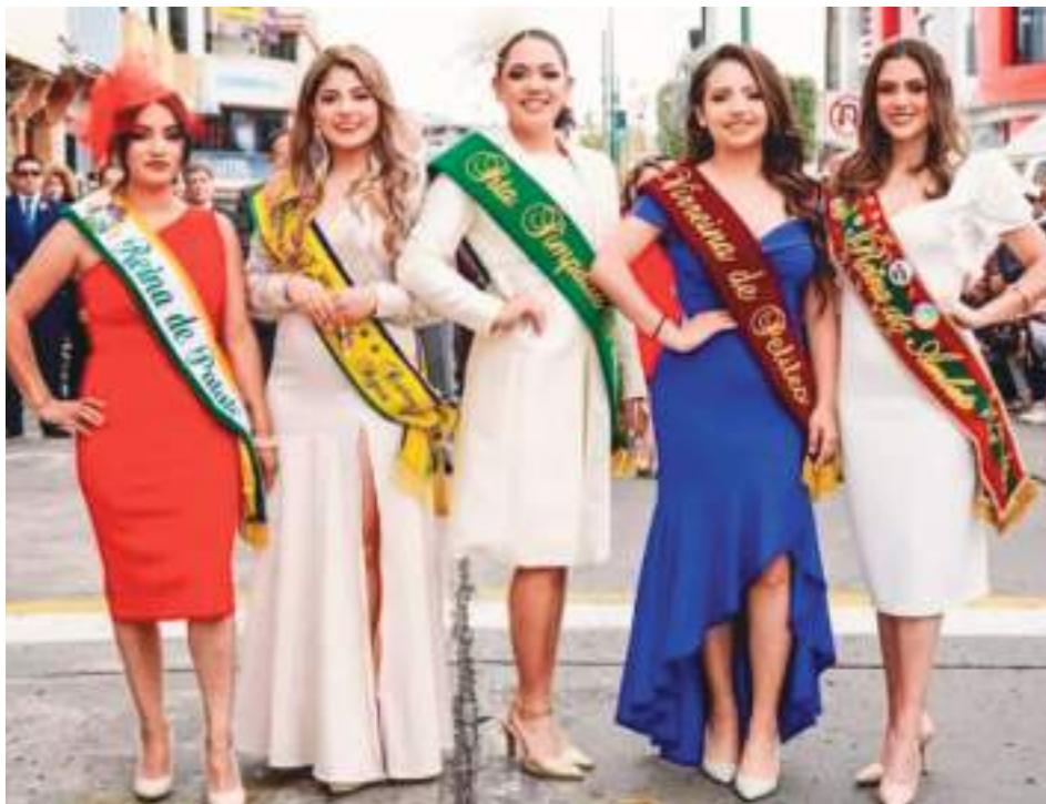
Las reinas de Patate, Baños, y Ambato fueron las invitadas especiales.