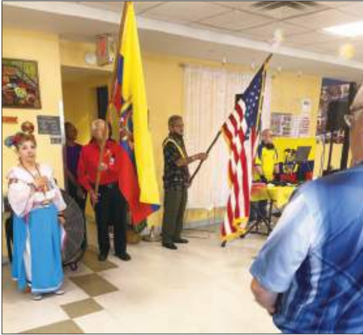
Momentos en los que entonaron los Himno de Estados Unidos y Ecuador.