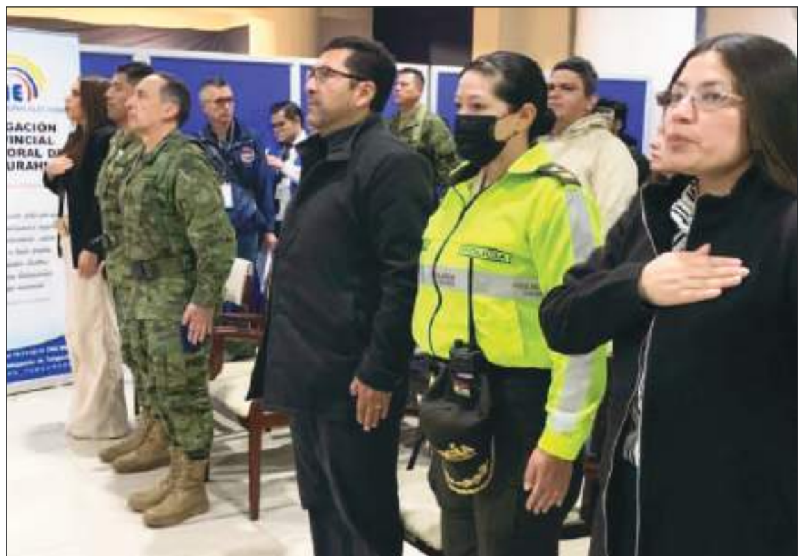
El proceso electoral comenzó sin contratiempos en las provincias de la Sierra centro. En el Consejo Provincial Electoral se realizó la inauguración del evento democrático.

votantes más jóvenes que se oponen al "correísmo" y están interesados en un nuevo liderazgo más allá de las opciones más establecidas en Ecuador.