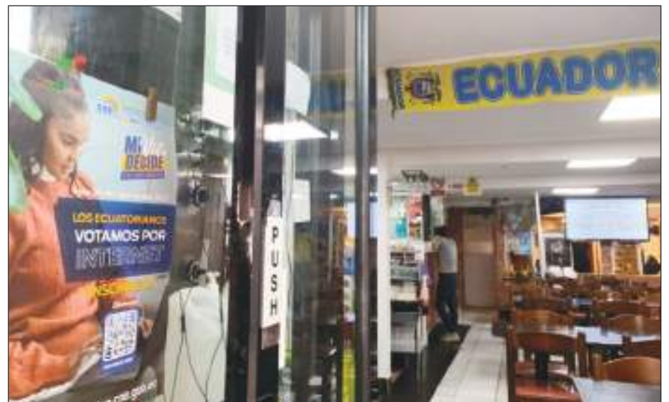
En un negocio de comida ecuatoriana se ve el afiche del CNE