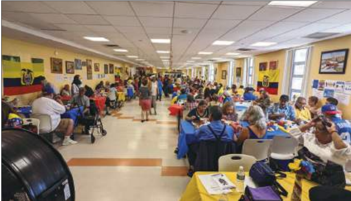
Los asistentes al evento disfrutaron mucho de este evento.

y cantar a los asistentes quienes pudieron degustar una exquisita comida.