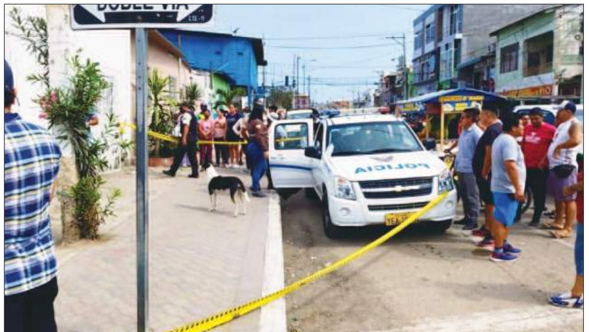
Las operaciones policiales son permanentes en muchos sitios ecuatorianos.

Al momento de escribir esta nota, no sucedía aún lo de Fernando Villavicencio.... Terrible.