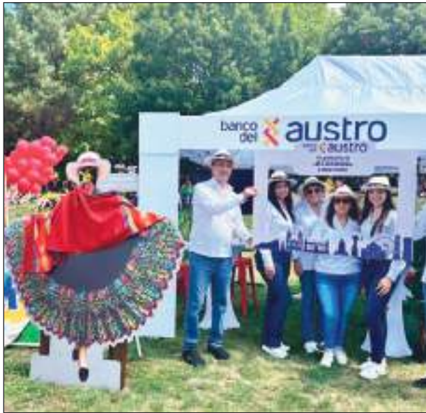
El Banco del Austro dijo presente en el Festival ecuatoriano.