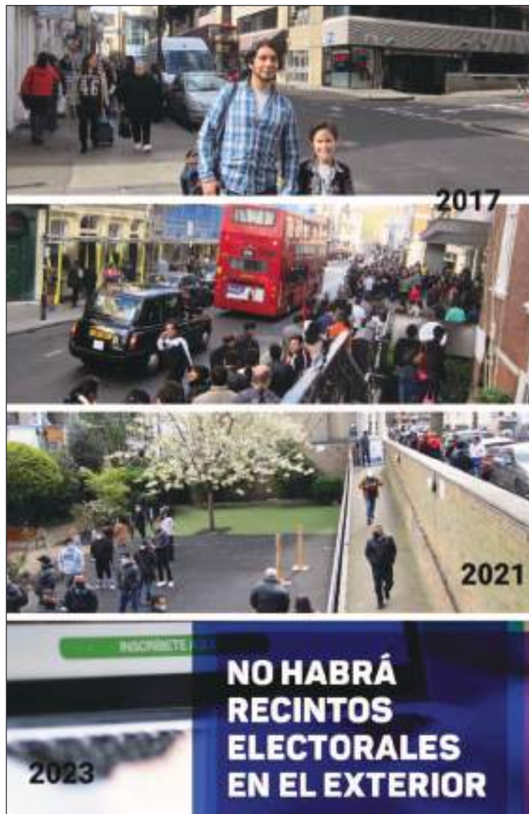
Un collage con el contraste de las elecciones de 2017, 2021 y 2023.

19. Fue el miedo al contagio el que alejó de las urnas al votante, mientras que en este 2023 fue la decisión precipitada del CNE de introducir el voto telemático en las 101 zonas electorales en el exterior la que ha impedido que los ecuatorianos ejerzan su derecho al voto.