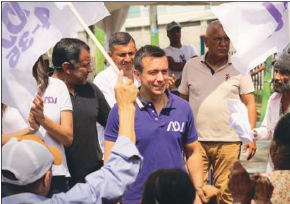
Daniel Noboa resultó la gran sorpresa. De números bajos a comienzos de la contienda, se ha trepado al segundo lugar y con muchas posibilidades de ser el próximo presidente de los ecuatorianos.

Además, Correa redujo los vínculos con Estados Unidos,