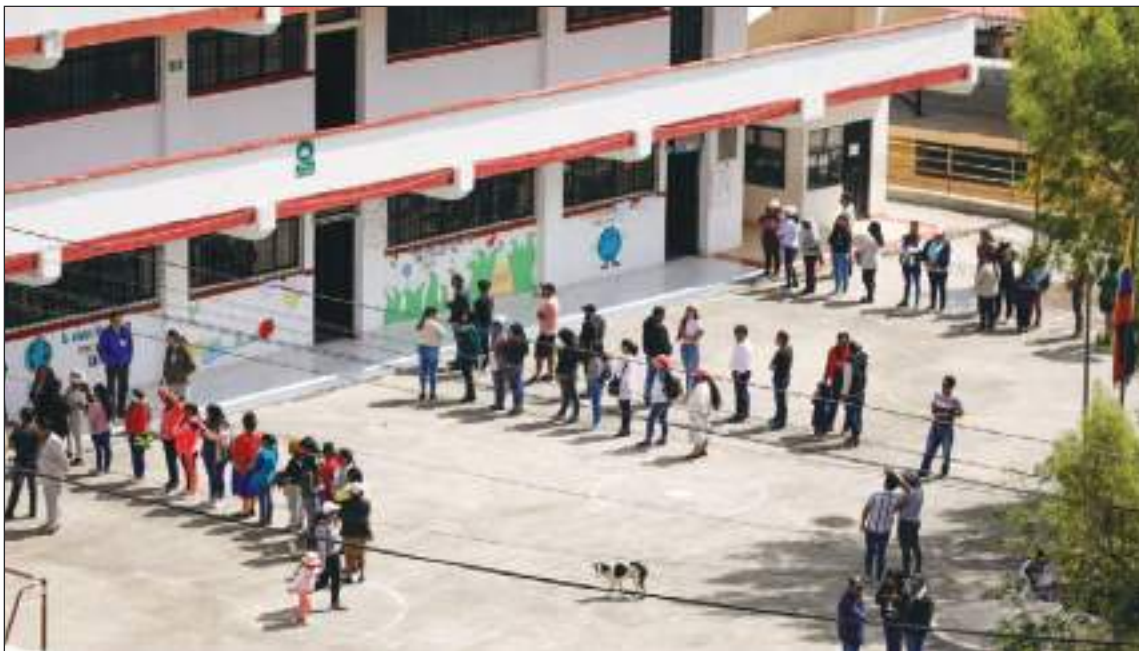
Las votaciones presenciales fueron exitosas en la mayoría de los lugares ecuatorianos. Sin embargo en el llamado "voto telemático" se produjo un fracaso rotundo. Las autoridades deben investigar y subsanar.

incluido el corte de la relación del país con la Agencia Antidrogas (DEA) y el derrocamiento de ciertos diplomáticos, esfuerzos que González también podría promover. Desde que dejó el cargo, Correa ha huido a Bélgica después de enfrentar una sentencia por corrupción; González ha dicho que lo contrataría como asesor principal. (También afirmó que no hizo nada malo...).