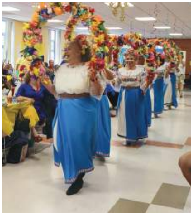
Un baile típico del Ecuador fue muy aplaudido.