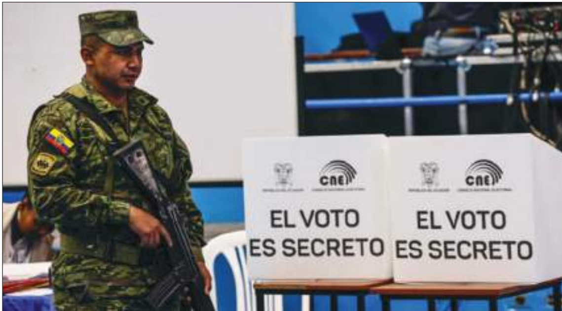
A raíz del asesinato de uno de los candidatos y el clima de violencia que se ha vivido en los últimos tiempos, las elecciones ecuatorianas fueron muy bien vigiladas. Por fortuna transcurrieron con normalidad.