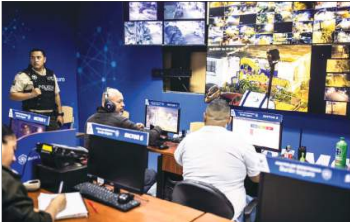
El monitoreo es permanente, pero quizá haga falta mayor recurso humano y técnico.

De los aproximadamente 300.000 contenedores que salen cada mes de Guayaquil, una de las mayores ciudades de Ecuador y uno de los puertos más activos de Sudamérica, las autoridades solo pueden inspeccionar el 20 por ciento, según el mayor Núñez.