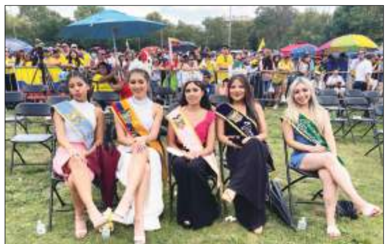
Las Reinas del Comité asistieron a presenciar el festival ecuatoriano en primera fila.