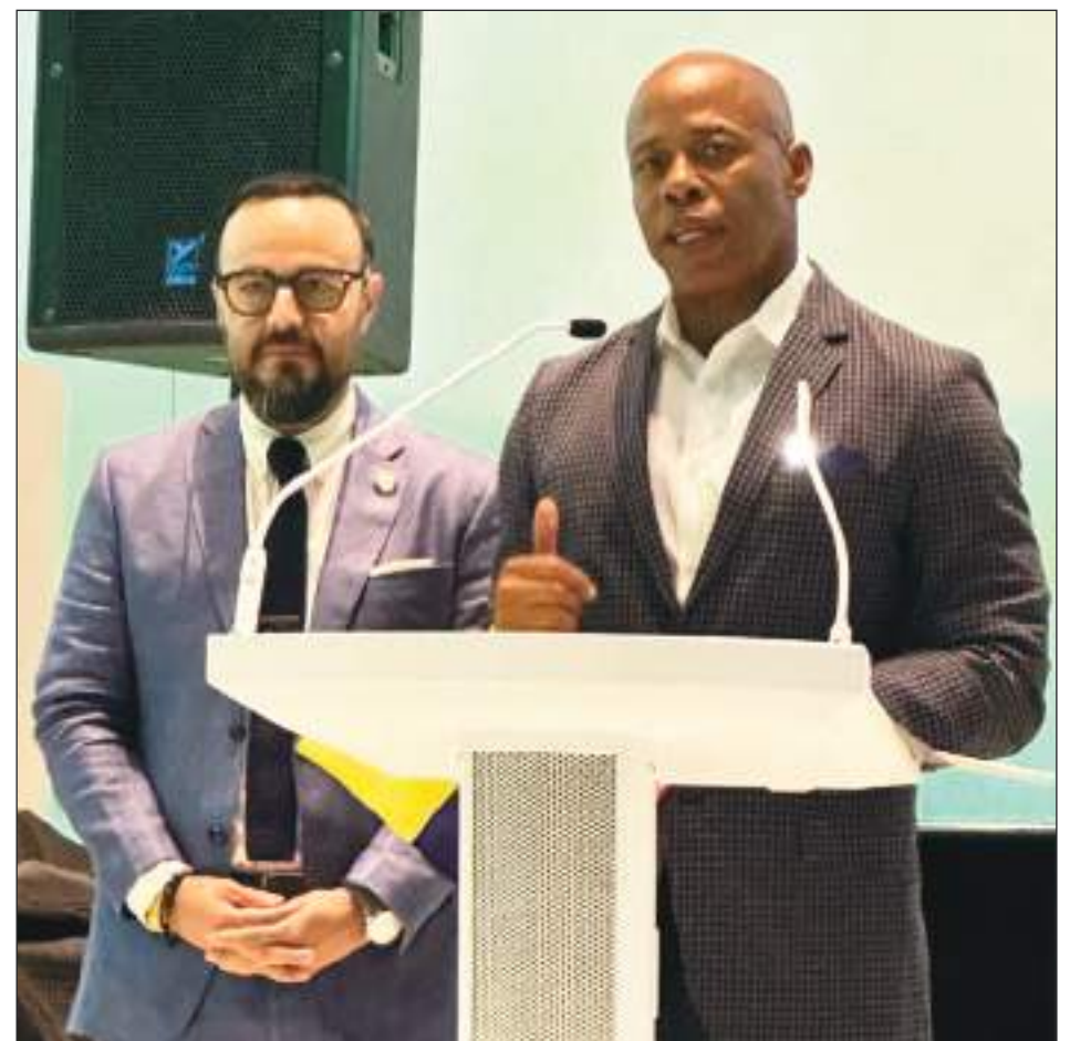
El Alcalde de New York Eric Adams, en su intervención, junto al Concejal Moya.