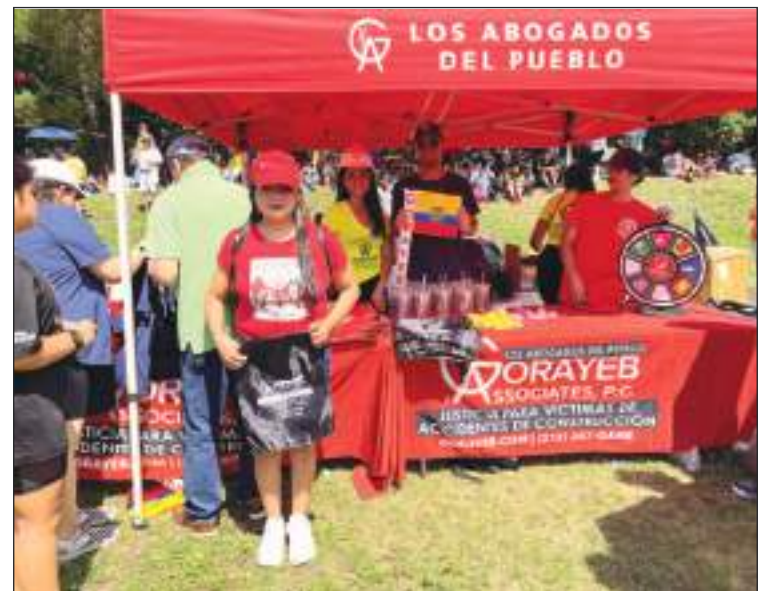
Gorayeb como siempre dijo presente entregando premios a los asistentes.