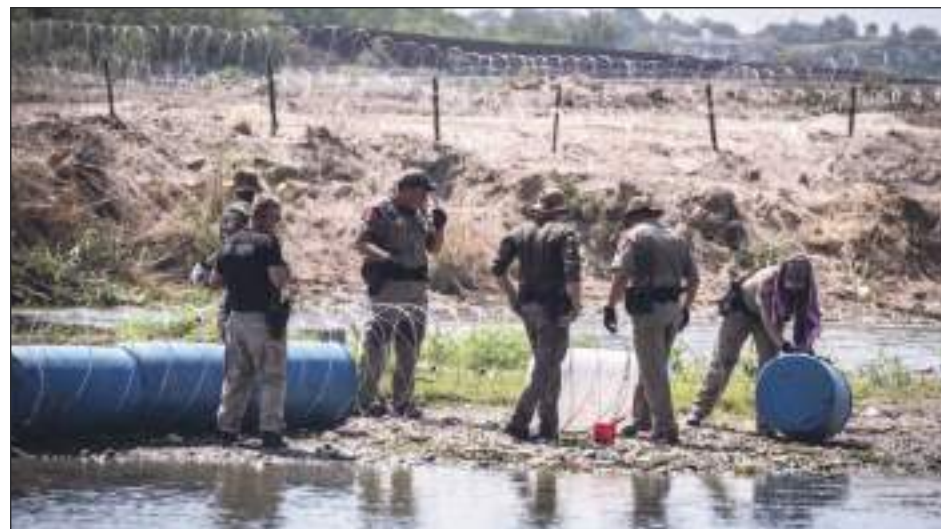
La Patrulla Fronteriza investiga el hecho, pero su labor ha sido muy cuestionada.