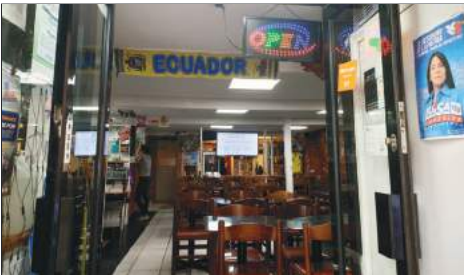
Al ingreso de un restaurante y al fondo en una popular peluquería en Elephant & Castle se ve el poster de la candidata de la RC.