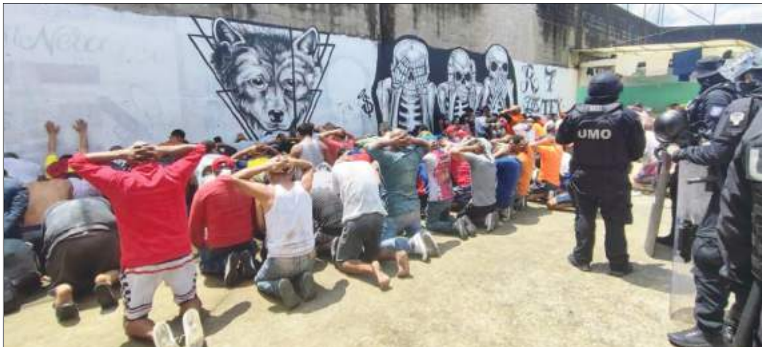
El problema de las cárceles en Ecuador es crónico. Aunque viene de años, ningún gobierno ha sido capaz de detenerlo.

La cocaína, o un precursor llamado pasta base de coca, entra en Ecuador desde Colombia y Perú, y suele salir por vía fluvial desde alguno de los ajetreados puertos del país.