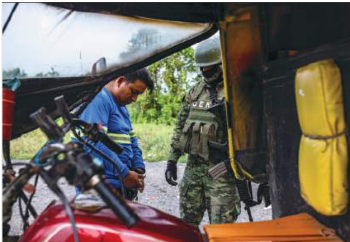
Hombres detenidos durante una redada policial en las afueras de Guayaquil.

No es que Ecuador sea nuevo en el negocio de la droga. Ubicado entre los mayores productores de cocaína del mundo, Colombia y