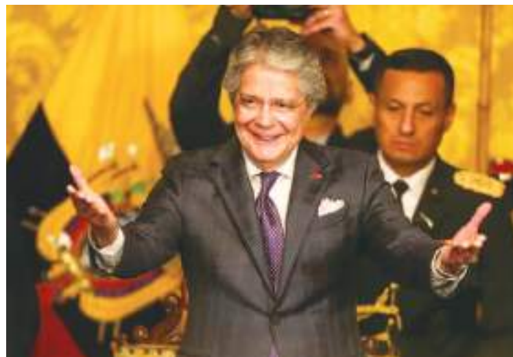
En su lucha contra la inseguridad, el gobierno de Lasso también anunció la semana pasada la compra de casi 11.000 fusiles, subfusiles y pistolas a empresas de Israel, Suiza y Austria.

El objetivo que busca el gobierno es que su Fuerza Aérea cuente no sólo con mejores equipos, también con mejor información para rastrear a las aeronaves de las organizaciones criminales. El narcotráfico ha convertido a Ecuador en el epicentro de sus envíos de cocaína a EEUU y Europa, al encontrarse