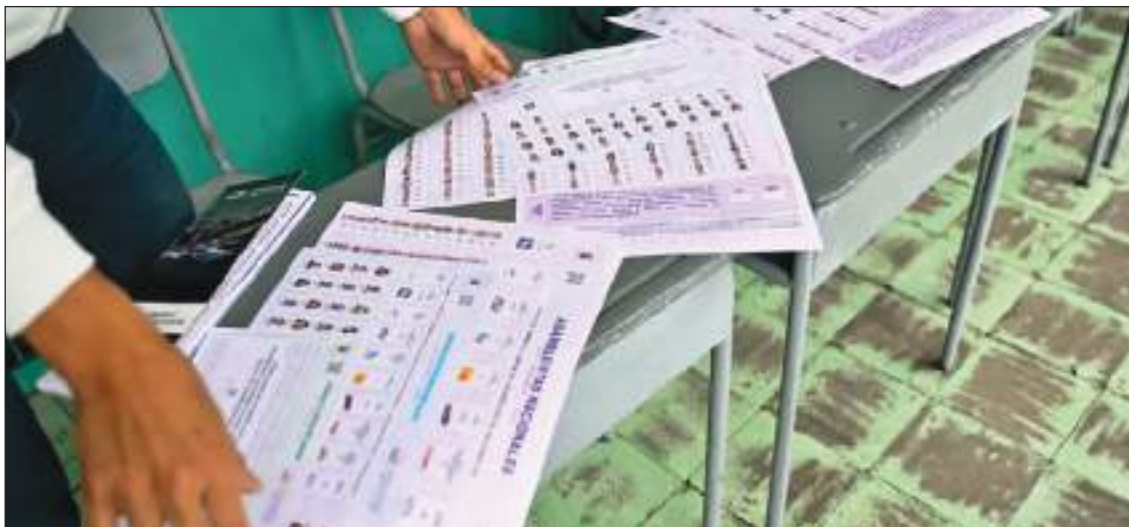
Papeletas de votación en un colegio electoral de Quito el día de las elecciones.