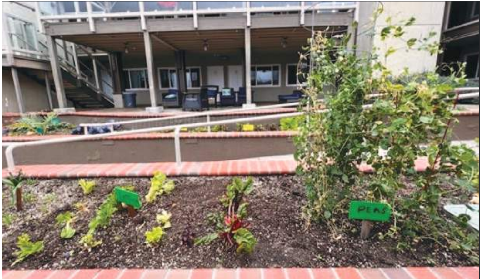
A lo largo de los senderos del centro residencial Glennwood House en Laguna Beach se siembran los vegetales.