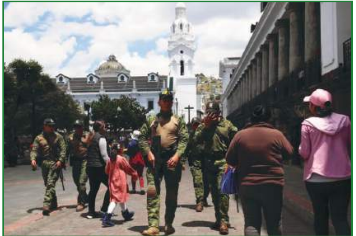
Miembros de las fuerzas de seguridad caminan en la plaza principal del centro de Quito antes de las elecciones.