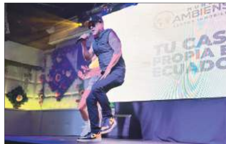
El rapero Gerardo Mejía puso a bailar a todos.