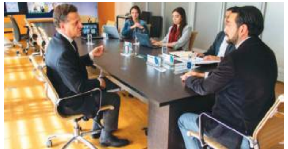
Delegados alemanes y ecuatorianos durante la trascendental reunión.

Por otra parte, según cifras del ministerio,