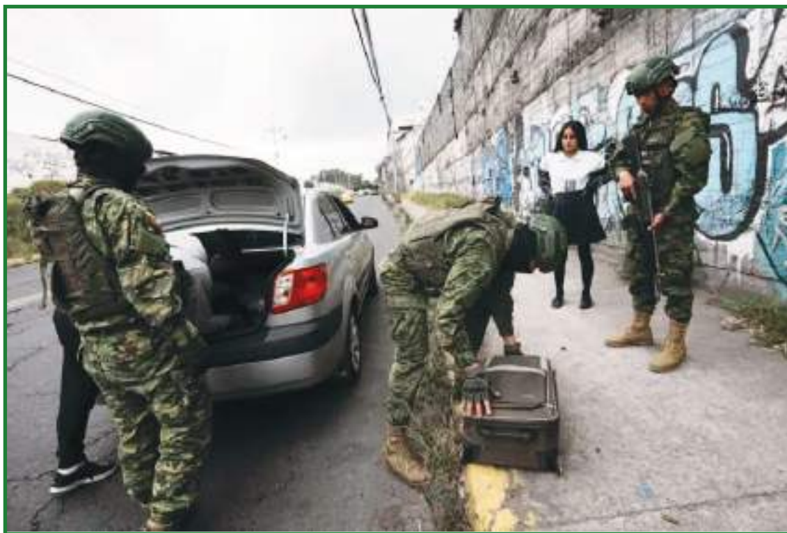
Soldados inspeccionan un automóvil en un puesto de control de seguridad colocado por el Ejército en Quito.

El boom coincide con el brote de violencia que asedia a la capital en la antesala de las elecciones de este domingo, y que el 9 de agosto dejó su primer magnicidio. Un sicario colombiano mató a tiros al candidato presidencial Fernando Villavicencio cuando se acababa