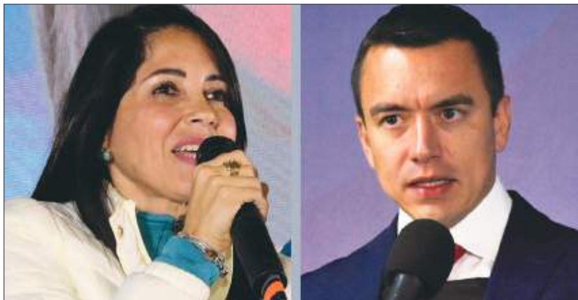
Los candidatos Luisa González, de Revolución Ciudadana, y Daniel Noboa, de Acción Democrática Nacional.

La decisión del CNE se dio un día después de que el movimiento Revolución Ciudadana, que lidera el ex presidente Rafael Correa, pidiera una investigación y la repetición de las votaciones en las circunscripciones electorales del exterior, ante los problemas registrados en el sistema de votación telemática.