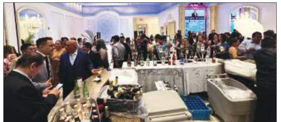
Todos los asistentes pudieron convivir en camaradería.