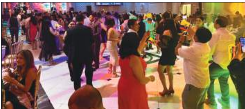
La gente que asistió pudo disfrutar de la buena música que los puso a bailar a todos.