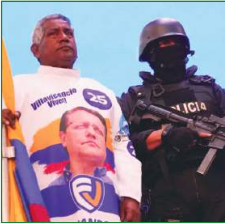
Un simpatizante del partido "Movimiento Construye" con una camiseta con la imagen del asesinado candidato Fernando Villavicencio, junto a un oficial de policía con equipo táctico durante una misa en Quito.

así como periodistas que cubren la campaña electoral. El aspirante Daniel Noboa asistió el domingo al único debate oficial usando este tipo de traje blindado.