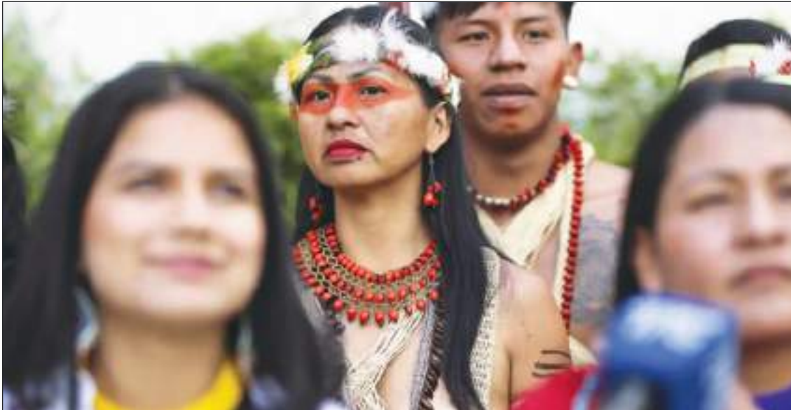
Ecuatorianos votando en el exterior. El evento electoral deberá repetirse.

Según France24 , la población Kawymeno , con 400 habitantes, así como algunas comunidades de la nacionalidad kichwa , ubicadas en esta región defendían la actividad: "Si no hubiese la