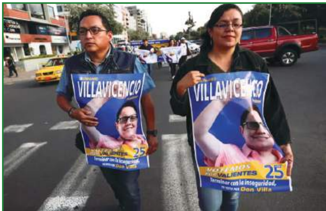
Partidarios con carteles del asesinado candidato presidencial Fernando Villavicencio marchan el día del mitin de clausura de la campaña de su reemplazante, Christian Zurita, en Quito.

pidiendo cotizaciones, cuenta Sánchez. El ritmo frenético de fabricación lo ha llevado a ampliar las instalaciones de su empresa por falta de espacio.