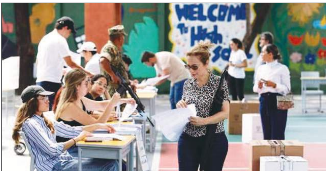
Ecuatorianos votando en el exterior. El evento electoral deberá repetirse.

promovía la candidatura del candidato asesinado Fernando Villavicencio, se ha pronunciado en contra de esta decisión por considerar que “una negligencia” del CNE no es una causal para repetir una elección en otro