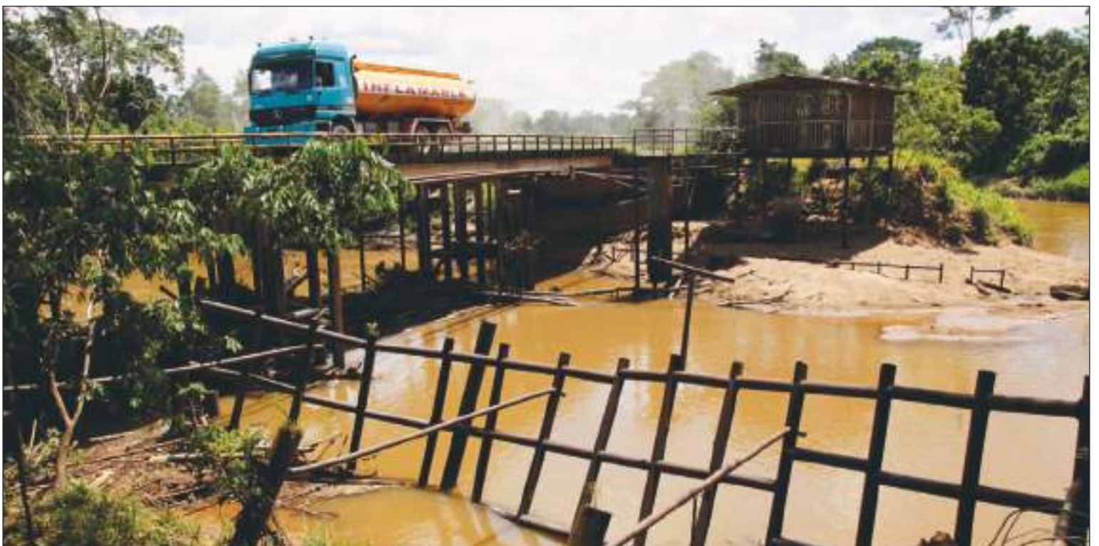
Parque Nacional Yanusí: entre la explotación y la conservación

Como consecuencia, Ecuador ha decidido a favor de la acción por el clima, de los derechos de los indígenas y de la protección medioambiental. Y todo gracias a una papeleta.