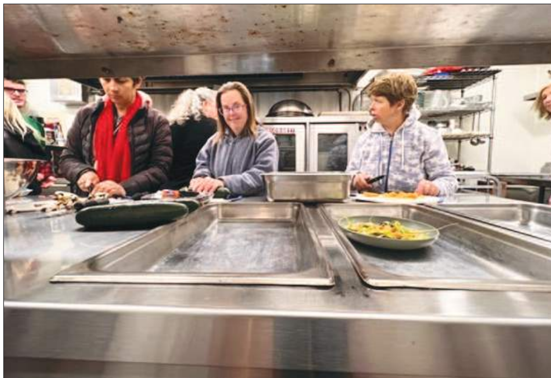
Los residentes de Glennwood preparan una ensalada para el almuerzo usando los vegetales del huerto.