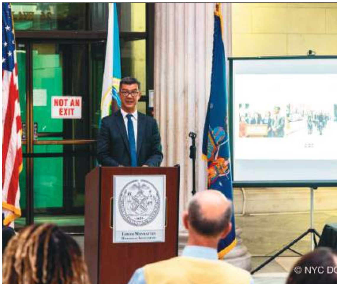
Momentos en los cuales el Comisionado Ydanis Rodríguez, agradece tan apreciada distinción.

un inmigrante caribeño que se convirtió en uno de los Padres Fundadores de los Estados Unidos, estos premios celebran el espíritu perdurable de la inmigración y su papel esencial en el éxito de la nación.