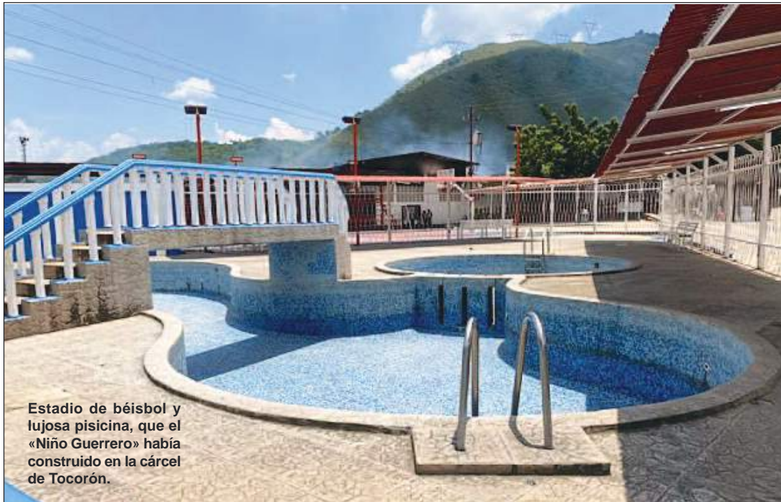
Estadio de béisbol y lujosa piscina, que el «Niño Guerrero» había construido en la cárcel de Tocarón.