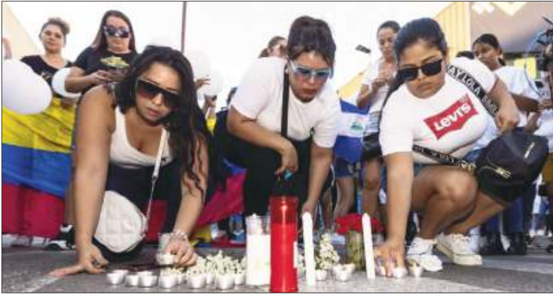
Las comunidades ecuatoriana y colombiana rindieron tributo a las víctimas cerca del lugar del siniestro.