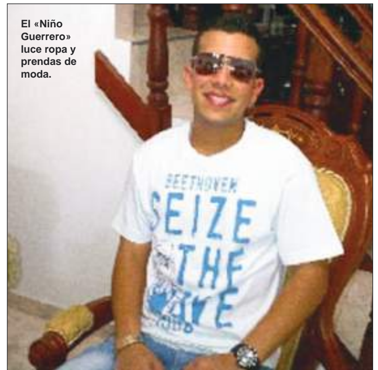
El «Niño Guerrero» luce ropa y prendas de moda.

En Ecuador se dedican a lo mismo. Esta semana varios negocios han sido baleados por motorizados. O no pagaron las extorsiones, o se les está diciendo que ellos pueden protegerlos, previo pago de altas sumas, que en buen porcentaje llega a manos del «Niño Guerrero».