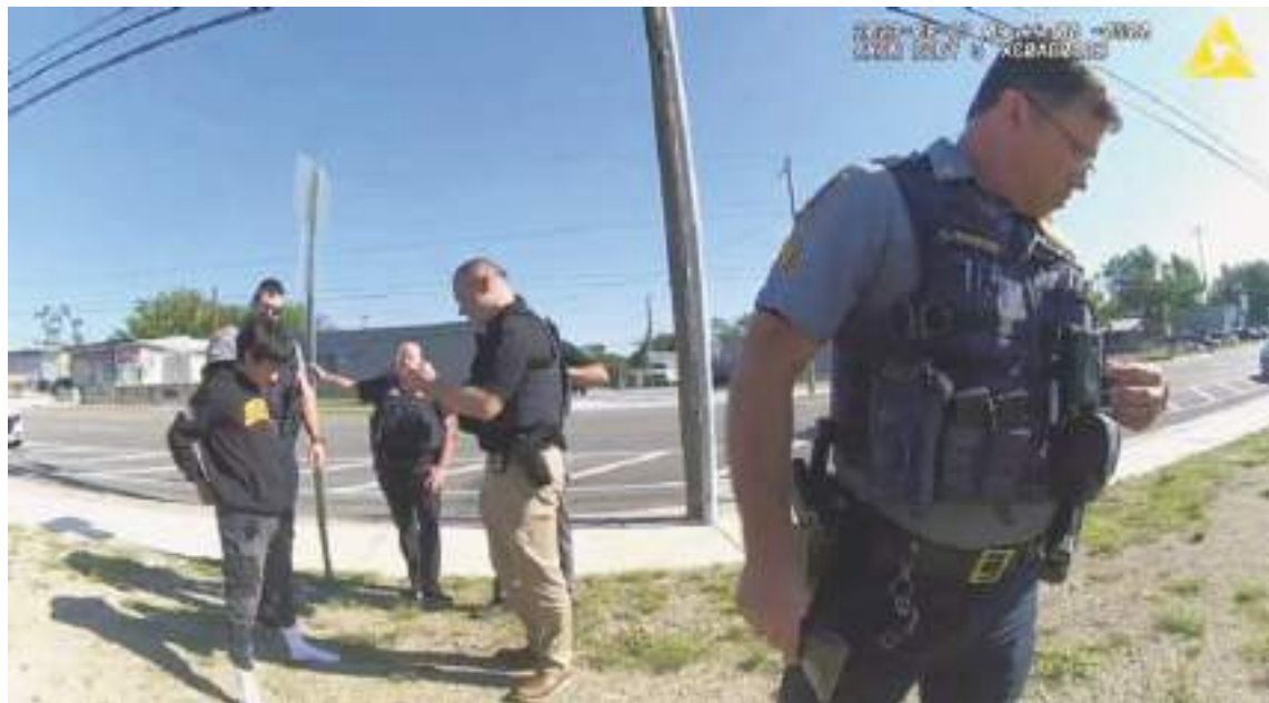
“Cara de Bebé” cuando fue de nuevo capturado. No presentó resistencia y menos arrepentimiento de lo que hizo.

“Había varias personas en la línea de fuego durante el tiroteo”, dijo Medders al Tribunal de Distrito de Tulsa. “Los servicios de emergencia transportaron a la niña al hospital por la gravedad de su estado y una diferencia de uno o dos centímetros en las heridas de bala penetrantes de la niña podría haber provocado su muerte”.