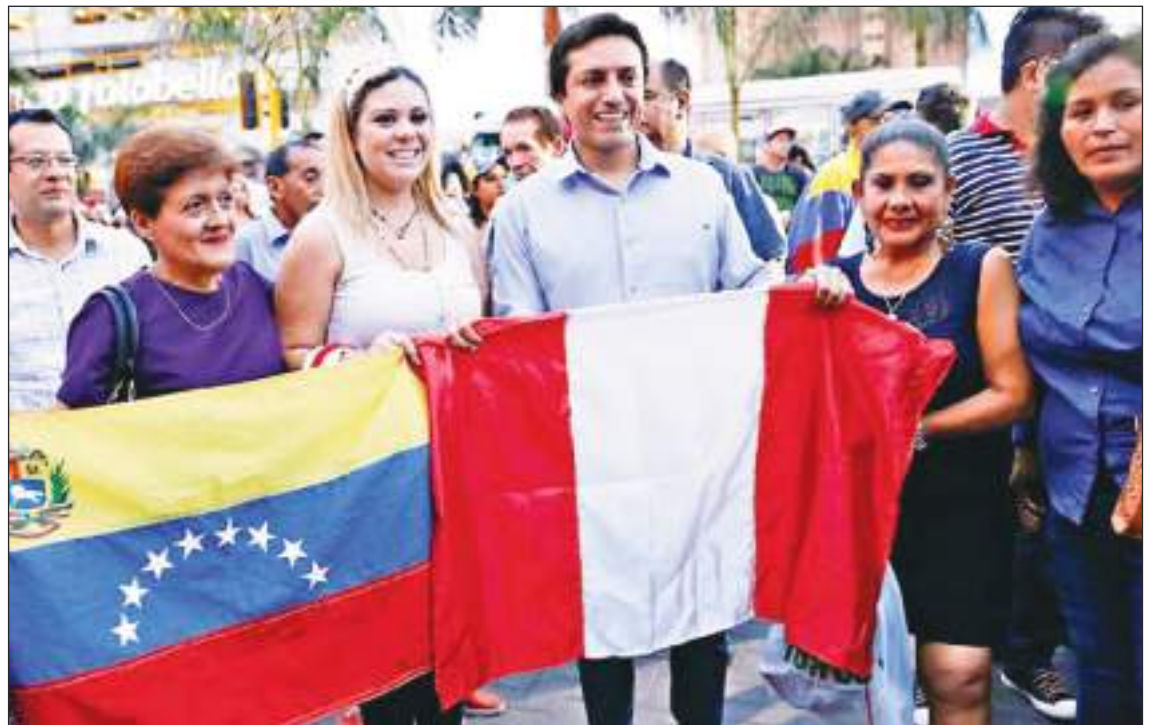
Los venezolanos han sido bien recibidos por muchos peruanos. Hay lazos afectivos entre todos.