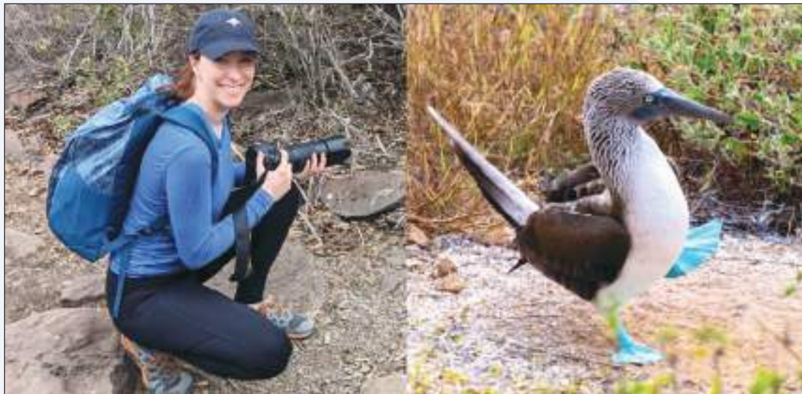
La autora del artículo durante su labor en Galápagos. A la derecha un piquero de patas azules.

Los visitantes de la isla Isabela pueden caminar hasta el borde del volcán Sierra Negra, que mide 6 millas de diámetro, lo que lo con-