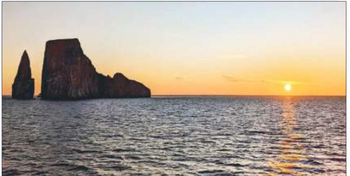
Kicker Rock es hermoso al atardecer... Un paraíso.