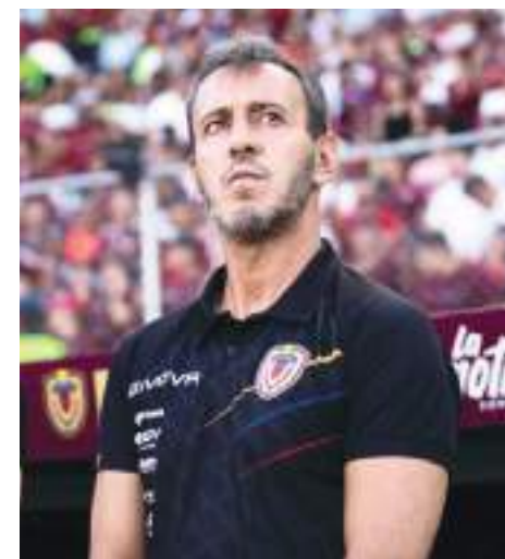
Fernando Batista, técnico de Venezuela.

cionador de Ecuador, el español Félix Sánchez, el defensa Pervis Estupiñán, porque continúa lesionado con su club, el Brighton inglés. También fue descartado de la convocatoria el defensa Jhoanner Chávez, que había sido llamado en el lugar de Estupiñán, pero se lesionó el sábado pasado con su equipo, el Independiente del Valle en el enfrentamiento por la Liga ecuatoriana contra el Aucas.