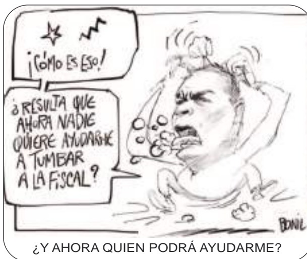
¿Y AHORA QUIEN PODRÁ AYUDARME?