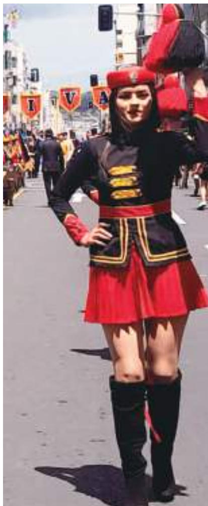
Unidad Educativa Bolívar