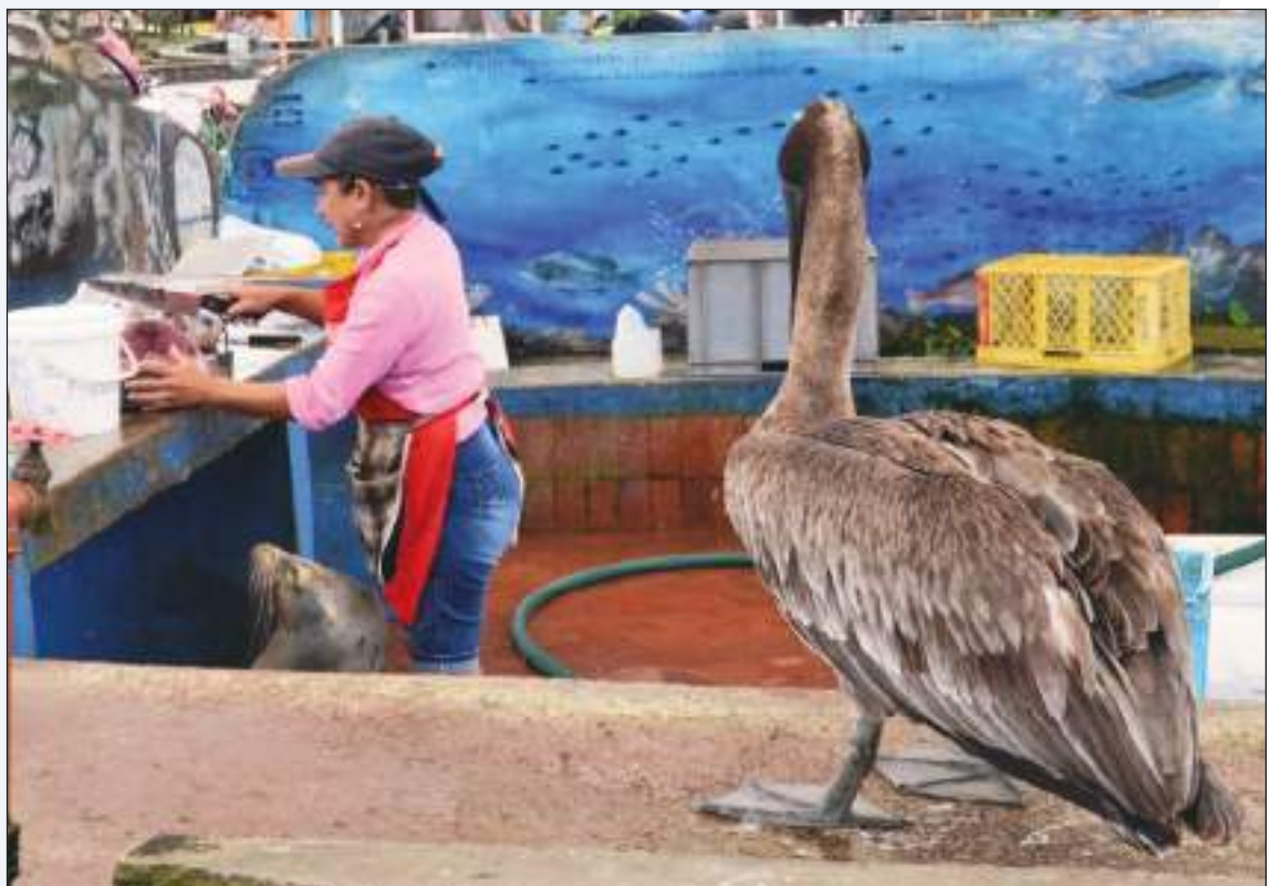
La fauna local suele esperar las sobras en el mercado de pescado.