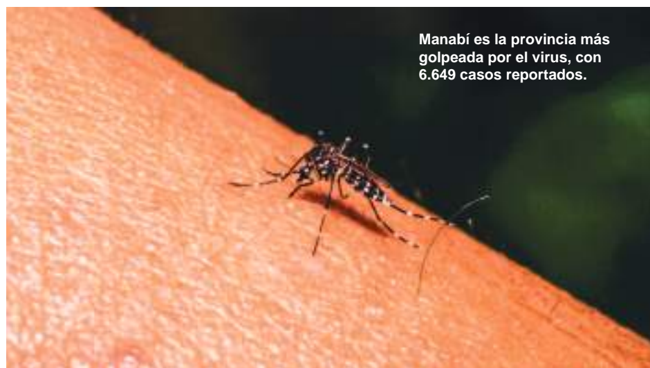
Manabí es la provincia más golpeada por el virus, con 6.649 casos reportados.

En 2015, Ecuador registró más 42.000 casos de esa enfermedad tropical transmitida por mosquitos.