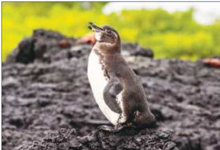
Los únicos pingüinos del hemisferio norte se encuentran aquí.