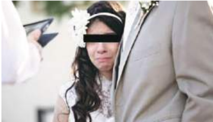
Servicios combinados de Ecuador News

La investigación enfatizó en que las niñas se ven obligadas a unirse a temprana edad como un escape a la situación de vulnerabilidad, violencia y pobreza que viven.