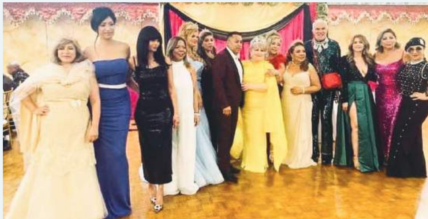
Candidatas, coordinadora y Jurados Calificadores