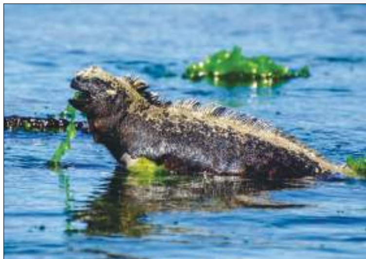
Las Islas Galápagos albergan las únicas iguanas nadadoras.

Recomiendo pasar por el mercado de pescado de Santa Cruz por la mañana para observar a los leones marinos y pelícanos hacer fila pacientemente alrededor del mostrador de pescado para recoger las sobras. En mi opinión, esta es una de las mejores maneras de echar un vistazo a la vida local y presenciar cómo los habitantes humanos de las islas coexisten con la vida silvestre.