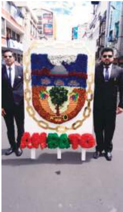
Escudo de Ambato

Con la izada de las banderas en los edificios de la Gobernación de Tungurahua, Gobierno Provincial y Municipio de Ambato, comenzaron los actos conmemorativos por los 203 años de la gesta del 12 de Noviembre de 1820. Ambato es la capital de la Prov. De Tungurahua y está considerada como una de las principales ciudades del Ecuador.