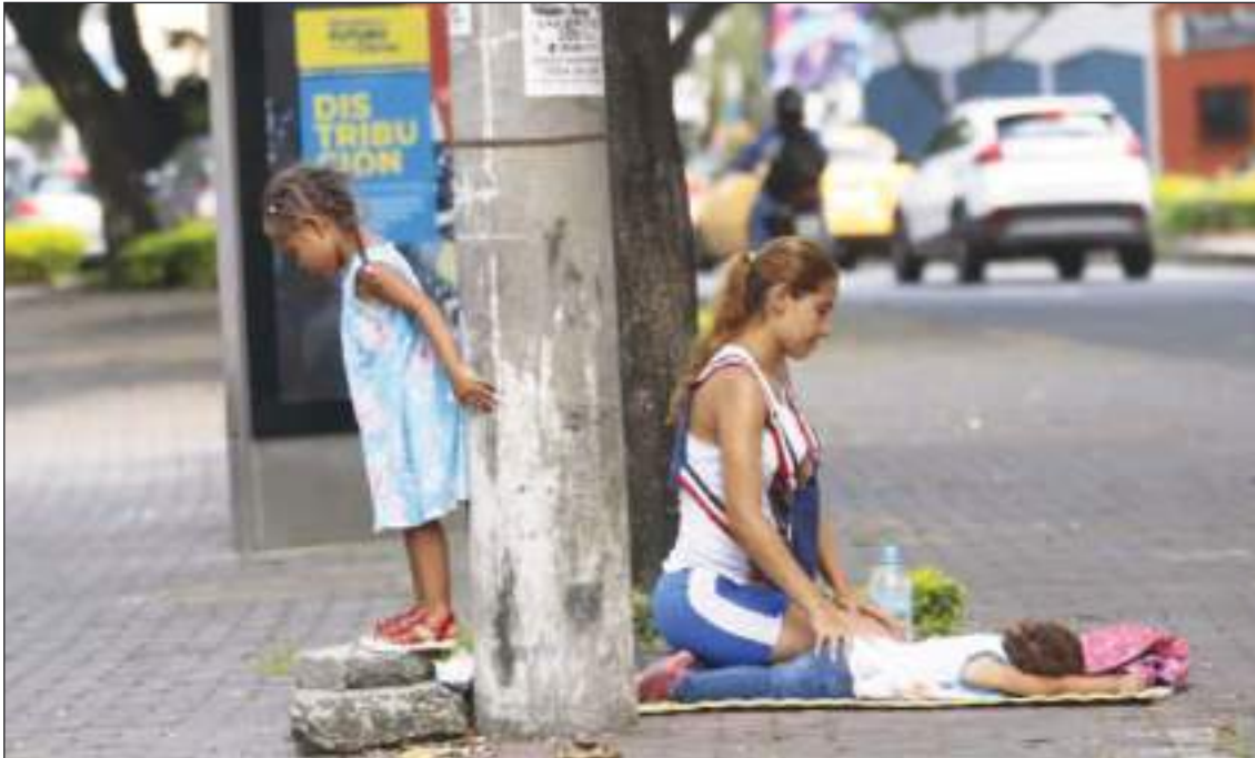
La escena es común en Ecuador, Perú o Colombia, familias de venezolanos acudiendo a la caridad.

de homologar la ley para el mejor control de la movilidad humana.