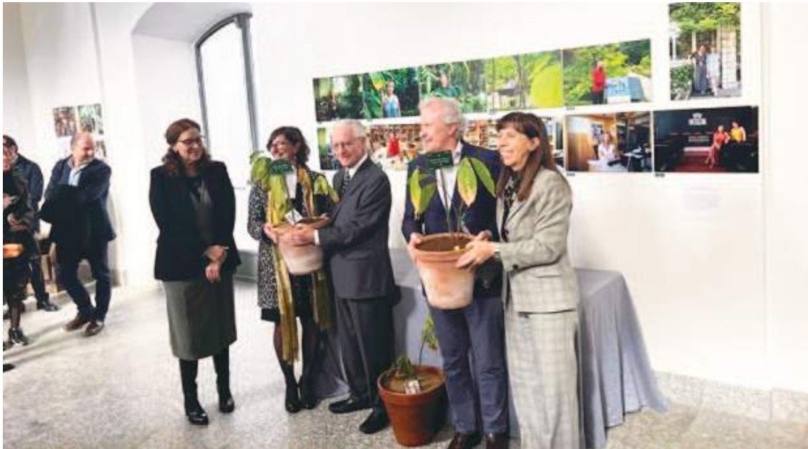
El momento exacto de la entrega del preciado alimento a España procedente de Ecuador.

sido preparado durante más de seis meses y durante otro mes más han estado en proceso de adaptación desde que las plantas llegaron a España para su cuidado. Pese a las dificultades, Martín confía en que prosperen.