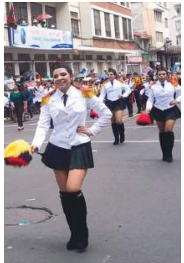
Las bastoneras dieron colorido a este desfile