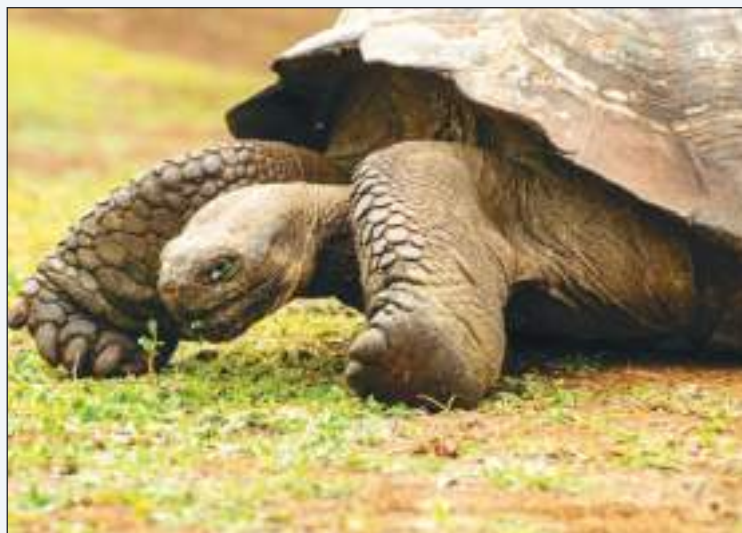
La tortuga gigante puede pesar más de 500 libras.