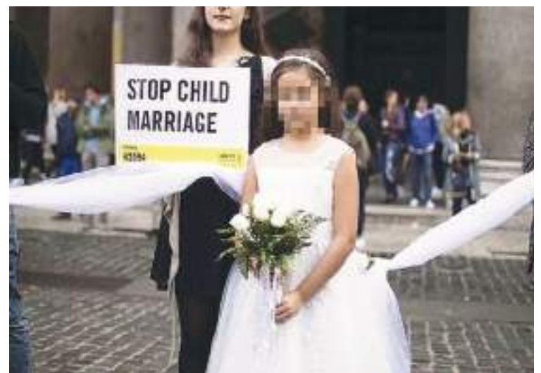
En muchos lugares hay protestas por una costumbre de muchos países de obligar a las niñas a casarse a una edad temprana.

“El siguiente paso es que las instituciones del Estado, los gobiernos locales, las comunidades y familias nos comprometamos a actuar para lograr que las uniones infantiles tempranas y forzadas no sigan ocurriendo”, acotó Quiñónez.