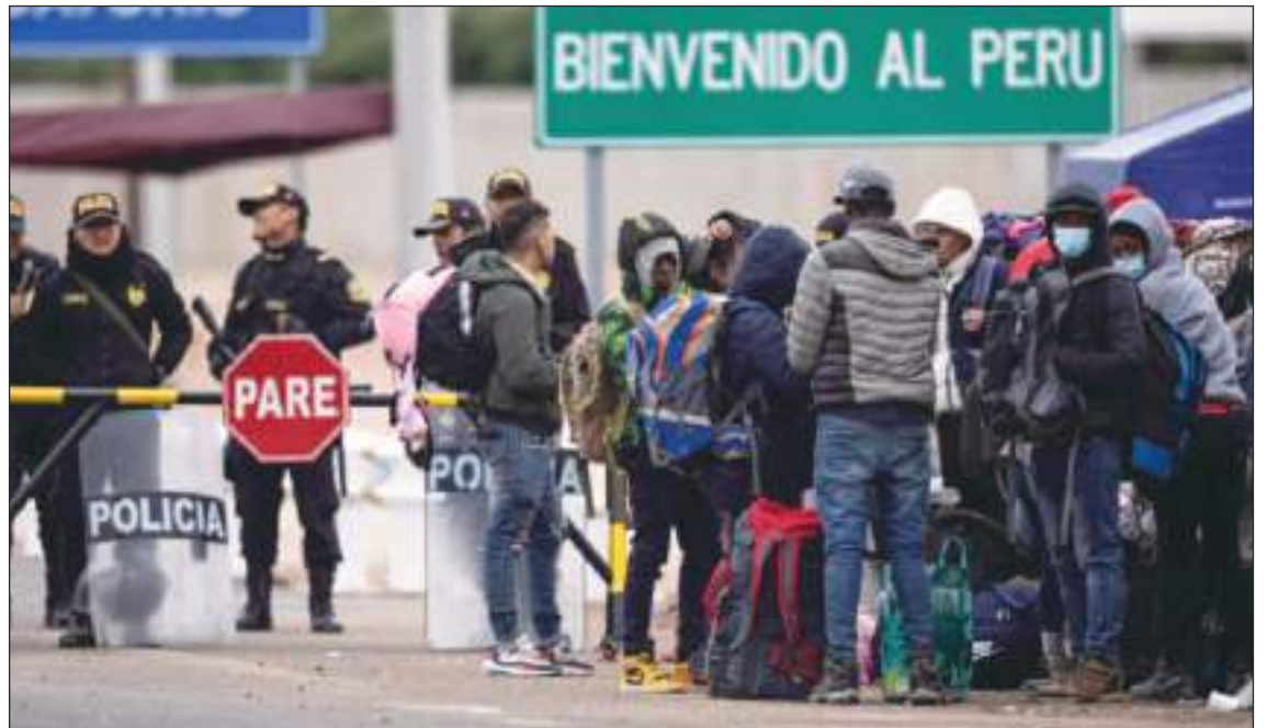
Desde la semana anterior, los venezolanos sin gestionar su permanencia temporal deben salir de Perú.

Estas amenazas han provocado que él, junto a su esposa, se planteen la posibilidad de volver a su patria en vuelos gratuitos que se han ofrecido. "En el camal de Yerbateros, que está acá a unas cuadras, han dado un comunicado que restringía el acceso de venezolanos por 7 días. En todos estos días, varios hombres y mujeres se han quedado sin trabajo por eso", agregó... Y muchos piensan en Ecuador como destino.