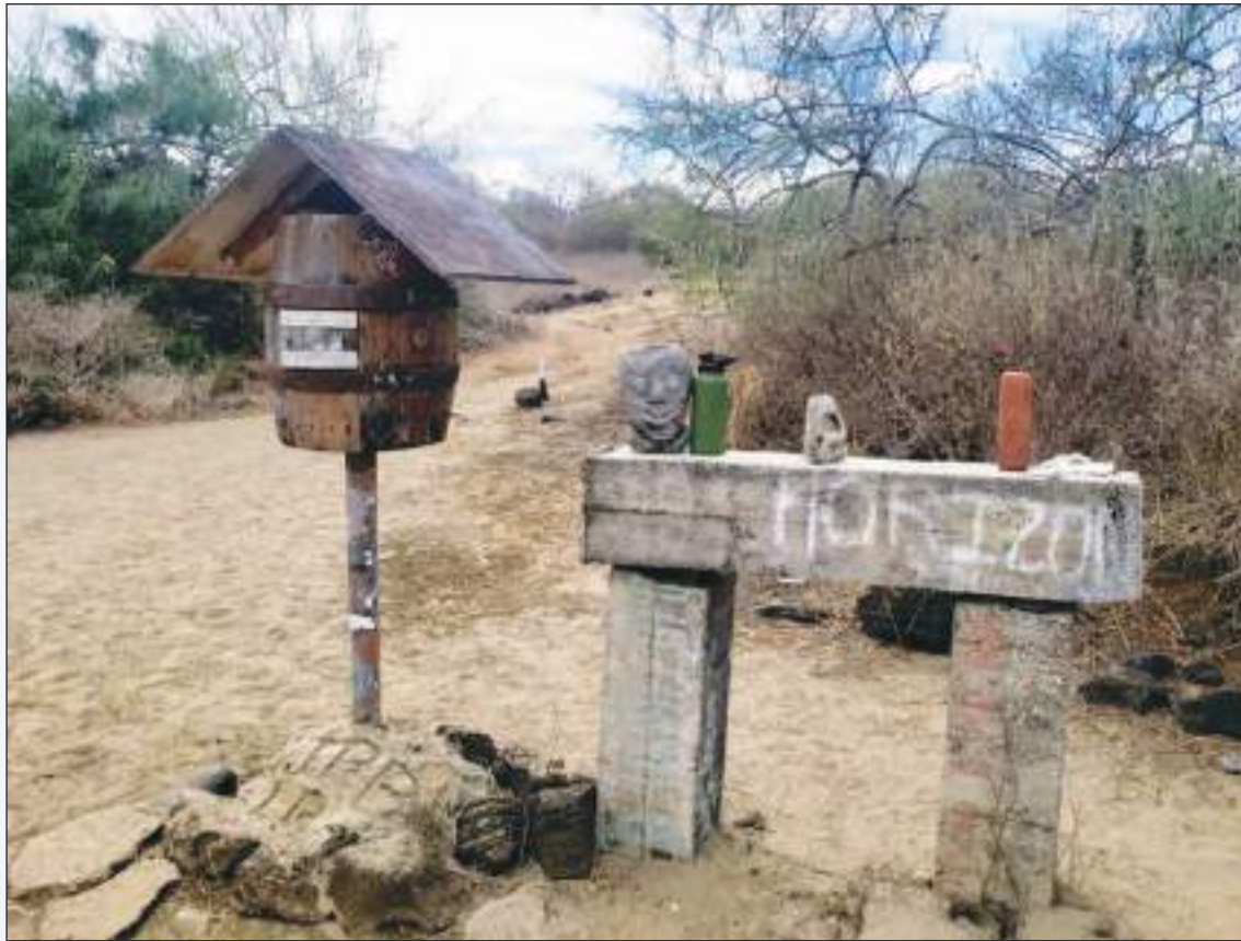
En todos los lugares el ambiente es ensañador, en realidad es un mundo diferente.

Si Post Office Bay está incluido en su itinerario, traiga una postal: