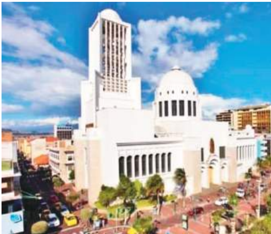
La Catedral de Ambato