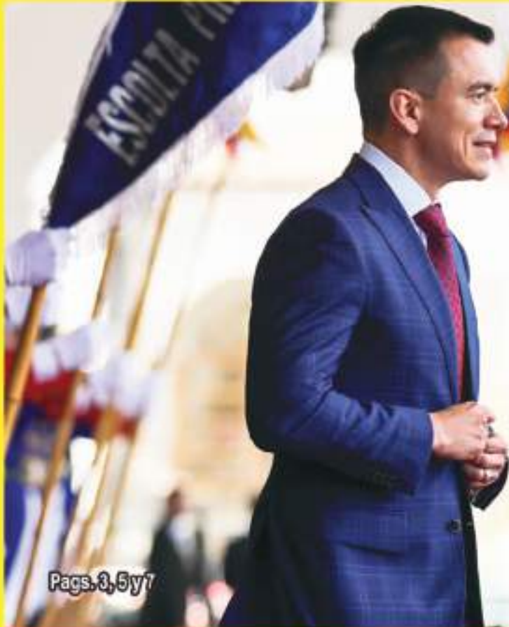
Pags. 3, 5 y 7

Ecuador News desea un feliz 'Thanksgiving' a sus lectores