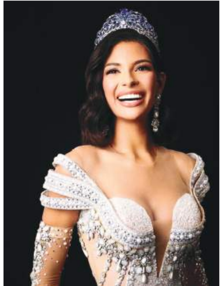
La nueva Miss Universe 2023 Sheynnis Palacios Cornejo.

Thailandia, Chile, Jamaica, USA, Nepal, Perú, Cameroon, Colombia, Portugal, Pakistán, Australia, Filipinas, South África, y El Salvador. Después estás veinte semifinalistas se redujo el grupo a diez entre las que figuraron Puerto Rico, Tailandia, Perú, Colombia, Nicaragua, Filipinas, El Salvador, Venezuela, Australia y España.