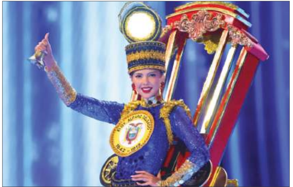
El traje típico de Miss Ecuador rindió homenaje al sistema ferroviario ecuatoriano. Presentaba una chimenea que producía vapor, sombrero iluminado y un tren diseñado para parecerse a las vías del tren. ¡Todos a bordo!