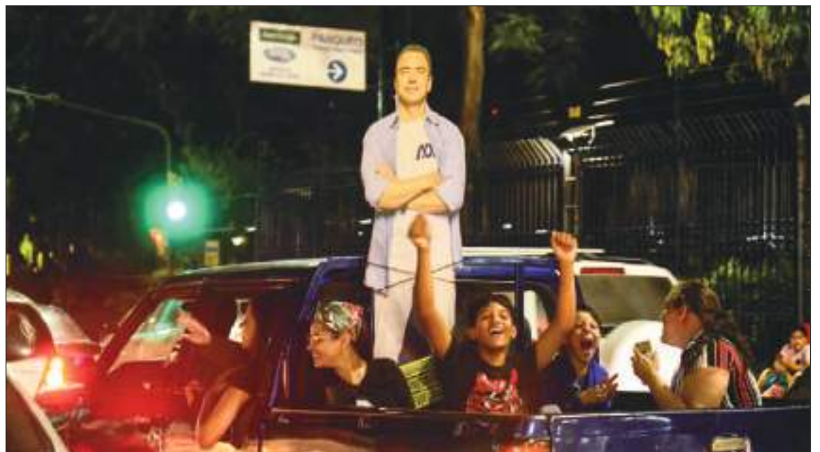
Otro problema para Noboa es que el pueblo espera mucho de él y su tiempo es muy corto.

Noboa tiene más urgencias: pretende una reforma tributaria y otra energética y hasta anunció una consulta popular para sus primeros 100 días de gobierno.