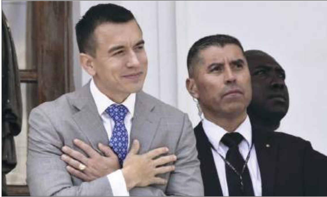
Daniel Noboa se prepara para un año y medio difícil. Las organizaciones del narcotráfico se disputan las principales ciudades del país y habrá compromisos financieros importantes que no puede eludir.

"El Gobierno enfrenta una lógica de transición, por lo que será un gobierno atípico. Tendrá un año y medio hasta que complete el periodo. Y ahí juegan dos variables clave: uno, el tiempo; y la otra, la necesidad de solucionar lo urgente, los principales problemas", evaluó