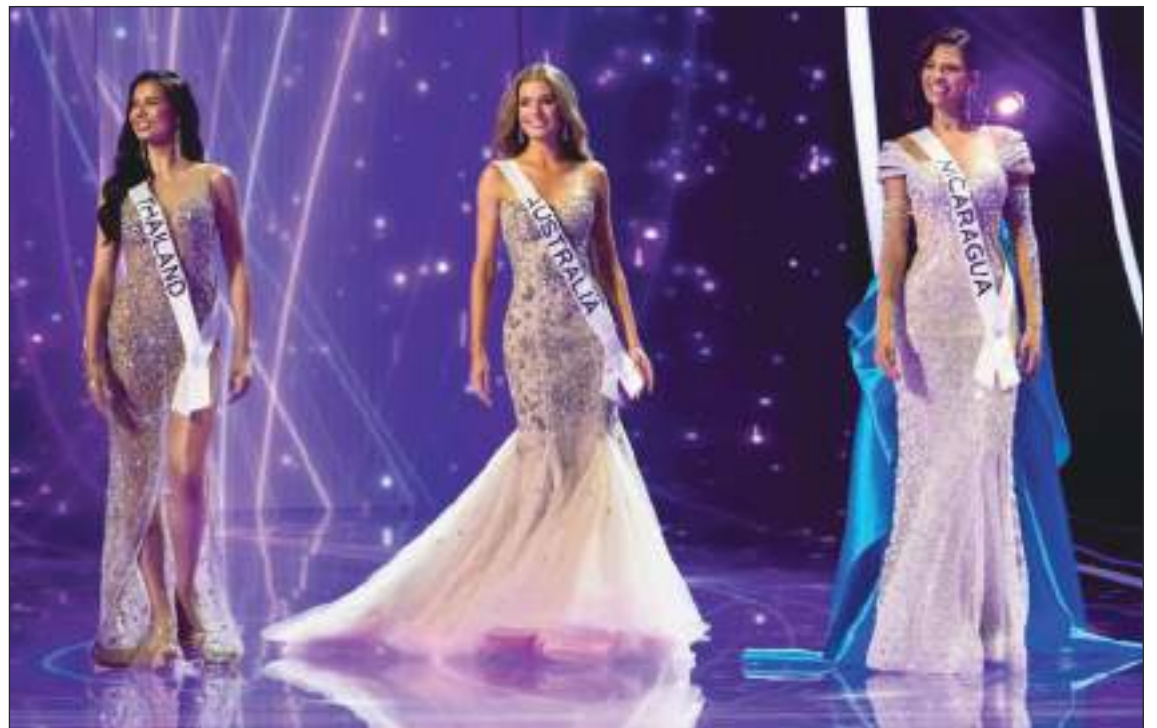
El jurado consideró a estas tres beldades como las finalistas.