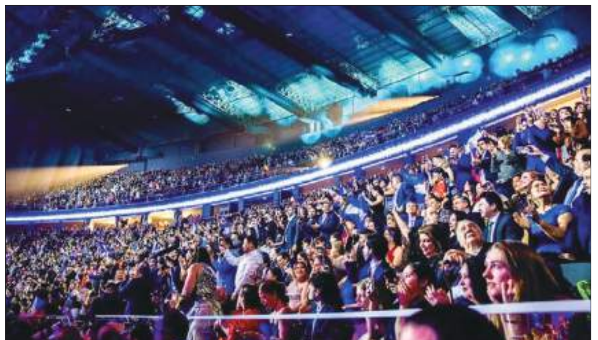
El Gimnasio Nacional de San Salvador, José Adolfo Pineda se llenó por completo para presenciar el concurso.

las tres finalistas fueron Moraya Wilson de Australia, Sheynnis Palacios de Nicaragua y Anntonia Porsild de Tailandia, quedando Australia como segunda finalista, Tailandia fue la primera finalista y la ganadora fue Nicaragua como ya todos conocen desde la noche del Sábado 18 de Noviembre. R'Bonney Gabriel Miss Universe 2022, fue la encargada de coronar a la nueva Miss Universe 2023, título que recayó en la nicaragüense Sheynnis Palacios.