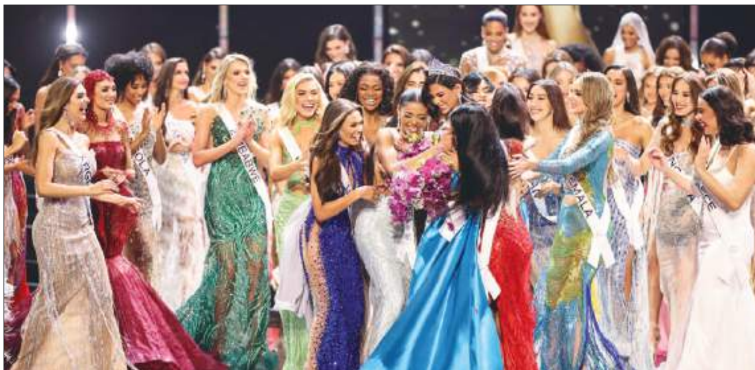
La algarabía fue total al final de la velada. Sheynnis Palacios se ganó también el corazón de sus compañeras.

Antes de representar a Nicaragua en Miss Universo, participó en otros 5 concursos. En el año 2016 fue coronada como la reina adolescente del país centroamericano, luego participó en el Miss Teen Universo 2017 donde quedó entre las 6 finalistas. Años más tarde, se coronó como Miss Mundo Nicaragua 2020, y quedó entre las 40 finalistas del concurso interna-