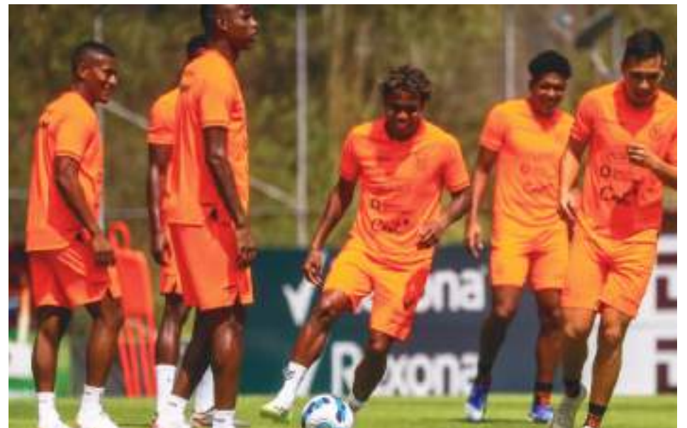
Los ecuatorianos entrenaron optimistas antes de su juego ante los chilenos.

"No me gusta mucho Trump, pero yo también me tomaba la foto y la subía! Jaja! Vamos Chito, a ganar!!", le escribió un seguidor.