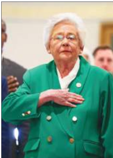
Kay Ivey, gobernadora de Alabama.

En Alabama, según el Centro de Información sobre la Pena de Muerte, la inyección letal sigue siendo el principal método de ejecución en el estado. Sólo otros dos estados -Oklahoma y Mis-