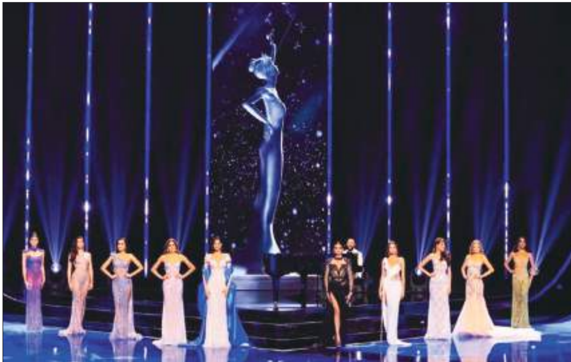
Las diez semifinalistas Puerto Rico, Tailandia, Perú, Colombia, Nicaragua, Filipinas, El Salvador, Venezuela, Australia y España.

Las primeras 20 semifinalistas fueron Nicaragua, España, Puerto Rico, Namibia, Venezuela, India,