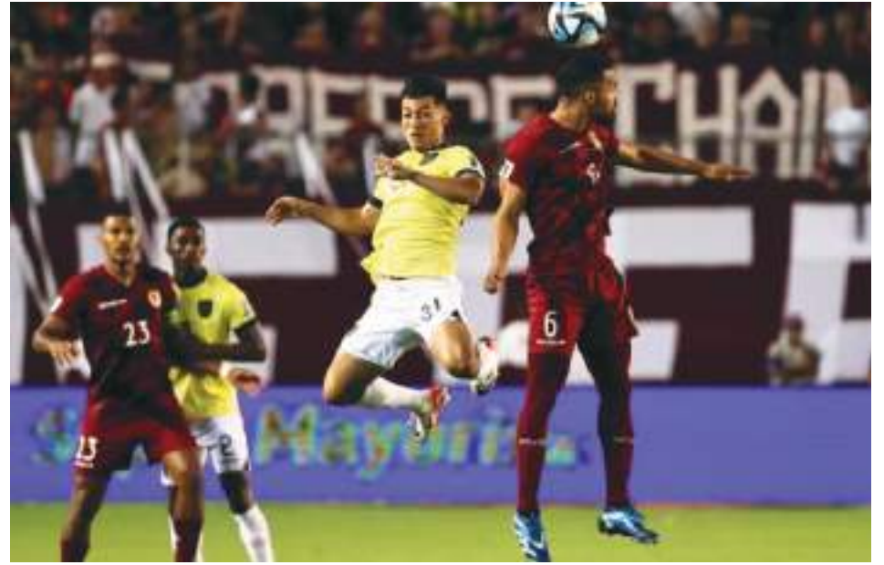
Ecuador y Venezuela empataron a cero goles, un marcador que les favoreció a ambos.