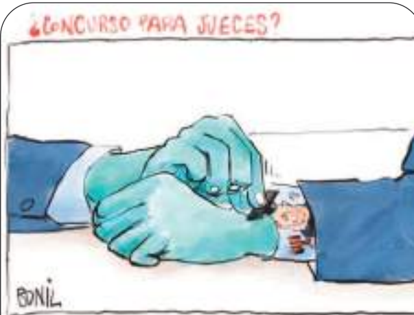
JUEZ EN LA MANGA