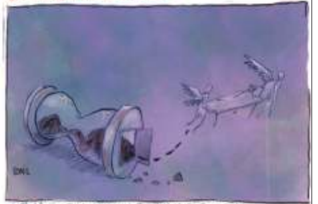
A MALA FELICIDAD Y SOLUCIÓN POR UNA MUERTE DIGNA DOLOR ETERNO