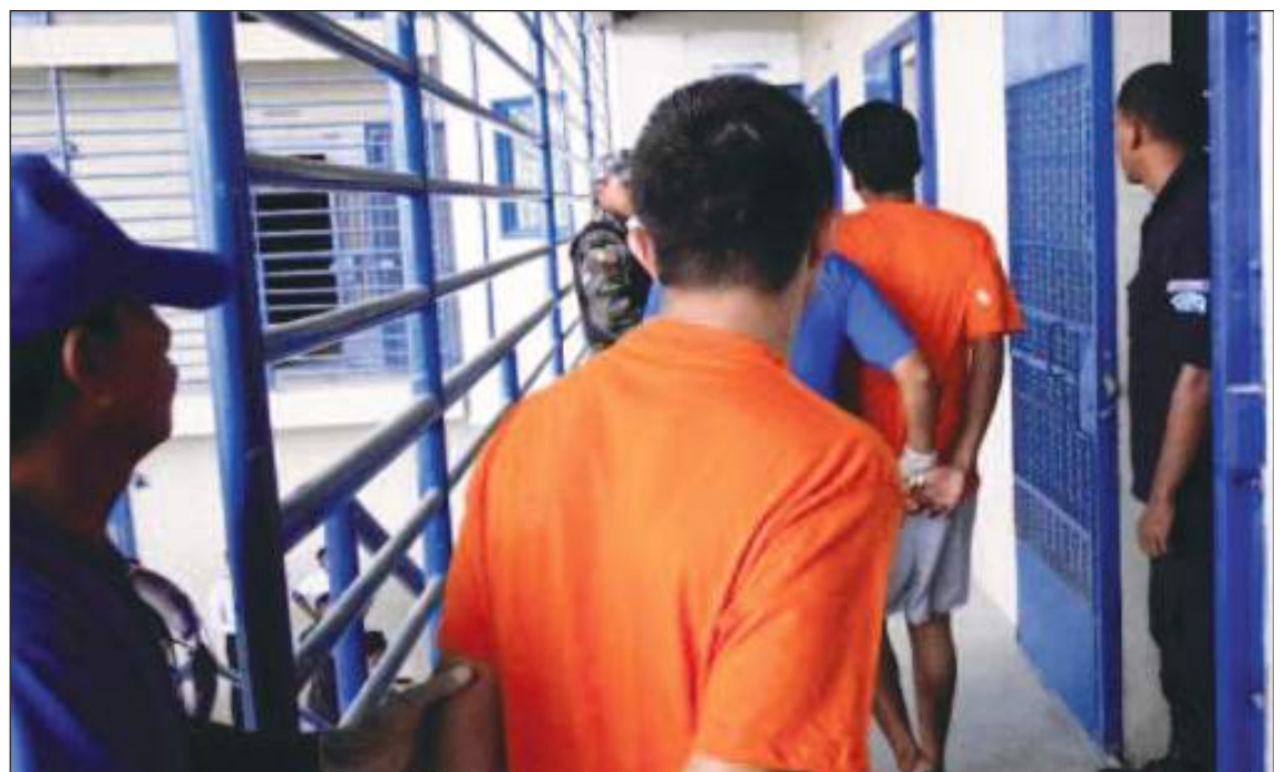
La militarización de las cárceles ecuatorianas se produjo en el marco del estado de excepción.

"(Este viernes) supuestamente se iba a permitir el ingreso de medicinas. Muchos familiares madrugaron para hacer fila en la Penitenciaria del Litoral (Guayaquil).