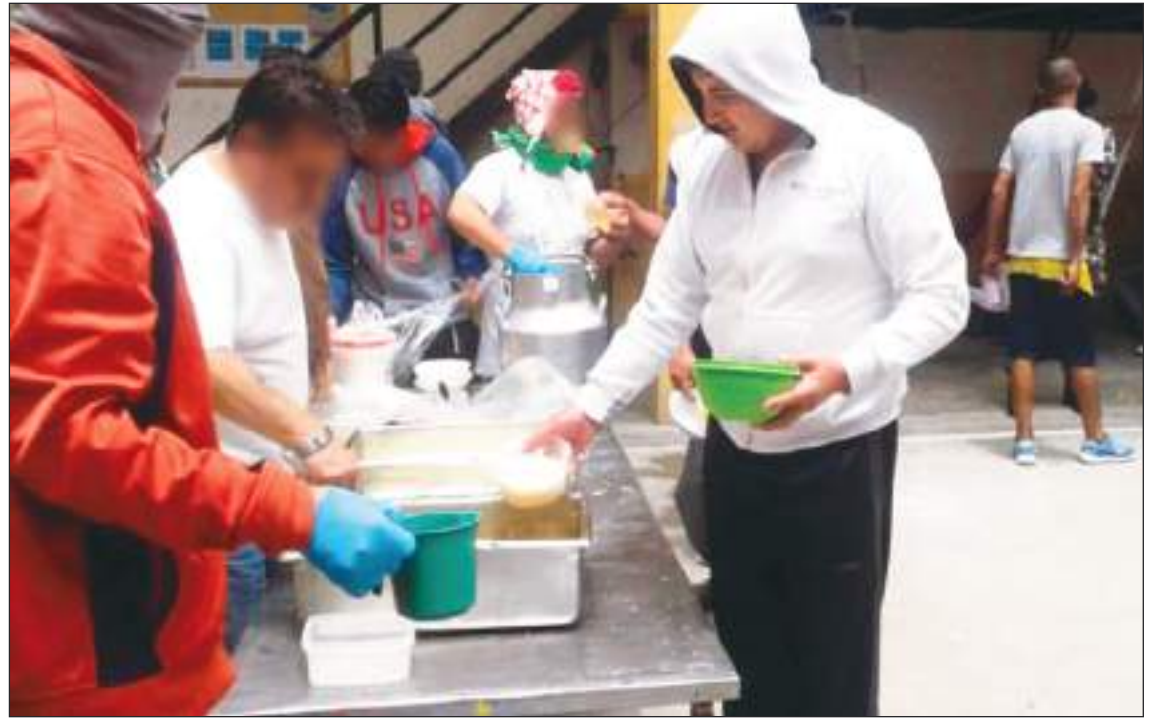
Hay denuncias que deben comprobarse según la Comisión de Derechos Humanos.

Desde que el 9 de enero pasado el presidente Noboa decretó la existencia de un conflicto armado interno, el control de las penitenciarías está en manos de las Fuerzas