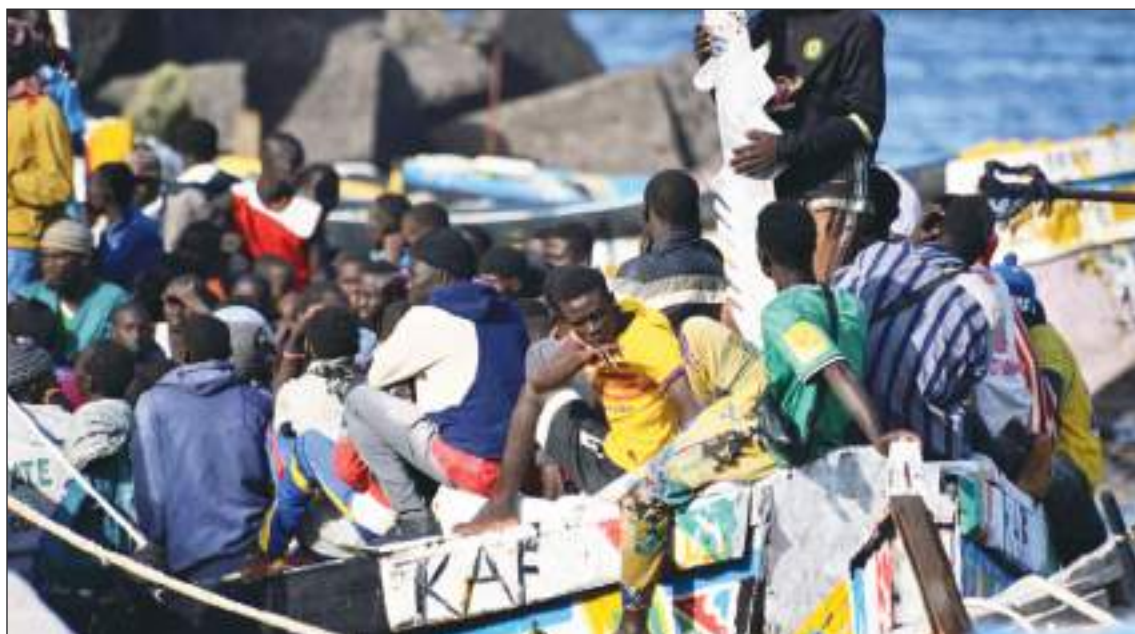
Las pateras con africanos constituyen un problema para los españoles, el cual quieren resolver.

La comunidad ecuatoriana en España en cifras del 2021 era la tercera comunidad extranjera más importante en el país con unas 416.323 personas. De este número un total de 184.470 ecuatorianos en España estuvieron en este 2024, llamados a participar el domingo