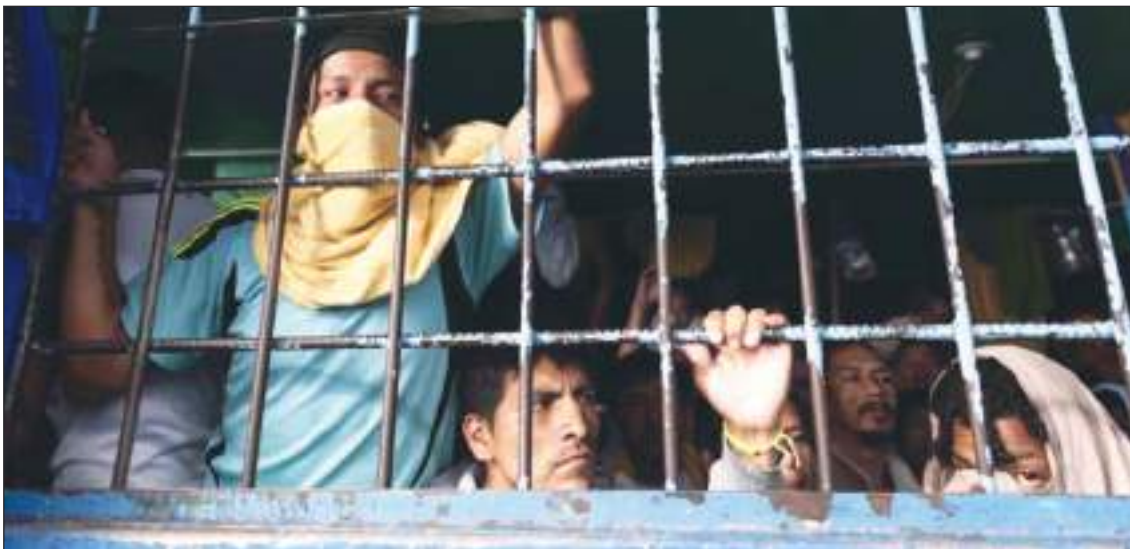
En los últimos años, los centros carcelarios se situaron como el epicentro de la crisis de violencia criminal.

En los últimos años, los centros carcelarios se situaron como el epicentro de la crisis de violencia criminal que sufre Ecuador y que ha hecho que el país se sitúe entre los primeros con más homicidios de Latinoamérica.