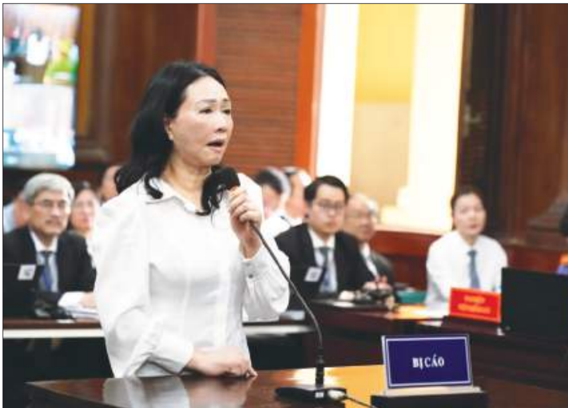
La acusada tuvo la oportunidad de defenderse, pero sin éxito, los cargos eran muy fuertes y comprobados.

Tras una serie de detenciones de grandes empresas en 2022, las acciones vietnamitas sufrieron desplomes de millones de dólares, haciendo tambalear la confianza de los inversores en un momento delicado para la economía de rápido crecimiento.