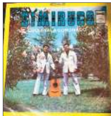
Portada del LP. El Simiruco

Ellos son el resultado de una amistad artística y personal, que nació para desarrollar una propuesta musical nueva. Dedicaron mucho tiempo y pasión a su tra-