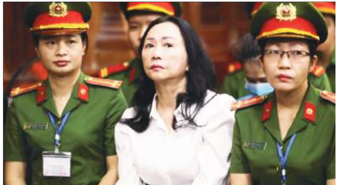
La magnate vietnamita Truong My Lan observa en un tribunal de la ciudad de Ho Chi Minh el 11 de abril de 2024.

Este juicio, que comenzó el 5 de marzo y terminó antes de lo previsto, fue uno de los dramáticos