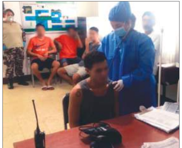
Hay otros servicios para los presos que se investiga si igualmente están siendo rebajados.

Por su parte, Amnistía Internacional (AI) pidió al Estado ecuatoriano que garantice a los presos de al menos cinco cárceles en el país el acceso a alimentación y medicamentos, después que varias organizaciones y colectivos hayan denunciado la suspensión del ser-