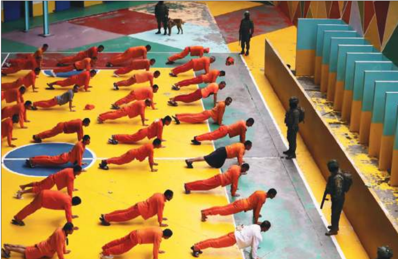
Los controles se han hecho más estrictos por lo sucedido en los últimos tiempos.

"conflicto armado interno" declarado por el presidente ecuatoriano, Daniel Noboa, contra las bandas del crimen organizado, cuyas estructuras tenían el control interno de las prisiones.