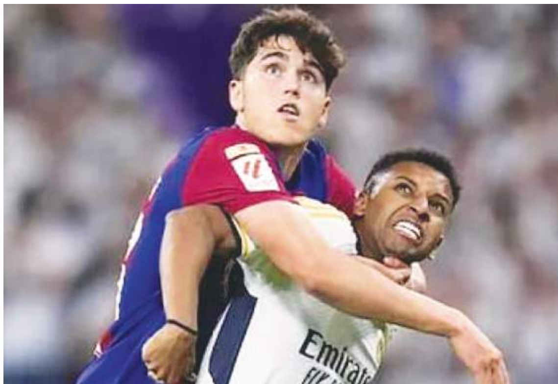
El español Pau Cubarsi (izquierda) y el brasileño Rodrygo Gois, del Barcelona y Real Madrid, respectivamente, dos jugadores muy jóvenes, pero que disputan el balón con exagerada fortaleza, arriesgando sus físicos.

Se habla de videos que muestran tales o más cuales cosas que desentonan contra el arbitraje, señalándolas como favorables al Madrid, sin pruebas fehacientes al respecto, porque la Liga Española no ha invertido el suficiente dinero