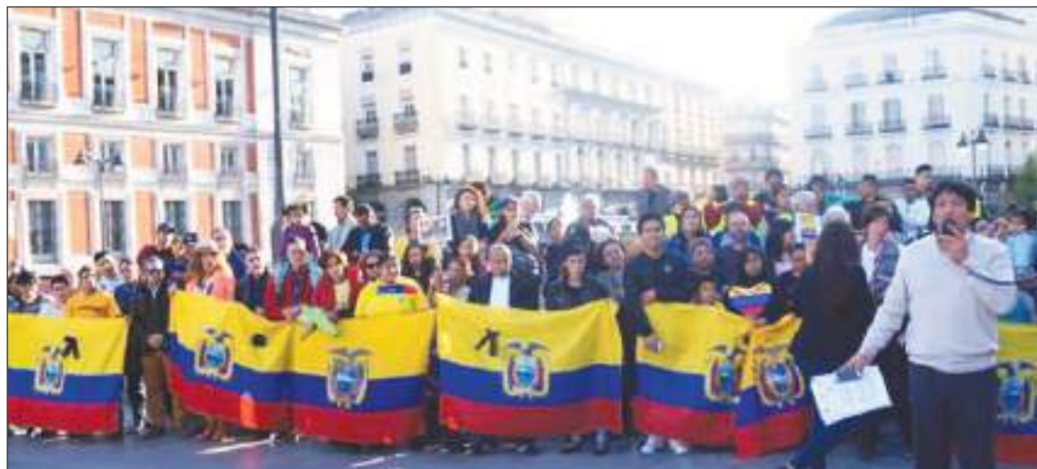
En España, los ecuatorianos organizan maravillosas actividades en donde lucen orgullosos su bandera tricolor.