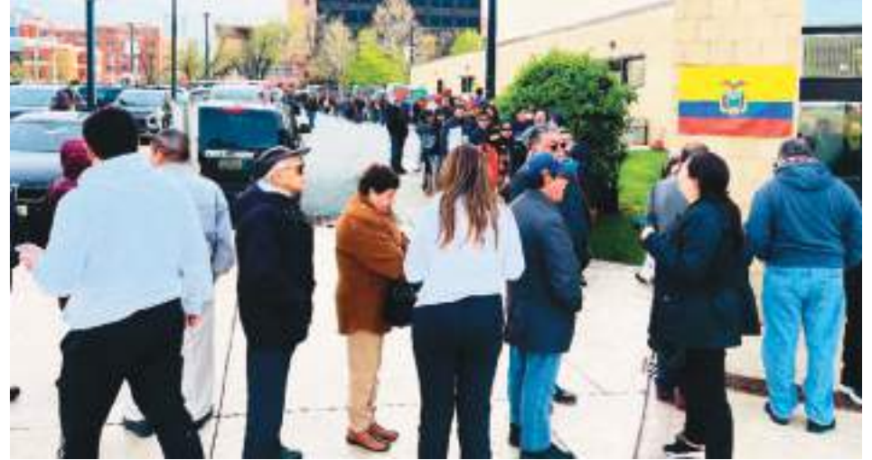
Lo destacable, se dio paso a que primero sufragaran los adultos mayores, en primer plano, en la gráfica de Ecuador News.