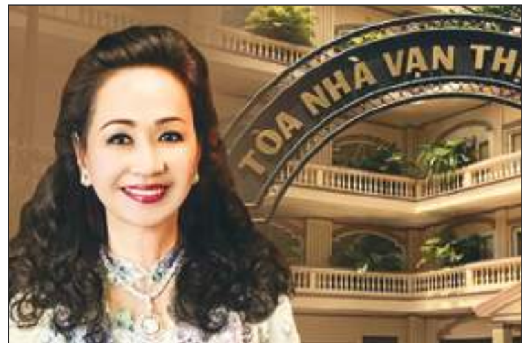
Truong My Lan, la 'magnate' que construyó un enorme ecosistema con un tentáculo para atraer decenas de miles de millones de dólares.

Entre tanto, un miembro de la familia de Lan, que habló bajo con-