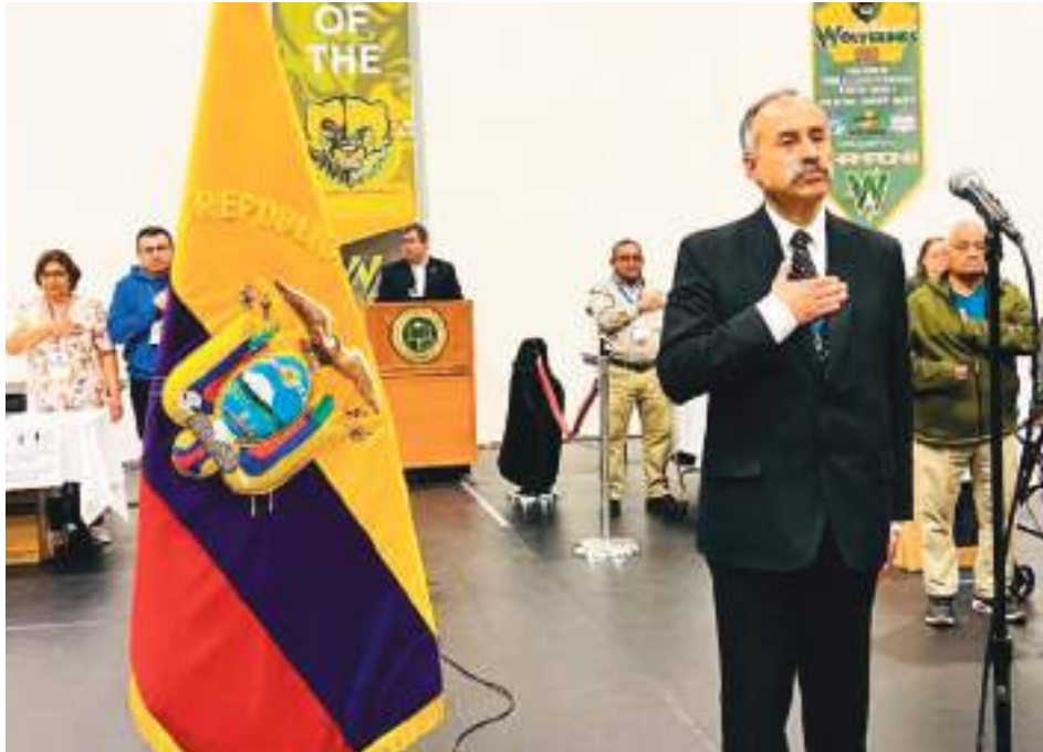
El Honorable Alfonso Morales, Cónsul General del Ecuador en New Jersey y Pensilvania, inició la apertura de la Consulta Popular y Referéndum con el Himno Nacional del Ecuador.

Es indudable que la comunidad ecuatoriana empadronada en New Jersey y con tres recintos electorales la principal ubicada en la ciudad de Newark y las dos restantes en las ciudades de Hightstown y North Plainfield, no llenaron las expectativas de que los ecuatorianos acudieran masivamente a las urnas, escasa promoción, desconocimiento de las 11 preguntas y sus anexos, podría haber sido las causas para el ausen-