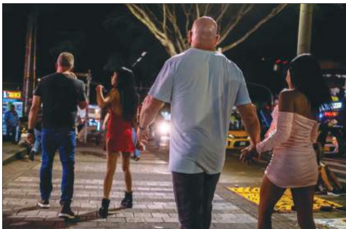
La rumba de Medellín está siendo promocionada, pero lo que se acaba de descubrir está fuera de toda lógica.

las dos niñas, a quienes despidió un par de horas más tarde en la puerta del ascensor. A las menores, por su parte, se les vio contando el dinero recibido de Timothy.