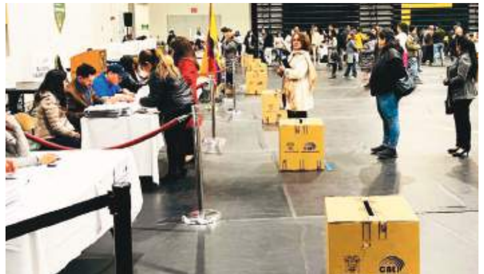
Primera hora del domingo anterior, votaciones en la ciudad de Newark, delegados en las mesas electorales laboraron de manera holgada y ordenada, esperamos ver una mayor participación de electores en las elecciones presidenciales del próximo año 2025.

En definitiva los ecuatorianos empadronados brillaron por su ausencia en los tres recintos electorales; conocemos que en la jurisdicción de EE.UU. y Canadá existen aproximadamente unos 136.600 empadronados, quizá en esta ocasión el 21 de abril acudieron a las urnas escasamente un 25 por ciento.