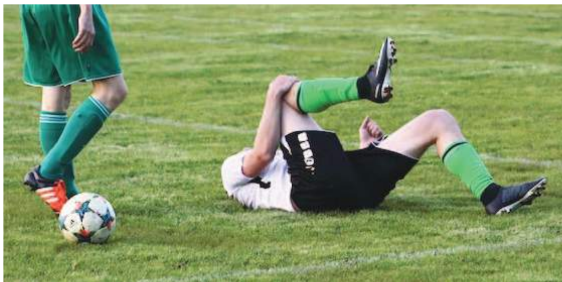
En cada partido siempre habrán varios jugadores en el piso quejándose de una entrada muy fuerte.

Simplemente, los árbitros habían "dejado jugar", en aras de "no dañar el espectáculo", aunque "se dañen los jugadores".