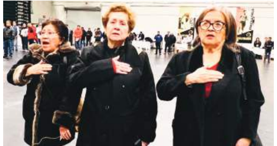
Damas de la tercera edad, en una demostración de civismo cantan altivas nuestro Himno Nacional, previo a las votaciones en el recinto electoral de Newark.