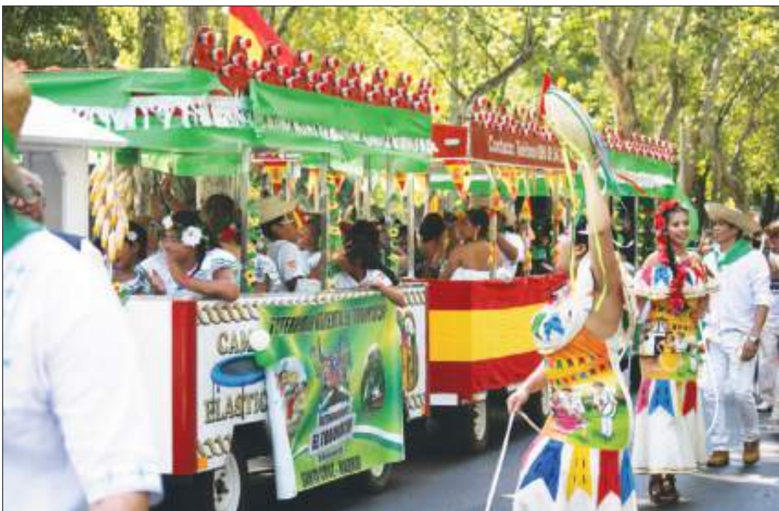
Muchas comunidades que hicieron de España su nuevo hogar, exteriorizan con orgullo sus raíces.