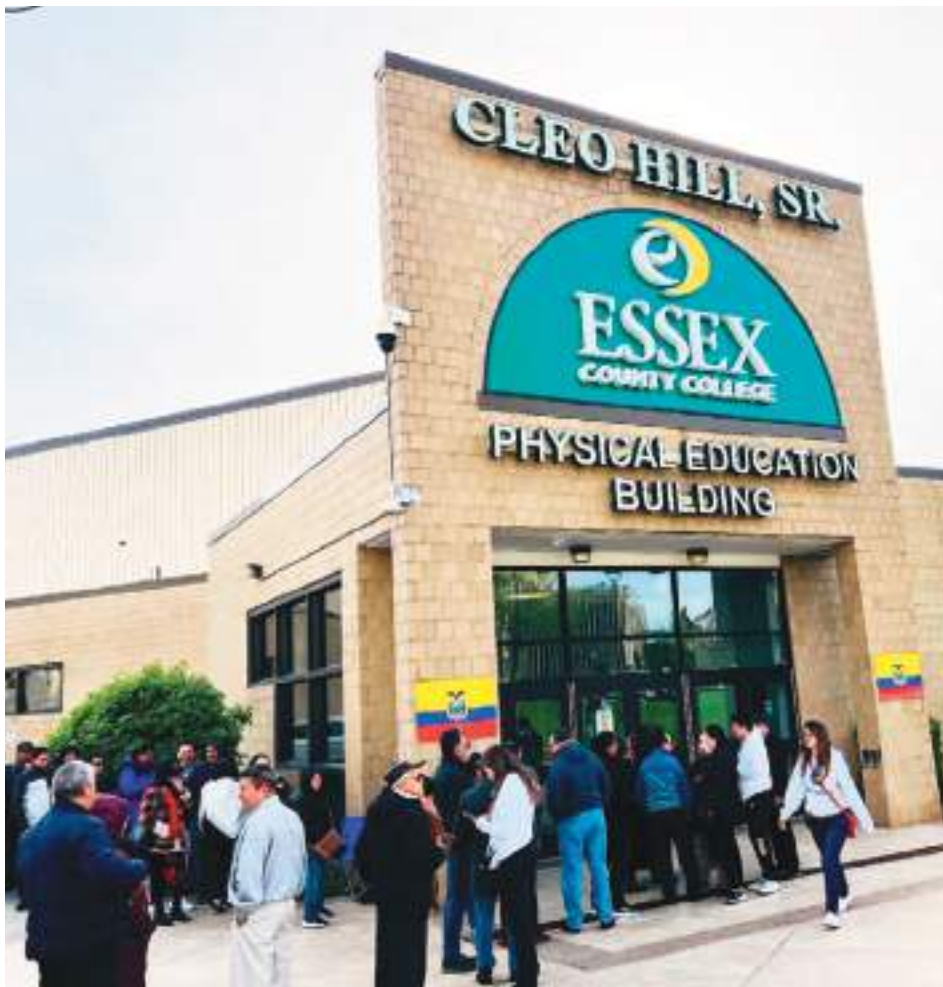
9 AM. Ecuatorianos listos para ingresar al recinto electoral ubicado en la cancha de educación física del Essex County College en la ciudad de Newark.

tismo de los ecuatorianos empadronados y con derecho al voto.