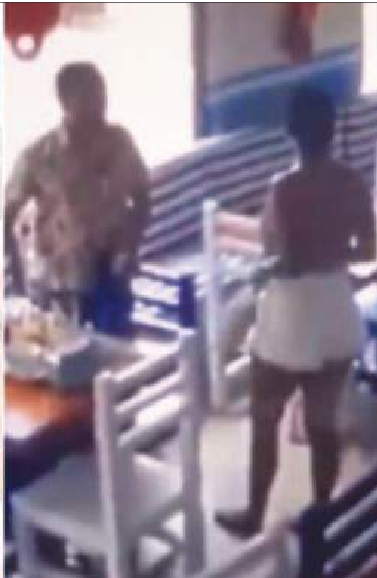
La joven alcanzó a publicar en dónde se encontraba y qué estaba desayunando, cuando llegaron los sicarios a quitarle la vida.

restaurante de Quevedo, capital de la provincia tropical de Los Ríos, hasta donde se había trasladado para un evento social.