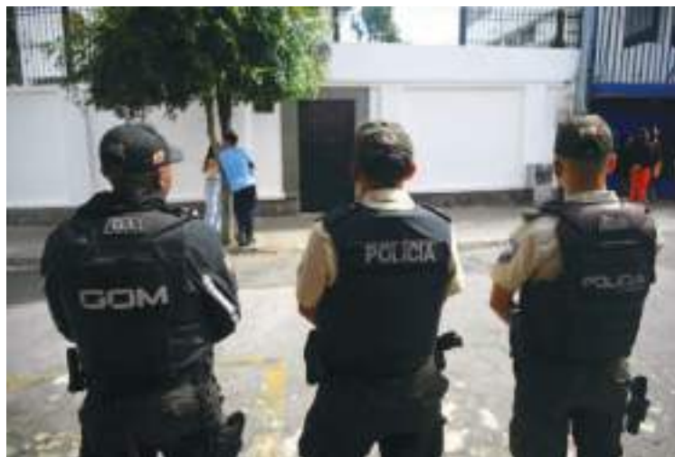
Varios policías montan guardia frente a la Embajada de México en Quito.

La Corte Nacional de Justicia de Ecuador (CNJ) consideró que el