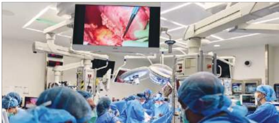
Los xenotrasplantes (trasplantes de órganos entre especies diferentes) se han presentado como una posible solución para los pacientes necesitados en un contexto de escasez crónica de donantes de órganos.

Otras especialidades se encuentran observando atentamente la evolución de la paciente.