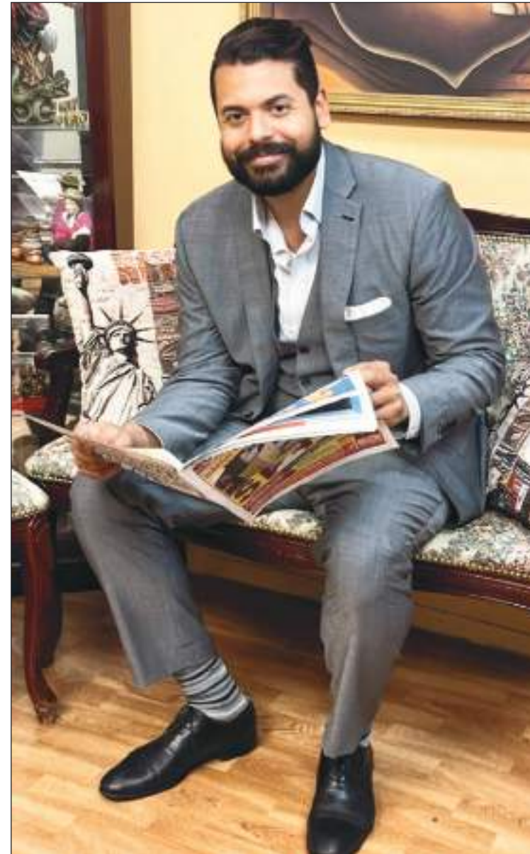
Ramery visitó las oficinas del Semanario Ecuador News para dialogar con nosotros.

el bajo Manhattan, siempre estudié en escuelas públicas, fui a PS 20, después estuve en PS 140, después me fui para High School Leadership que queda en el financial district,