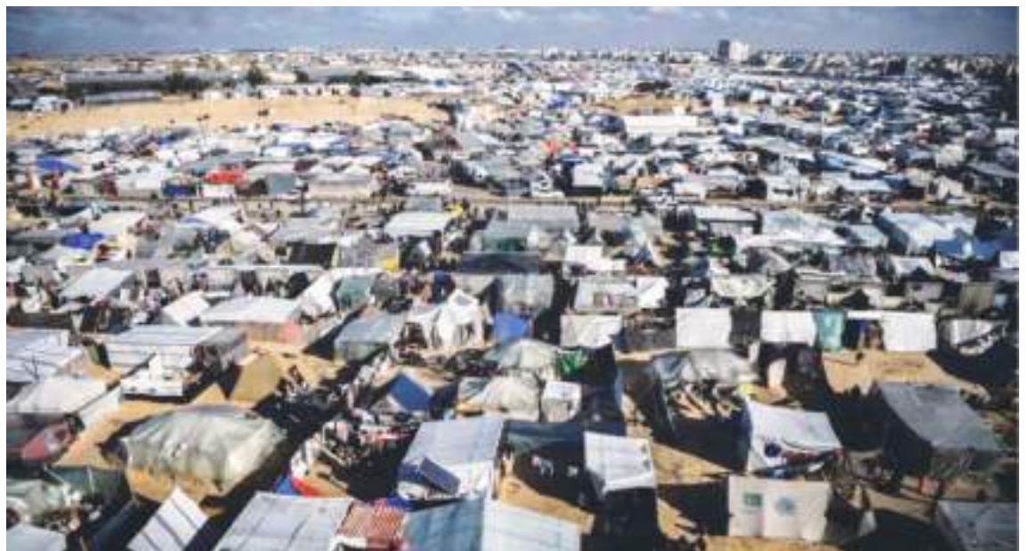
Vista parcial de carpas montadas por miles de palestinos que huyeron a Rafah en busca de refugio.

El resultado de este resentimiento popular podría ser un revés para la democracia. Ya que pudiera volver a darle el mando de la Casa Blanca a Donald Trump. Sin duda alguna el primer dictador de los Estados Unidos de Norte América.