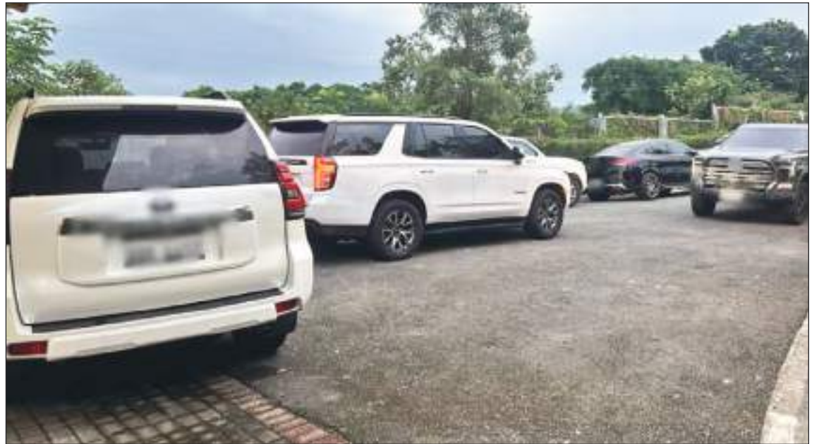
Lujosos vehículos de alta gama estaban en el parqueadero en espera de sus dueños.

Y un tercer expediente, también por delincuencia organizada, por la supuesta venta irregular de medicamentos para los hospitales del IESS Teodoro Maldonado y Ceibos.