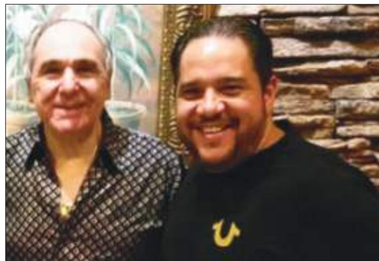
Para Abdalá Bucaram lo de su hijo es una nueva persecución política.

La finca San Andrés, el predio de vía a la Costa de Guayaquil donde fueron detenidas varias personas -entre ellos Jacobo Bucaram- se pronunció sobre el operativo. Se celebraba el cumpleaños de