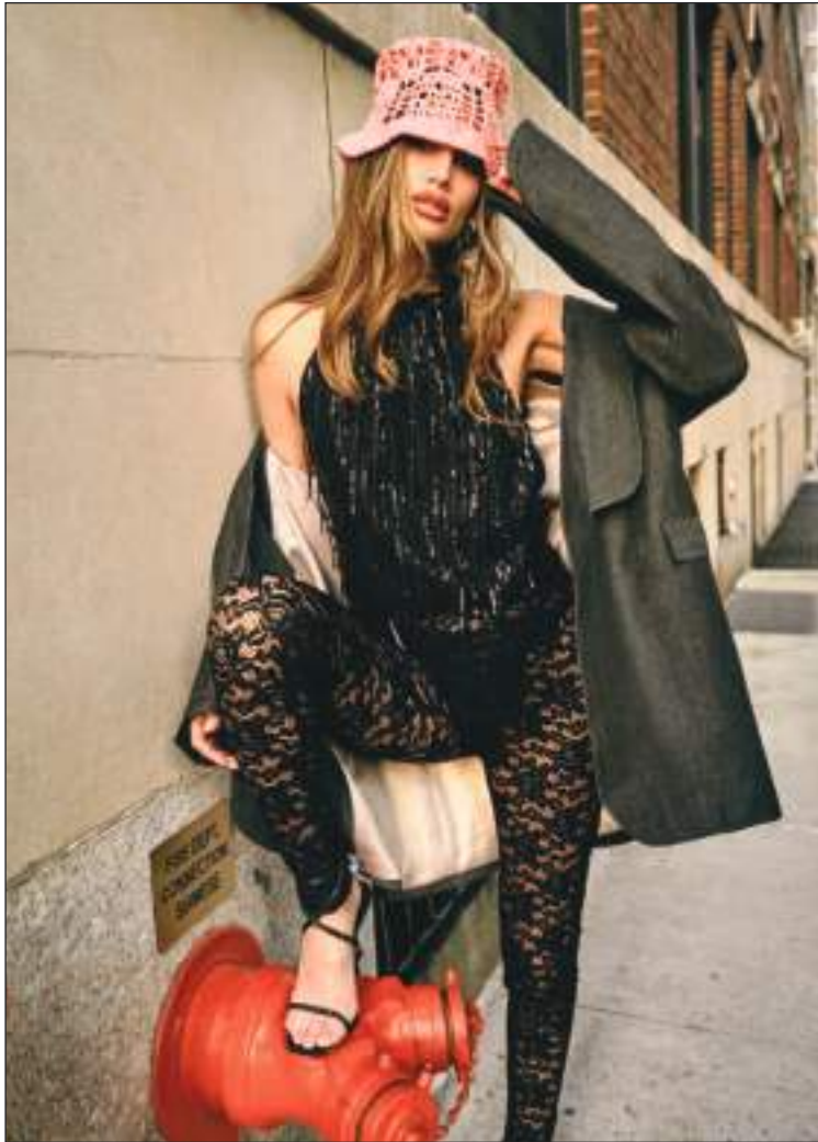
Durante la sesión de fotos una de las modelos con un traje de la próxima colección.