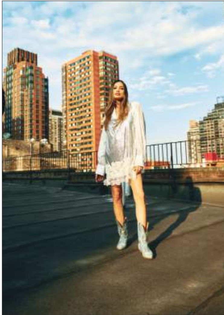
Una de sus modelos en una sesión de fotos en New York.

incursionando, haciendo cosas para mi mamá, y cuatro años más tarde fallece mi papá y esto me da impulso para decir bueno ahora sí voy a realizar lo que siempre quise hacer, empezando a armar mi primera colección que se llamó fotosíntesis, la cual tuvo 240 looks, hasta hoy en día después de 27 años se denominó la colección más grande en la historia latinoamericana, nadie más lo ha hecho y mucho menos poder superarlo, desde ahí me catapulté y armé mi primer show room, donde tenía dos pisos, en el un piso estaba toda la ropa, y en el otro piso atendíamos a la gente, preparándoles como lucir bien.