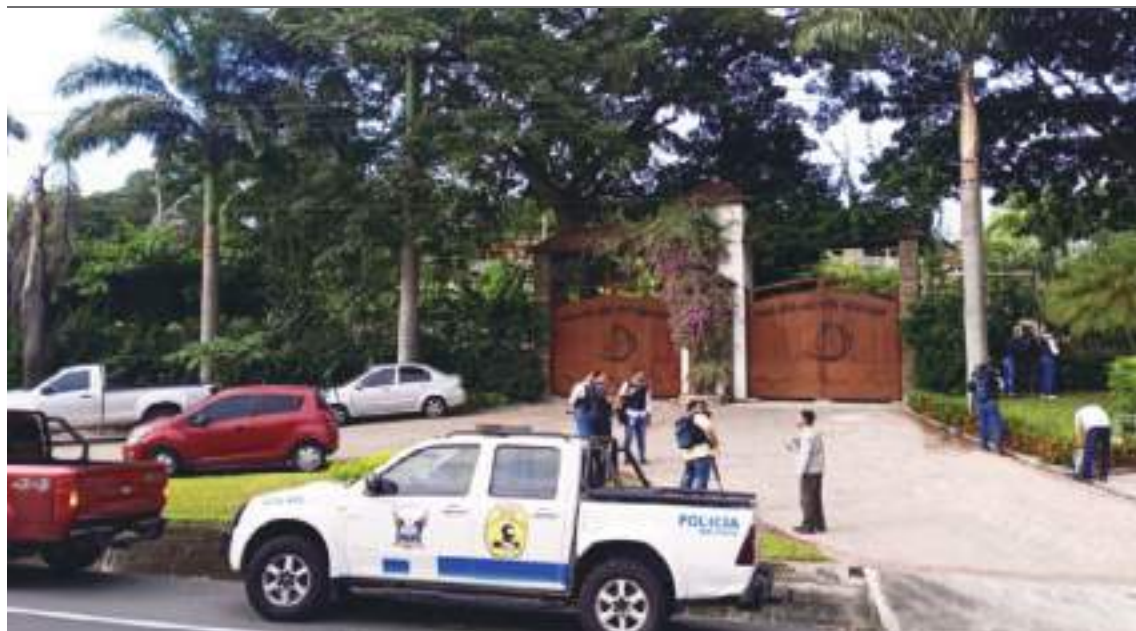
Portal de la finca San Andrés, en donde la policía hizo presencia después de una llamada anónima.

"Lo real es que anoche llegué a Boston para celebrar junto a mi familia las actividades con motivo del doctorado honoris causa que me otorgará Berklee Music College. Cualquier otra información es totalmente falsa".