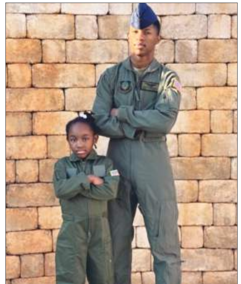
Fortson era una persona estimada en su entorno y dentro de la familia.