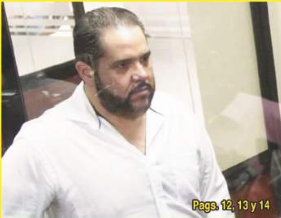
Pags. 12, 13 y 14