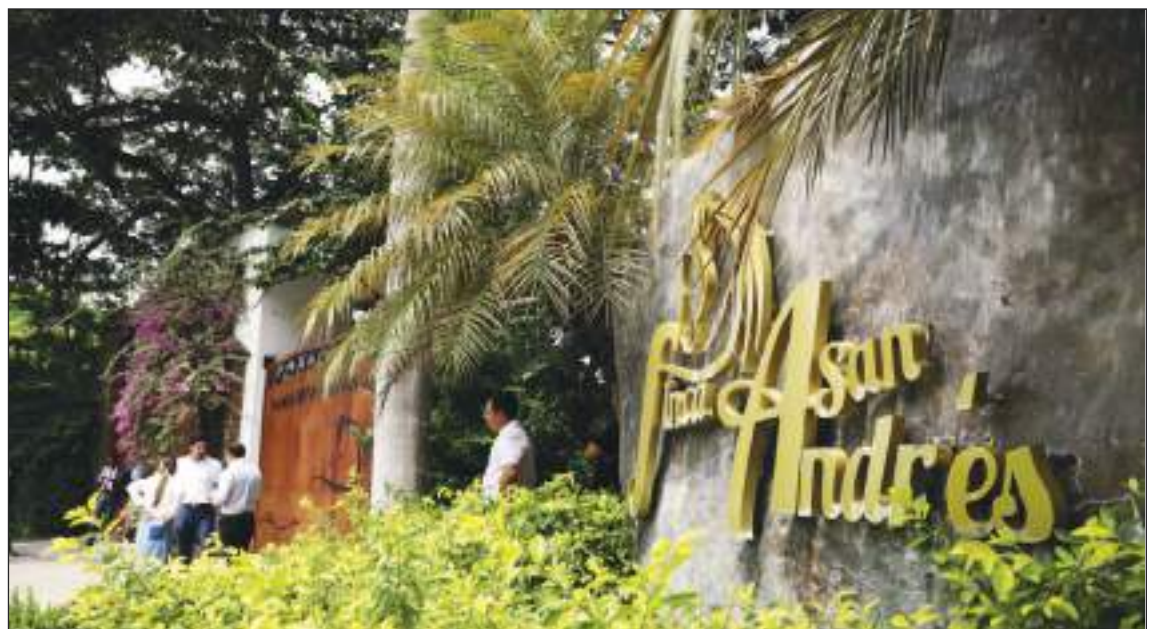
Los propietarios de la finca San Andrés rindieron rápidamente su declaración a las autoridades.

Informa el portal GK, que cuando su padre era presidente del país, se habló de viajes que Jacobito hizo a Estados Unidos utilizando recursos del Estado para someterse a tratamientos para bajar de peso.