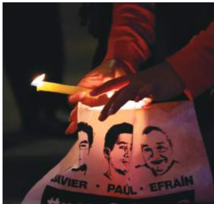
Sus familias y mucha gente se niega a olvidarlos. Con frecuencia se les rinde homenaje religioso. Ahora se sabrá la verdad.

En junio de 2018, los cuerpos fueron encontrados en Tumaco, Colombia, en la frontera con Ecuador y tras verificar la identidad fueron devueltos a Ecuador y entregados a sus familiares.