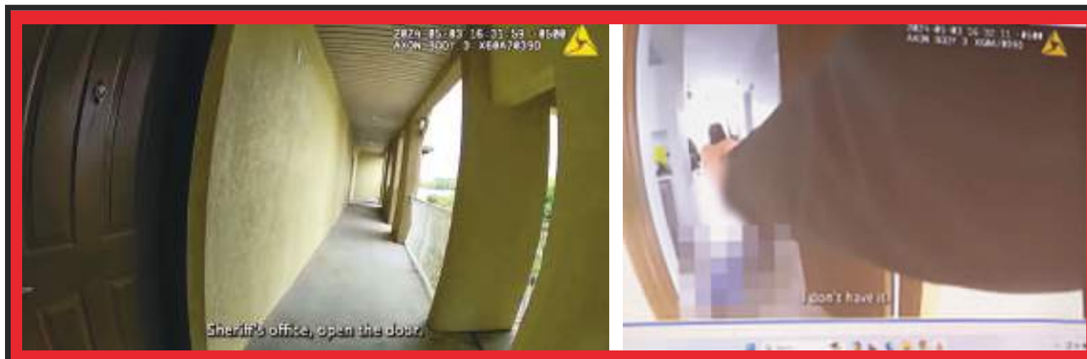
Videos captados de la cámara del oficial que disparó. A la izquierda frente a la puerta, a la derecha efectuando los disparos, lo cual se investiga.