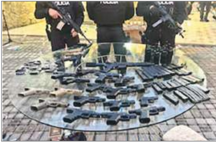
Armas de diverso calibre fueron incautadas en la fiesta.

Agregó que no estuvo, ni está, ni estará en la próximos días en Ecuador.