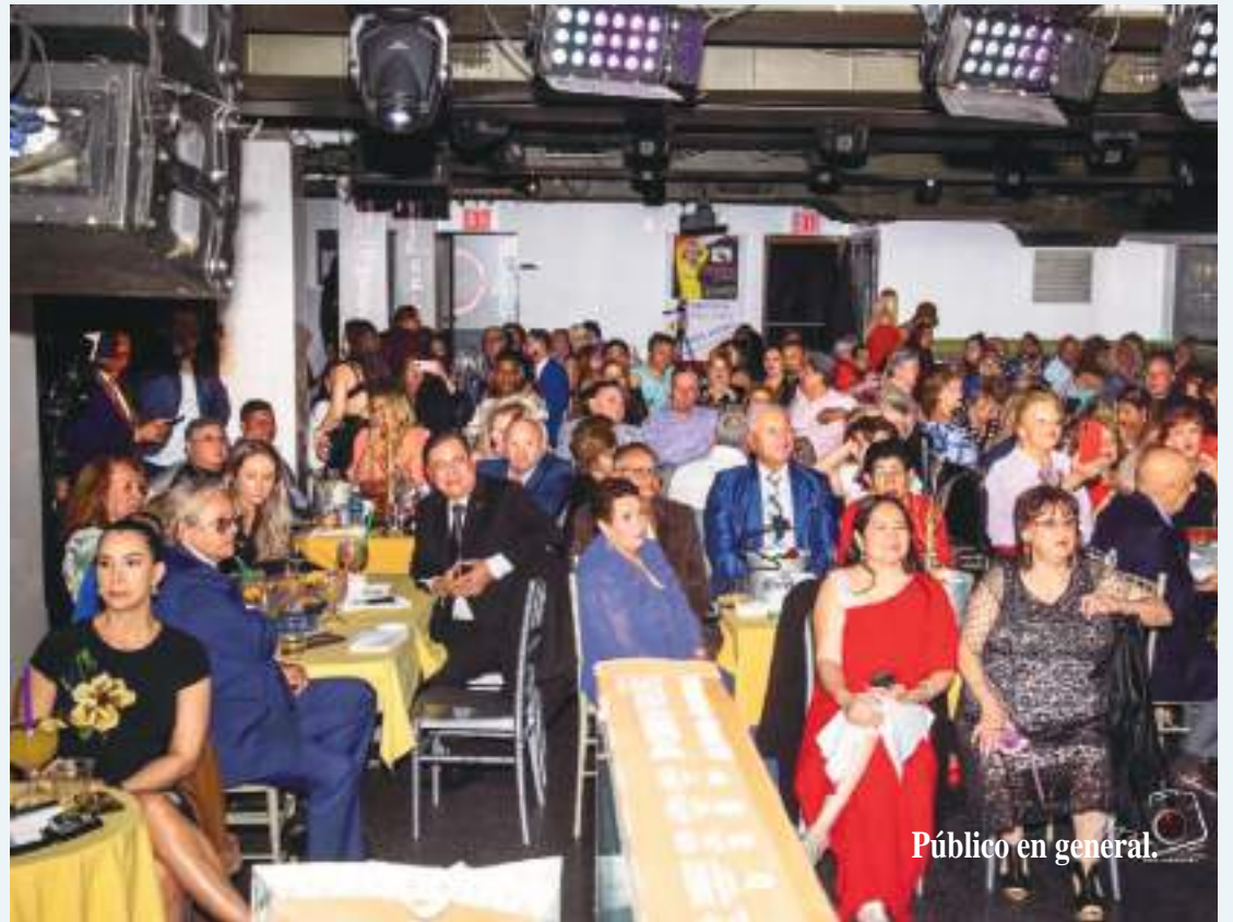
Público en general.

decimiento especial por el respaldo y apoyo a todos y a cada uno de sus patrocinadores de este gran evento "Homenaje a Mamá", que fue un éxito y lleno total.