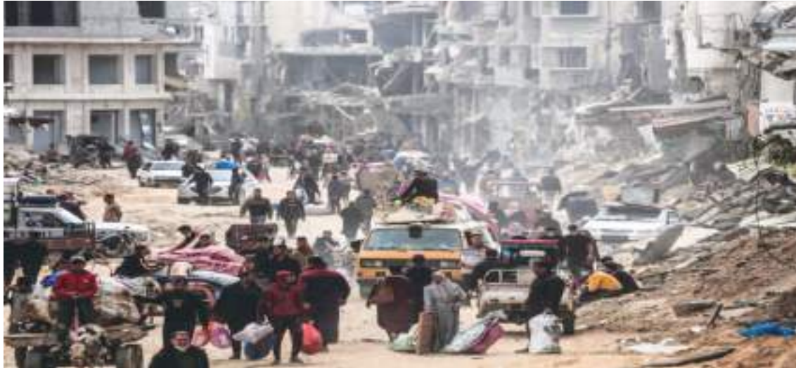
Destrucción de Palestina por los bombardeos de Israel.

de crear un régimen más autocrático y se alejan de mejores medios democráticos.