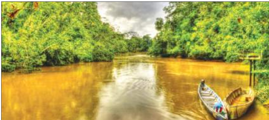
Parque Nacional Yasuní, una hermosa zona que muchos en el mundo piden que sea protegida.

Este plan debe ser construido con la participación de los Pueblos Indígenas y debe lograrse a más tardar en agosto. Yasuní no puede esperar más. ¿Puede decirnos cuáles son las fechas exactas? Gracias por su compromiso," finalizó.