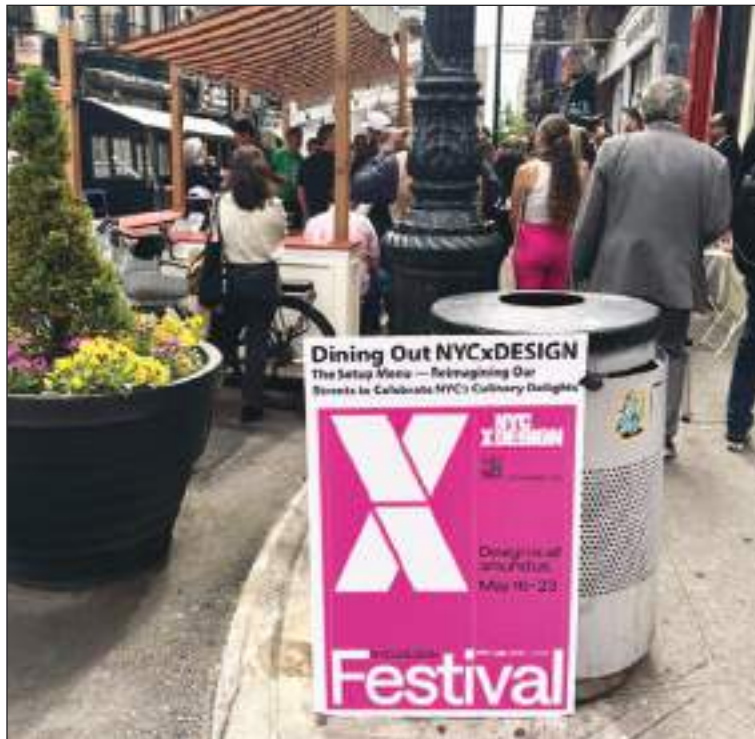
El Prototipo del programa Dining Out NYC, instalado en las afueras de Sunday to Sunday.

Entre los lugares donde ya se han instalado los diferentes proto-