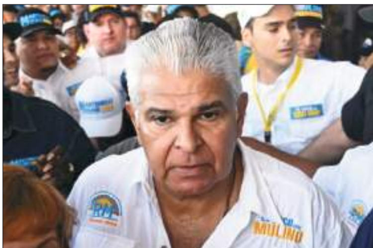
El presidente electo de Panamá, José Raúl Mulino, tiene una idea concreta con respecto al Tapón del Darién, que ha preocupado al mundo.