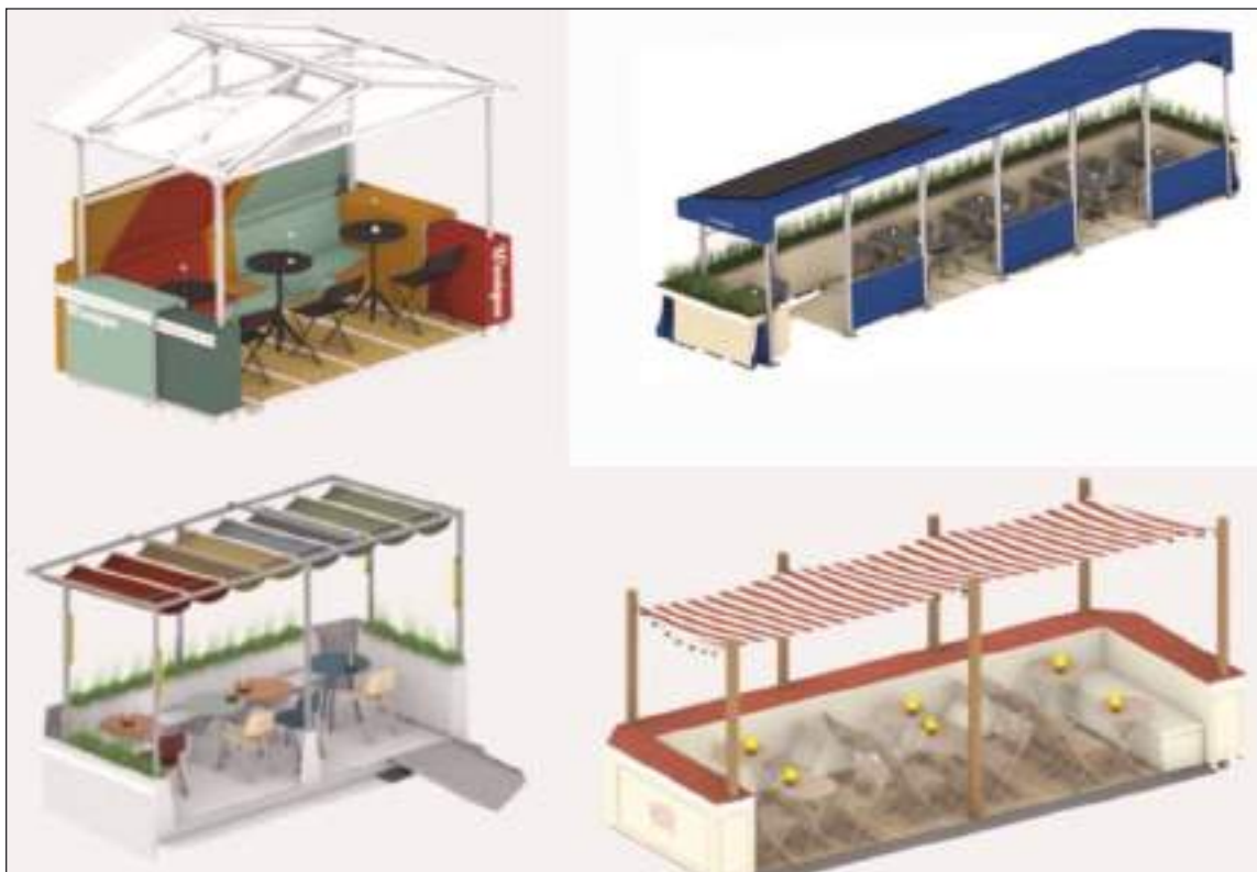
Los cuatro diseños del Programa Dining Out NYC.

Bodrum en el Upper West Side, Manhattan, configuración del carril de estacionamiento flotante, la que incluye una barrera con revestimiento de madera contrachapada marina, una estructura de piso de aluminio con losas de madera y una barrera removible, rampa de accesibilidad de goma. esta configuración presenta un dosel superior rígido hecho de aluminio y una cubierta de panel del vestíbulo; el diseño también incluye maceteros para zonas verdes, una protección hecha de paneles del vestíbulo y un recinto de cadena de eslabones.