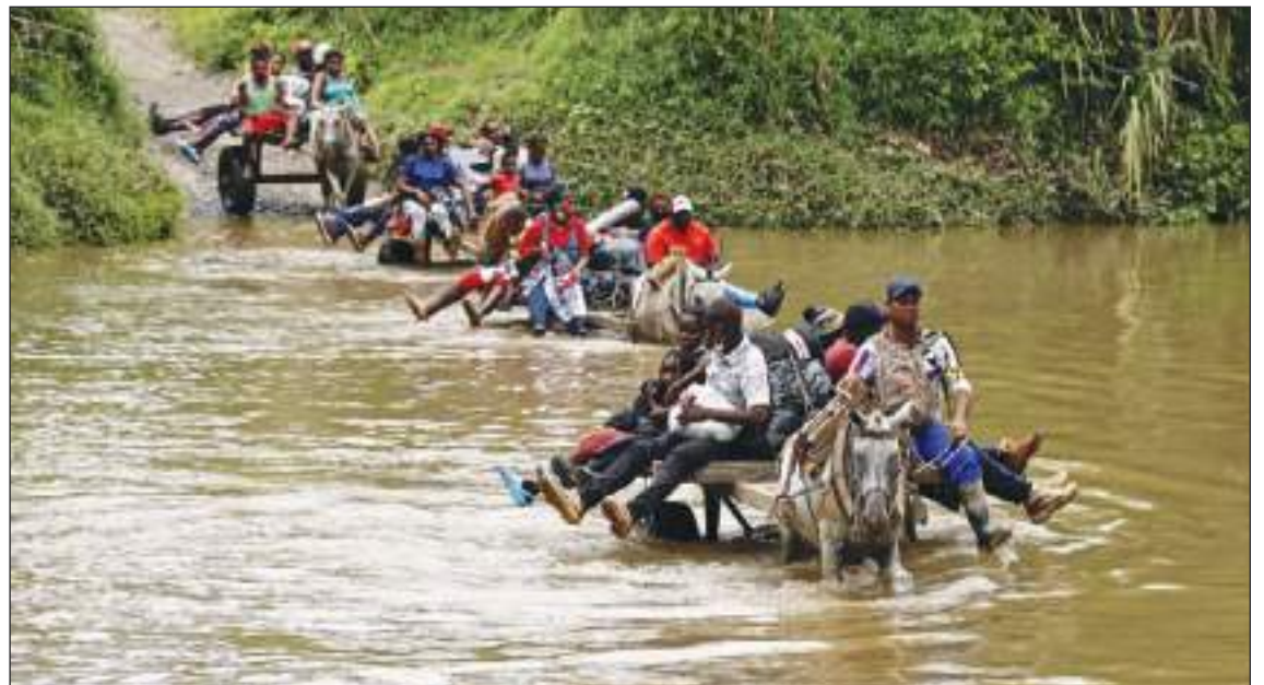
Quienes viven en la zona también van a sufrir las consecuencias de los planes del nuevo presidente panameño.

“Lo importante es tratar de no buscar que la migración sea cada vez más clandestina, sino buscar procesos de trabajo con los gobiernos, con la comunidad internacional más activamente para poder buscar una solución mucho más efectiva y que garantice los derechos humanos de las personas”, sentenció el vocero del MPI.