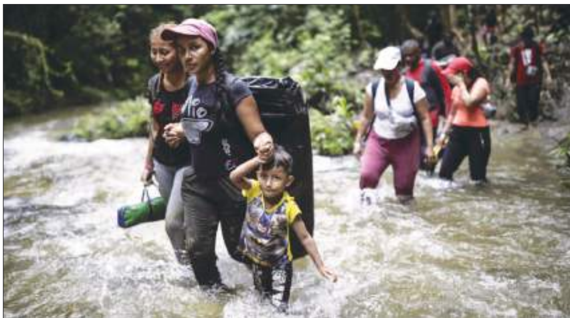
Jóvenes, viejos, niños... Se ven a diario cruzando el Tapón del Darién. ¿Buscarán otras rutas?