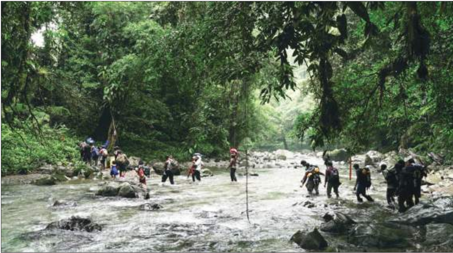
Las dificultades topográficas y ambientales del Tapón del Darién son complicadas y se requieren baquianos expertos para cruzar.

electrónicos de monitoreo... Hay un portafolio de medidas disponibles”.