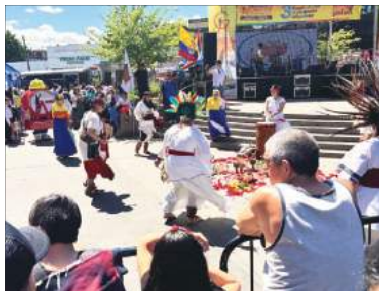
El Festival se inició con esta ceremonia ancestral.