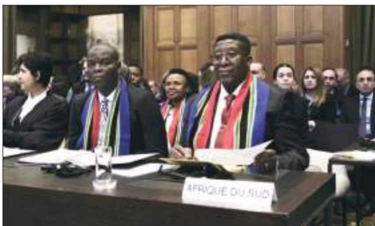
La CIJ es un organismo muy serio e imparcial.

El 29 de abril, la canciller mexicana, Alicia Bárcena, rechazó los argumentos de Ecuador sobre que México había hecho un mal uso de su representación diplomática y las autoridades mexicanas no se han expresado sobre la posibilidad de un posible restablecimiento en las relaciones diplomáticas entre los dos países.