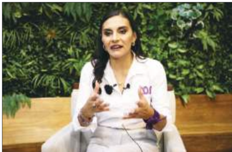
Para complicar más su situación, la vicepresidenta confirmó que Estados Unidos le había cancelado su visa... Sin darle ninguna explicación.

“Esto es, sin duda alguna, una mezcladilla, porque lo que hacen es filtrar información, desinformando, diciendo que es por tráfico de influencias con mi hijo, no hay nada, no existe nada (...) Para mí, no es ninguna cosa que me preocupe, lo que me preocupa, sin duda alguna, es en manos de quién estamos”, señaló.