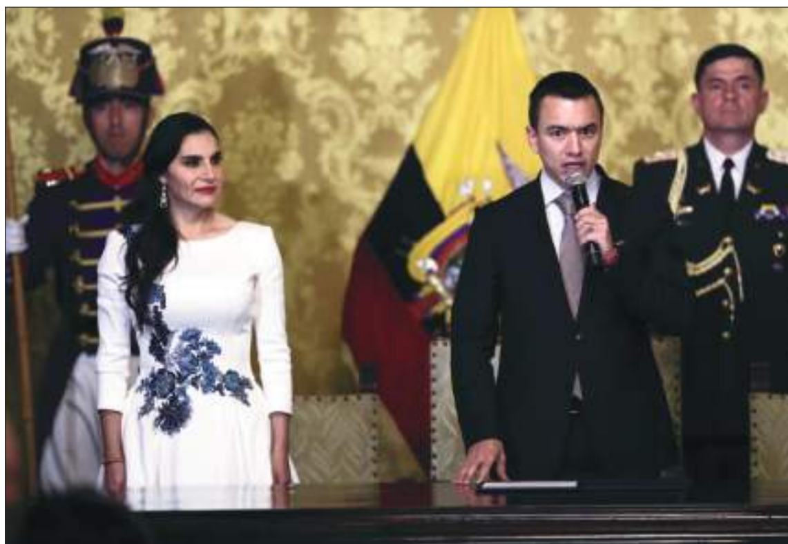
Resulta obvio que el presidente Noboa no quiere que Verónica Abad sea su reemplazo.