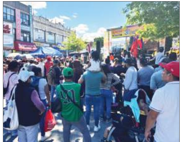
La comunidad se aglomeró para disfrutar de este Tercer Festival del Trabajador Migrante.