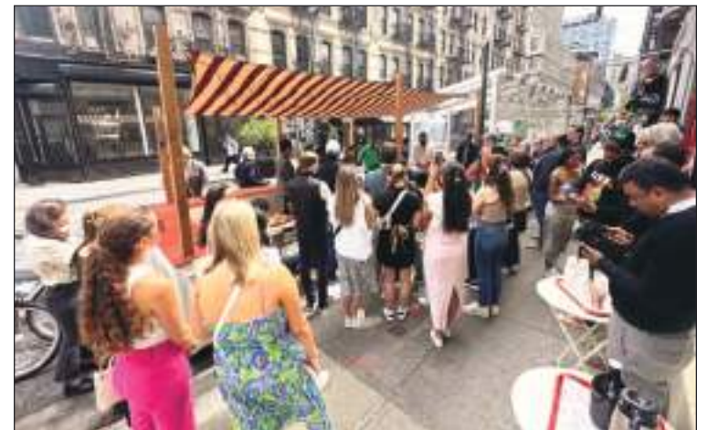
La prensa se hizo presente en el Restaurante Sunday to Sunday.

tipos y están ubicados de acuerdo al área donde están los restaurantes, podemos señalar a: