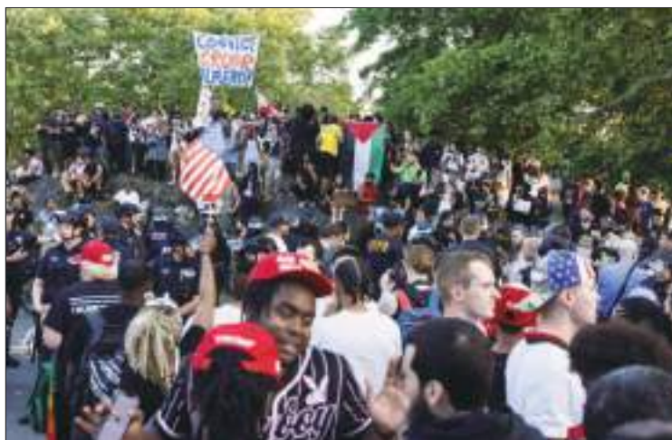
Trump aseguró que una zona demócrata como El Bronx, lo apoyará.

cuestionar las capacidades del líder demócrata, afirmó que los líderes de China, Corea del Norte y Rusia están "en la cima del mundo", es decir, el presidente actual de EE.UU. está atrás de todos los mencionados.