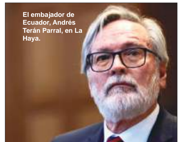
El embajador de Ecuador, Andrés Terán Parral, en La Haya.

En casos donde surjan diferencias durante la implementación de la sentencia, la CIJ puede ser solicitada para resolver disputas adicionales o aclarar aspectos. Esto asegura que el fallo se ejecute conforme a los términos dictados por el tribunal.