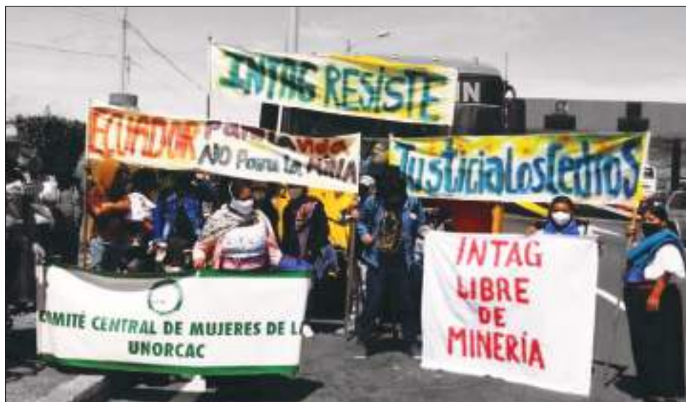
La lucha antiextractivista en Ecuador se cumple desde varios frentes.

Como investigadora, ha participado en distintos congresos tanto nacionales como internacionales y ha realizado distintas publicaciones en revistas y capítulos de libros dentro y fuera de España.