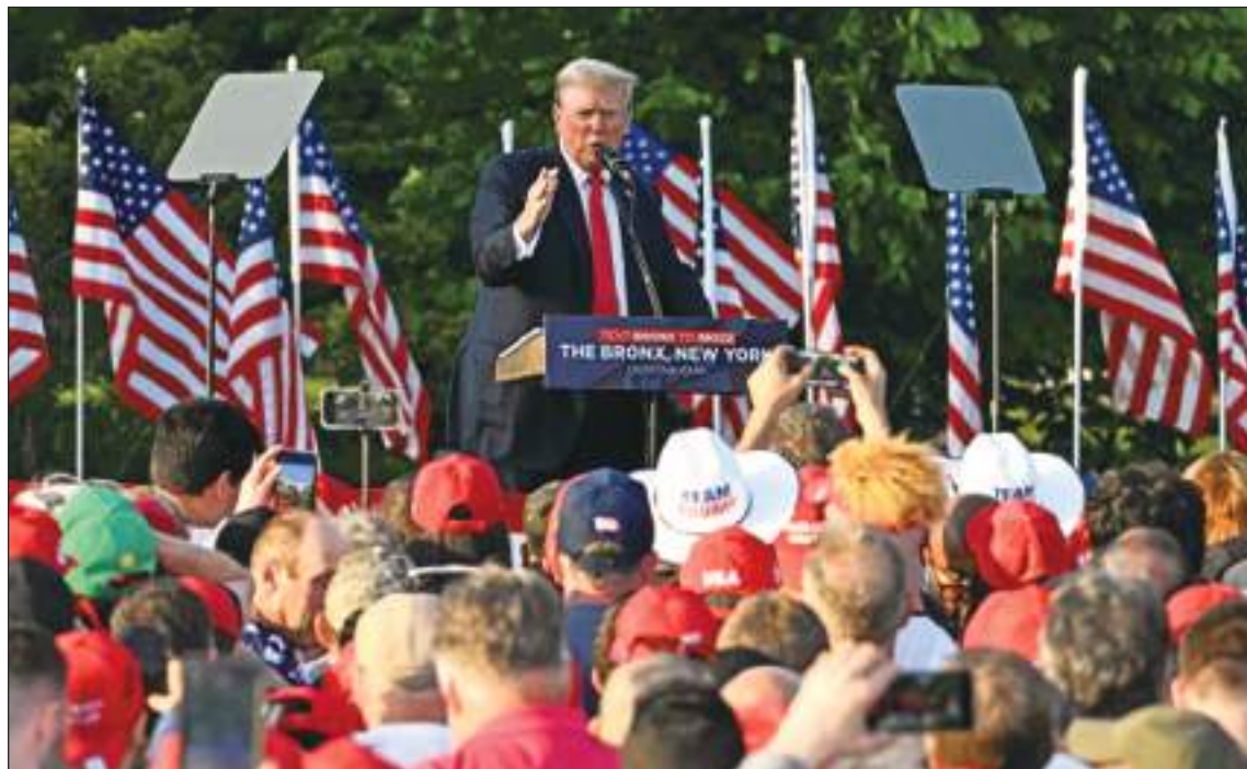
El ex presidente es un duda un cautivador, sus audiencias lo acogen con fidelidad absoluta.