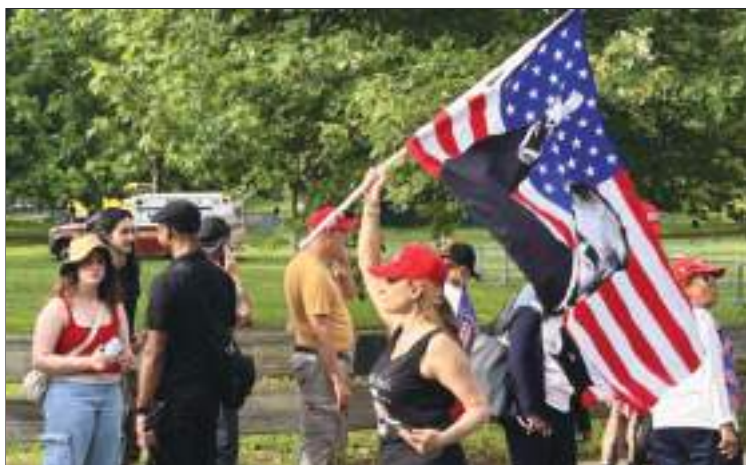
Los seguidores de Trump estuvieron, como siempre, muy activos.