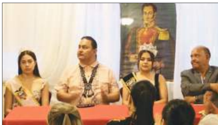
La Reina Juvenil, el Cónsul del Ecuador, la Vi Reina del Comité y el Presidente del Comité Cívico Ecuatoriano.

celebró un acto cívico por la conmemoración de la Batalla de Pichincha, este pasado 24 de Mayo, evento que se realizó en las insta-