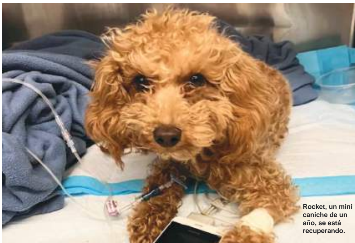
Rocket, un mini caniche de un año, se está recuperando.

punto más crítico de su recuperación", dijo la portavoz de ASPCA, Alyssa Fleck. "Se sometió a una cirugía y se encuentra bien, pero se espera que su recuperación demore aproximadamente otras