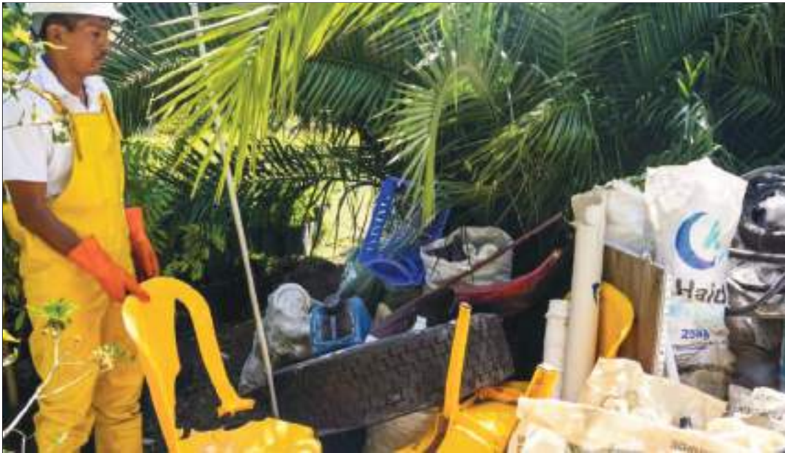
Identificar y rastrear los desechos plásticos hasta su origen es una parte clave de la misión de Azure para detener el flujo de plástico hacia los océanos y los ríos.

sistemas de limpieza de plástico para ríos.