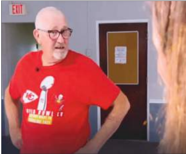
Klass comentó que a pesar de su edad, se había visto obligado a volver a trabajar debido a la carga financiera que ha significado perder su estatus.

ron”, dijo Klass. Incluso visitó el consulado canadiense en Miami con la esperanza de ayudar a aclarar las cosas, pero fue en vano.