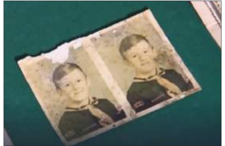
Klass fue traído a Estados Unidos cuando tenía dos años en la década de 1960, durante décadas pensó que le habían concedido la ciudadanía a través de su padre.

USCIS dijo en un comunicado al medio “News 6 Click” de Orlan-