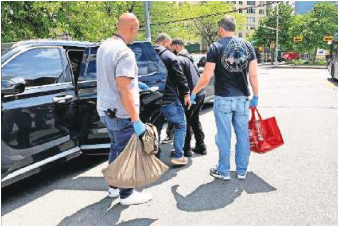
La acción estaba prevista para algunos minutos, pero se extendió por varias horas.

repentina llegada de personas realmente extrañas y “bulliciosas”, que ya se han constituido, según algunos, en un problema.