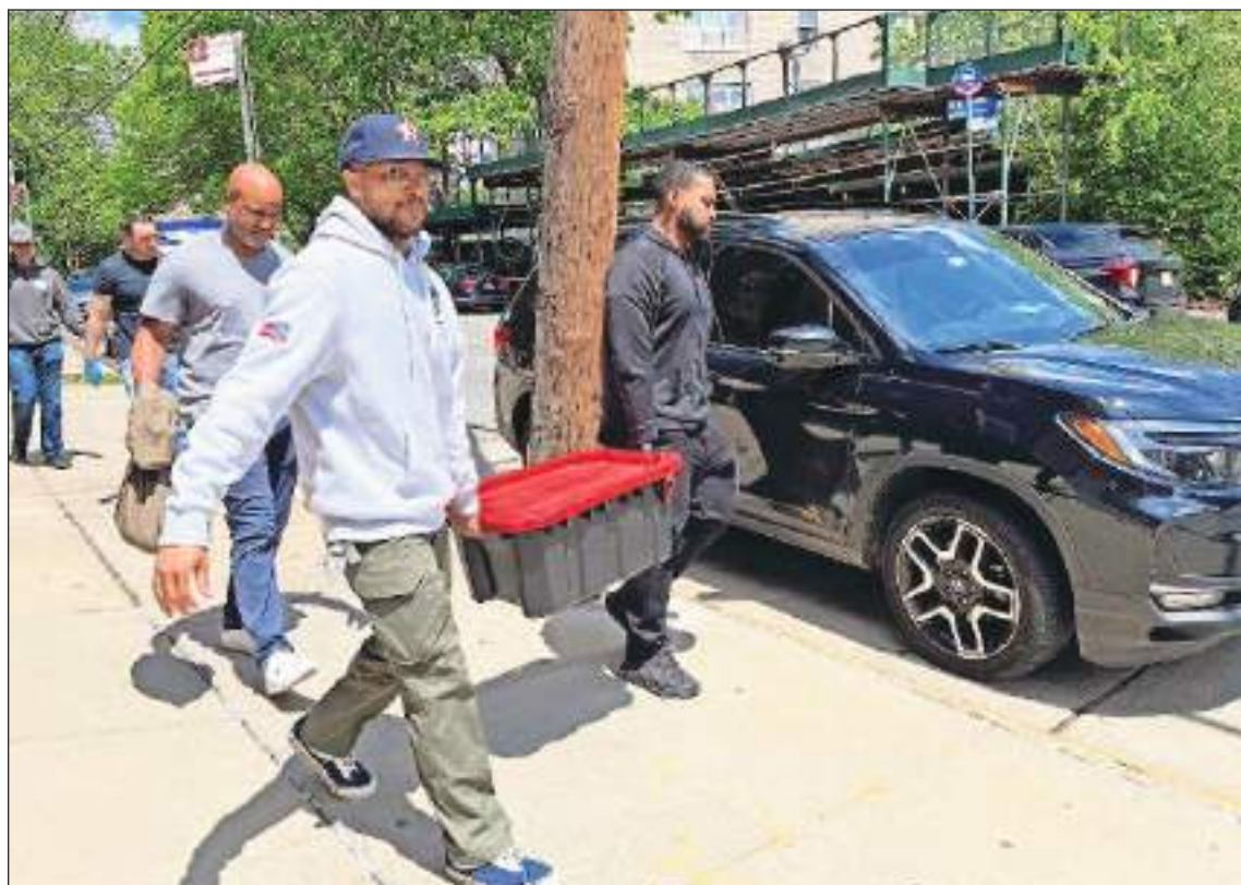
Los oficiales llegaron buscando a alguien, pero también se encontraron con otras cosas.