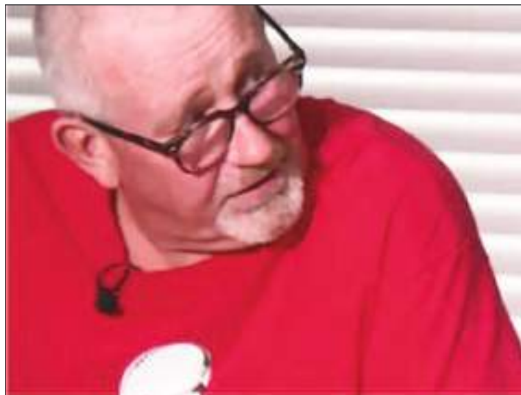
Descubrió que no era ciudadano estadounidense, a pesar de tener una tarjeta de Seguro Social y votar en las elecciones.

Un hombre que reside en el estado de la Florida, de 66 años, que presentaba documentos de jubilación, quedó sin palabras al descubrir que no es ciudadano de los Estados Unidos a pesar de haber vivido aquí desde que era un niño y haber votado en numerosas elecciones federales durante las últimas seis décadas.