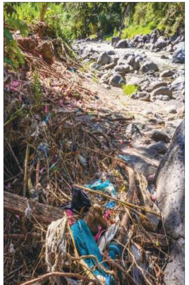
Las barreras no solo recogen plástico, sino también mucha materia vegetal invasora, un grave problema para el medio ambiente.

Y al final, llega a una opinión similar a la de Cowger: "la solución es evitar el consumo", afirma. "Eso es fundamental".