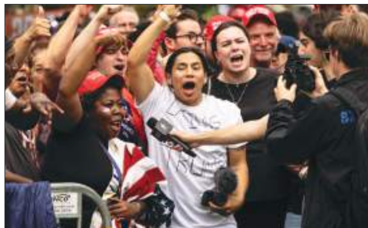
Asistieron muchos inmigrantes que apoyaron el discurso contra ellos.

Uno de los argumentos repetidos por el candidato -y por sus invitados- fue que los allí reunidos no eran "negros, marrones ni blancos", sino estadounidenses, y que votaban como tales. Palabras que eran respondidas con gritos de ¡¡U-S-A, U-S-A!!! Y el candidato concluyó, con su voz ahogada por los vítores, cambiando su lema a "Make Our City Great Again" (hagamos nuestra ciudad grande de nuevo). Recordó que vayan a votar a los "patriotas que trabajan duro como ustedes y que van a salvar nuestro país. Nuestro voto va a ser demasiado amplio como para ser manipulado".