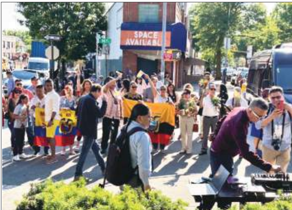
La comunidad ecuatoriana se dio cita a la Plaza Eloy Alfaro para celebrar el 24 de Mayo.