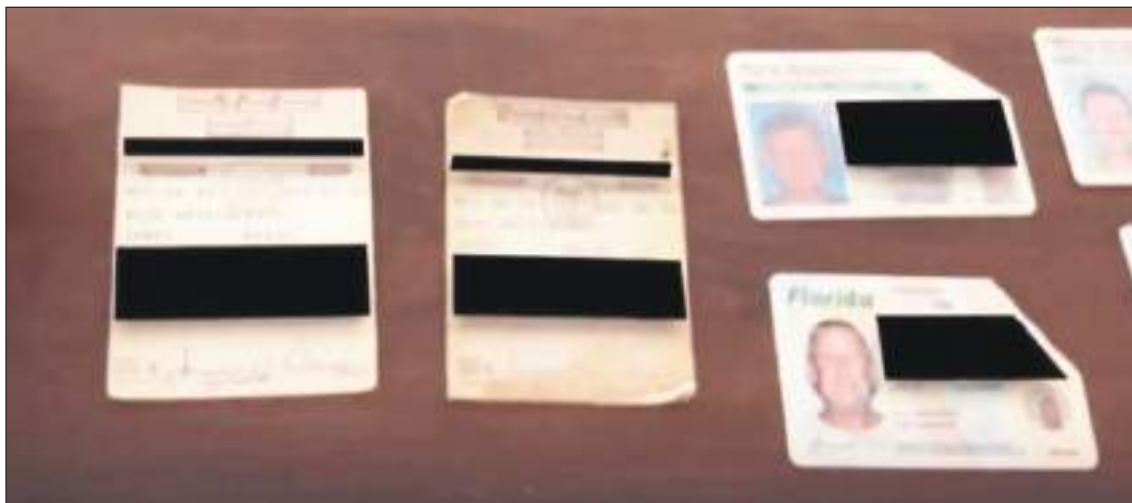
Klass tiene múltiples formas de identificación que lo llevaron a creer toda su vida que era ciudadano estadounidense.

A Klass ahora no le ha quedado más remedio que defenderse ante los Servicios de Inmigración y Ciudadanía de Estados Unidos (USCIS) para solucionar el problema, enviando a la agencia múltiples documentos que demuestran que ha estado viviendo en Estados Unidos durante más de 60 años como ciudadano de pleno derecho. "Envié todas esas cosas al USCIS y todavía me lo nega-