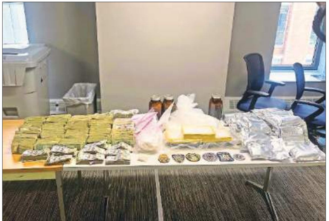
Dinero en efectivo, sustancias controladas, insignias policiales... Parte de lo encontrado en el allanamiento