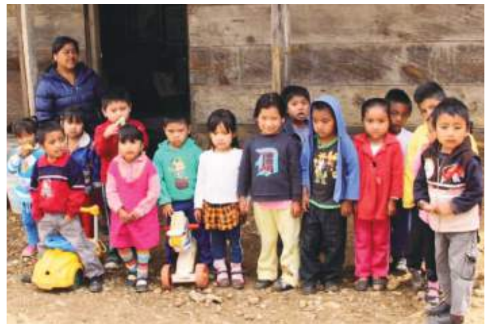
La desnutrición infantil en Ecuador preocupa a la Unicef, lo dice su director global.

Aguayo concluyó que atajar la malnutrición en todas sus variantes “tiene que ser una prioridad que trascienda colores o ideales políticos” porque “el desarrollo de la infancia es el desarrollo del país”.