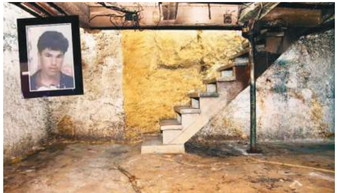
El sótano donde se mantuvo a Omar Bin Omran durante 17 años, al parecer por un problema familiar.