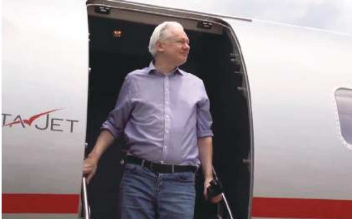
Julian Assange arriba a Bangkok luego de pactar un acuerdo de culpabilidad con Estados Unidos.

Assange fue acusado en 2019 de 18 cargos de espionaje, que conllevaban una pena máxima de 170 años de prisión. Durante mucho