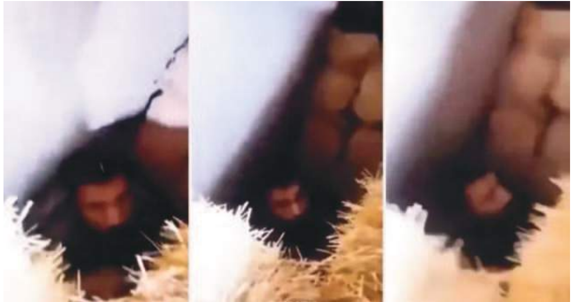
Uno de los componentes del equipo de rescate pudo tomar esta única foto de donde estaba el individuo.

La verdad salió a la luz debido a una disputa familiar no relacionada con la familia del desaparecido. El hermano del secuestrador, envuelto en una disputa por la herencia familiar con él, decidió