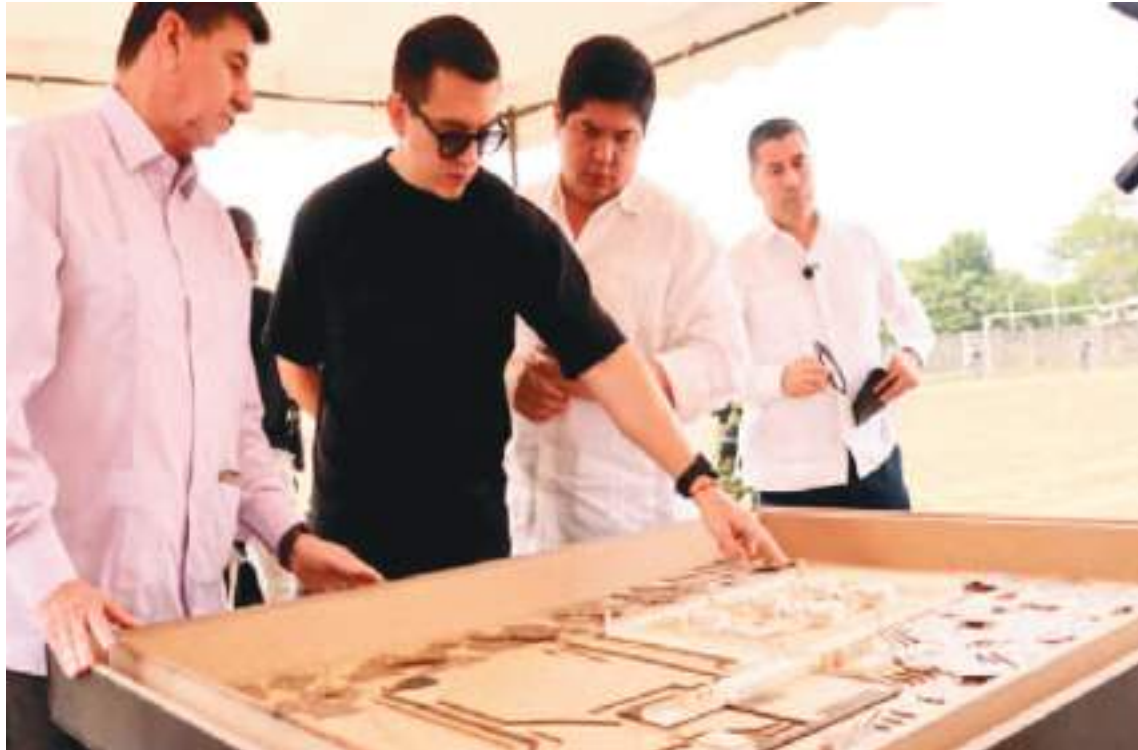
El presidente Daniel Noboa ya ha enseñado las maquetas de lo que será la "mega-cárcel" ecuatoriana.

Las instalaciones de la que ha sido bautizada como 'Cárcel del Encuentro', a las que se han desti-