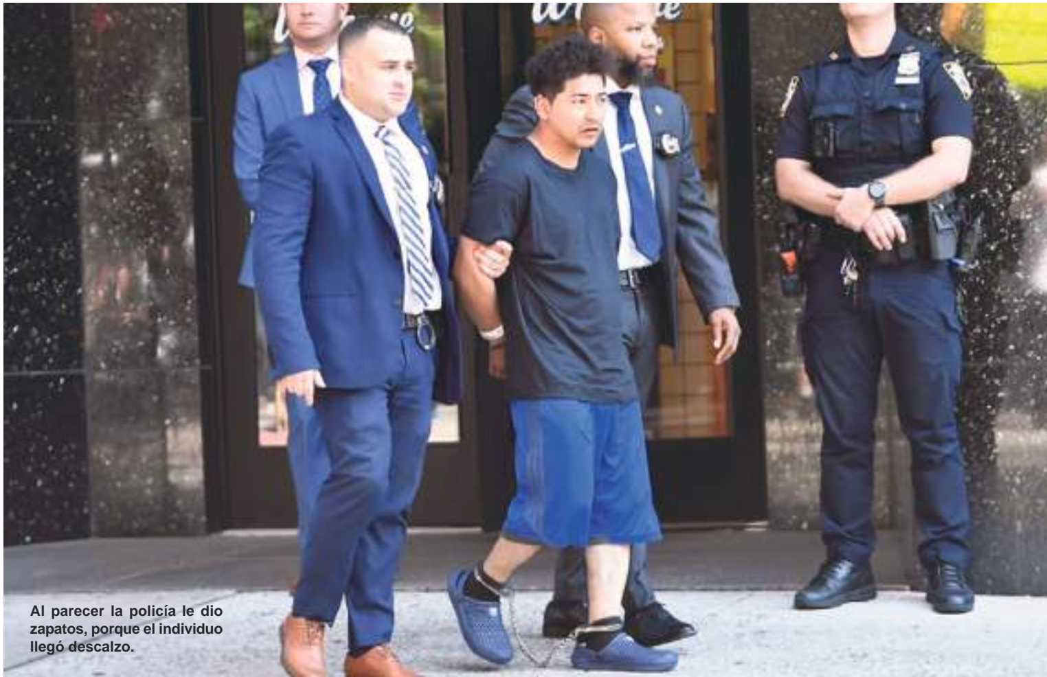
Al parecer la policía le dio zapatos, porque el individuo llegó descalzo.

liberado por agentes de la Patrulla Fronteriza. Inga-Landi dijo a los funcionarios que iba a vivir en un apartamento en Flushing, Nueva York.