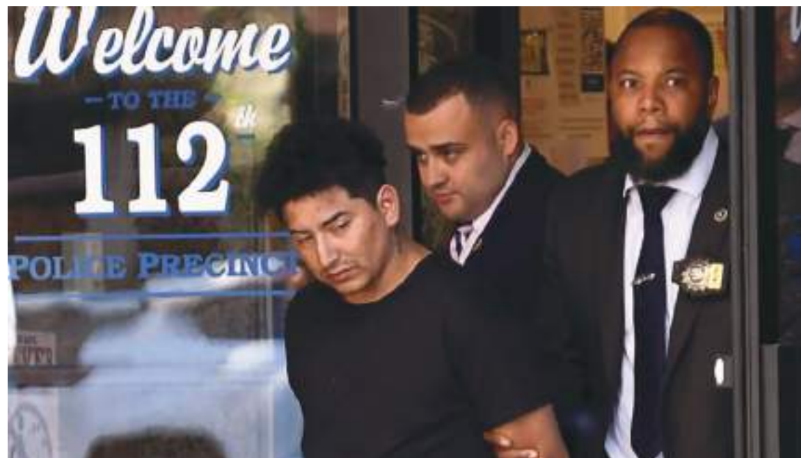
Oficiales del Precinto 112 de NY fueron los encargados de arrestarlo para que no siga delinquiendo.

Igualmente, cruzó la difícil frontera entre Estados Unidos y México el 25 de junio de 2021 con su hijo hacia Eagle Pass, Texas, donde fue capturado, procesado y