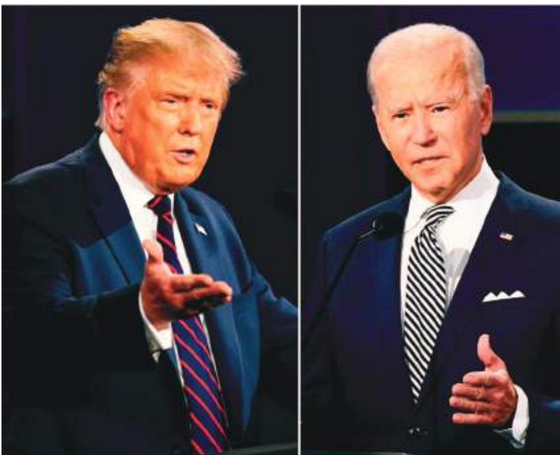
Donald Trump, izquierda, y Joe Biden, de nuevo están usando el tema migratorio para ganar votantes.

"Donald Trump está haciendo que los estadounidenses estén menos seguros al bloquear el acuer-