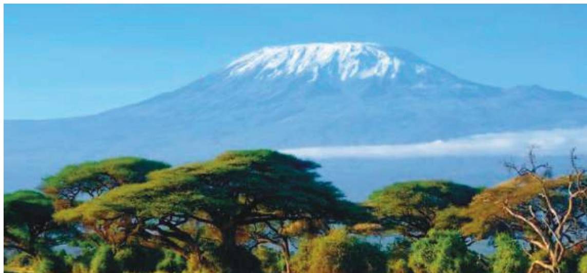
Punto culminante de África, el monte Kilimanjaro (República Unida de Tanzania) es uno de los mayores volcanes del mundo. Sus glaciares y sus nieves eternas son particularmente vulnerables al cambio climático.

Asimismo, en el caso de los Ilinizas el deshielo ha sido notorio. Todos los informes técnicos de los últimos años han servido para investigaciones académicas y que han planteado soluciones a los problemas ambientales del país.