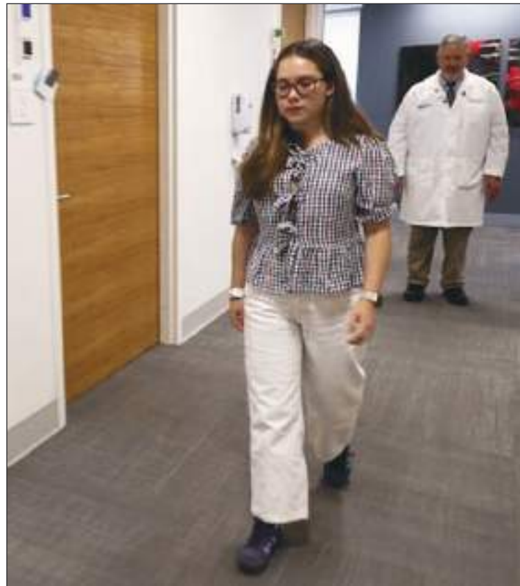
La ecuatoriana en sus primeros días de tratamiento.