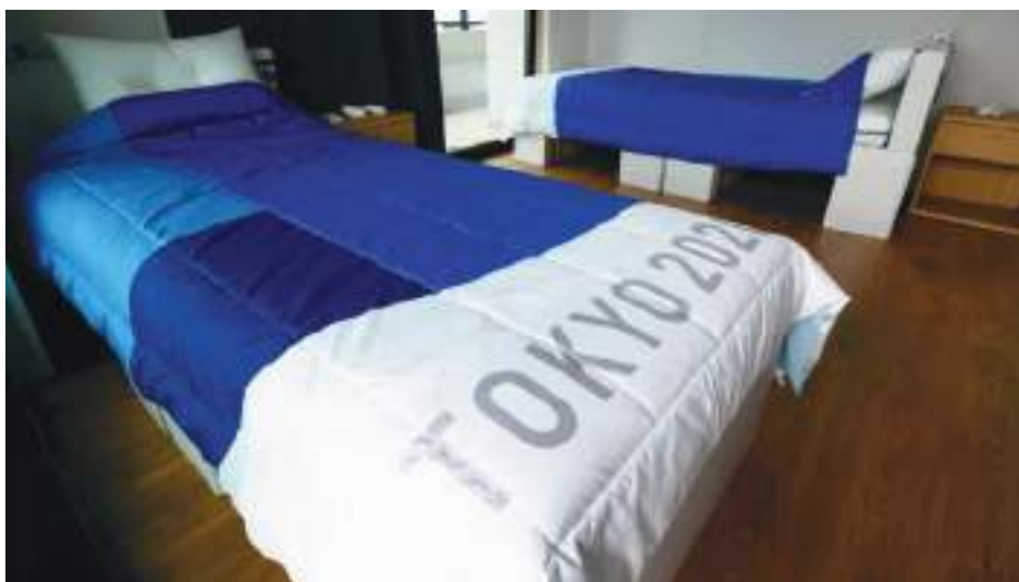
Las camas hicieron su estreno oficial y exitoso en los Juegos de Tokyo hace 4 años.