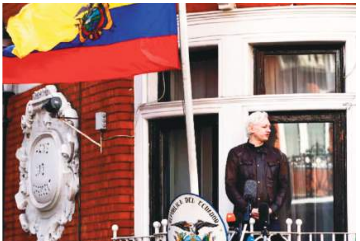
Assange permaneció largo tiempo en la embajada de Ecuador en Londres.

"Será un hombre libre una vez que haya sido aprobado por un juez y eso sucederá mañana".