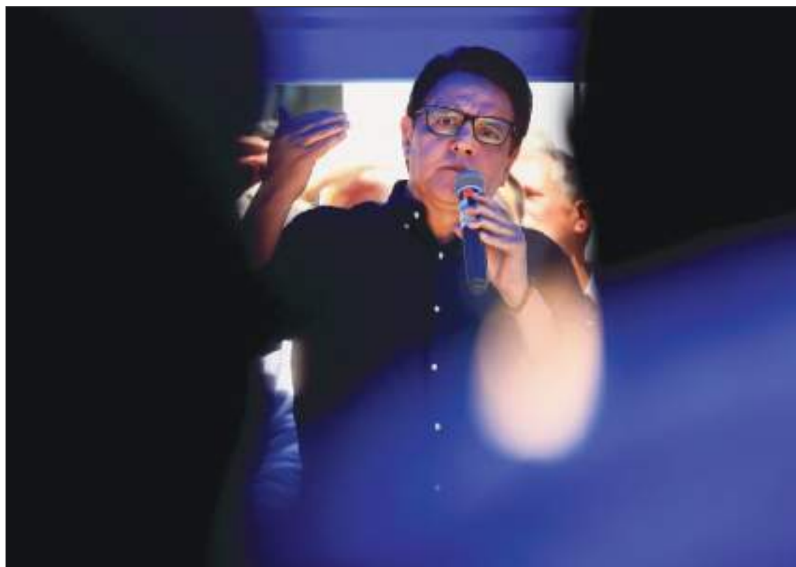
Villavicencio no sólo era un buen periodista sino que se destacaba también como político.

Posteriormente fueron arrestados siete sospechosos más, uno de los