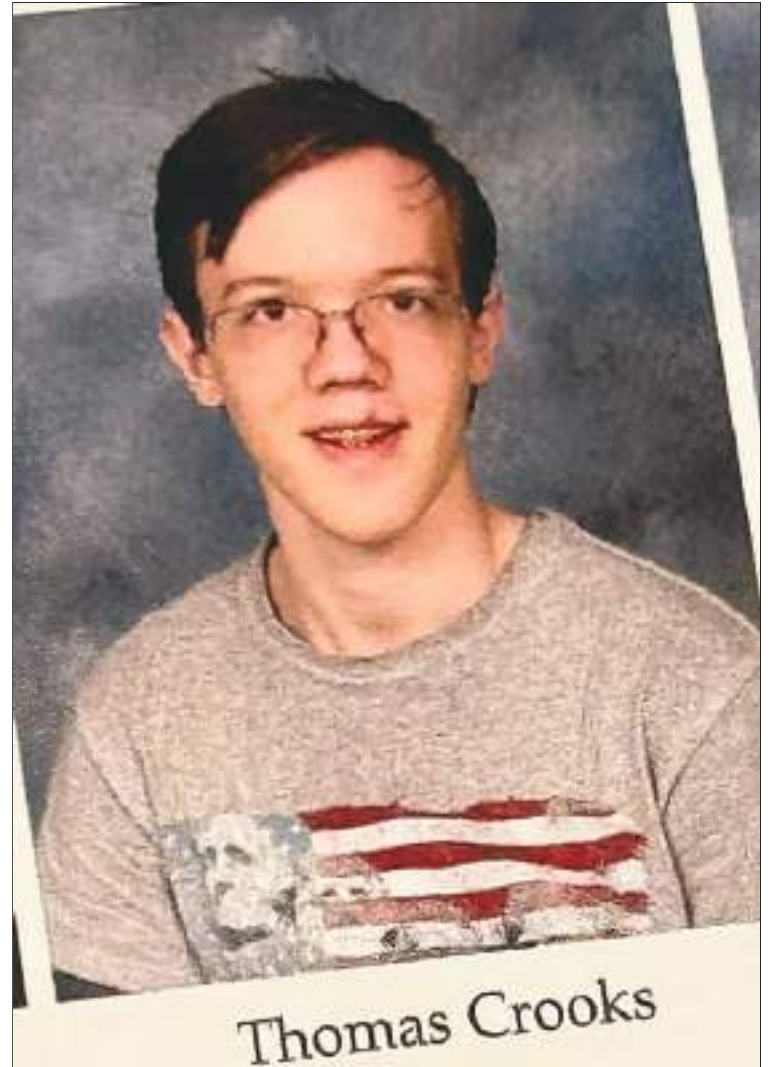
Thomas Matthew Crooks había sido un estudiante relativamente bueno. En apariencia fue seguidor de Trump porque hizo donaciones al partido republicano. Pero muchos expertos están intrigados por su precisión en el disparo, porque no tenía ni entrenamiento militar ni experiencia. Por eso la tesis de que actuó solo no debe abandonarse.

El portavoz Steven Cheung dijo a los pocos minutos que Trump está "bien" y que seguía siendo examinado en un centro médico local, mientras que el hijo mayor del expresidente, Donald Trump Jr, dijo que su padre "está de muy buen humor".