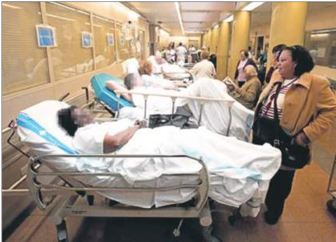
En las salas de urgencia se podría agilizar los procesos.

publicado en 'The Lancet Digital Health', dijo que los hallazgos muestran que la herramienta "puede alcanzar altos niveles de precisión en la predicción de las trayectorias de salud de los pacientes, demostrando que podría ser una herramienta valiosa para ayudar en la toma de decisiones e informar la investigación clínica".