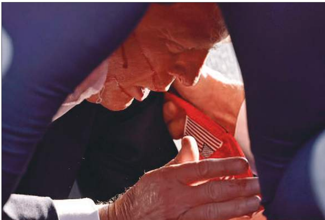
En el suelo, Trump se dio cuenta seguramente que había sido herido.

no tenía antecedentes penales y los funcionarios afirmaron que todavía están trabajando para identificar el motivo detrás del tiroteo.