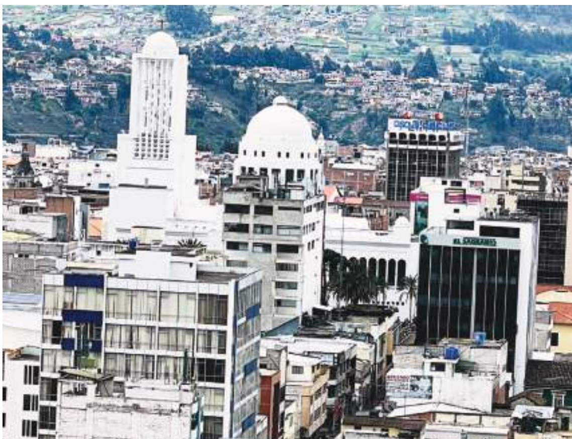
Tungurahueses conmemorarán a su ciudad en Agosto el Mes de la Herencia Ecuatoriana, en primera plana observar a la imponente catedral de Ambato