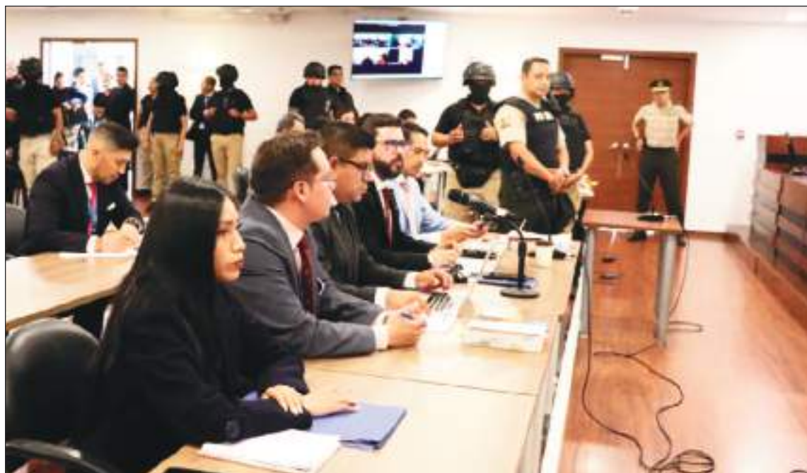
Instalación de audiencia de juicio a procesados en el caso del asesinato de Fernando Villavicencio.

Cuatro de los cinco sentenciados por el asesinato de Fernando Villavicencio hablaron en el último día del juicio. Todos se declararon inocentes y se acogieron al silencio para no responder las preguntas de la Fiscalía. Pese a los alegatos de los abogados defensores que remarcaron supuestos errores en la cadena de custodia del celular de alias Ito, quien disparó contra Villavicencio y luego murió abatido, el tribunal dictó sentencia para los cinco vinculados de