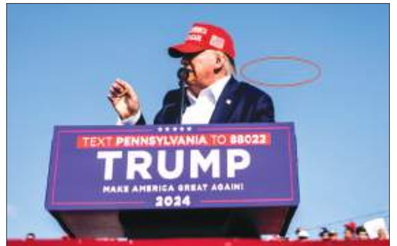
Una oportuna foto muestra el paso de la bala tras impactar a Trump.

Recién completamos una nueva encuesta realizada el 24 de junio y