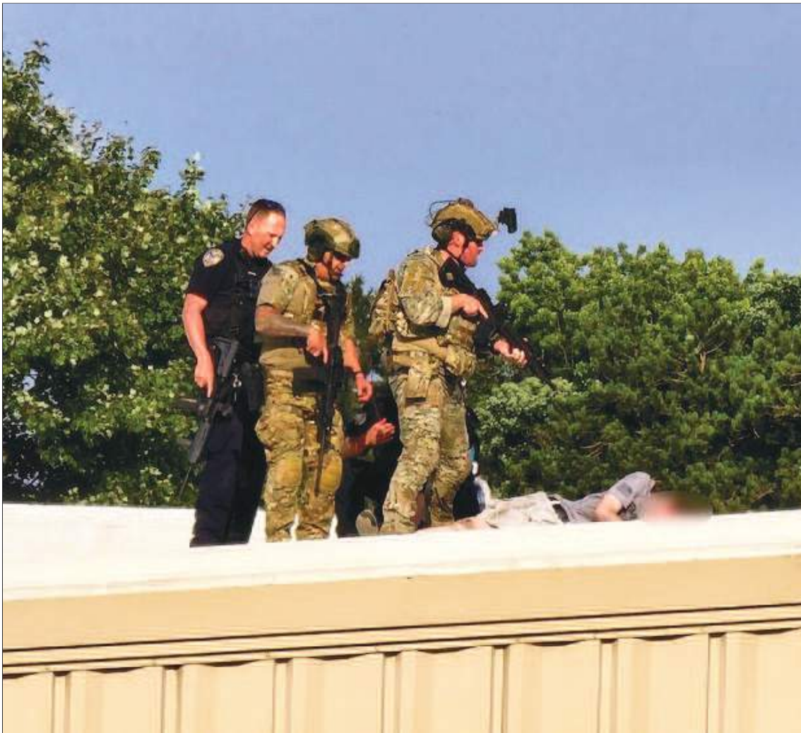
Presunto tirador de Trump es visto tendido inmóvil en un tejado cercano.

guardia frente a una cinta amarilla de precaución policial.