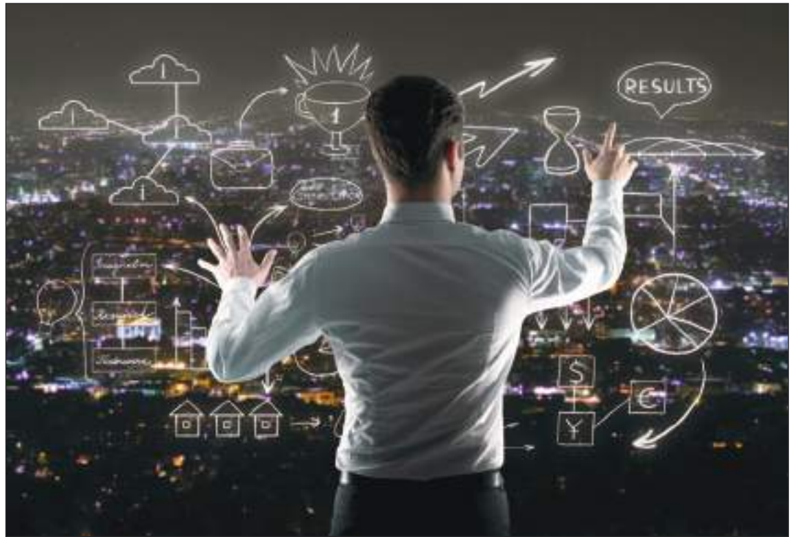
'Foresight' es la plataforma que según sus creadores será "milagrosa".

Los investigadores dijeron que la tecnología podría usarse para ayudar a los médicos a la hora de monitorear a los pacientes o tomar decisiones sobre el diagnóstico.