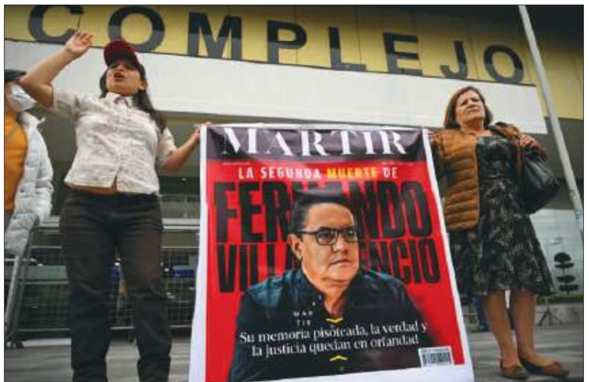
Seguidores del periodista siempre se ha mantenido firmes exigiendo justicia.