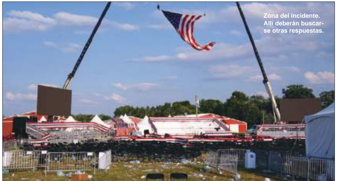
Zona del incidente. Allí deberán buscarse otras respuestas.

"Hemos cruzado el umbral y ahora es posible que tengamos un ciclo en espiral de violencia política, porque estamos entrando en esta temporada electoral altamente volátil", advierte Pape en una entrevista con BBC Mundo.