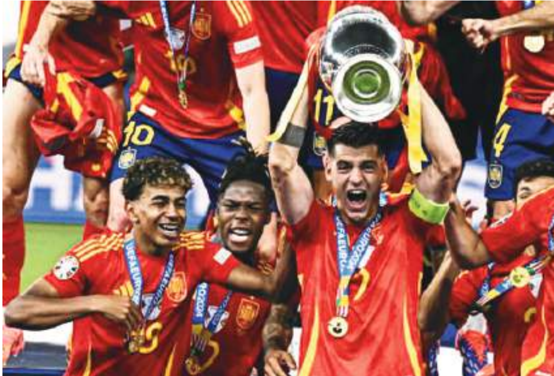
El capitán español Alvaro Morata alza el trofeo que acredita a su país como campeón de la Eurocopa 2024. A su lado los dos niños prodigios del cuadro: Nicolás Williams y Lamine Yamal.

lace para los anfitriones del torneo, Julian Nagelsmann le ha cambiado la cara a Alemania y ya avisó tras la derrota contra España: van a por el Mundial-2026.