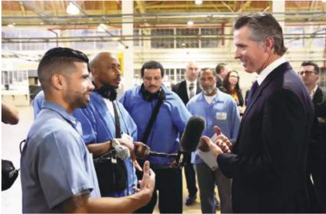
El gobernador de California Gavin Newsom visitando San Quintín.

persona condenada y recomienda dónde trasladarlos según factores individuales del caso.