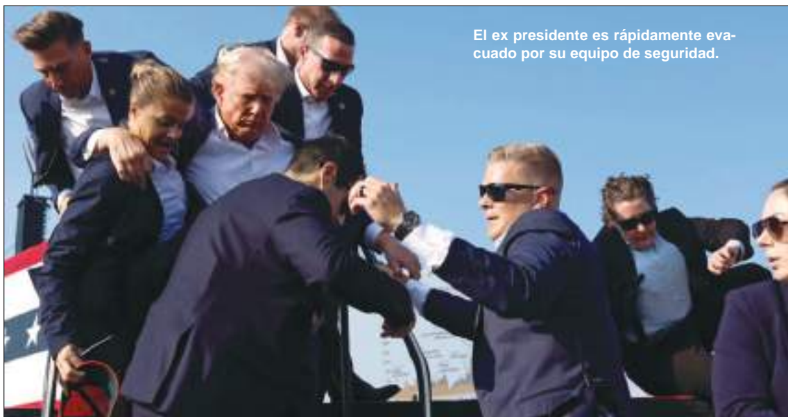
El ex presidente es rápidamente evacuado por su equipo de seguridad.

Estaban empezando a actuar. Normalmente se empieza por un círculo y luego se pasa a otros. Todo se estaba