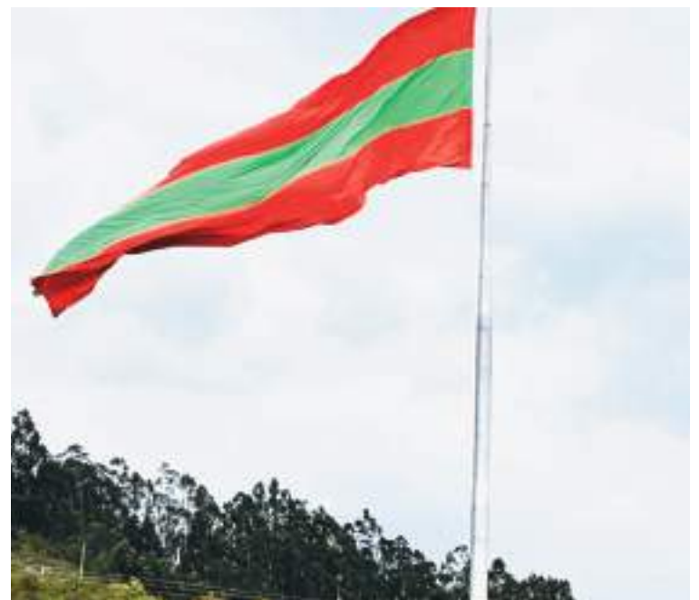
La bandera que representa a Tungurahua, el rojo verde rojo se hará presente en los Plainfields. Nueva Jersey.