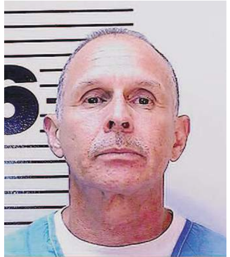
Manuel Bracamontes, condenado por el secuestro, violación y asesinato.

California han estado alojadas durante mucho tiempo en la Instalación de Mujeres de Central California, al norte de Fresno. Todas permanecen en la institución pero ahora están alojadas entre la población general.