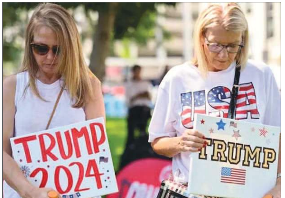
Seguidoras del ex presidenta candidato apesadumbradas por lo sucedido.

Lo que podemos decir es que estamos atravesando una zona roja muy peligrosa. Y como estamos atravesando una zona roja, tenemos que tomar esas medidas de precaución y no dar por sentado que todo irá bien.