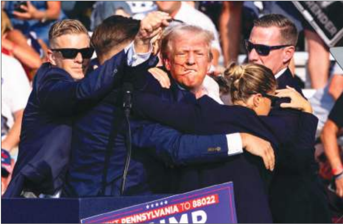
Se han hecho muchos esfuerzos por encontrar a la joven, pero todo ha resultado infructuoso.