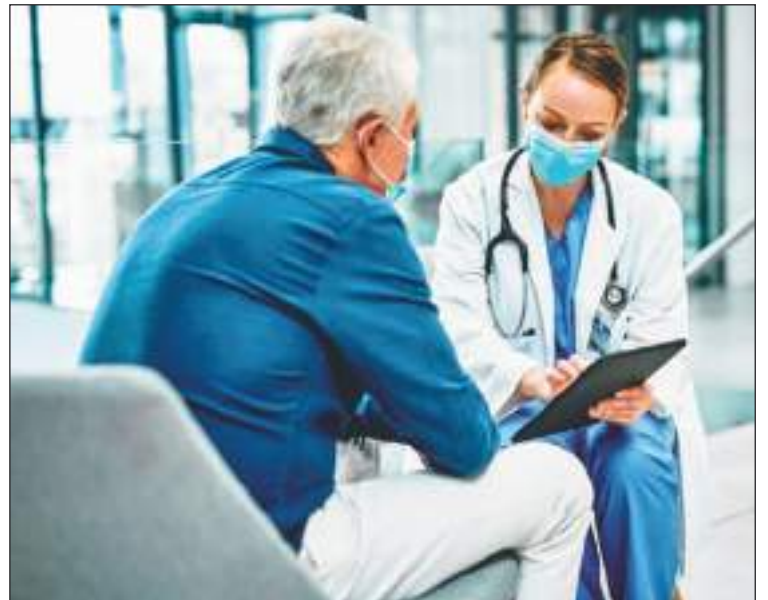
Los médicos de hoy quieren tener más argumentos para el acierto de sus diagnósticos. Aumentará la confianza de los pacientes en todas partes.