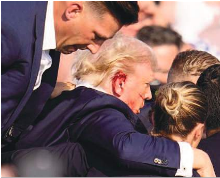
La herida de Trump se aprecia con claridad.

organizando cuando se desarrollaron los acontecimientos de forma tan brusca y rápida que fue difícil dar a conocer nuestra encuesta.