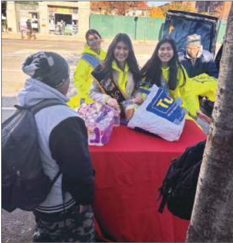
En el Día de Acción de Gracias, la Reina y su comitiva entregaron refrigerios y chompas a las personas en busca de empleo.

• Realmente no estoy preparada, este año se me ha ido volando, ha sido un abrir y cerrar de ojos, pero me he venido preparando junto con las chicas que están de