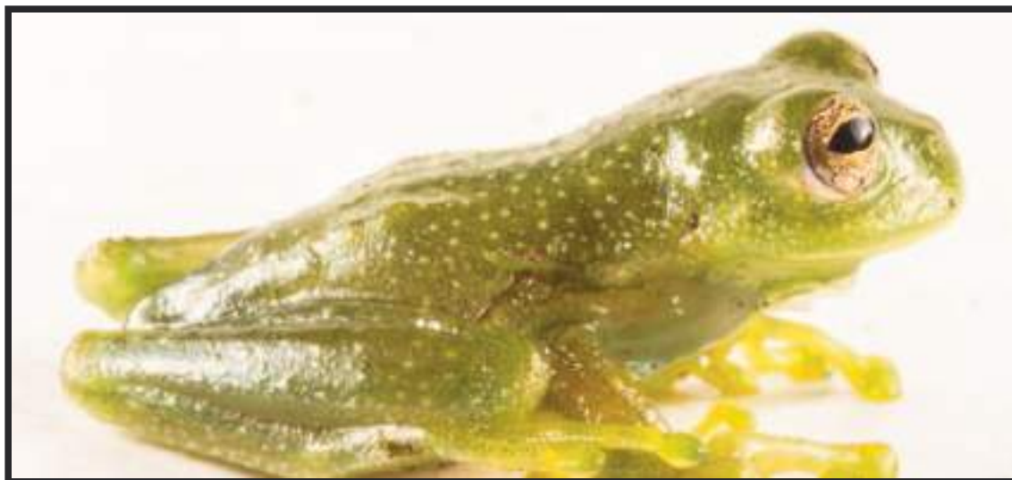
Fotografía cedida por la Universidad Pontificia Católica del Ecuador de la especie de rana de cristal.

El Inabio advirtió que "lastimosamente, las concesiones mineras amenazan a esta nueva especie y la localidad donde fue encontrada no se encuentra en zona protegida".