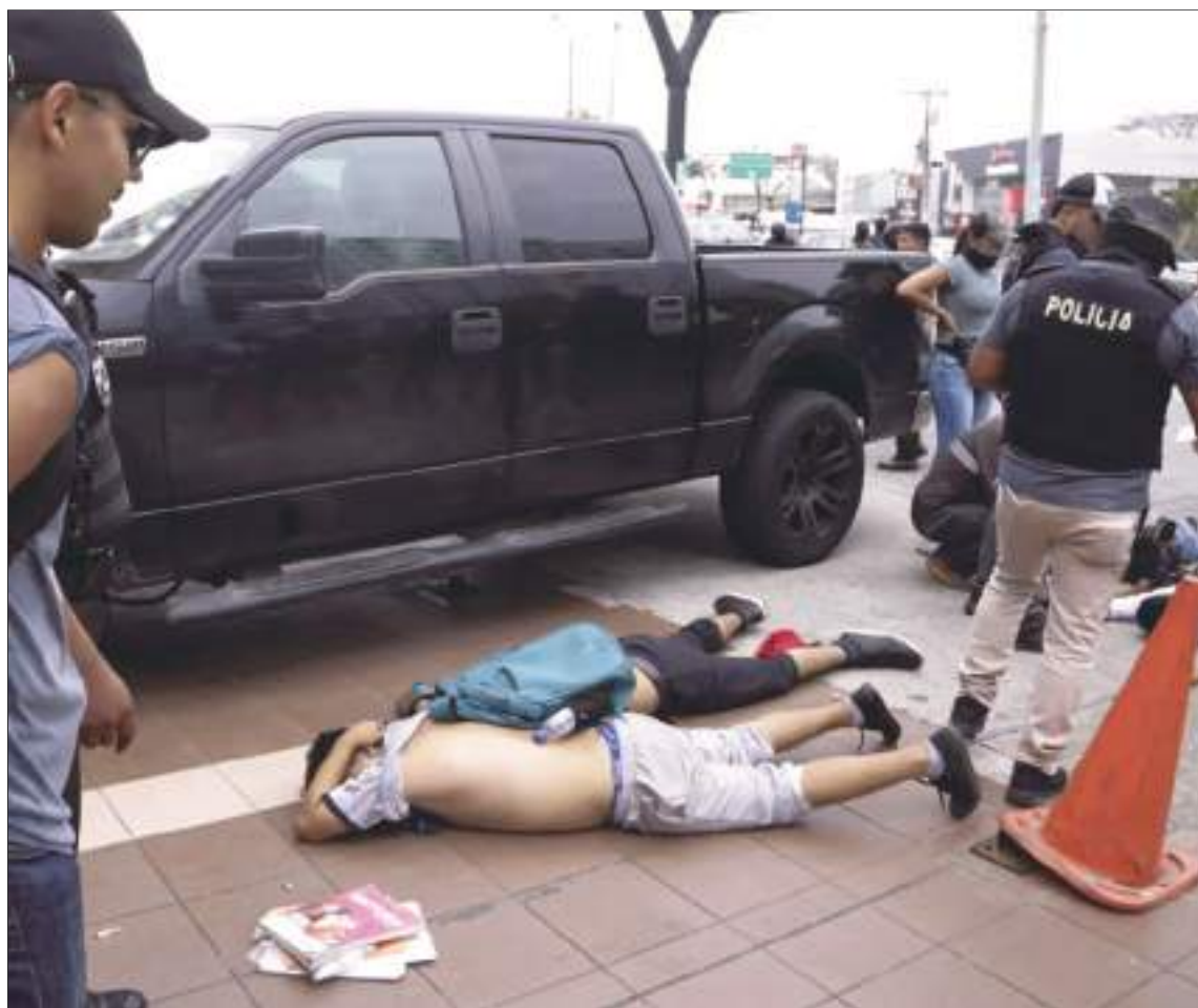
Varios hombres tumbados boca abajo en el suelo, detenidos por la policía frente a TC Televisión, después de que un productor dijera a la policía que formaban parte de un grupo que irrumpió en su plató durante una emisión en directo, aunque no habían entrado en la emisora, en Guayaquil, Ecuador.

9 de enero y pensó, por un momento, en reportar que estaba enferma. Pero decidió entrar como todos los días en la madrugada para los informativos de la mañana y las coberturas en los barrios. Las calles de Guayaquil estaban calientes por esos días y todos intentaban trabajar con normalidad. “Ya estaba por salir cuando vi cómo los delincuentes entraron apuntando con armas”, relata la mujer.