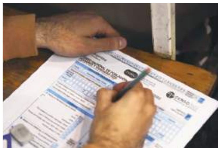
Los censos son una herramienta importante.

Pero eso no significa que los demógrafos estén sacando números de la nada cuando se trata de esti-