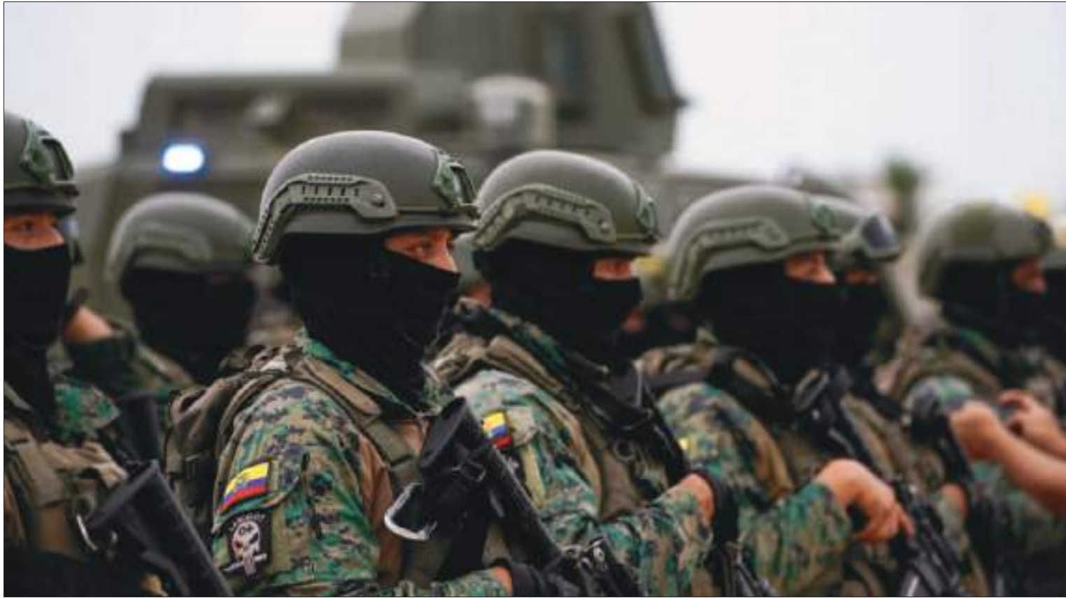
Soldados en posición durante un discurso del presidente de Ecuador, Daniel Noboa. Los militares deben estar atentos permanentemente.

administrativo. Mientras en las calles, las bandas delincuenciales explotaban coches bomba y mataban sin discriminación alguna.