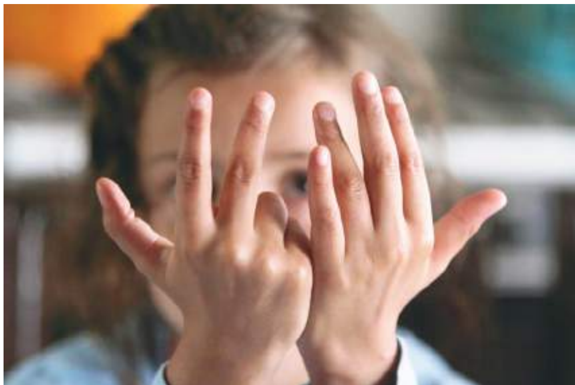
A nivel mundial, las personas nacidas hoy vivirán una media de 73,3 años.

"No tenemos una bola de cristal", subraya la doctora Toshiko Kaneda, experta en pronósticos demográficos de la organización