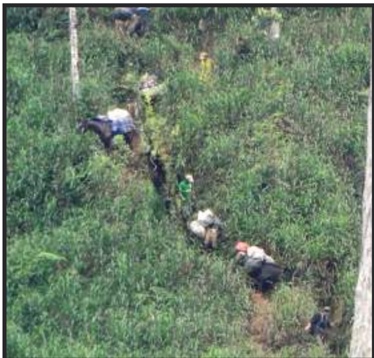
Exploradores cumpliendo con su labor.

Esto ofrece nueva información sobre su morfología, historia natural y riesgo de extinción. Asimismo, evalúa la presencia de la rana de cristal de Mueller (centrolene muelleri) en Ecuador, previamente conocida solo para Perú, concluyó el Inabio en su comunicado.