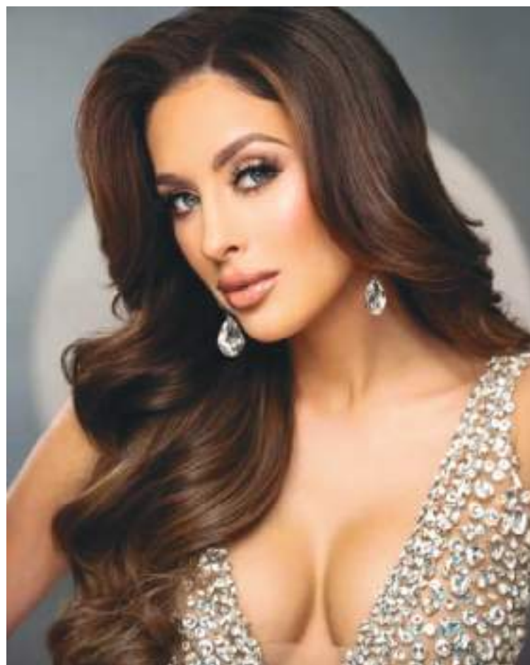
Los atributos de la boricua saltan a la vista.