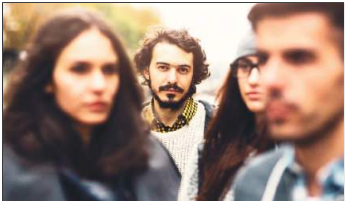
Cada vez los jóvenes encuentran menos oportunidades.

El Instituto de Medición y Evaluación de la Salud (IHME, por sus siglas en inglés) de la Universidad de Washington y el Centro IIASA-Wittgenstein de Viena son los otros dos organismos principales que realizan proyecciones de población mundial.