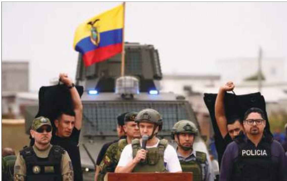
El presidente Daniel Noboa, pronuncia un discurso custodiado por agentes de seguridad, en el barrio La Delia de Durán, una de las ciudades más afectadas por la violencia relacionada con el narcotráfico, en las afueras de Guayaquil. Apparently el crimen ha decrecido, pero aún son muchas las acciones delictivas.