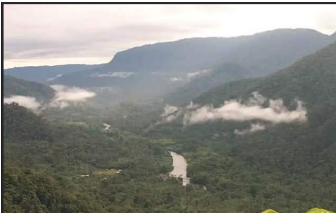
Cordillera del Kutukú, un pedazo ecuatoriano de mucha riqueza biológica.