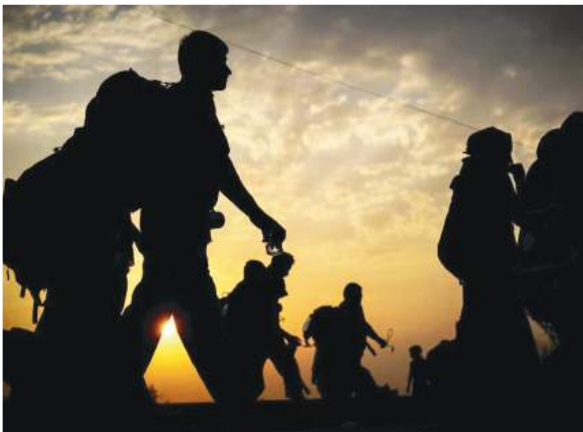
La constante migración influye en el crecimiento demográfico.

El estudio Perspectivas de la Población Mundial 2024 dice que "una de cada cuatro personas en todo el mundo vive en un país cuya población ya ha alcanzado su punto