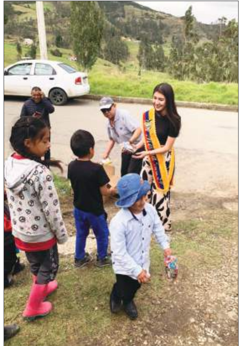
La Reina entregó juguetes, caramelos y comida en las áreas más vulnerables de Cuenca.

el tiempo a todas las puertas que se les abren aquí, de buena manera, que demuestren que son capaces hasta donde pueden llegar, así no estén cerca de sus familiares, y aunque estén lejos de su país donde nacieron y crecieron, lo que son y de dónde vienen, eso es lo más importante.