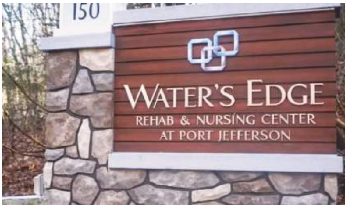
Centro de rehabilitación al que han acusado de posible negligencia.