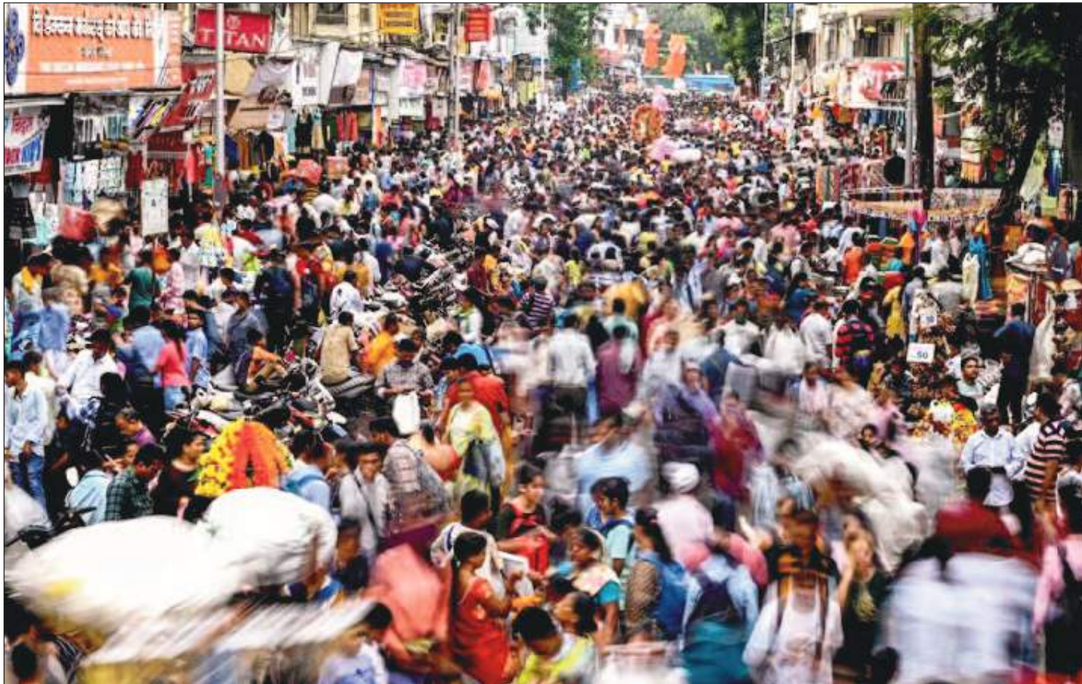
La súper población de muchos lugares es un impedimento para el desarrollo.

máximo". Sin embargo, 126 países y áreas verán crecer su población durante otras tres décadas, y estos incluyen a algunos de las naciones más pobladas del mundo, como India, Indonesia, Nigeria, Pakistán y Estados Unidos.