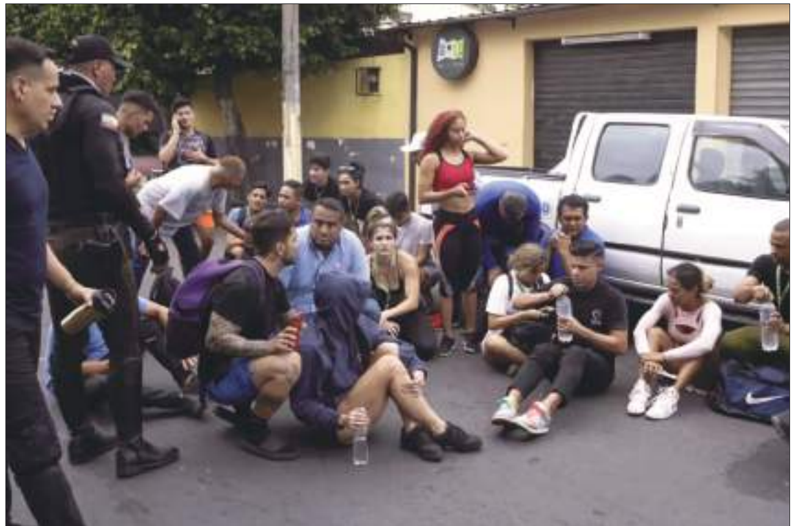
Miembros del personal se sientan en una calle después de que fueran evacuados de la estación del canal de televisión TC después de que un grupo de hombres armados irrumpiera en su set durante una transmisión en vivo, en Guayaquil. Una oportuna foto muestra el paso de la bala tras impactar a Trump.

El presidente Daniel Noboa anunció que el plan de seguridad entra en una nueva fase en la guerra que libra contra el crimen organizado, en la que todavía las estructuras delincuenciales tienen el control de algunas ciudades, y cabecillas, como alias ‘Fito’, aún no han sido capturados.