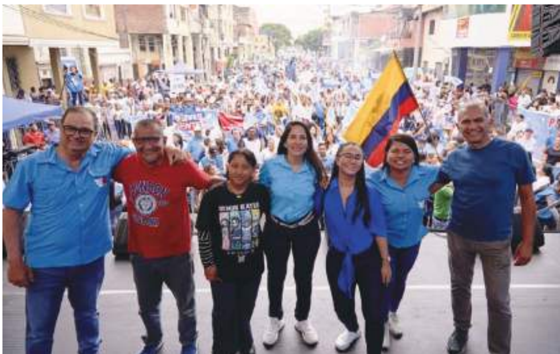
Luisa González y su equipo, esperar mejorar su caudal electoral en las próximas elecciones.

Noboa y su partido, Acción Democrática Nacional (ADN).