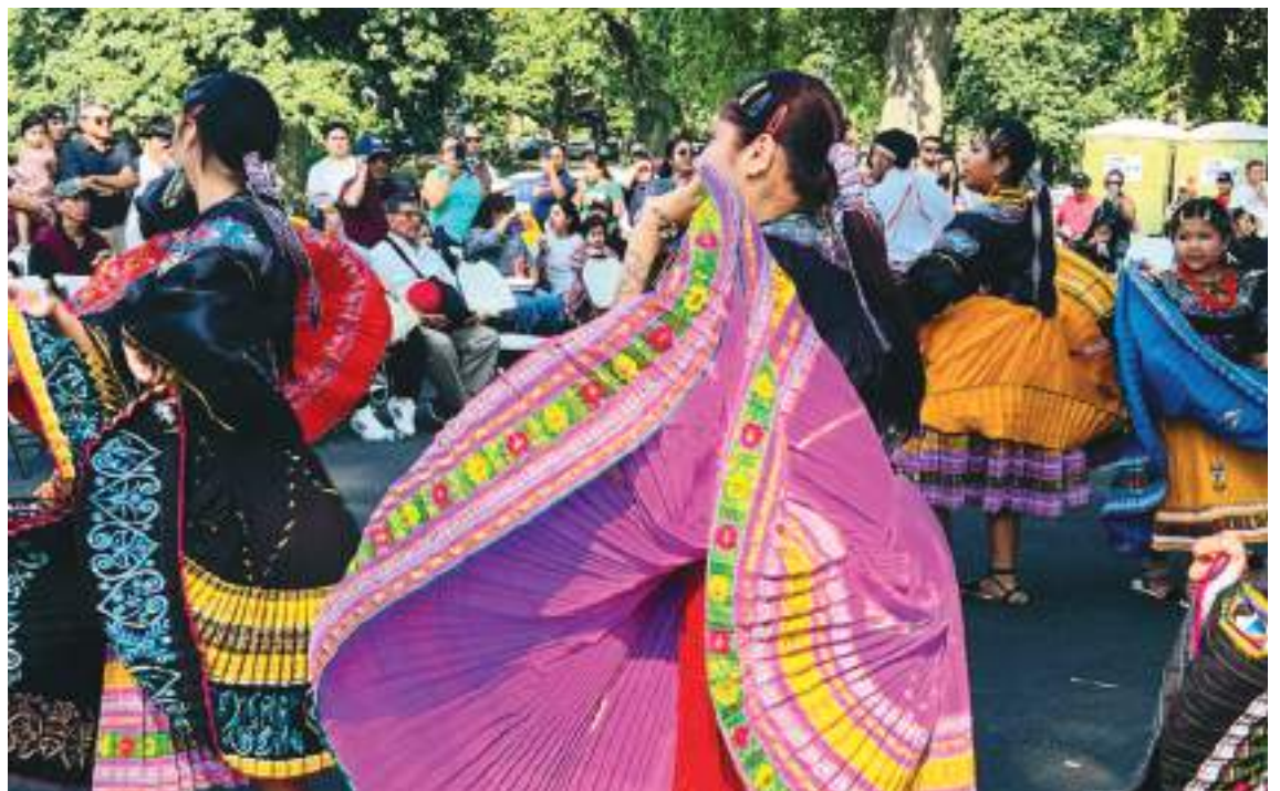
En la 49 Edición del Desfile Estatal de New Jersey, nuestro Ecuador será el anfitrión encabezando el Desfile con carro alegórico y danzas de nuestro país.