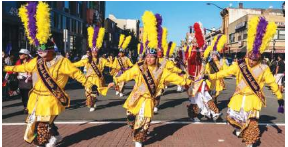
La identidad cultural peruana a través de la danza es loable y perdurable celebrando el "Mes de la Hispanidad".