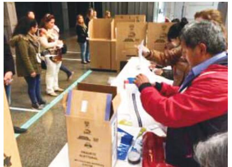
Se trabaja fuerte para que llegue el día de elecciones sin problemas.

Las fórmulas vicepresidenciales develadas ya generan algunos indicios de la forma en que se ajustará la campaña. María José Pinto, que acompaña al actual presidente, trata de mostrar un rostro humano y preocupado por problemas sensibles a la propuesta electoral de