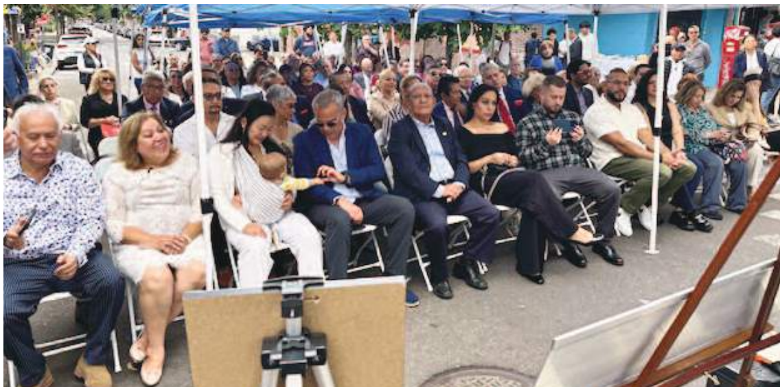
Amigos y familiares se hicieron presentes en este magno evento.

Arboleda quedó plasmado en las calles de New York.