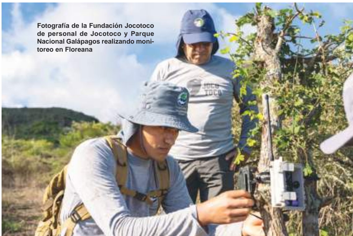
Fotografía de la Fundación Jocotoco de personal de Jocotoco y Parque Nacional Galápagos realizando monitoreo en Floreana