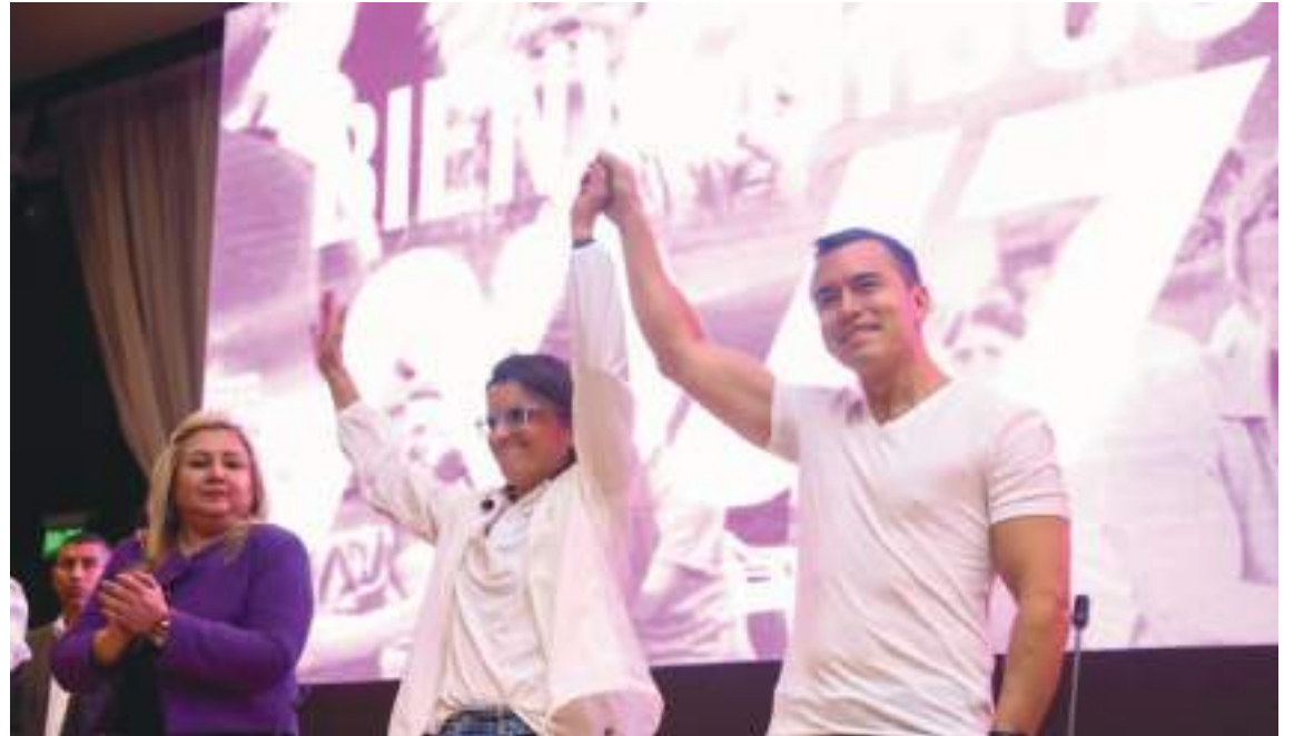
El presidente Daniel Noboa y su compañera de fórmula María José Pinto asisten a un evento con el partido gobernante, Acción Democrática Nacional (ADN), anunciando su boleta para las elecciones del próximo año.

El resultado cerrado de la contienda de 2023 hace prever una