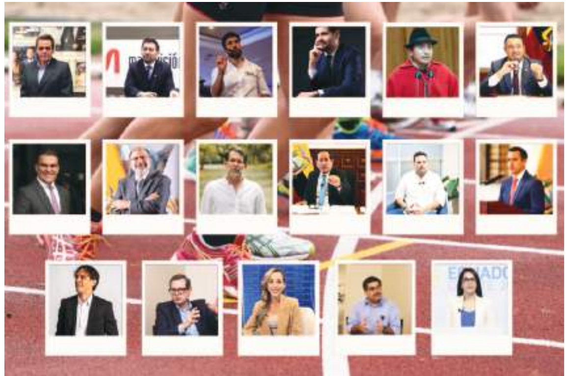
Aún falta tiempo para la confirmación de todos los candidatos, pero ya hay varios "fijos" en el partidador.

El gran reto del correísmo es lograr variar las tendencias que se han petrificado en las últimas dos