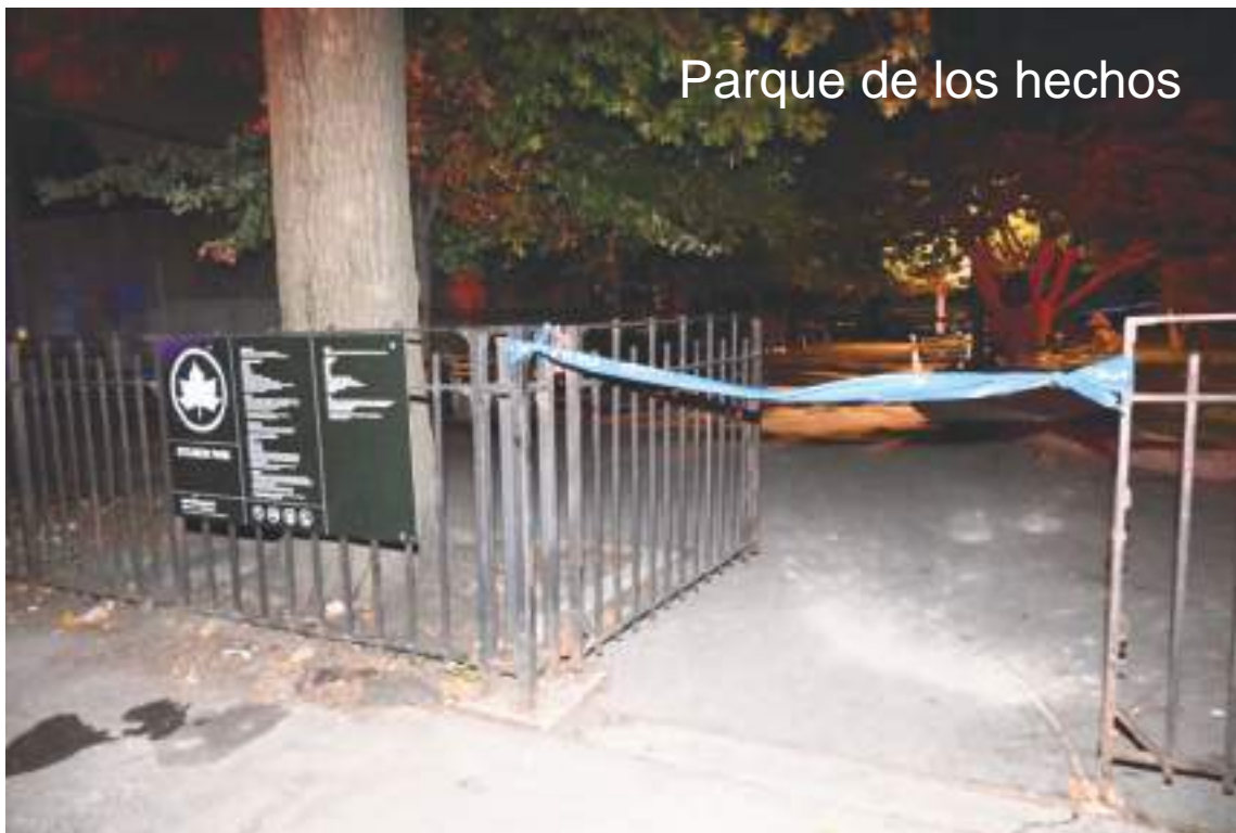
Parque de los hechos

Un abogado de Mitchell no respondió a un correo electrónico el miércoles de la semana anterior.