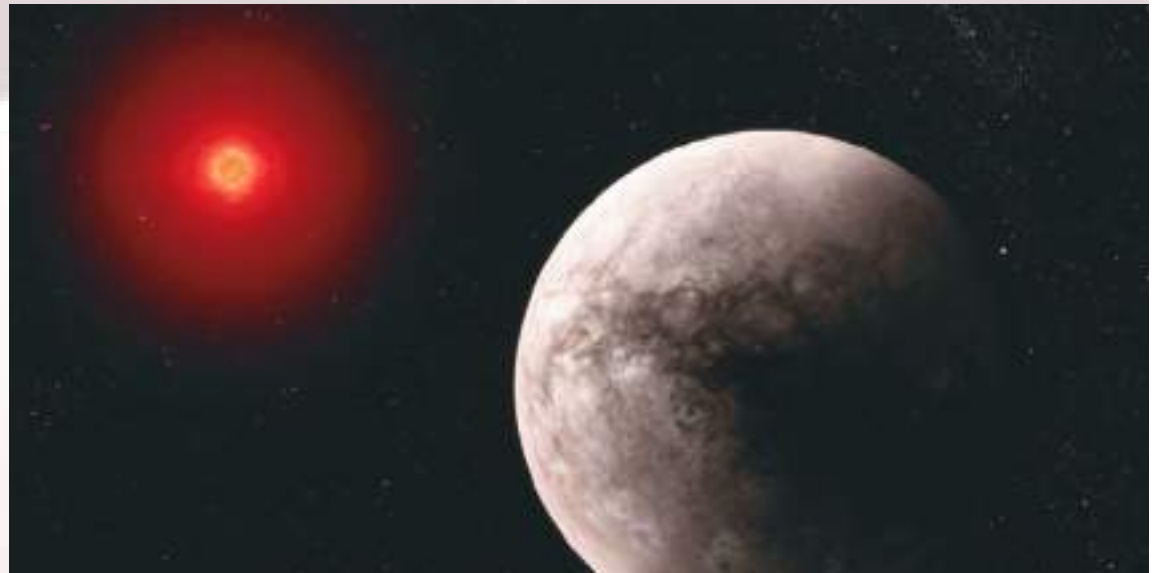
El posible descubrimiento de vida en planetas que orbitan alrededor de la estrella enana roja Trappist-1, que Lisa Kaltenegger y su equipo estudian actualmente, ejemplifica el tipo de trabajo innovador que se está llevando a cabo bajo su dirección.

En ese sentido, la astrofísica, autora del libro Alien Earths: Planet Hunting in the Cosmos (Tierras extraterrestres: a la caza de planetas en el cosmos), recientemente expresó al influyente medio The Telegraph su convicción, apoyada en el uso del avanzado telescopio James Webb. Este instrumento, un salto cualitativo en la observación del espacio, permite a los científicos analizar con gran precisión la composición atmosférica de planetas lejanos. Según Kaltenegger, estamos en "una era dorada de exploración, con miles de mundos al alcance que ahora podemos investigar".