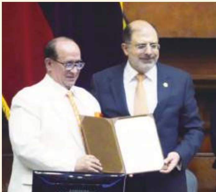
EDUARDO FRANCO LOOR, ALCANZÓ SOLO A POSESIONARSE.

Este cambio de color en el CPCCS vendría a ser para la Revolución Ciudadana, especialmente para su líder, la parte final de una temporada de mala racha o la saturación de la obstinación por el poder, para limpiarse por lo menos la cara ante la Historia.