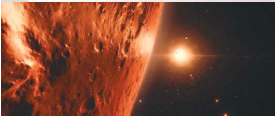
Esta ilustración de la Agencia Espacial Europea muestra el posible aspecto del exoplaneta Trappist-1

Además, menciona el desarrollo de un nuevo telescopio espacial: el Observatorio de Mundos Habitables. Pero insiste: "creo que la ciencia es una hermosa red de ideas que se extiende a través del tiempo. Incluso si no podemos encontrarlo en mi vida, las ideas que reunimos, las cosas que ponemos en marcha son los peldaños que permitirán a las próximas generaciones hacerlo".