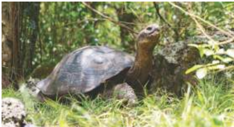
Fotografía de la Fundación Jocotoco de una tortuga gigante

“En este momento -dijo- tenemos una oportunidad para cambiar el rumbo del futuro de Floreana, para su vida silvestre y para su gente (160 habitantes)”.