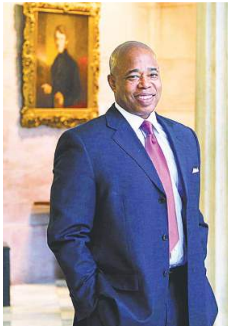
Los problemas de Adams comenzaron cuando fue presidente de Brooklyn.

ciones estadounidenses", según la acusación.