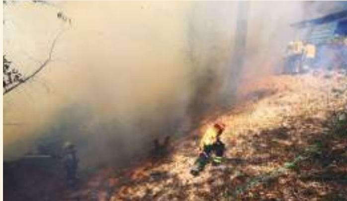
ARDUO FUE EL TRABAJO REALIZADO POR LOS BOMBEROS EN QUITO.

Según ECUAVISA, la primera conclusión de las autoridades municipales y gubernamentales es que el fuego inició de manera intencional, incluso el presidente Daniel Noboa insinuó que, de determinarse aquello, los responsables serían tratados como terroristas.