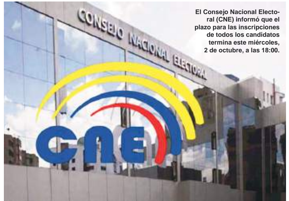
El Consejo Nacional Electoral (CNE) informó que el plazo para las inscripciones de todos los candidatos termina este miércoles, 2 de octubre, a las 18:00.

alegría, con esa fe de días mejores" y con la esperanza de que en ella tienen "una mujer que sabrá conducir este país con la verdad, con la capacidad, con la transparencia y con la firmeza que requiere este país; con un liderazgo firme, con un liderazgo donde el poder vuelva a la gente".