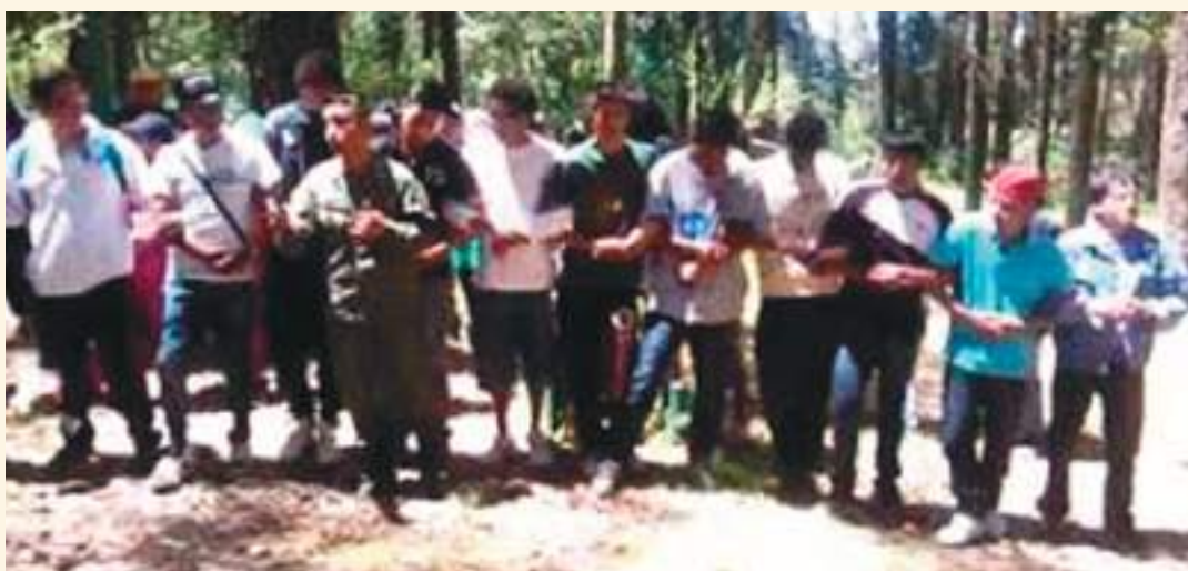
UN OFICIAL DANDO INSTRUCCIÓN MILITAR A COMITÉS DE LA RC-5-

Hay un largo camino por recorrer, ojalá que esta vez valga la penas esperar la terminación de las investigaciones que tienen un olor fuerte y penetrante como el del humo que tuvieron que inhalar los quiteños hace pocas horas.