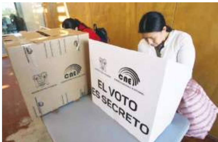
Ecuador vive un momento difícil, pero no decae el optimismo de la gente.

Al finalizar su discurso, formuló un llamamiento a "vencer el miedo con esa esperanza, con esa