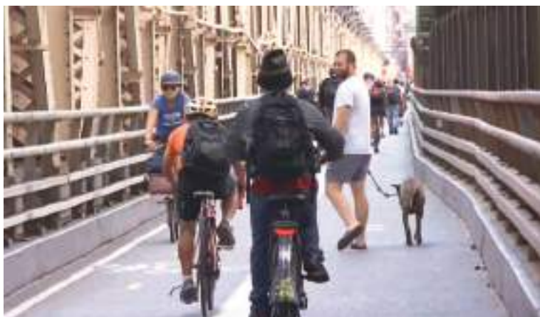
"Aquí transita demasiada gente con la bicicleta, las patinetas y los que practican ejercicios corriendo. Es muy urgente".

¿Y cuándo abrirá el nuevo cruce peatonal? El departamento de Transporte dice que este invierno aunque no han dado una fecha precisa.