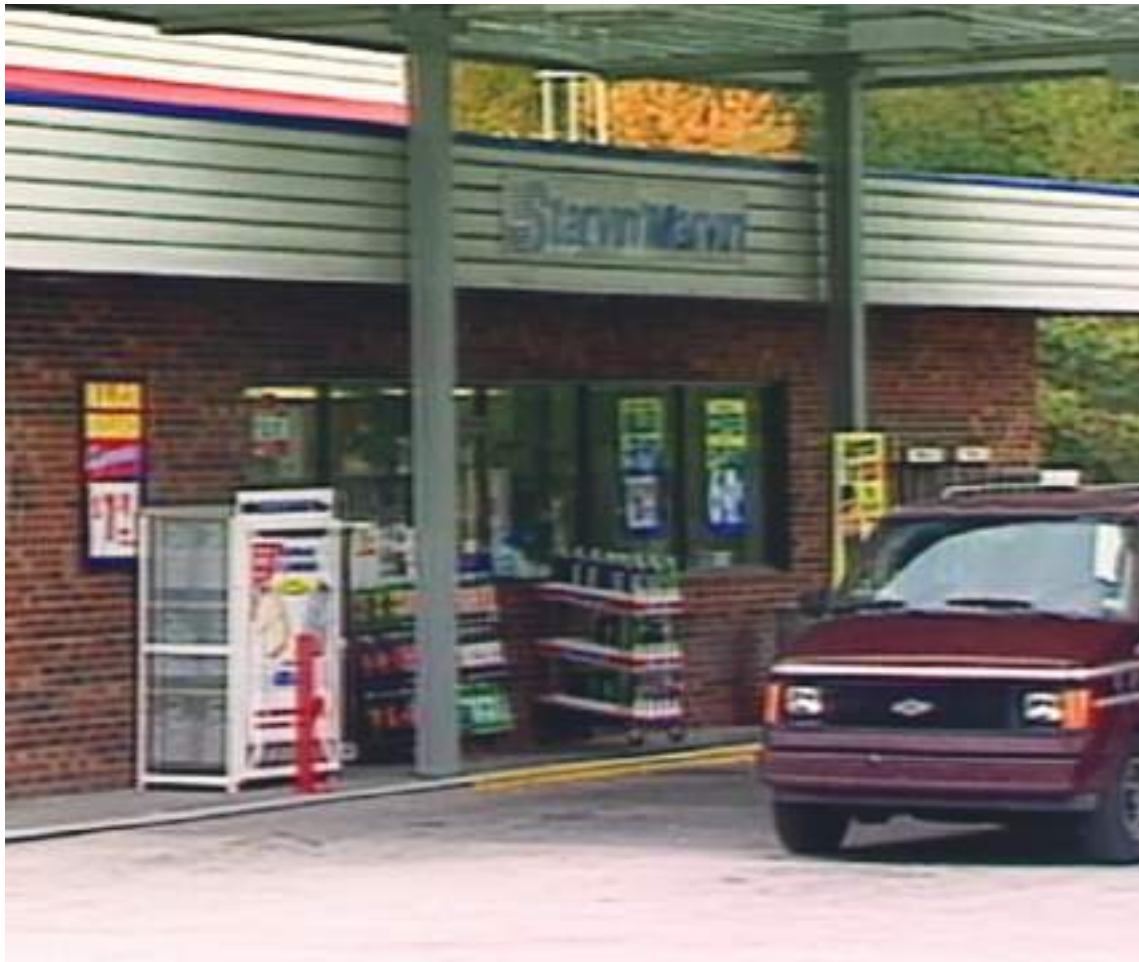
Lugar donde se produjo el crimen que condujo a la reciente sentencia de muerte, ya ejecutada.

injustamente por asesinato", según un relato escrito de un investigador.