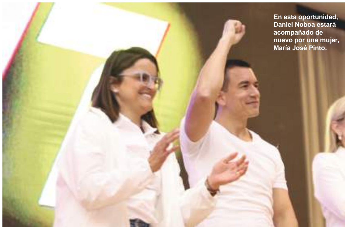
En esta oportunidad, Daniel Noboa estará acompañado de nuevo por una mujer, María José Pinto.

El mandatario, que en 2023 se convirtió el presidente más joven en ganar unas elecciones en la historia de Ecuador, asumió un país con la tasa más alta de homicidios de Latinoamérica, producto del auge de la violencia criminal, por lo que a inicios de 2024 elevó la lucha contra el crimen organizado