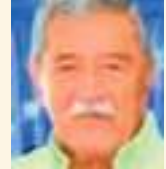
ANTONIO MOLINA Especial para Ecuador News

ECUAVISA puso las alarmas, los temores con el andar de las horas amenazaban convertirse en pánico colectivo y la Municipalidad Metropolitana de Quito multiplicaba sus esfuerzos como quien se cura en sanos; el Ministerio de Defensa empezó a desempolvar archivos y los periodistas aguzaron su memoria para desentrañar quien, metódicamente, podría ser quien se propuso incendiar Quito, para crearle un nuevo problema al país, a la Alcaldía quiteña y al Gobierno Nacional, amén de las consecuencias que – como ocurre casi siempre - arrastra y padece el ecuatoriano común y corriente, al patial suelo vecino de nuestro barrio.