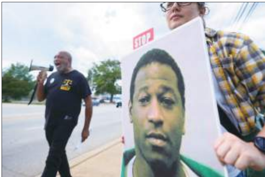
Muchas protestas se realizaron para evitar la ejecución de Owens, pero el gobernador del estado se mantuvo firme en la decisión.

Para adquirir los fármacos y reiniciar las ejecuciones, el estado terminó teniendo que aprobar una ley de protección que protege al proveedor de los fármacos y el protocolo en materia de ejecuciones (muchas de las compañías farmacéuticas no estaban dispuestas a vender públicamente los fármacos de inyección letal del estado). El estado también adoptó un nuevo protocolo de ejecuciones por inyección letal, utilizando únicamente el sedante pentobarbital en lugar de una serie de tres fármacos.