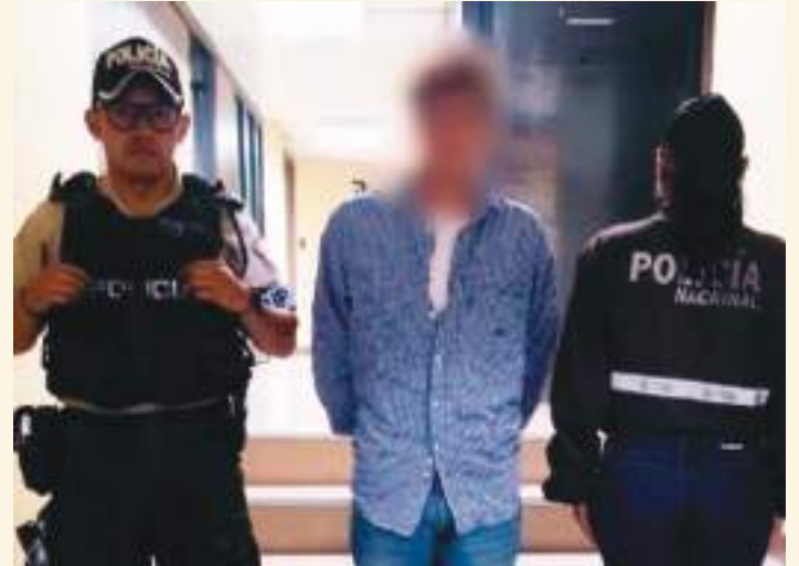
UN PRESUNTO PIRÓMANO DETENIDO POR LA POLICÍA, ASEGURÓ ECUAVISA.

La sola presencia de Ricardo Patiño en Ecuador causó inquietud política (se había autoexiliado en