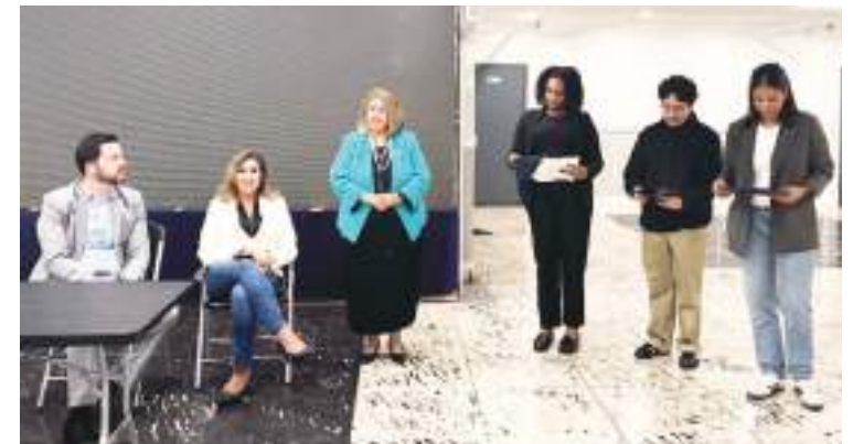
La foto del recuerdo de todos los organizadores y participantes del foro informático.