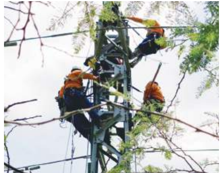
Igualmente se trata de resolver otros problemas eléctricos.

El alumbrado público no funciona, las residencias al acecho de los delincuentes, telefonía celular e internet con problemas, hospitales y clínicas con servicio a medias, los centros de privación de libertad en tinieblas, instituciones educativas suspenden actividades, seguridad descontrolada. En síntesis, estamos a un pasito de migrar y de una revolución social.