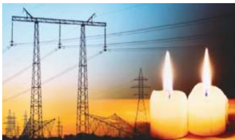
Las velas y la paciencia de la gente se está terminando.

trabajar, estudiar, limpiar la casa, bañarse, atender a los niños, hasta ir al baño y por supuesto, cabrearse por tanta mentira, pero menos trabajar.