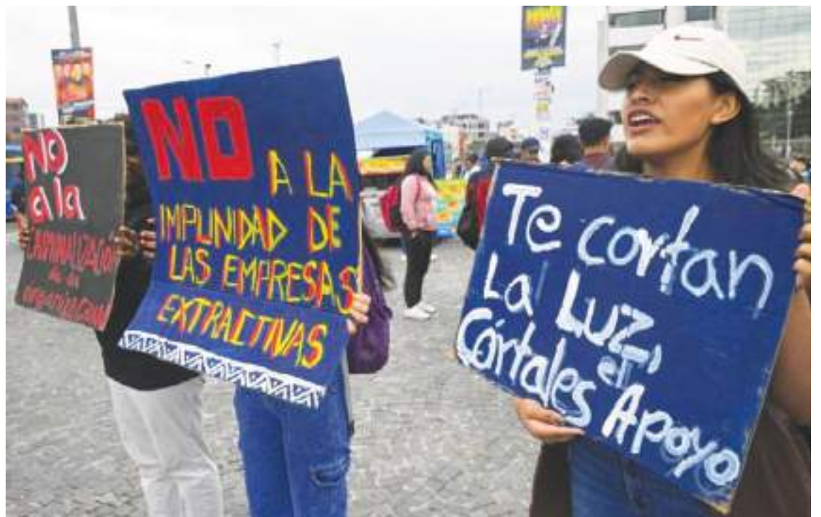
La ciudadanía tiene optimismo y se limita a protestar.