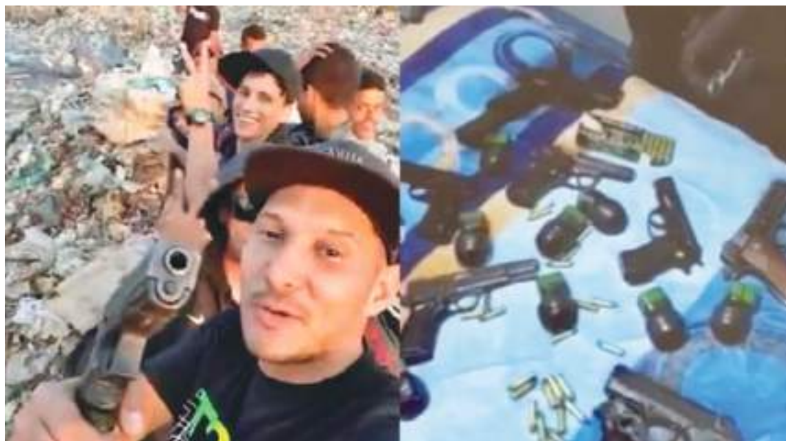
A los integrantes de la pandilla les encanta presumir de su poder con las armas, muchas han sido incautadas.

De modo que la pandilla callejera local, aunque era una preocupación para el personal de la embajada de Estados Unidos en sus movimientos diarios por la peligrosa capital de Venezuela, no se consideraba un riesgo importante para la seguridad de Estados Unidos. Ahora, más de una década después, la pandilla se ha convertido en una amenaza incluso en suelo estadounidense y ha irrumpido