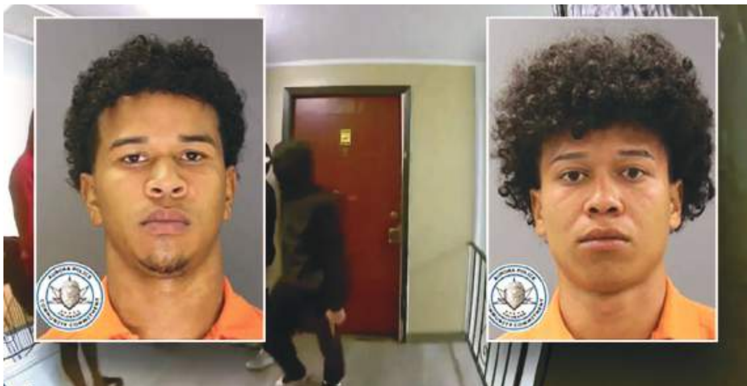
Dos presuntos miembros de la pandilla transnacional Tren de Aragua fueron liberados bajo fianza luego de estar involucrados en un tiroteo.