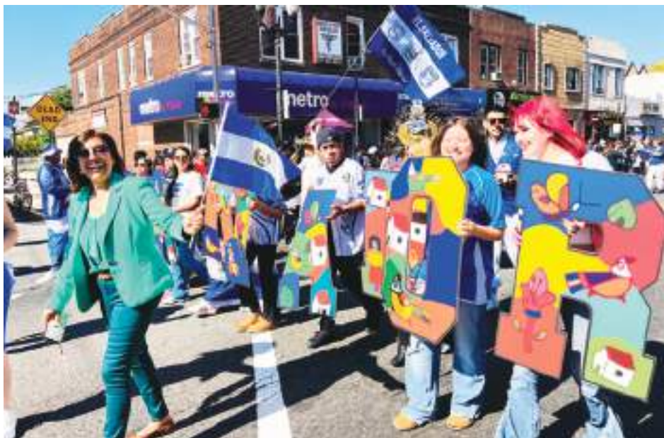
Gran participación de la comunidad salvadoreña en la 49 edición del Desfile Hispano.