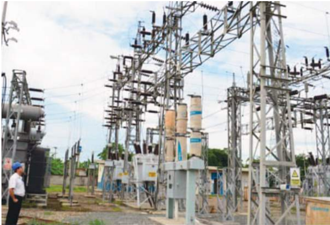
Las plantas eléctricas paralizadas.

hay medios de transporte, como superar el cansancio por no haber dormido, ¿cómo ch... puede dar clases?