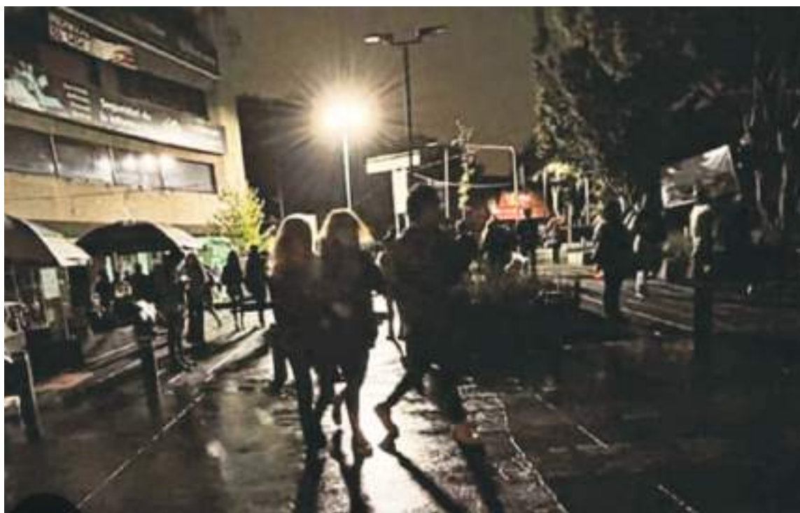
Así son las noches en Ecuador.

Hoy son más las horas de apagones que las horas que tenemos electricidad. En el poco tiempo de luz que nos dan, por lastima, tenemos que hacer todo: cocinar,