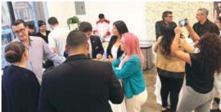
Los asistentes degustaron bocadillos de Rumba & Sazón y Ceviche Bistro.