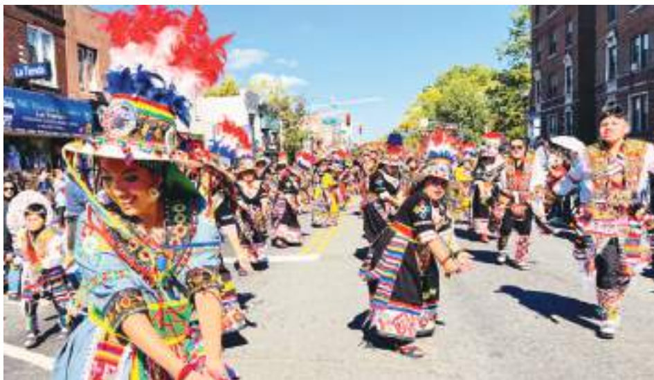
El colorido de la danza boliviana cautivó a miles de espectadores con la danza de los Tinkus de la Confraternidad San Simón de New York.