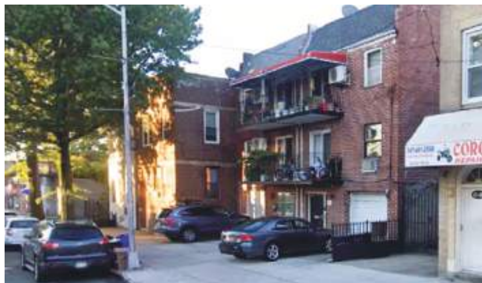
Casa donde aparentemente residía el sindicado.