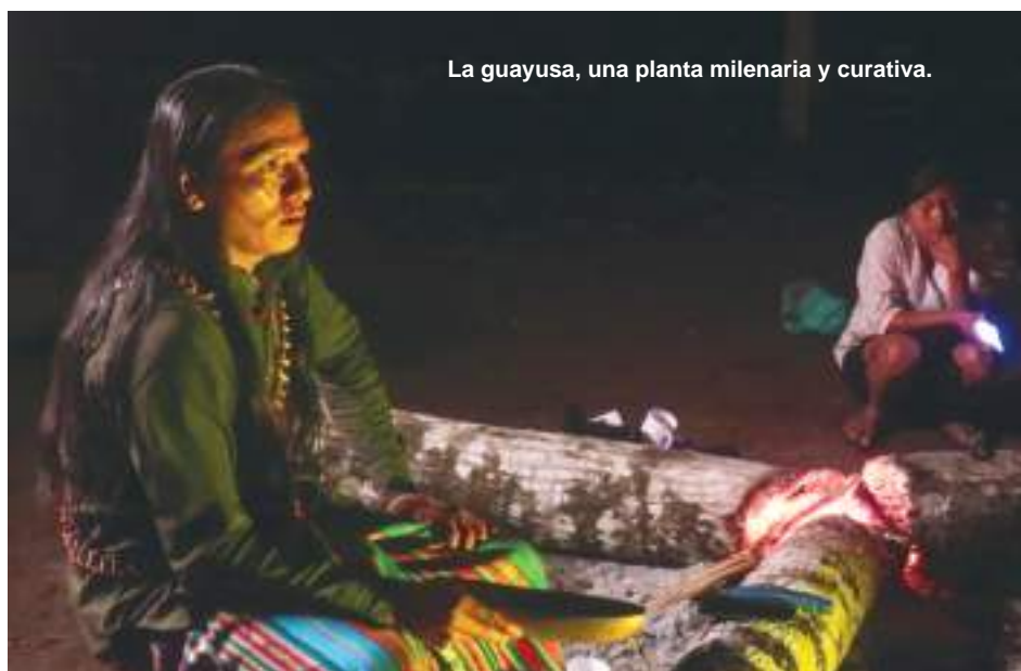
La guayusa, una planta milenaria y curativa.

La toma de guayusa , que se realiza a diario en el entorno familiar, representa también un