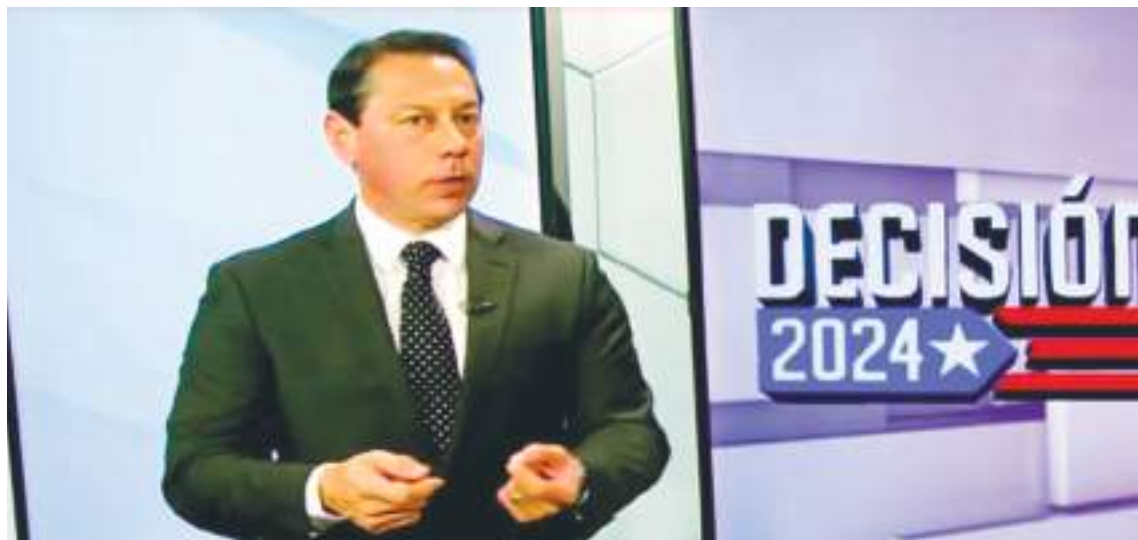
Lcdo. Juan Dalmau Ramírez Candidato para Gobernador de Puerto Rico por la ALIANZA: Movimiento Victoria Ciudadana y el Partido Independentista Puertorriqueño.