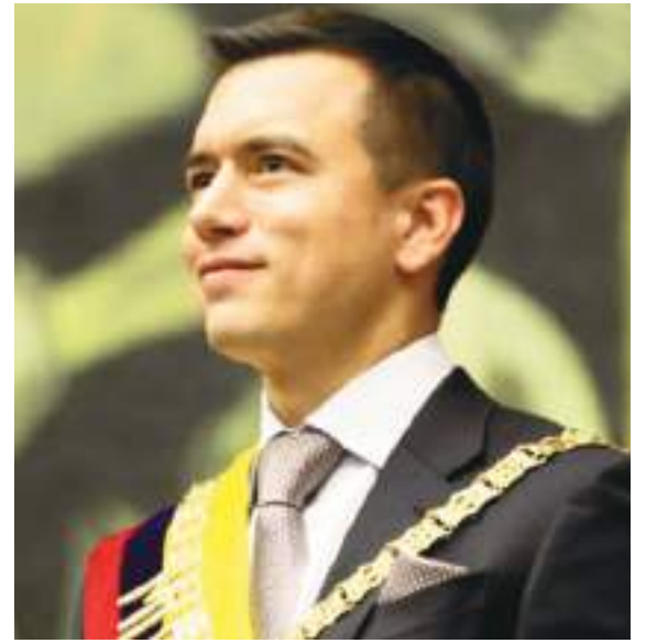
Luisa González y Daniel Noboa son, hasta el momento, los mas opcionados para el triunfo en el 2025.

La crisis de la política y de lo público y la influencia que tiene en ello un perfil inadecuado o insuficiente de nuestros dirigentes políticos, debe ser analizado. Hay que examinar el contexto en que se desenvuelve la acción político-pública, incluidos los nuevos retos que presenta este siglo, la influencia de la corrupción y el poder de la narco política.