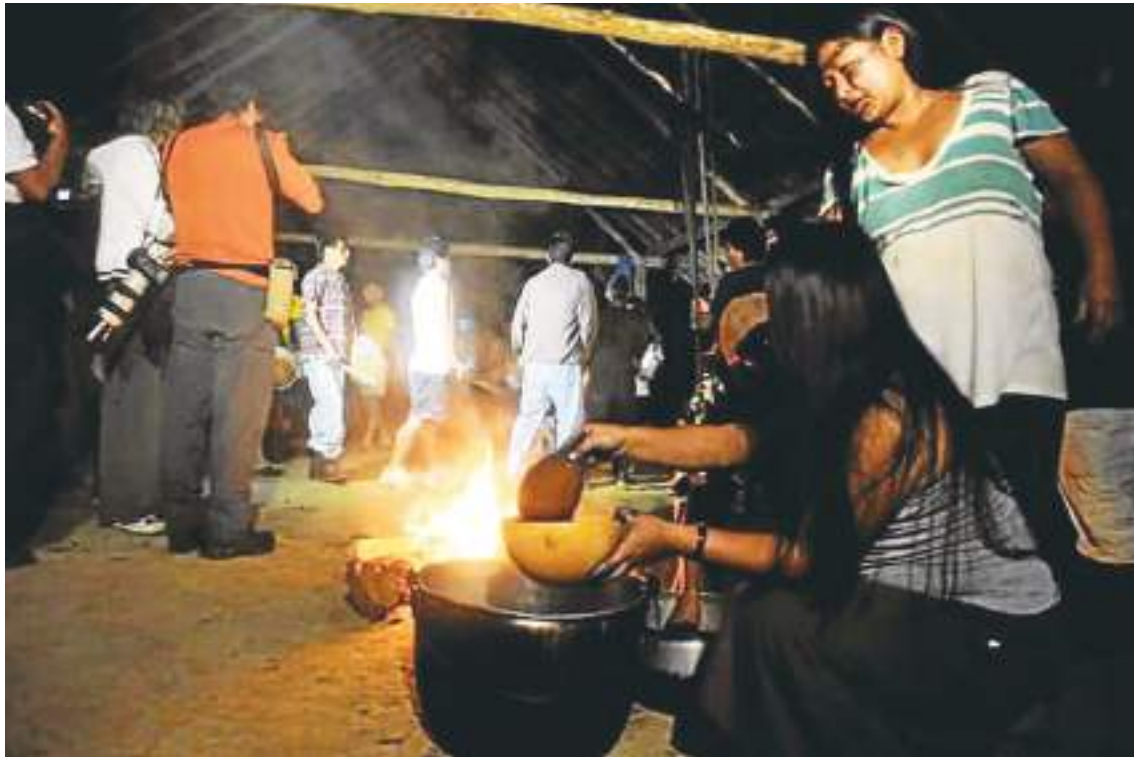
En la comuna kichwa Atari, de la parroquia El Eno, cantón Lago Agrio, realizan una ceremonia ancestral de la guayusa.