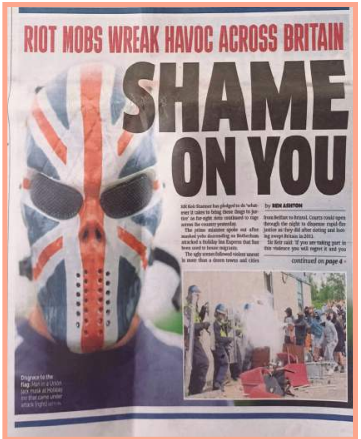
¡Qué vergüenza! Es el titular que refleja el sentimiento mayoritario de los británicos ante los disturbios ocasionados por vándalos en agosto.

Similar es la situación en otros países europeos donde se promueve visas de búsqueda de trabajo para entrega de domicilio, restauración, hotelería, agricultura, áreas donde se necesita la fuerza laboral de los migrantes. España requerirá 25 millones de inmigrantes en los siguientes 30 años.