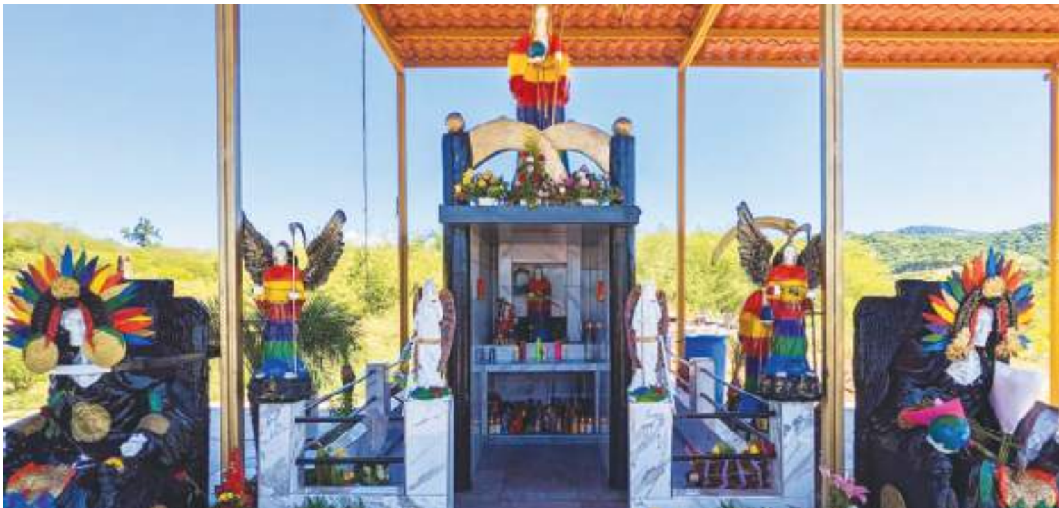
Un altar a la Santa Muerte encontrado por autoridades en El Salvador.

“No es sorprendente que el culto a la Santa Muerte crezca y florezca en tiempos de tanta muerte. Muchas personas recurren a la Santa Muerte como protección ante una posible muerte inminente o para desear la muerte a sus enemigos”, dijo Chesnut.