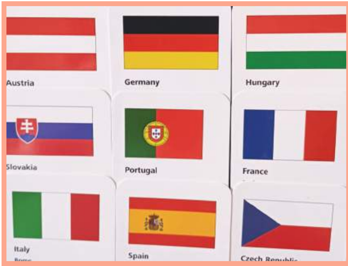
Algunos de los países europeos donde la extrema derecha avanza.