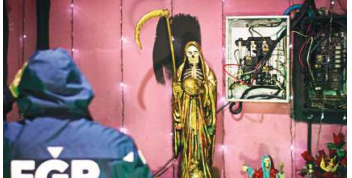
Altar y estatuas de la Santa Muerte en Culiácan, Sinaloa. Esta creencia ha sido "exportada".

El reciente descubrimiento en El Salvador de un santuario a la Santa Muerte, una deidad femenina asociada con el submundo criminal, ha revelado cómo el nuevo movimiento religioso se ha vuelto popular entre los grupos criminales fuera de México.