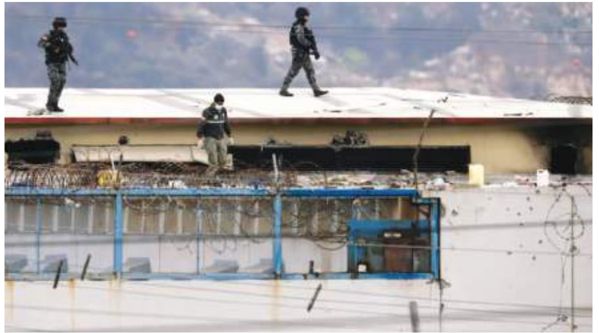
Cada vez que se produce una masacre o una revuelta, la vigilancia en las cárceles se incrementa.

Las autoridades no especularon públicamente sobre lo que motivó la masacre, pero una organización de familiares de reclusos dijo al medio 'Primicias' que la pelea fue por la comida. Las bandas carcelarias suelen ejercer control sobre