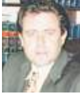
JAMES R. CULLEN Especial para Ecuador News

Como muchos de los lectores habituales de este periódico sabrán, he tenido el privilegio de haber sido el abogado de Ecuador News desde su creación hace unos 30 años.