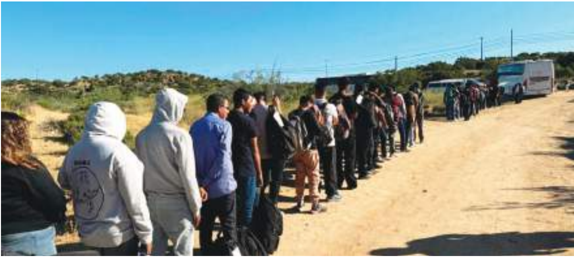
Los migrantes hacen fila en la frontera sur de San Diego en junio. Muchos miembros del Tren de Aragua ingresaron ilegalmente a los EE. UU. a través de esa zona.

por acabar con la actividad de sus componentes, especialmente si los sospechosos no tienen "orden de detención" de inmigración.