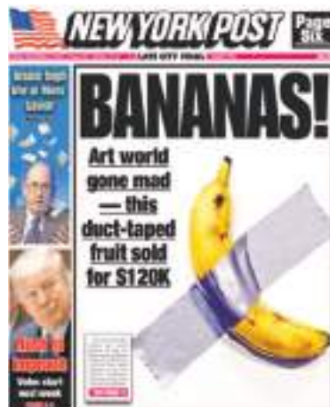
La "obra" tal como se presentó en la audición de la famosa casa de subastas de NY. El hecho se convirtió en noticia mundial.