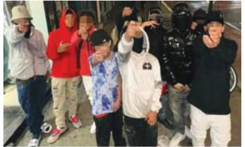
Se presume que los jóvenes miembros del Tren de Aragua, con base en el Hotel Roosevelt en Nueva York, han estado atacando la cercana Times Square en una serie de robos.

Además de la ciudad de Nueva York, Colorado y Texas, la pandilla tiene presencia en California, Florida, Georgia, Illinois, Luisiana,