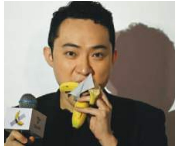
Tras pagar la insólita cifra, el empresario chino pelo la "obra artística" y en presencia de todos se la comió....

"Comerlo en una conferencia de prensa también puede convertirse en parte de la historia de la obra de arte", agregó.