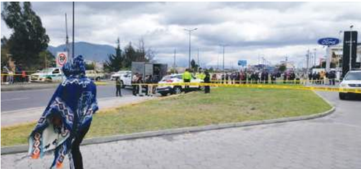
La policía busca más indicios para esclarecer el crimen de Olger Moreno. (Foto El Extra).

Además, este enfoque, que ya está mostrando resultados negativos evidenciados en el repunte de las tasas de homicidio, es insuficiente para hacer frente a la dinámica más compleja que está surgiendo.