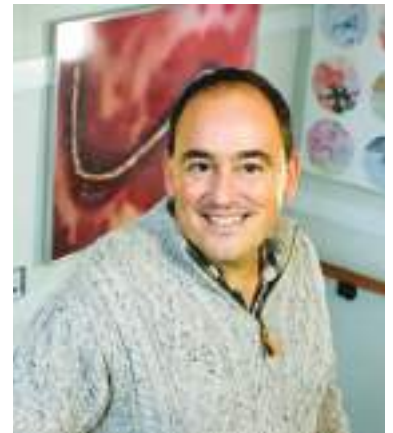
Profesor Tim Coulson

Aunque es poco probable que se adapten a la vida en tierra debido a su falta de esqueleto, el científico no descartó que pudieran construir comunidades submarinas parecidas a ciudades e incluso aprender a respirar fuera del agua