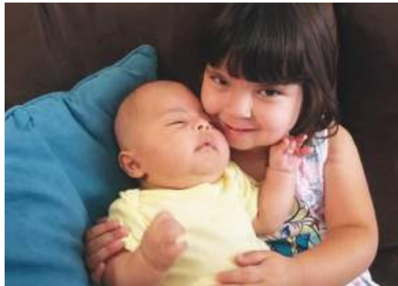
Los hermanitos Montalvo se aman desde siempre, son héroes.

“Como padre, nadie está preparado para esta noticia”, dijo. “Sin embargo, al pasar por esto por segunda vez, conocíamos a los médicos y, de alguna manera, en ese océano de incertidumbre sentimos mucha confianza en que estábamos en el lugar donde se suponía que debíamos estar y en las manos adecuadas”.