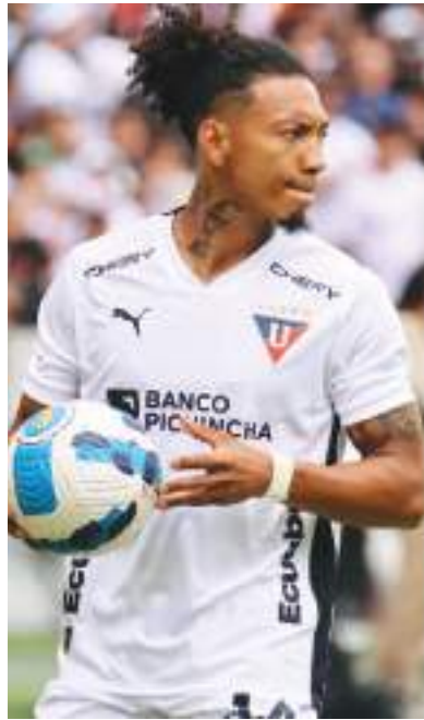
Liga de Quito, Barcelona e IDV ya conocen sus grupos de Copa Libertadores

Las finales de LigaPro, entre Liga de Quito e Independiente del Valle, se jugarán el sábado 7 y 14 de diciembre, ambas a las 15h30.