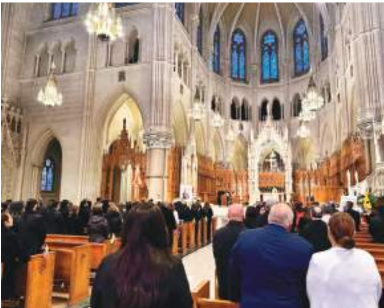
La comunidad ecuatoriana residente en el área Tri Estatal acudió a despedir al Embajador.