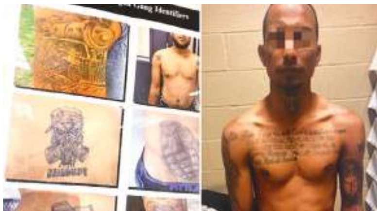
Estas imágenes de un boletín de inteligencia de Aduanas y Protección Fronteriza muestran tatuajes e identificadores del Tren de Aragua.

Rausch dijo que el Tren de Aragua tiene "cero respeto" por la policía y ha atacado a las fuerzas del orden en todo Estados Unidos. Agregó que las fuerzas del orden están limitadas en sus esfuerzos