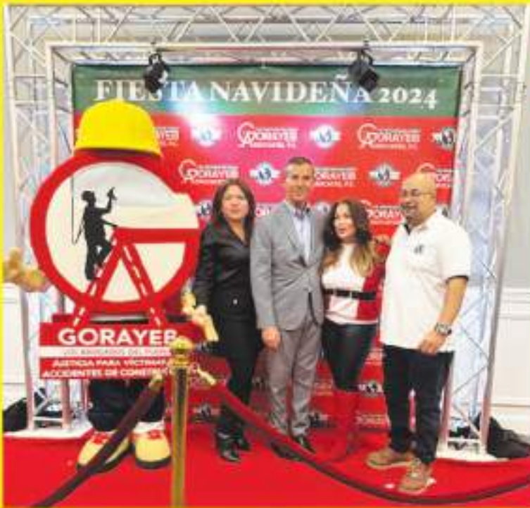
Anabella Azín habla de su esposo Alvaro Noboa