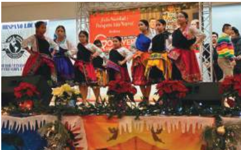
Nukanchi Llacta Wawakuna y el Grupo Wuambas.