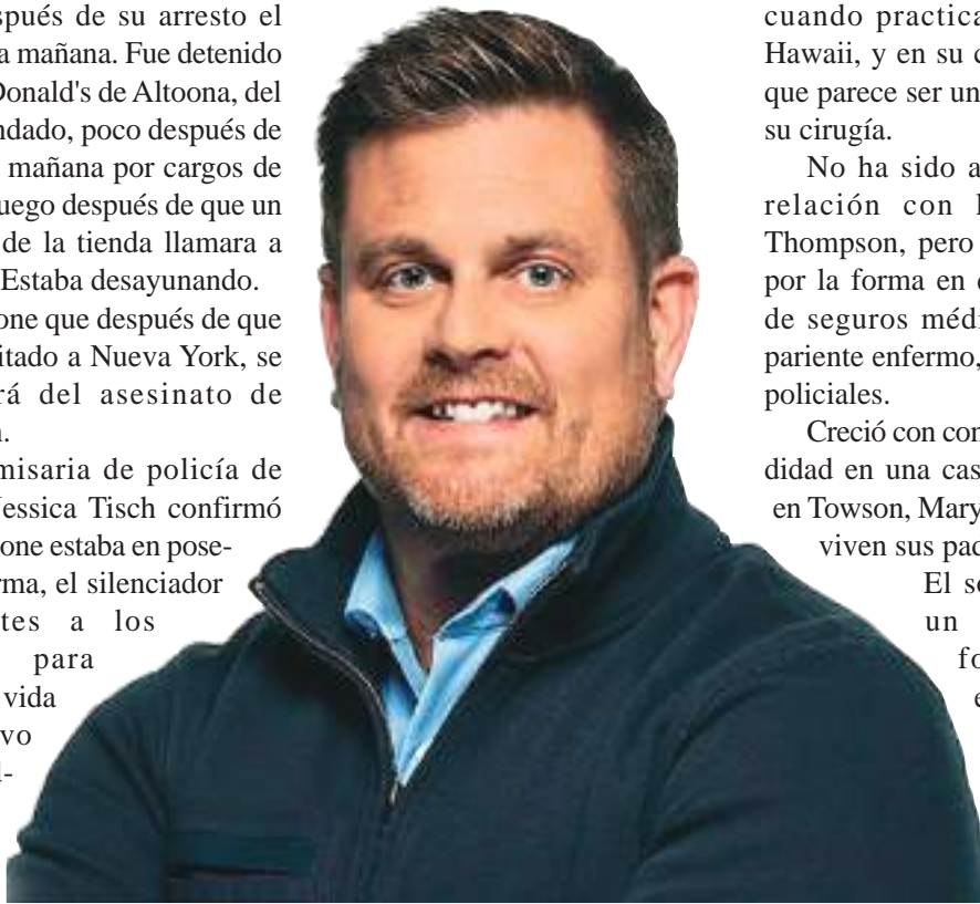
Brian Thompson fue asesinado el miércoles de la semana anterior en la mañana.

La comisaria de policía de Altoona, Jessica Tisch confirmó que Mangione estaba en posesión del arma, el silenciador -semejantes a los usados para quitarle la vida al ejecutivo de United-