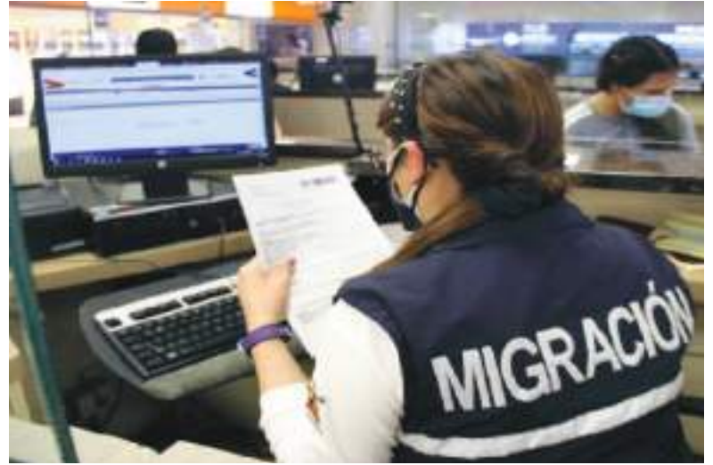
Hay que cumplir todos los requisitos legales al entrar o salir de Ecuador, para evitar demoras o dolores de cabeza.

El Servicio Nacional de Aduana del Ecuador (Senae) informó que, desde este lunes 9 de diciembre de 2024, todos los pasajeros que ingresen o salgan de Ecuador por vía aérea deberán declarar el dinero en efectivo y los bienes tributables que tengan a través de un formulario en línea. Entérese de cómo es el proceso y a partir de qué monto es obligatorio llegar el formulario en línea.