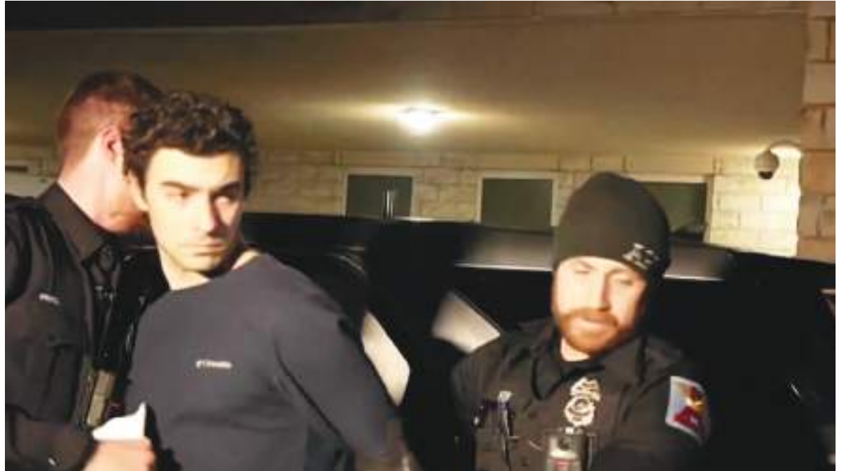
Tras su detención en un McDonald's el presunto asesino del CEO, Luigi Mangione, fue llevado a un Precinto.

En menos de una semana, los cuerpos investigativos de Nueva York, apoyados por fuerzas federales, dieron con el presunto responsable de asesinar al director ejecutivo de UnitedHealthcare, en una calle de Manhattan.