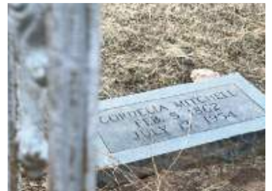
Algunas de las parcelas de entierro de la familia Mitchell están parcialmente rodeadas por una cerca ornamental. Gran parte de la cerca fue destruida durante el incendio de Witch Creek. (Regina Elling).