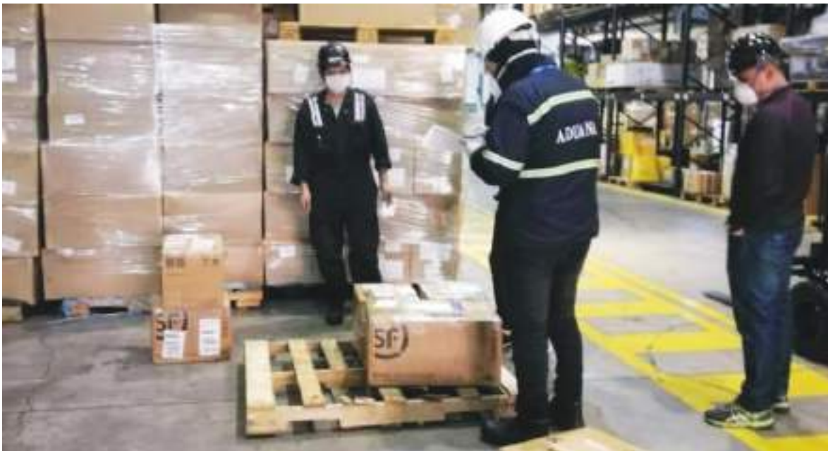
En Ecuador siempre ha habido una lucha fuerte contra el contrabando.

Se debe recordar que se puede sacar de Ecuador sin pagar ISD (Impuesto de Salida de Divisas) hasta cierto dinero, llame antes para informarse.