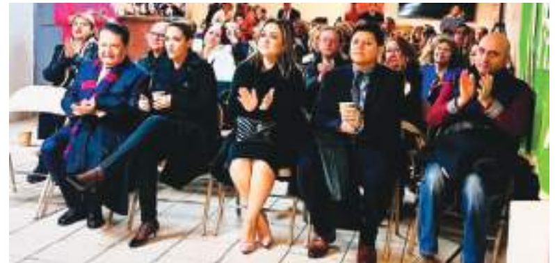
La comunidad ecuatoriana asistió a celebrar la Fundación de Quito.