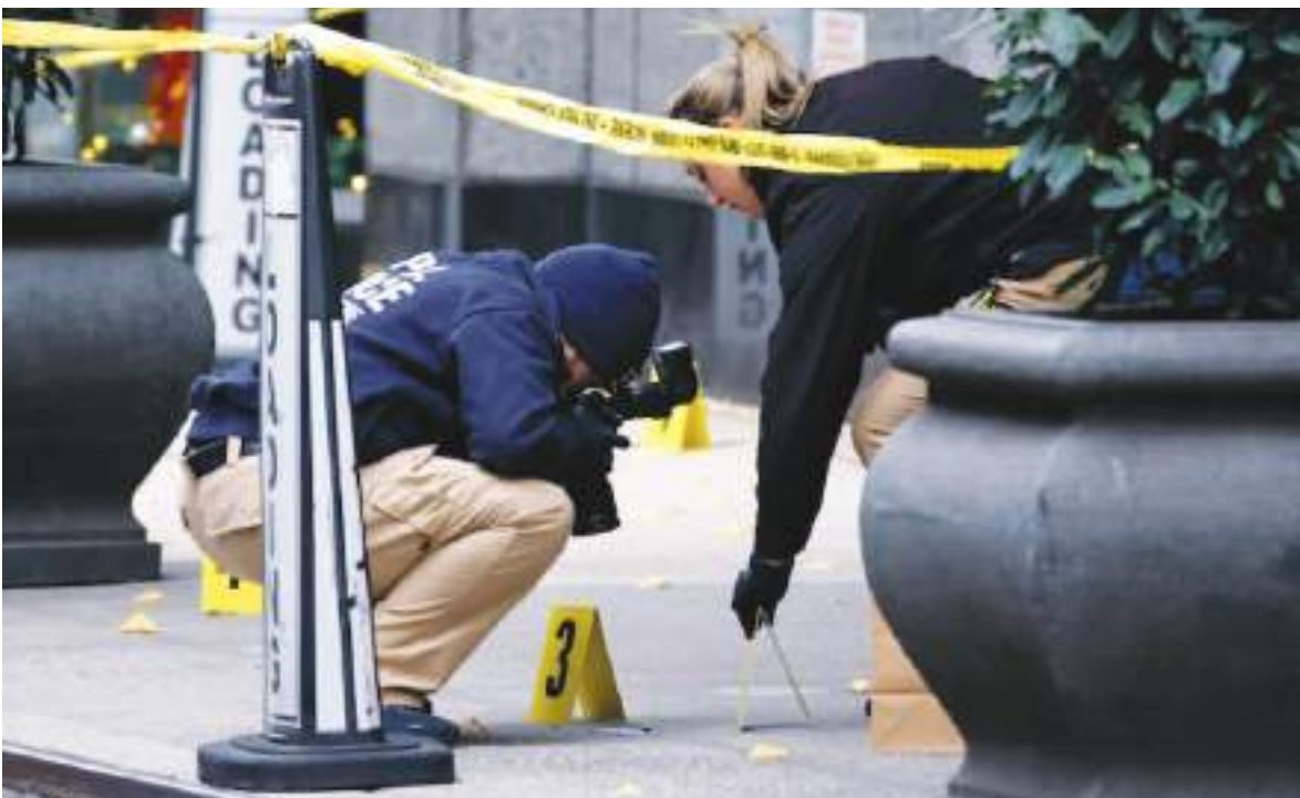
Los investigadores recolectaron evidencias de forma cuidadosa en la escena del crimen.

Es factible que en su manifiesto haya repetido estos pensamientos, lo que se dirá una vez haya sido acusado del asesinato.