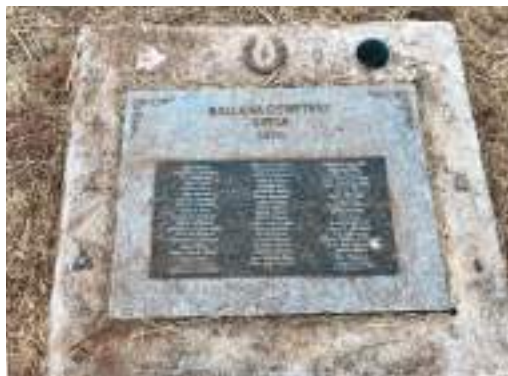
Una placa cerca de la entrada del cementerio de Ballena enumera los nombres de las personas que se sabe que están enterradas allí, así como los “11 desconocidos”. (Regina Elling).

La tumba más antigua en Ballena se identifica como el “bebé Van Casner,” alrededor de 1870,