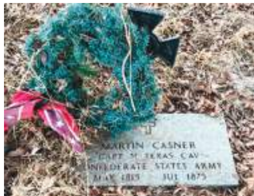
La tumba de Martin Casner, un capitán del Ejército de los Estados Confederados, fue marcada con una corona y una bandera. (Regina Elling).