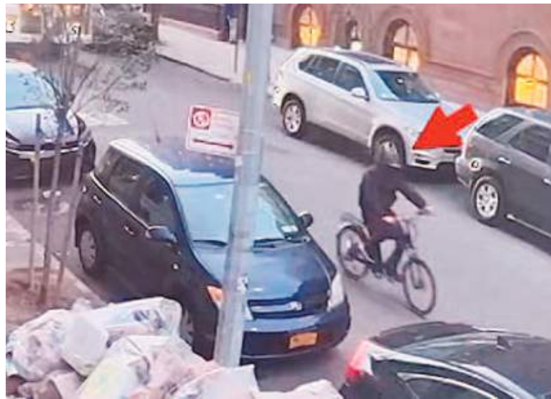
El tirador captado por cámaras de vigilancia en su huida.