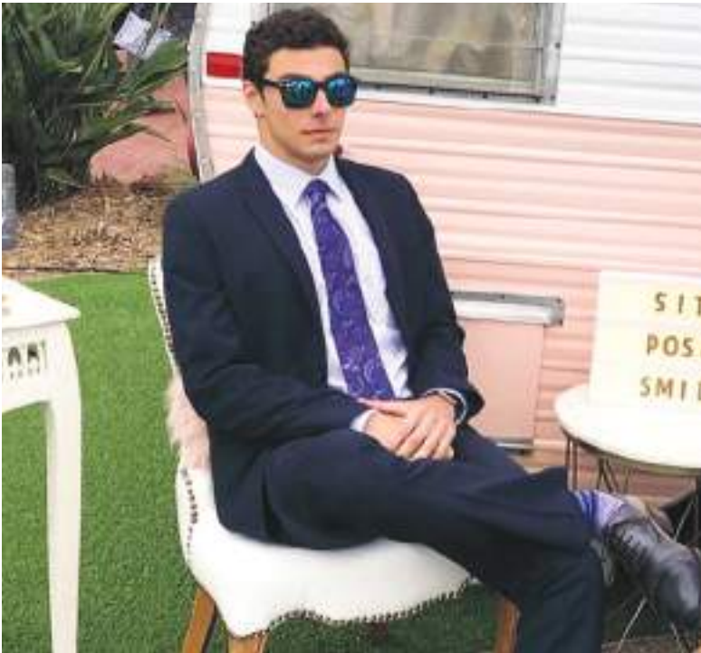
Es miembro de una familia adinerada.