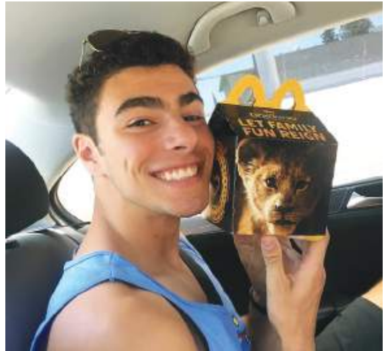
Al parecer siempre ha sido amante de lo que sirve McDonald's.

No se han compartido mayores detalles sobre otros parientes, aunque los obituarios en línea muestran que Mangione perdió a una abuela en 2013 y a un abuelo en 2017.