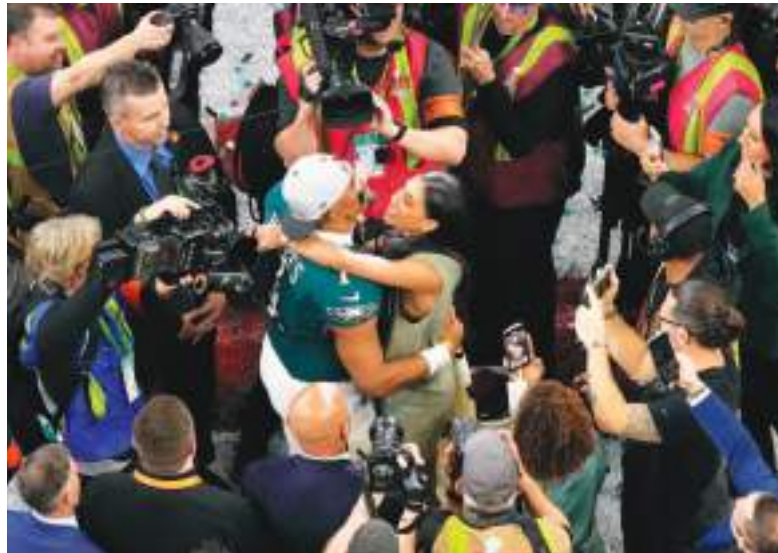
El quarterback de los Eagles de Filadelfia, Jalen Hurts (1), abraza a su pareja Bryonna Burrows después del Super Bowl 59 de la NFL, el domingo 9 de febrero de 2025, en Nueva Orleans.

Todas esas dudas ayudaron a impulsar a Hurts en el camino y ahora será conocido para siempre como un Jugador Más Valioso del Super Bowl, y a pesar de no haber brillado especialmente en una noche dominante