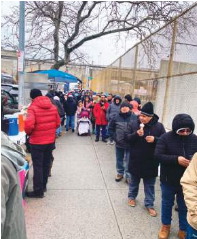
Largas filas para ejercer el voto en Queens con mucho fervor patriótico.