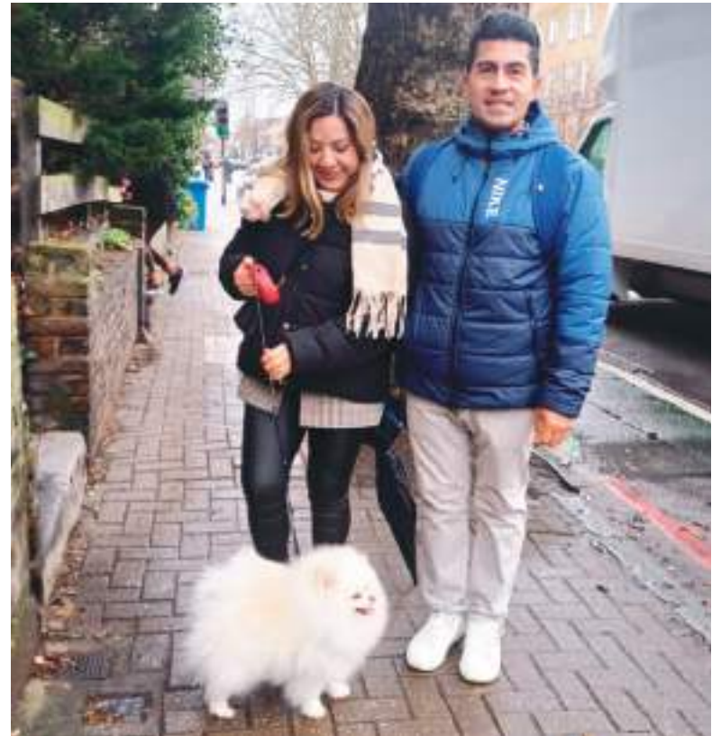
Compatriotas yendo a votar con el hermoso Bizcocho.