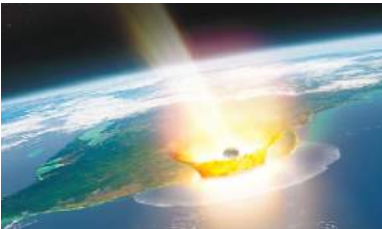
Representación artística del momento del impacto.

A lo largo de la historia, impactos similares han provocado cambios climáticos drásticos, como el que extinguió a los dinosaurios hace 66 millones de años.