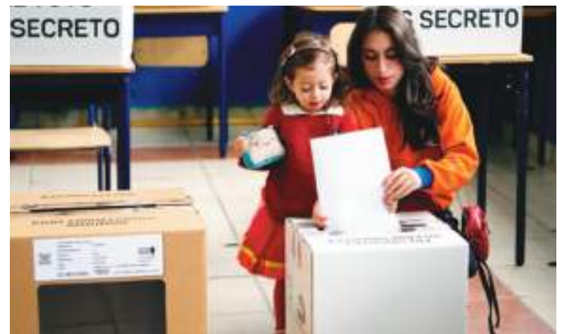
Cumpliendo con el deber cívico y enseñándole a las nuevas generaciones.

La Asamblea Nacional estará conformada por dos mayorías simples, pero cualquiera de ellas según los acuerdos o componendas, podría lograr una mayoría absoluta y manejar el poder legislativo a su antojo e interés. Nada se proyecta fácil para el nuevo Presidente, en esa virtud el pueblo debe reflexionar seriamente antes de emitir su voto, en un país con una economía hecha añicos, con una de las tasas de inseguridad más altas del mundo.