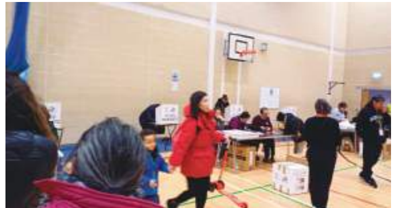
Toma en el interior del recinto electoral, donde la actividad fue plena de patriotismo.