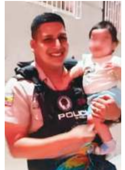
Agente de la policía ecuatoriana con la bebé tras ser rescatada.