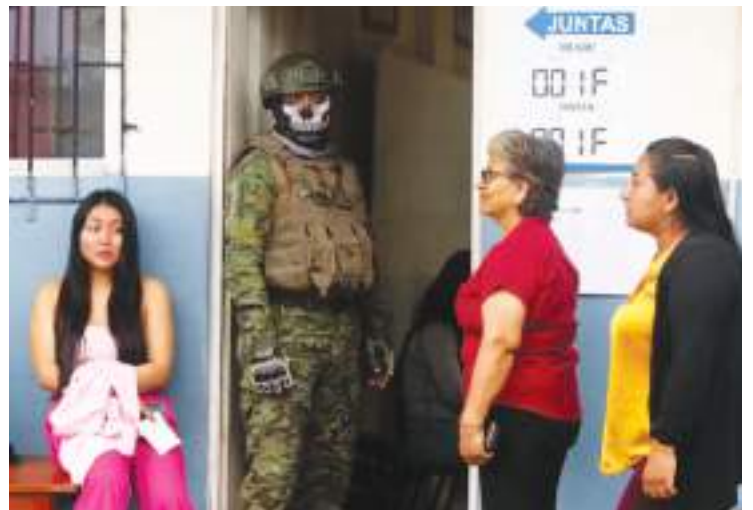
Un guardia en Olón, comuna de Santa Elena, donde tiene su residencia el presidente Noboa, un guardia controla el ingreso de los votantes que a la postre le dieron la espalda a su ilustre vecino.