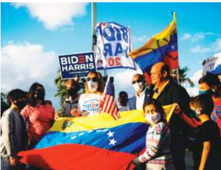
Muchos venezolanos presintiendo lo que se venía, apoyaron a los adversarios de Trump, pero lamentablemente para ellos la situación fue diferente.

La decisión de revocar las protecciones podría enfrentar desafíos legales por parte de activistas de los derechos de los inmigrantes que han estado esperando tal decisión.