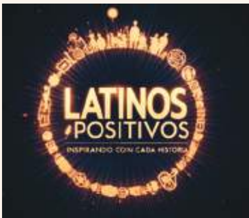
Logo del documental Latinos Positivos.