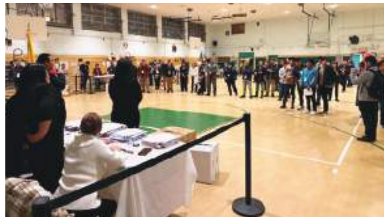
Cierre de las elecciones en New York.