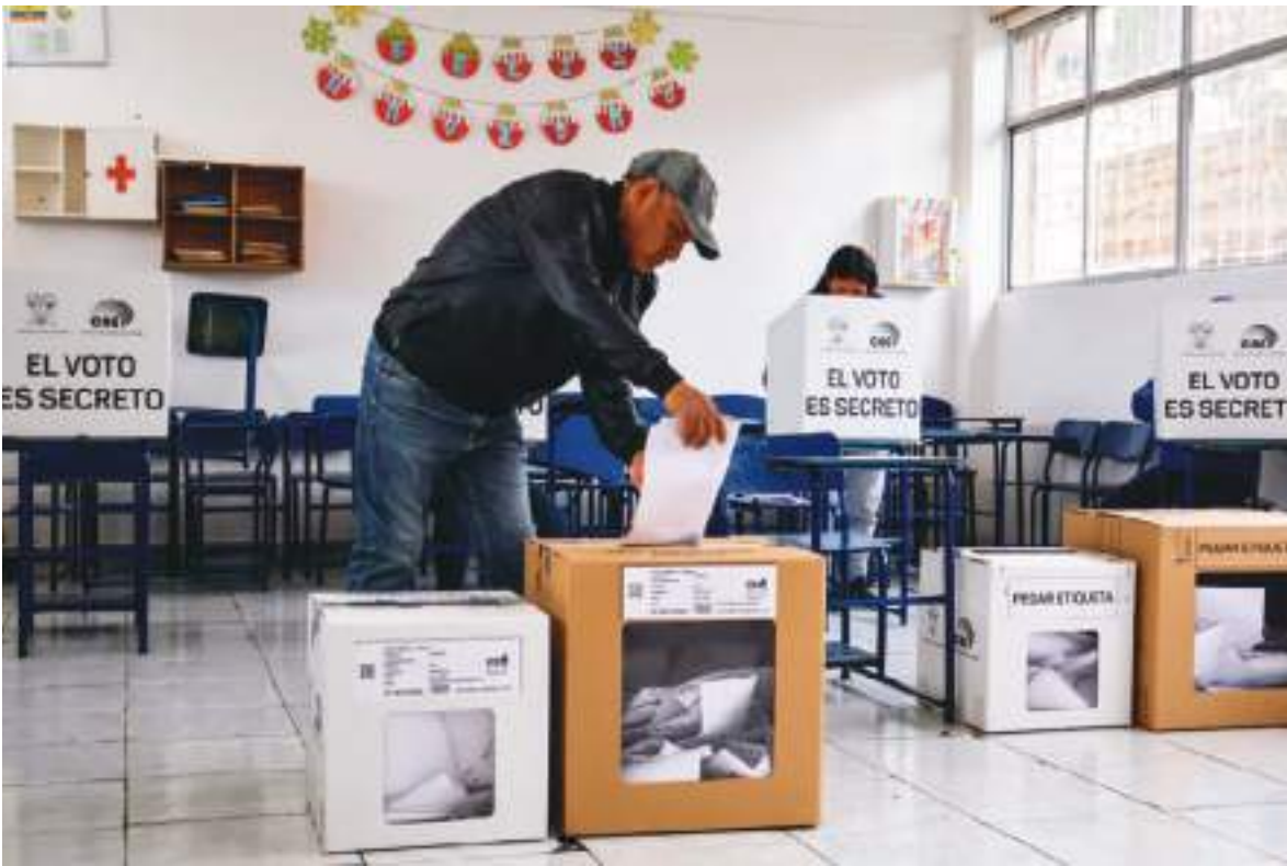
Entrada la tarde del domingo, seguían llegando sufragantes en un clima de mucho patriotismo.

durante el período establecido por el CNE, ser un extremado triunfador y confiado excesivamente en el trabajo que deben hacer otros y no él a título personal.