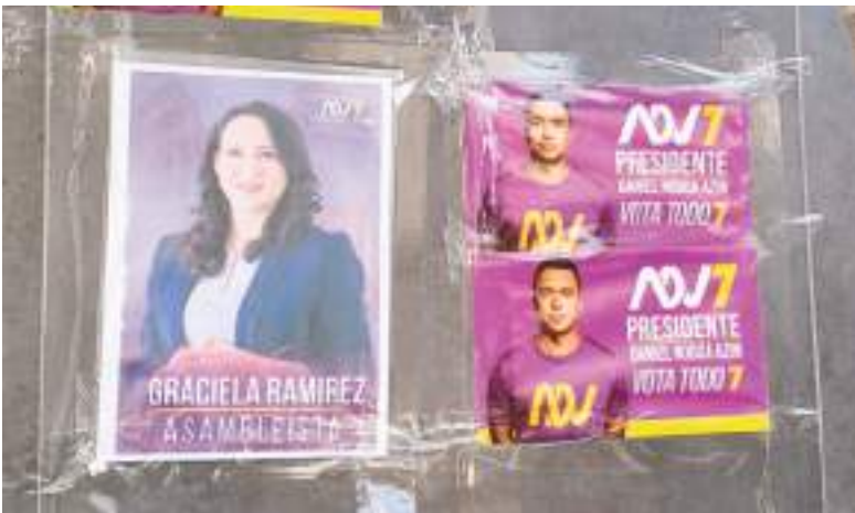
Afiche de la candidata electa de ADN en Elephant & Castle.