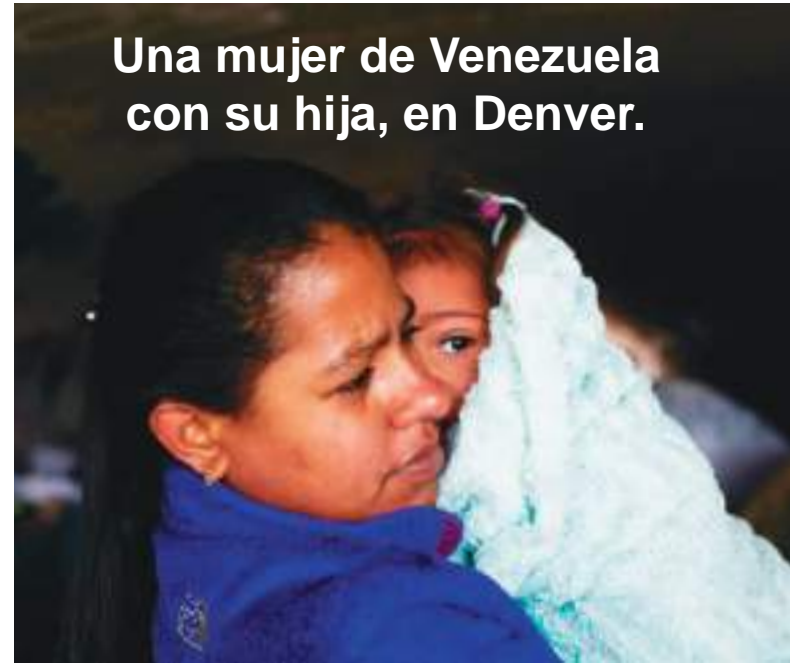
Una mujer de Venezuela con su hija, en Denver.

ha revocado el Estatus de Protección Temporal, o TPS, para más de 300.000 venezolanos en los Estados Unidos, dejando a la población vulnerable a una posible deportación en los próximos meses, según documentos del gobierno obtenidos por The New York Times , que presentó el reciente informe tan negativo para los venezolanos, la mayoría de los cuales son gente de bien pero que