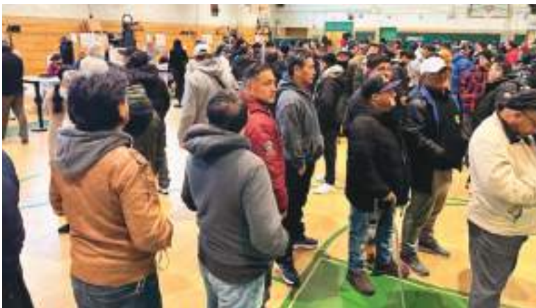
La comunidad ecuatoriana abarrotó el recinto electoral de Queens.

Las personas de la circunscripción de Estados Unidos y Canadá, al verificar su mesa de votación recibieron cuatro papeletas una para Asambleístas Nacionales, otra para Asambleísta por los Migrantes de la Circunscripción USA y Canadá, para que nos represente en la Asamblea, una tercera