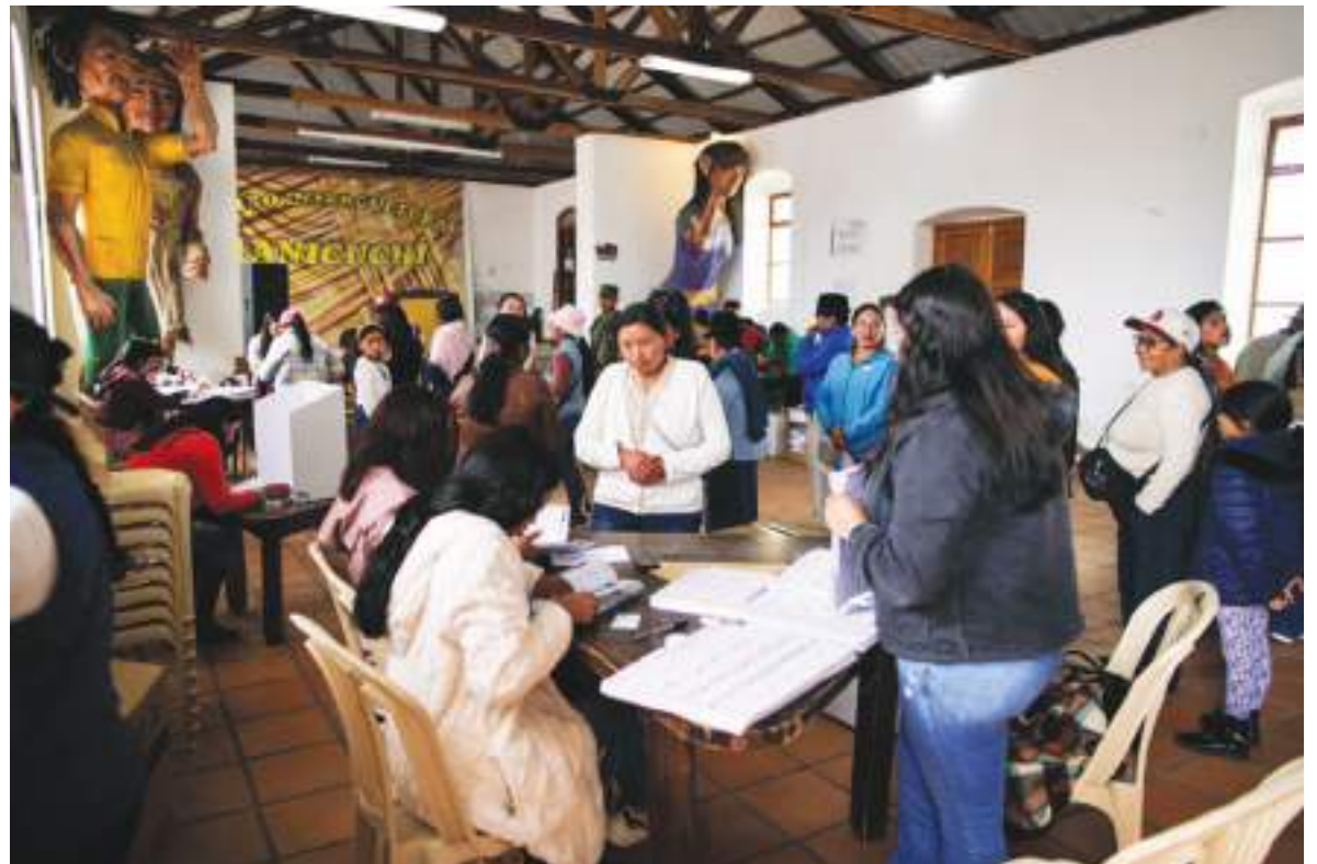
Votaciones en Tanicuchi, Ecuador, el domingo. La segunda vuelta de las presidenciales se celebrará en abril.

presidencia, fue lo más notable y caro que pagó en las urnas, no asistir a entrevistas en muchos medios de comunicación, no dar declaraciones sobre determinadas acciones de interés que se produjeron en el país, el rechazo al diálogo con la vicepresidenta Verónica Abad, no hacer campaña