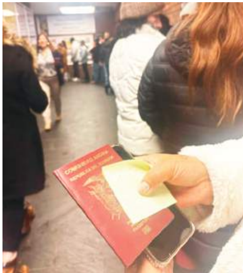
Llevar el pasaporte fue un requisito indispensable para votar. Además, a cada persona se le asignó una mesa específica según su género.

durante la jornada electoral fue mantener un proceso ordenado y respetuoso. “El salón nos quedó pequeño, pero seguimos los proto-