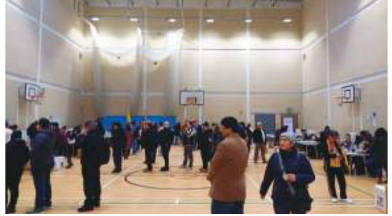
A las 10 de la mañana había un buen número de connacionales votando.