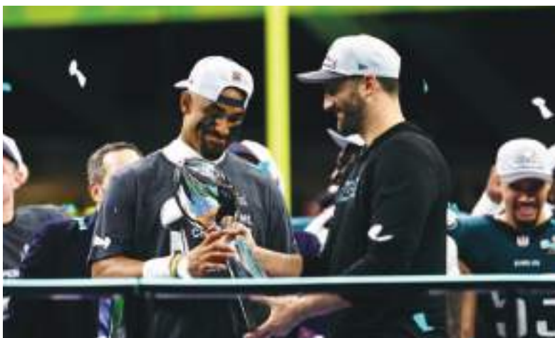
Jalen Hurts y el coach Nick Sirianni tras el triunfo de los Eagles.

Ambos son los únicos QB's que han lanzado al menos 200 yardas y dos TDs, y han corrido al menos 50 yardas y un puntaje con Montana haciéndolo en el Super Bowl 19 contra Miami. Hurts ahora es solo el cuarto mariscal de campo en la historia que pierde su primer titularidad en el Super Bowl y luego gana uno como titular más adelante en su carrera, uniéndose a los miembros del Salón de la Fama John Elway, Bob Griese y Len Dawson.