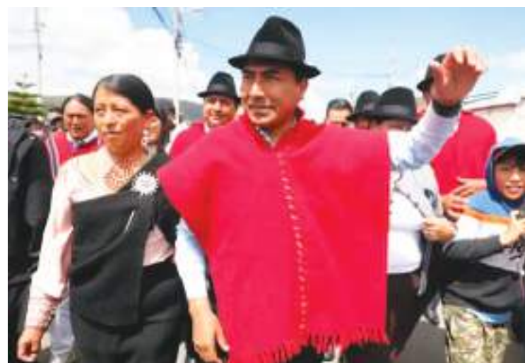
Segundo Leonidas Iza Salazar, candidato de Patchakutik, con su tercer lugar, podría tener la llave para el ganador de segunda vuelta. Con un porcentaje bajo, pero suficiente para inclinar la balanza.

Sin embargo, recuerda que este no es su hogar y que debe ser respetuoso con el país anfitrión que tanto ha hecho por él y su familia. “No me gustaría perturbar la paz y hacer quedar mal a mi país. Cuando uno vive aquí, se adapta a la cultura y valora las oportunidades”, concluyó.