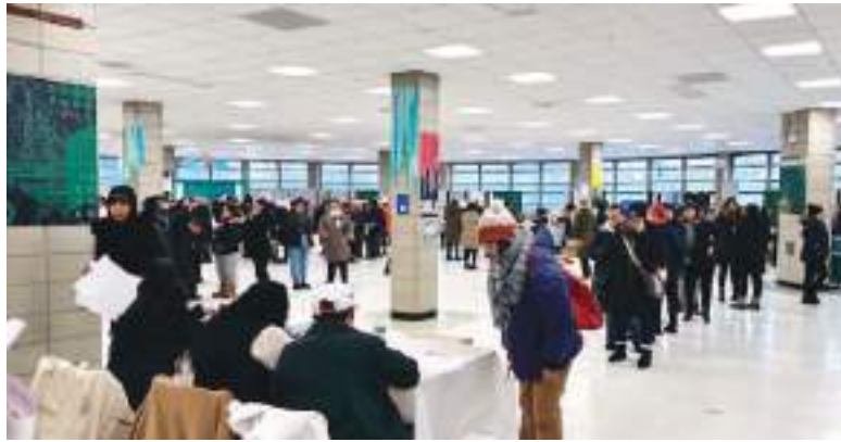
El área de votación para mujeres tuvo una gran concurrencia de votantes.

El actual presidente y también candidato, el Magister Daniel Noboa Azín, obtuvo una gran ventaja en las provincias de la sierra, las zonas montañosas e inclusive en la capital de la República, la ciudad de Quito, mientras que Luisa González, ganó en las provincias de la costa, donde el