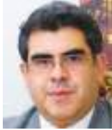
CÉSAR MONTAÑO GALARZA Especial para Ecuador News

H ay muchas señales para pensar que el mundo en la actualidad se debate bajo tensiones generadas en una especie de enfrentamiento de nuevo cuño, determinado por aspectos ideológicos, económicos y tecnológicos, antes que, de índole política o militar, los cuales conciernen especialmente a dos potencias descomunales: China y E.E.U.U. Sobre el tablero de juego global también se encuentran otros ámbitos como el comercio, el medioambiente, la salud, la cooperación, la migración forzada; imposible ignorar que detrás de todo ello se percibe un peligroso tufillo nacionalista.