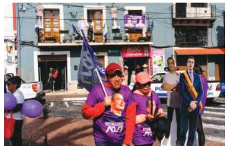
Partidarios de Daniel Noboa, se retiran un poco desencantados.