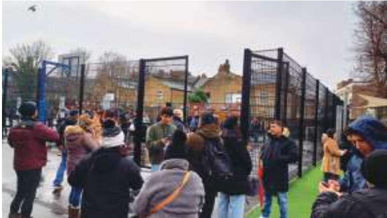
Compatriotas a la cola para ingresar a votar.