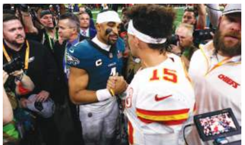
Jalen Hurts y Patrick Mahomes, ganador y perdedor.