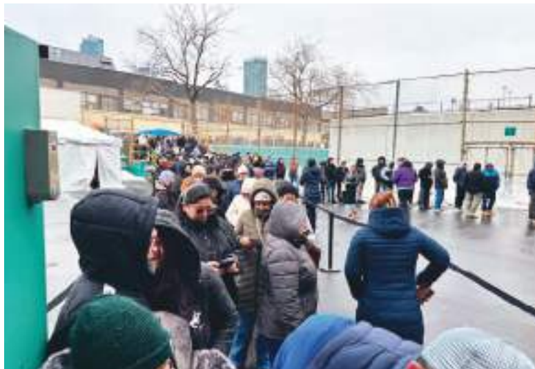
Desde tempranas horas la comunidad ecuatoriana se acercó a hacer fila en el recinto electoral de Queens.

tiempo, tanto en Queens, el Bronx, Long Island y Hudson Valley, donde desde tempranas horas de la mañana la gente se abarrotó a esperar por horas antes de iniciarse las elecciones, sin importarles las inclemencias del tiempo y la situación migratoria que se vive en la actualidad.