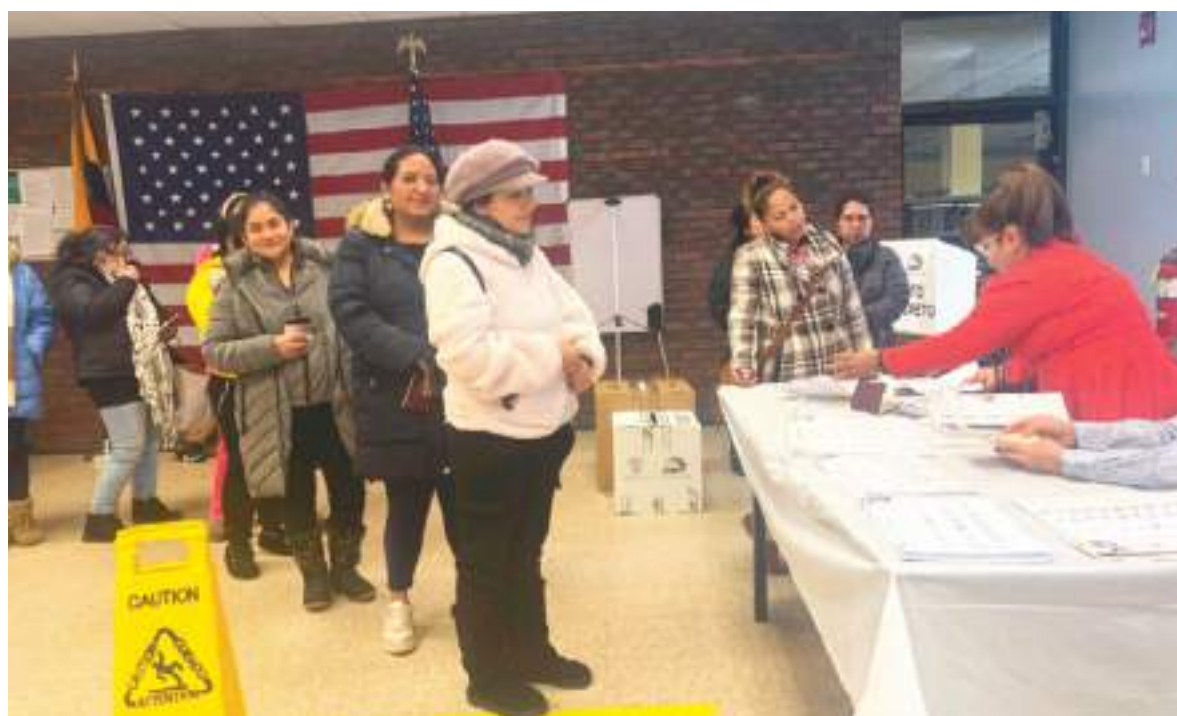
Este año, la presencia de mujeres en las urnas fue notablemente mayor en comparación con elecciones anteriores.