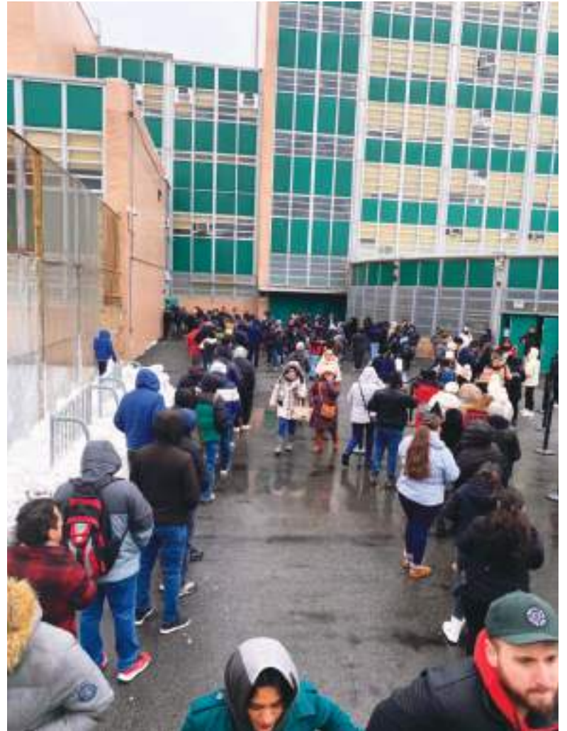
Miembros de la comunidad ecuatoriana ejerciendo su derecho al voto en el recinto electoral de Queens.

Mucha sorpresa causó el resultado de esta primera vuelta, ya que se esperaba un resultado más amplio en la ventaja de ADN sobre RC, pues Daniel Noboa con un