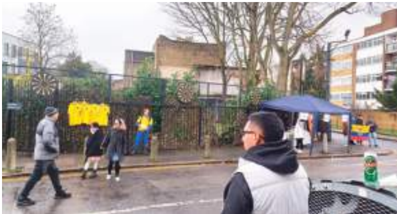
Toma afuera del colegio San Gabriel que por tercera vez es el recinto electoral de los ecuatorianos.