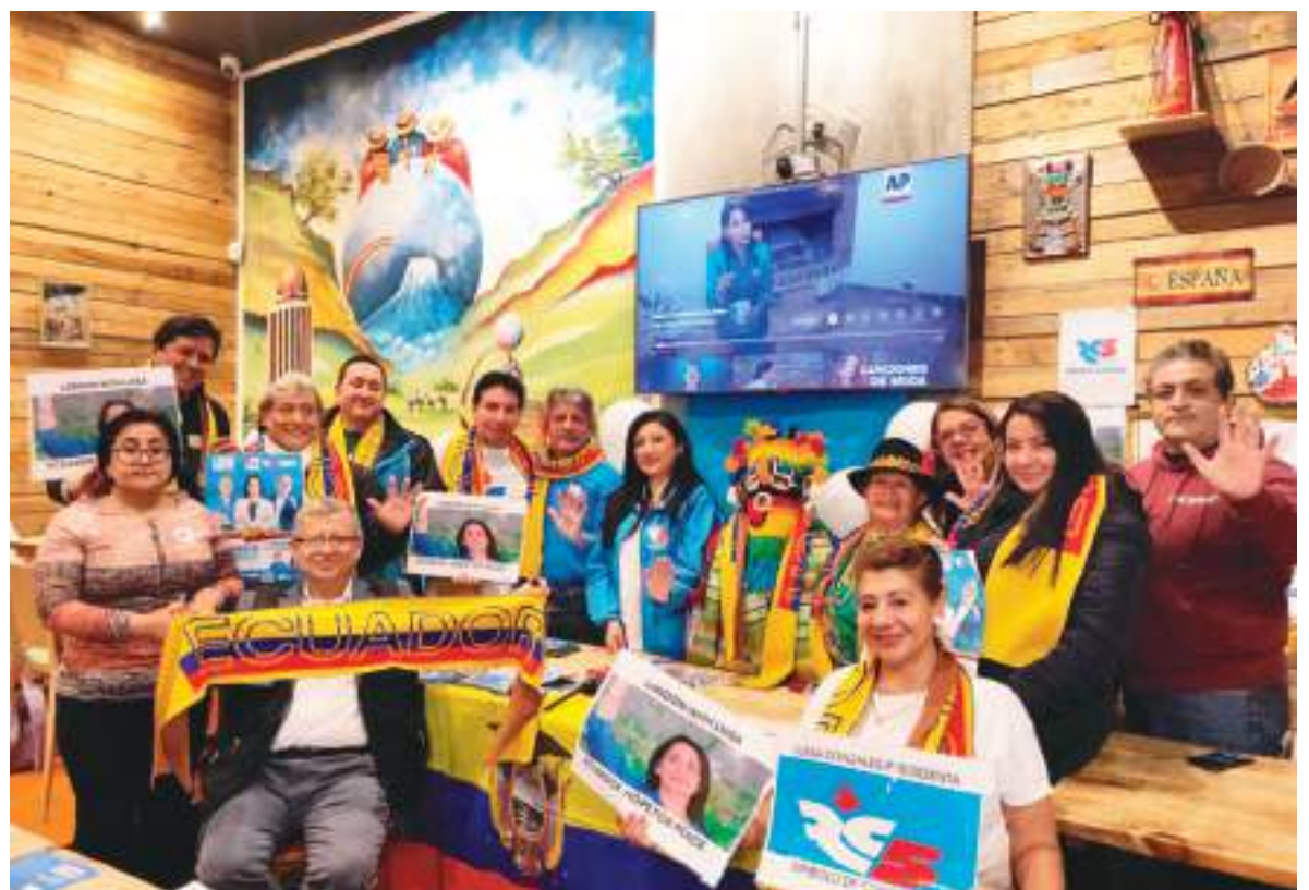
Cierre de campaña de la RC en Londres.