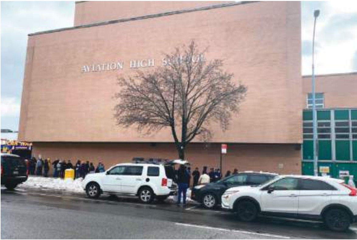
Recinto electoral del condado de Queens, Escuela de Aviación.

44,31% y 4.220,246 votos aventajó a Luisa González con 43,83% y 4.174,940 una cerrada ventaja que los separa, según datos obtenidos del CNE.