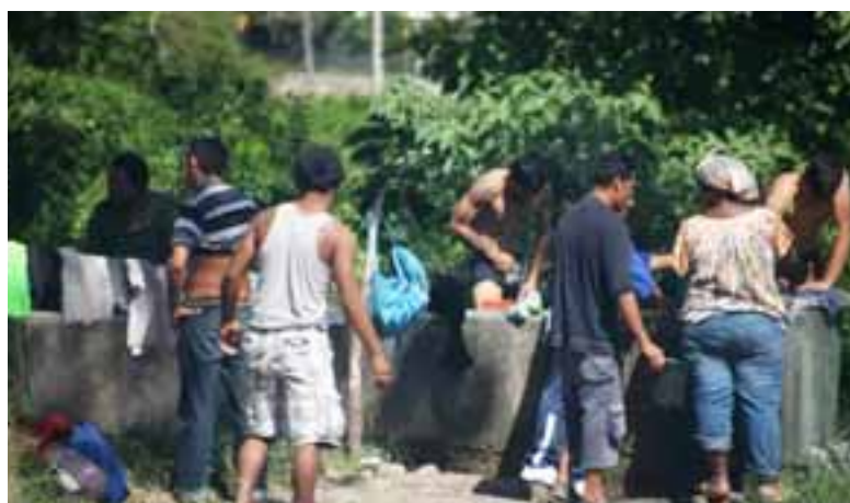
Un beneficiario pudo haber regresado ya a su país de origen.