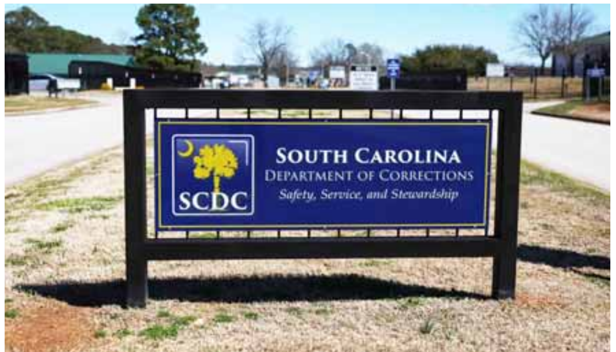
Departamento de correcciones donde se realizó el fusilamiento.