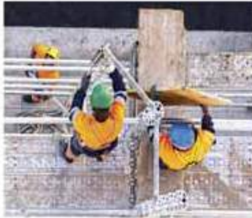
El papel que juega Ginarte en la protección de los trabajadores lesionados

En medio de esta controversia se encuentra el abogado Ginarte, que es reconocido por su