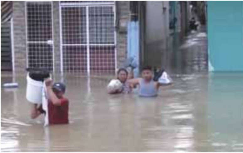
La gente salva lo que pueden

tras el colapso del puente en la calle Imbabura.