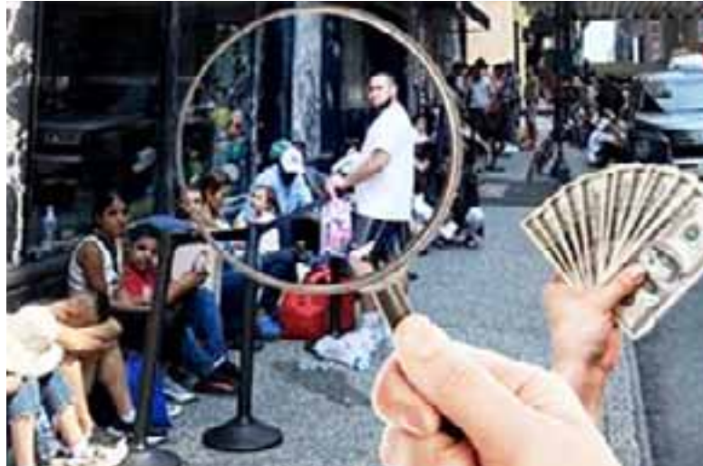
Prácticamente están siendo buscados con lupa los favorecidos.

Esta firma legal, que encabezó la demanda, sospecha que la mayoría de quienes pueden ser beneficiarios son del sur de México, dada la proporción mayoritaria de esa región en la población migrante en