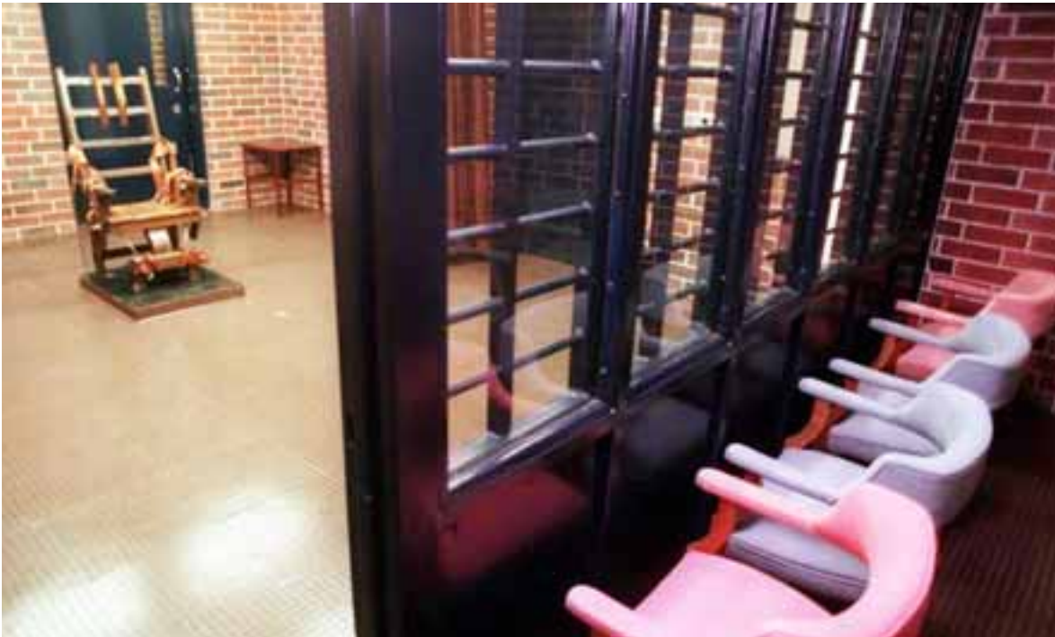
El tétrico escenario de la ejecución.

en el tribunal durante el juicio de 2002.