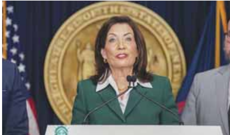
Kathy Hochul, gobernadora del estado de Nueva York

Según datos del Departamento de Impuestos y Finanzas de Nueva