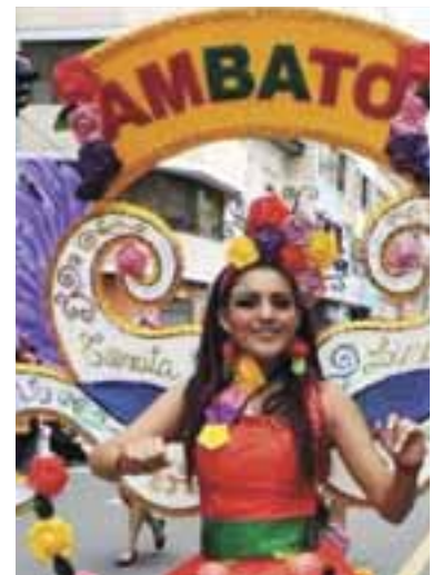
Diversidad y color cultural fueron la tónica de las comparsas en el desfile tradicional de la FFF.