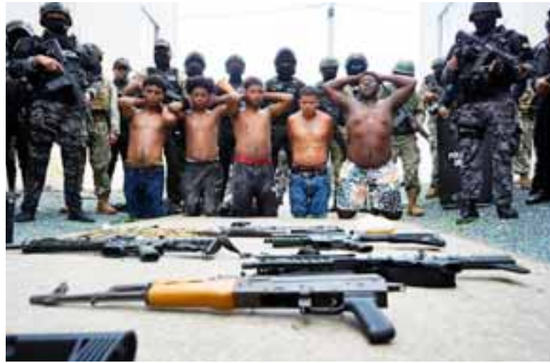
Los detenidos son mostrados a la prensa en Guayaquil.

durante allanamientos a 15 viviendas --que según las autoridades registran antecedentes penales por asesinato, tráfico de drogas, asociación ilícita y otros delitos— se suman a 20 capturados en la víspera a quienes un juez les dictó orden de prisión preventiva por presunto asesinato, informó el general Pablo Dávila, comandante