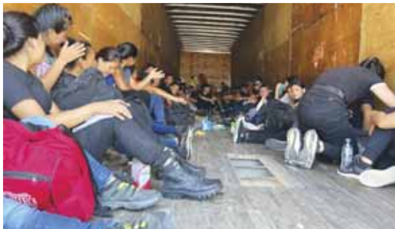
Igualmente al que buscan le tocó complicado su viaje.