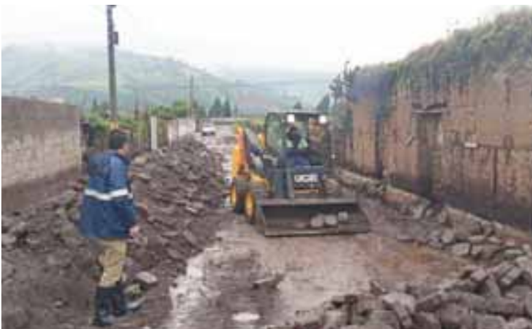
Maquinarias ya efectúan labores de limpieza.

drainar el agua acumulada en las zonas más afectadas, mientras que la Policía Nacional y las Fuerzas Armadas brindaron seguridad y apoyaron en la evacuación de bienes del Hospital Manuel Ygnacio Monteros. Además, el Ministerio de Transporte y Obras Públicas desplegó maquinaria para restablecer la conectividad vial