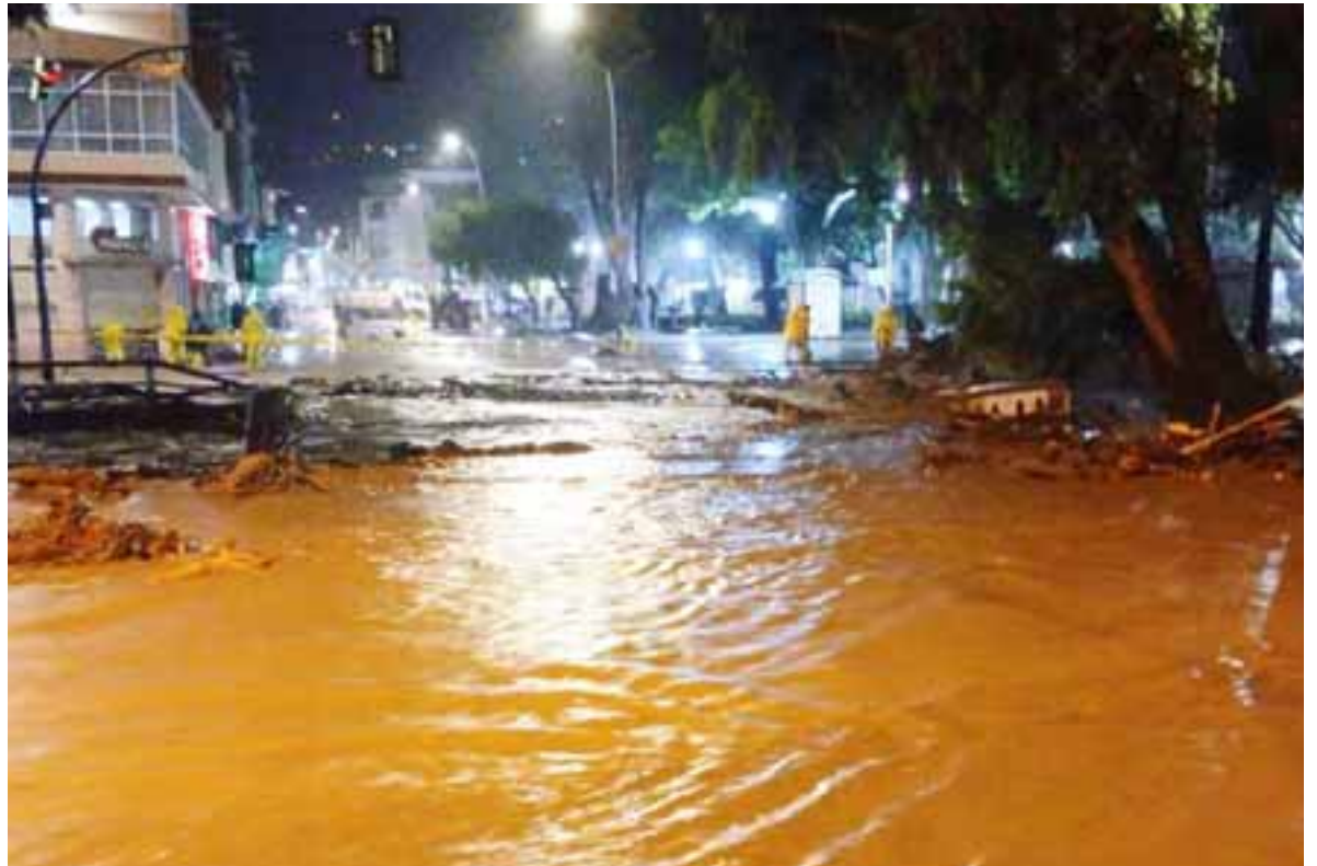
Las aguas no dan tregua, la población ha debido enfrentar a otro enemigo.

Calles enteras quedaron bajo el agua, mientras comerciantes y vecinos intentaban rescatar sus