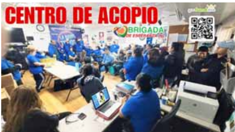
Miembros y Directivos de Brigadas de Esperanza en su Centro de acopio, planificando el futuro de la Institución.

Entre los diferentes servicios que la institución Brinda a nuestra comunidad están; brigadas de salud, exámenes de ojos, pruebas de COVID, cursos de OSHA, talleres de violencia doméstica, mamografías, mental health, impartidas por NYC comisionada, clases de nutri-