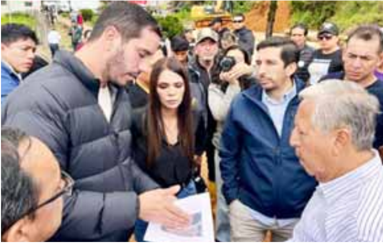
El Ministro de Obras Públicas Roberto Luque estuvo en las zonas afectadas.