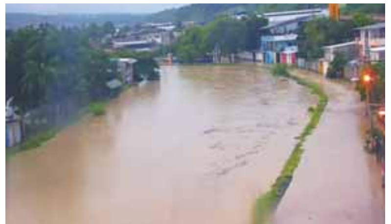
Imagen captada en Manta en las últimas horas.

pertenencias. Según el informe de la SNGR, entre los bienes públicos más afectados se encuentran el Mercado Gran Colombia, el Mercado Mayorista, el Hospital del Instituto Ecuatoriano de Seguridad Social (IESS) "Manuel Ygnacio Monteros" y el Hospital del Día del IESS, que sufrieron el