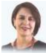
ROSALÍA ARTEAGA SERRANO

Ex Presidenta Constitucional de la República del Ecuador