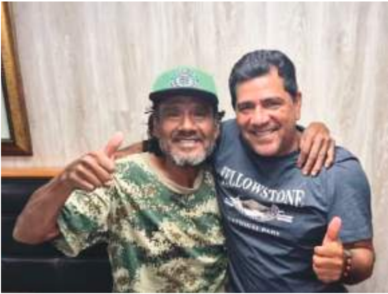
Su hermano fue uno de los primeros en verlo.