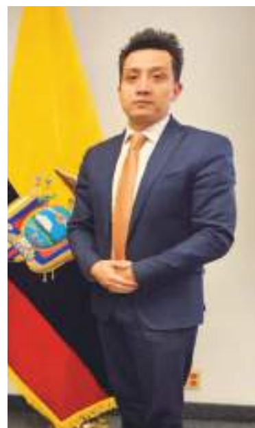
El Dr. Gustavo Velásquez, Cónsul General del Ecuador de New Jersey y Pensilvania será el encargado de inaugurar la segunda vuelta electoral a realizarse el domingo 13 de abril.

Jersey y Pensilvania deberán estar empadronados para ejercer su derecho a votar, están habilitados unos 35 mil compatriotas, mismos que acudirán a los tres recintos electorales ubicados en la ciudad de Newark, Plainfield y Highstown.