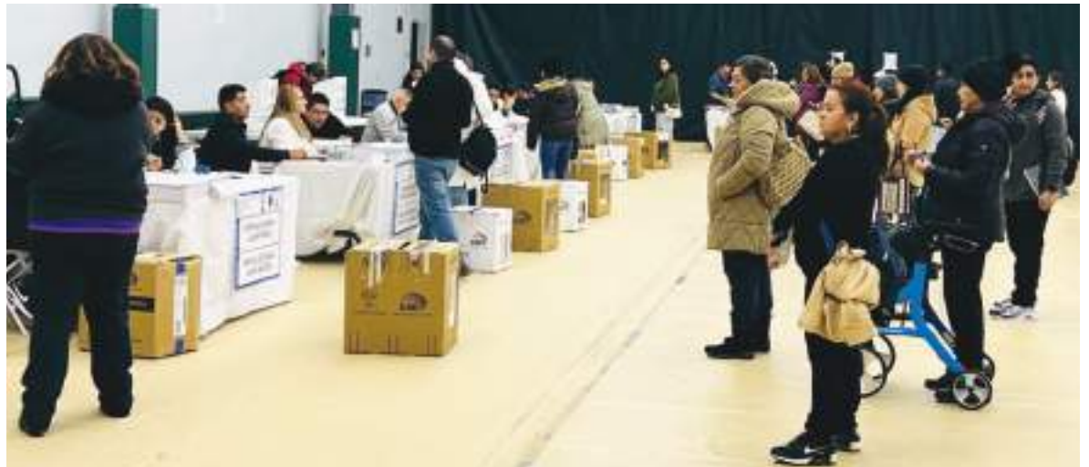
La primera vuelta electoral realizadz el 9 de febrero en Newark, se realizó con absoluta normalidad y orden.