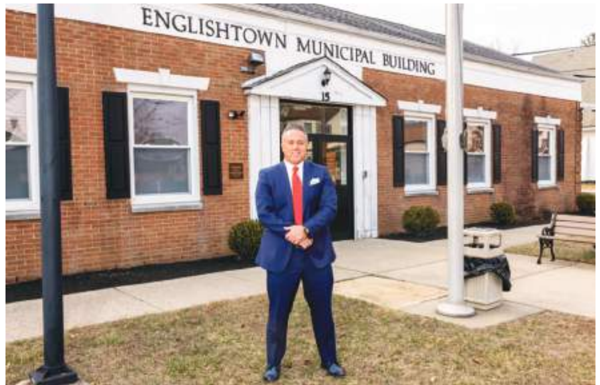
Hoy en día es un orgullo concejal que ha olvidado su anterior vida.

“Sé que realiza mucha labor de divulgación”, añadió el alcalde. “Comparte una visión de desarrollo para nuestro centro local, y creo que será fundamental en este esfuerzo por redefinir el panorama de nuestra comunidad”.