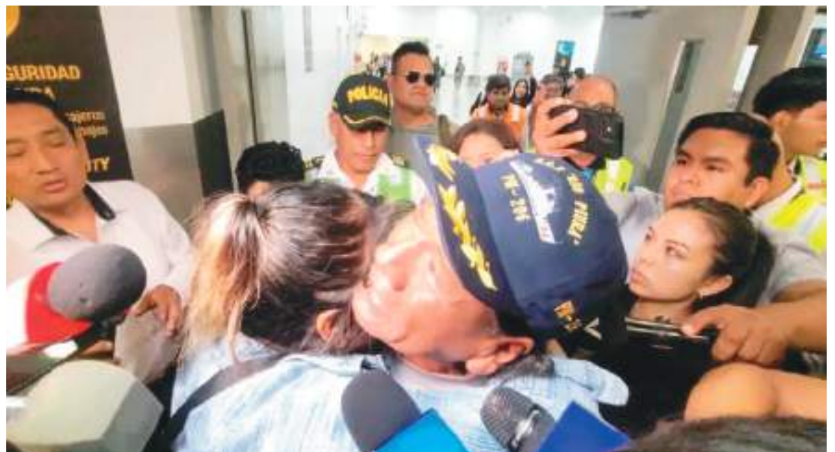
Sus familiares 'enloquecieron en el recibimiento.

“Para su cena vamos a prepararle su sopita porque tiene que seguir fortaleciéndose, tiene un estómago muy sensible por estar tantos días sin comer. El día de mañana le estamos preparando su comida como le gusta, su carapulcra (guiso típico en Perú) y arroz con pato”, concluyó.