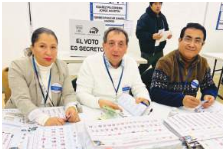
Miembros de las Juntas Receptoras del Voto, se encuentran listos para para la segunda vuelta electoral, numerosas mesas en la ciudad de Newark estarán para sufragar.

Los inmigrantes ecuatorianos que residen en el estado de New