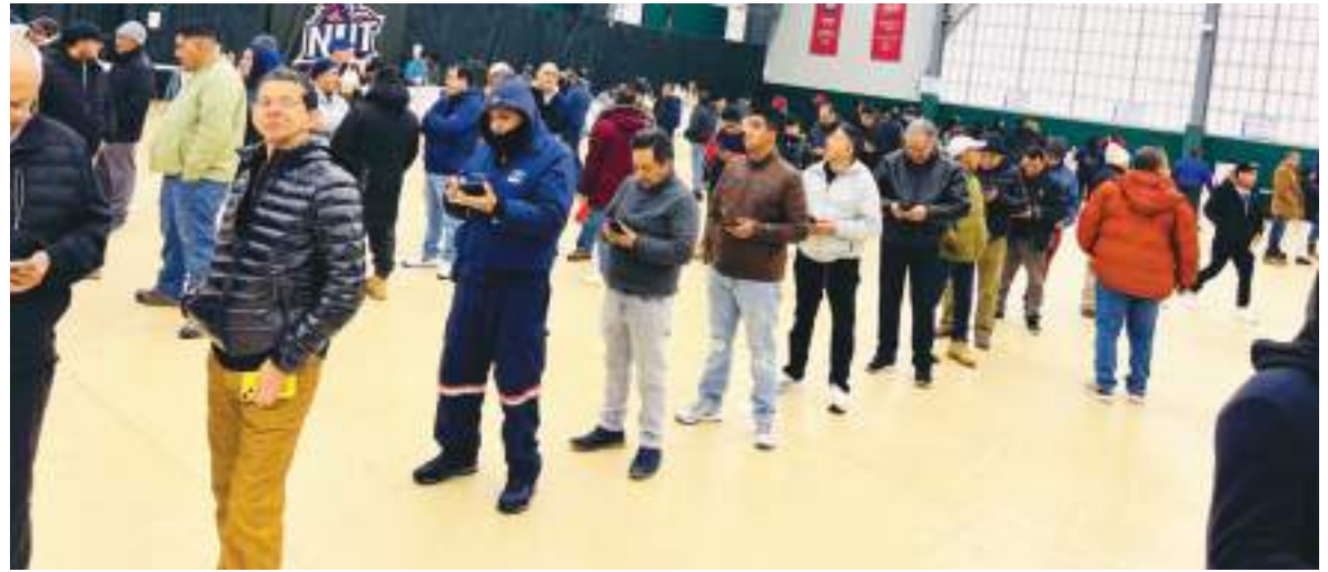
Los ecuatorianos residentes en New Jersey se aprestan acudir a las urnas el domingo 13 de abril.

Cabe destacar que el ganador de este balotaje, también encontrará un país destrozado por las intensas lluvias ya que varias provincias del litoral ecuatoriano se encuentran en emergencia al igual