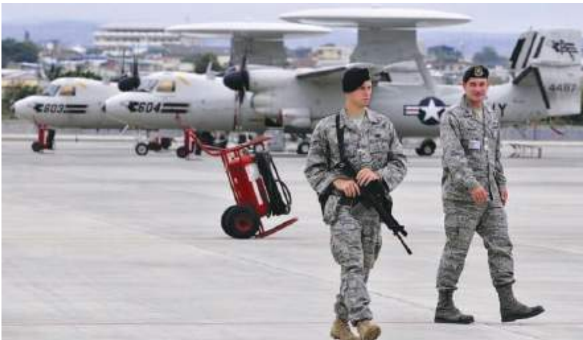
Los militares estadounidenses abandonaron la Base de Manta en 2009, cuando el entonces presidente Rafael Correa puso fin al acuerdo suscrito en 1999.

El Ministerio de Relaciones Exteriores de Ecuador y Mercury Public Affairs no respondieron a las solicitudes de comentarios.