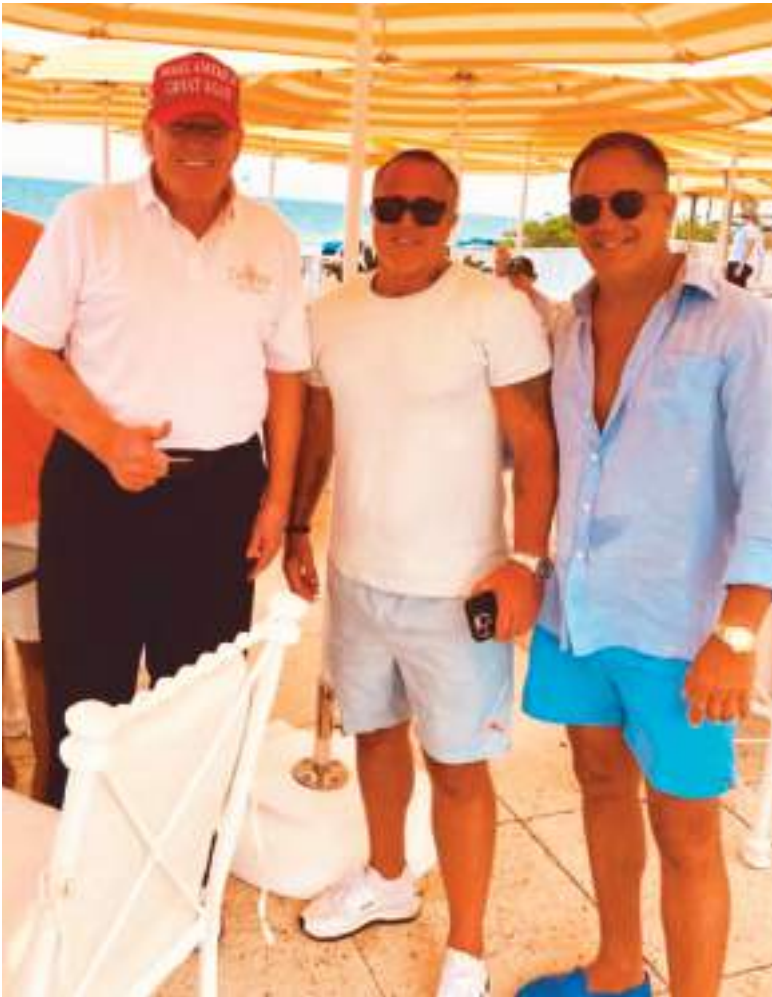
Alite ha sido aliado y contribuyente político de Donald Trump.

en cinco ocasiones. “No es el típico político; cumple con su trabajo; es un adicto al trabajo. Tiene muchísimas buenas cualidades”, dijo Alite, quien, según los registros, ha donado 6.501 dólares a Trump y a otros candidatos republicanos desde 2020.