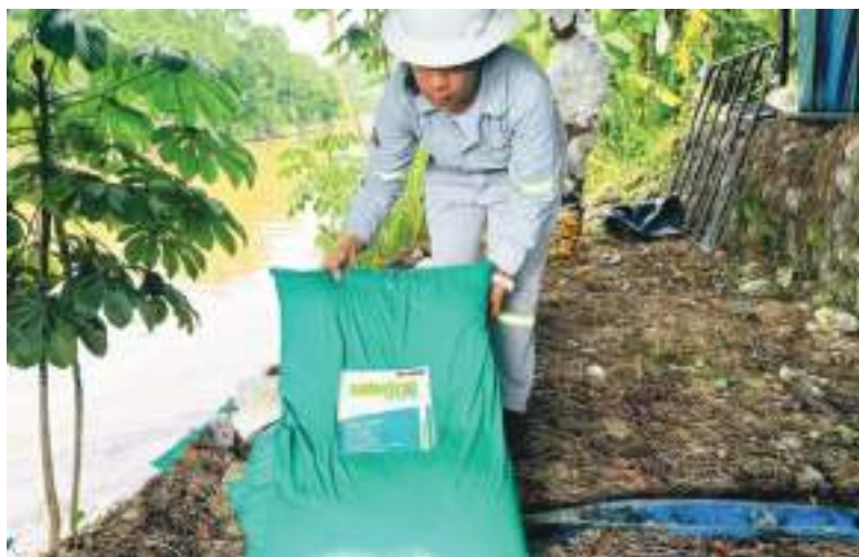
En algunas zonas se usaron sustratos absorbentes para retirar los contaminantes.

El petróleo rápidamente alcanzó los esteros de la zona, contaminando los ríos Caple, Viche y Esmeraldas. En las riberas de estos afluentes, cuenta Guebara, las comunidades se dedican a la agricultura, a la ganadería y a la