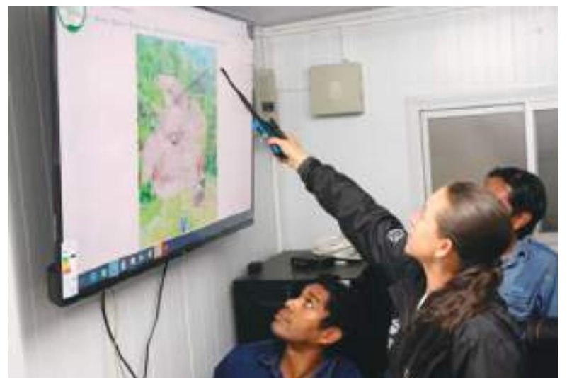
Análisis de la zona del deslave.

El crudo contaminó el río Esmeraldas, del que los cantones Río Verde, Atacames y Esmeraldas se abastecían de agua para potabilizarla. “Esperamos que Diosito,