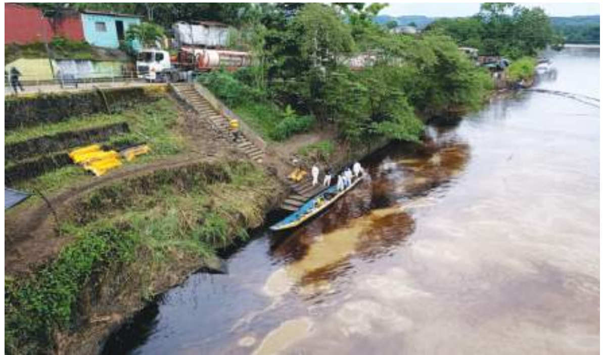
Los ríos de Esmeraldas lucen con manchas negras de petróleo.