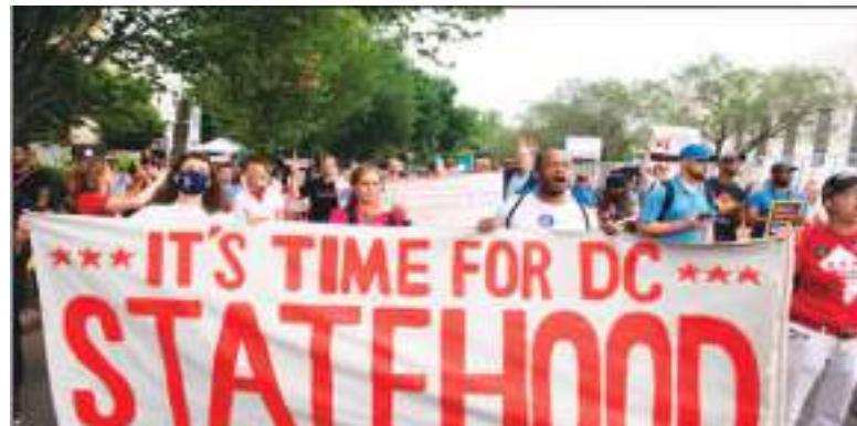
Protesta masiva en Washington D.C. a favor de la estidadad.

Obviamente, los referéndums tampoco han establecido de forma contundente cuál es el deseo de los puertorriqueños para resolver el