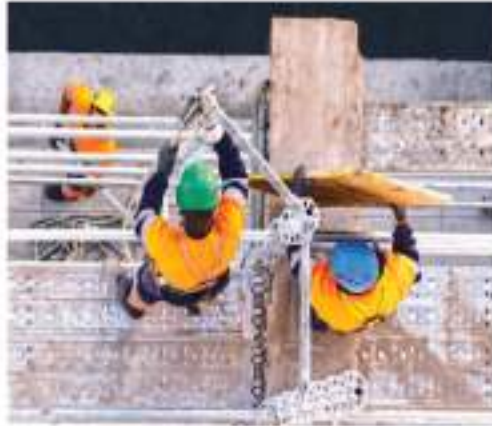
El papel que juega Ginarte en la protección de los trabajadores lesionados

En medio de esta controversia se encuentra el abogado Ginarte, que es reconocido por su