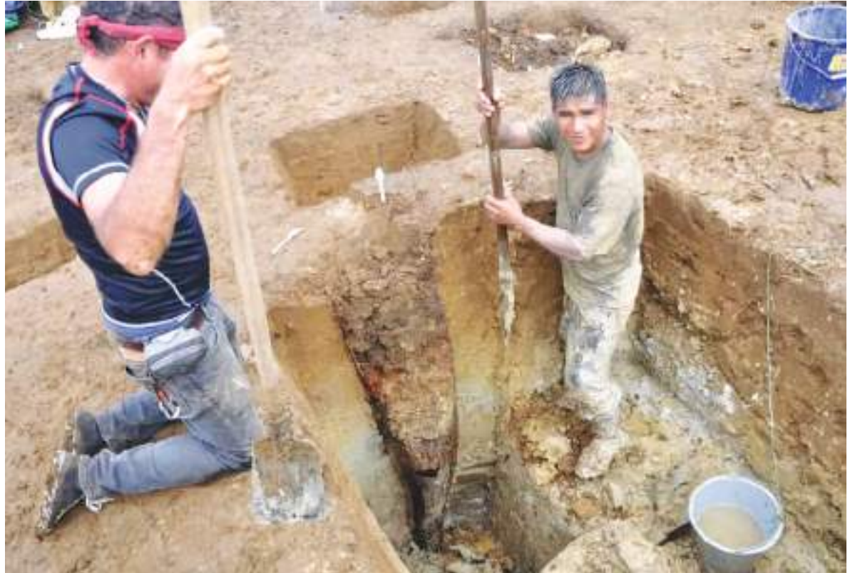
El avance de la arqueología en Ecuador se ha destacado en el mundo entero.

En un estudio publicado el jueves (23 de enero) en la revista Latin American Antiquity , Juengst y sus colegas detallaron este entierro "enigmático" realizado durante el período Manteño (650 a 1532) de la historia de Ecuador, que se caracteriza por cacicazgos complejos de pueblos costeros que se dedicaban a la agricultura y la