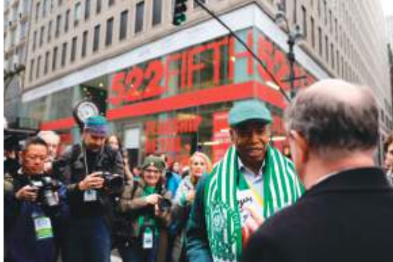
Eric Adams alcalde de NY, fue la gran figura de la Parada en la Gran Manzana.