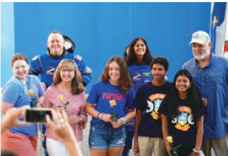
Butch Wilmore y Suni Williams con sus respectivas familias.

La secretaria de prensa de la Casa Blanca, Karoline Leavitt, declaró el miércoles de la semana anterior que el presidente "espera con ansias dar la bienvenida a Butch y Suni al Despacho Oval cuando se recuperen" de su estancia en el espacio.