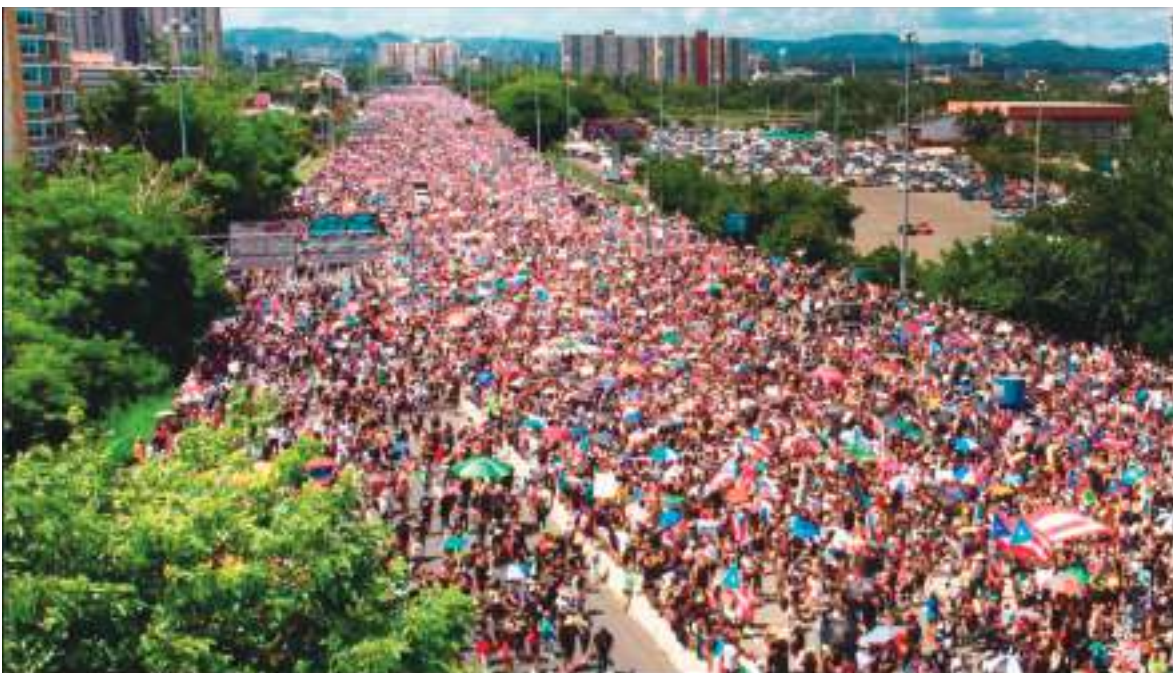
Protesta masiva en Puerto Rico en contra de la estidadad y el Partido Nuevo Progresista.

De modo que, las indecisiones de los puertorriqueños en escoger el estatus político de la isla, podría estar en las manos del Gobierno de Estados Unidos, y no en la inseguridad del voto isleño.