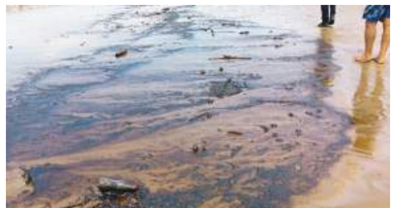
Los hidrocarburos contaminaron los ecosistemas costeros.

El gerente también dijo a la prensa local que “las autoridades nacionales no han informado hasta cuándo será la emergencia y cuándo la EPMAPSE podrá volver a captar agua del río para tratarla”.