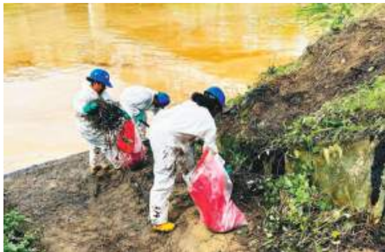
Labores de retiro del material contaminado. Todos siguen trabajando contra el tiempo, esperando proteger a la gente.

momentos”. Según explicó, esto se debe a que el petróleo está emulsionado con el agua.