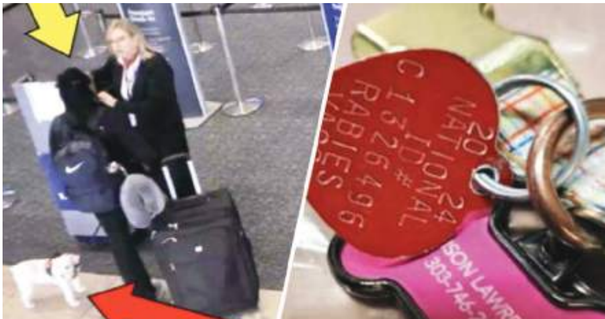
El perrito fue captado por las cámaras de seguridad del aeropuerto cuando su dueña era informada que este no cumplía con los permisos respectivos. A la derecha, los elementos que fueron encontrados junto al animalito.