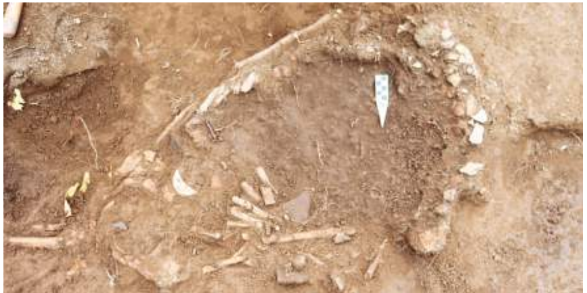
Los hallazgos suelen ser muy fragmentados debido al tiempo transcurrido.