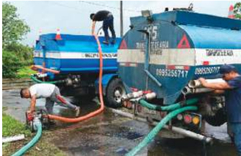
Diferentes instituciones gubernamentales apoyaron para proveer agua mediante tranqueros a la población de Esmeraldas, pero el agua no llegó a todos.

Mientras tanto, la población esmeraldeña espera respuestas sobre el suministro de agua y, de acuerdo con Guebara, diferentes colectivos preparan demandas en búsqueda de justicia y reparación.