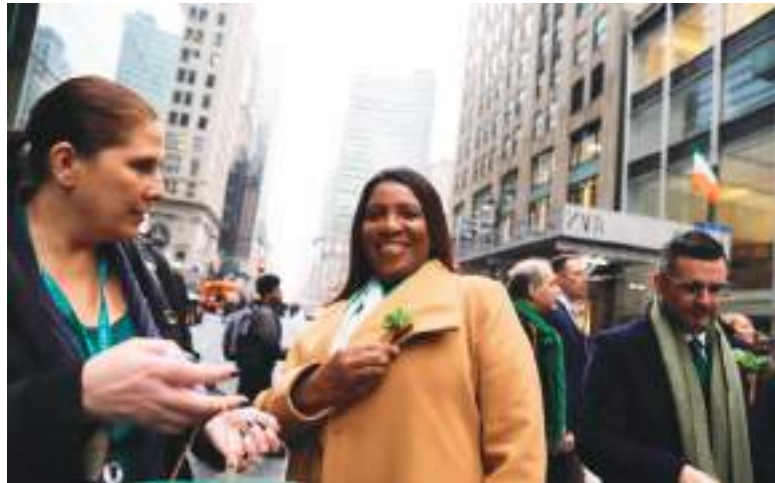
Letitia James, fiscal general de NY, fue también muy aplaudida.