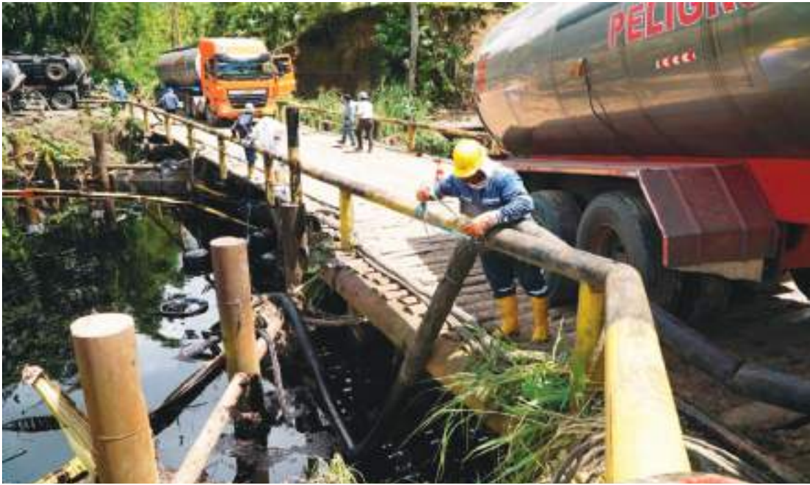
Se recuperaron 90 tanqueros de petróleo mezclado con agua.