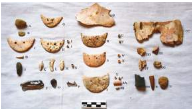
Los artefactos encontrados en el entierro de la mujer embarazada y el feto incluyen adornos de concha de Spondylus en forma de medialuna, hojas de obsidiana y una pinza de cangrejo.

La colocación de los artefactos alrededor del cuerpo de la mujer y sobre su abdomen "sugiere