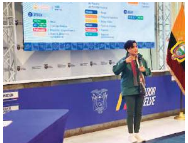
La Canciller Gabriela Sommerfeld durante su participación