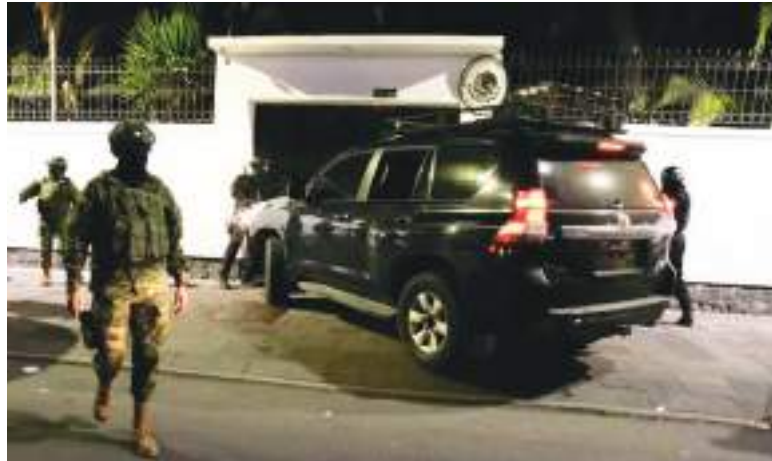
Toma de la embajada mexicana por parte de militares ecuatorianos.

En el momento de su detención, el exvicepresidente, uno de los hombres fuertes dentro del Gobierno del expresidente Rafael Correa (2007-2017), tenía pendiente el terminar de cumplir una pena de ocho años de cárcel por dos casos, mientras que había sido imputado