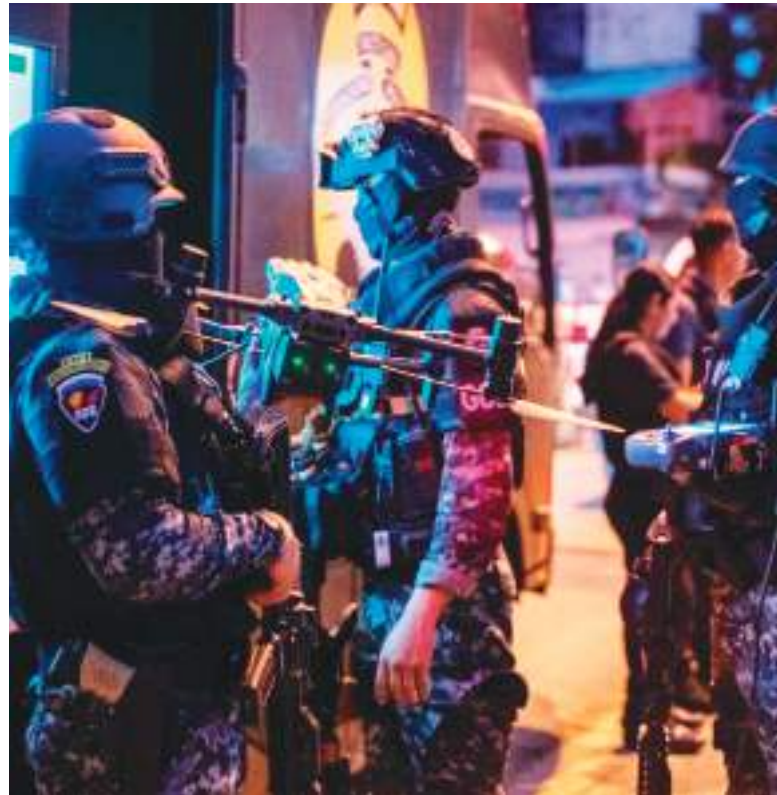
Los lugares sospechosos fueron estrictamente revisados.

Prince, cuya firma fue rebautizada como Academi tras verse involucrada en una matanza en Bagdad, es cercano al presidente