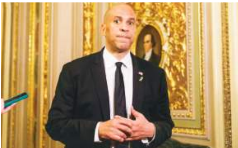
El político muy apreciado por los latinos de Newark, dice tener "su sistema".