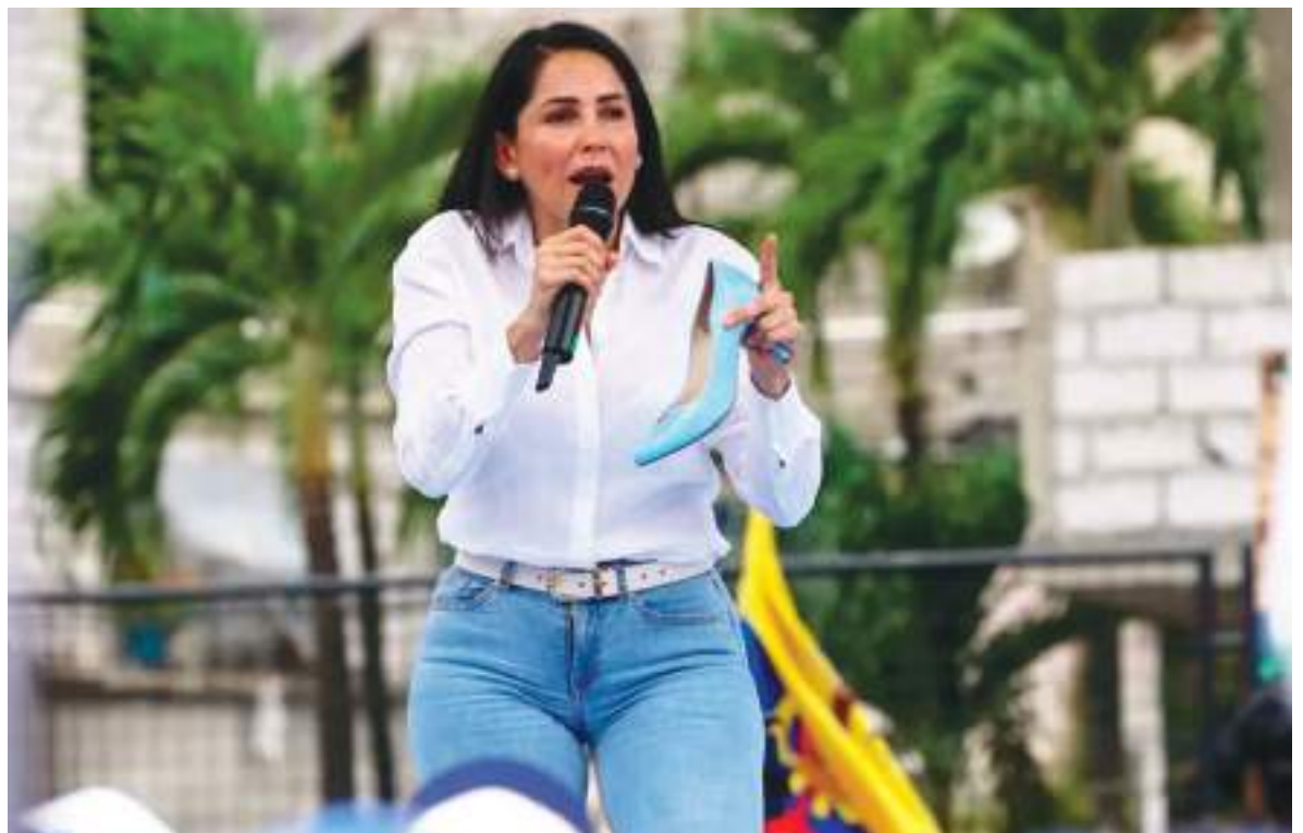
Luisa González sería la primera mujer ecuatoriana en la historia elegida presidenta.

La nueva alianza termina reconfigurando a la izquierda y al progresismo ecuatoriano en una especie de frente "antiderechista".