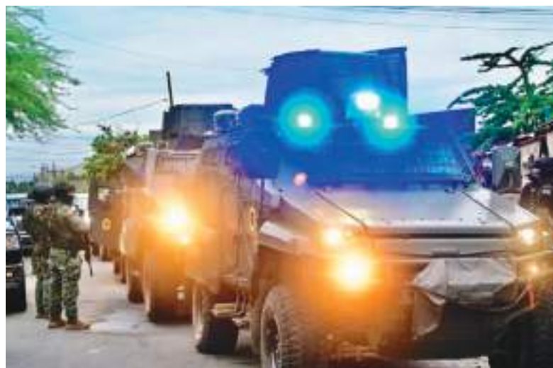
Vehículos especiales fueron usados en Guayaquil.

Prince es un antiguo miembro de la Armada de Estados Unidos. Creó BlackWater para entrenar a marinos y soldados estadounidenses. Su primer contrato con el Gobierno norteamericano se concretó tras el ataque contra el destructor 'USS Cole' en 2000, cuando dos pilotos suicidas de Al Qaeda atacaron el barco en las costas de Yemen que costó la vida a 17 víctimas y heridas a otras 37 personas.