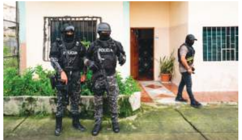
El operativo, en el que participaron 650 policías y militares, incluyó allanamientos de viviendas.