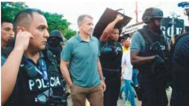
El fundador de Blackwater, Erik Prince, camina con policías durante el operativo anticrimen "Apolo 13" el 5 de abril de 2025 en Guayaquil

litación para consumidores de drogas cuyos internos serían forzados a cometer extorsiones, informó el comandante policial en Guayaquil, general Pablo Dávila.