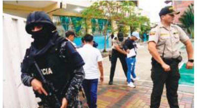
Policías y militares, durante un gran operativo contra el crimen organizado.

El operativo, del que participaron 650 policías y militares, consistió en el allanamiento de viviendas y de centros de rehabi-