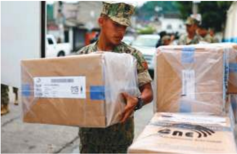
Las cajas electorales siguen llegando a diferentes puntos del país.