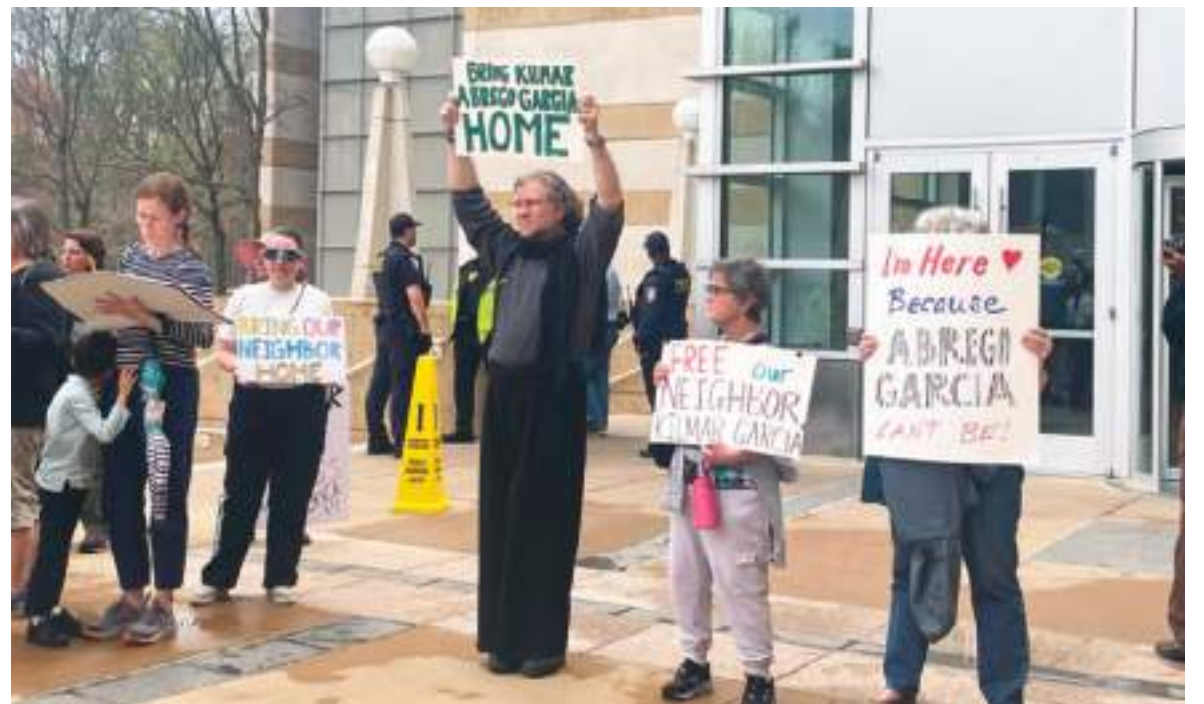
Muchos ciudadanos, latinos y norteamericanos, han expresado el apoyo por el detenido.