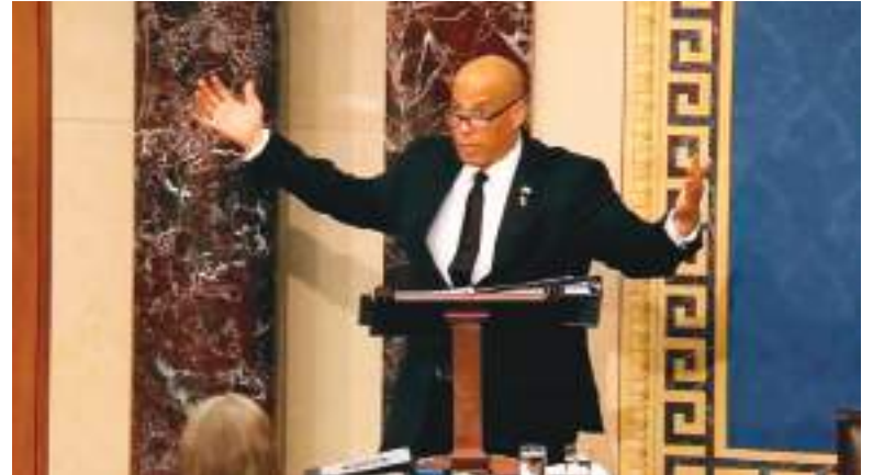
Cory Booker durante su largo discurso.