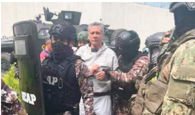
El exvicepresidente Jorge Glas fue la "manzana de la discordia".

Sheimbaum, por su parte, ha dicho que espera que sea la correísta Luisa González, que se enfrentará a Noboa en la segunda vuelta electoral el 13 de abril, quien gane las elecciones presidenciales para que "se puedan restablecer pronto las relaciones de México y Ecuador".