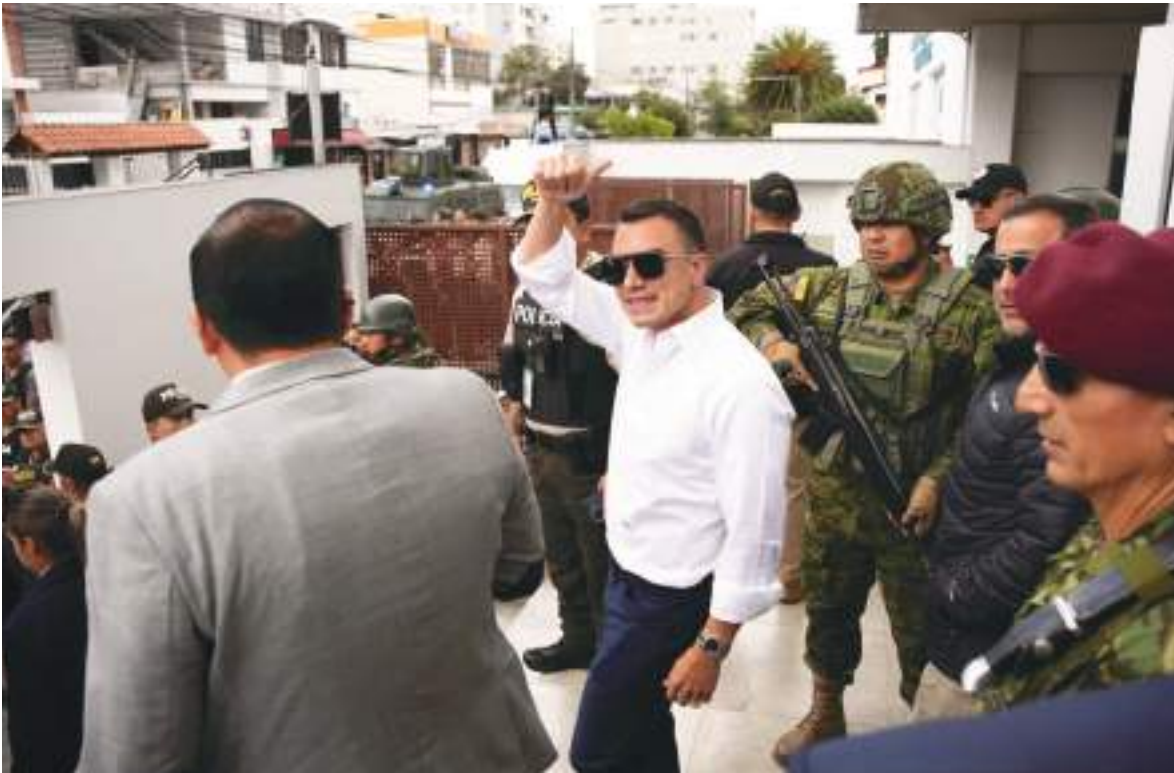
Muy bien custodiado ha adelantado su campaña el presidente Daniel Noboa.