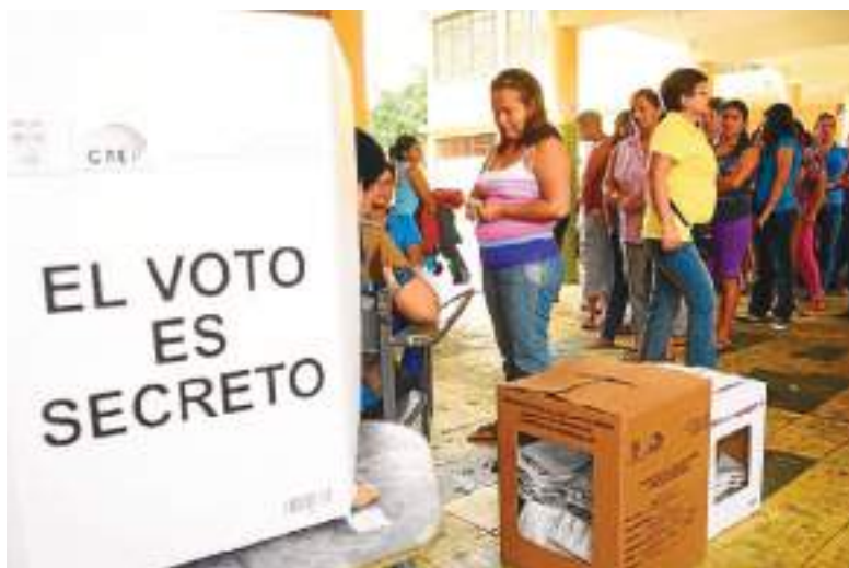
Los ecuatorianos ya están preparados para la fiesta electoral.

A las claras, esta foto con Trump entusiasmará a los electores más duros e ideologizados del