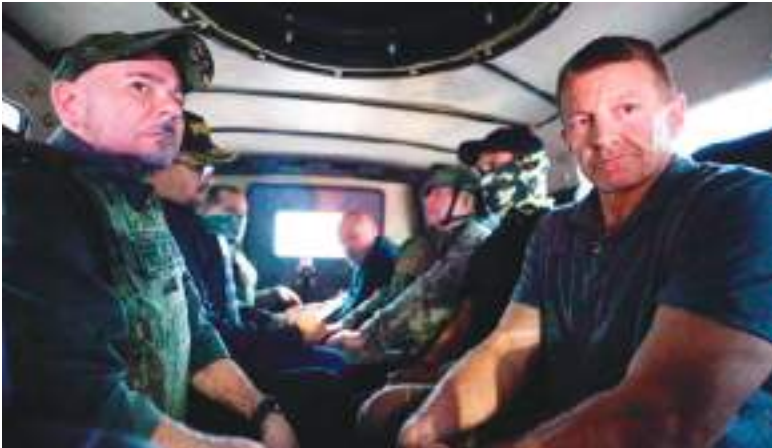
Erik Prince al mando de sus mercenarios y de la tropa ecuatoriana.