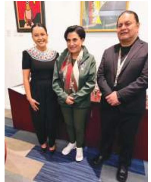
La Canciller Gabriela Sommerfeld junto al Cónsul Vinicio Kar Atamaint y su esposa Elina Intriago,

• Como Ministra de Relaciones Exteriores del Ecuador, ¿como ve usted las nuevas reformas migratorias de parte del actual gobierno de los Estados Unidos?