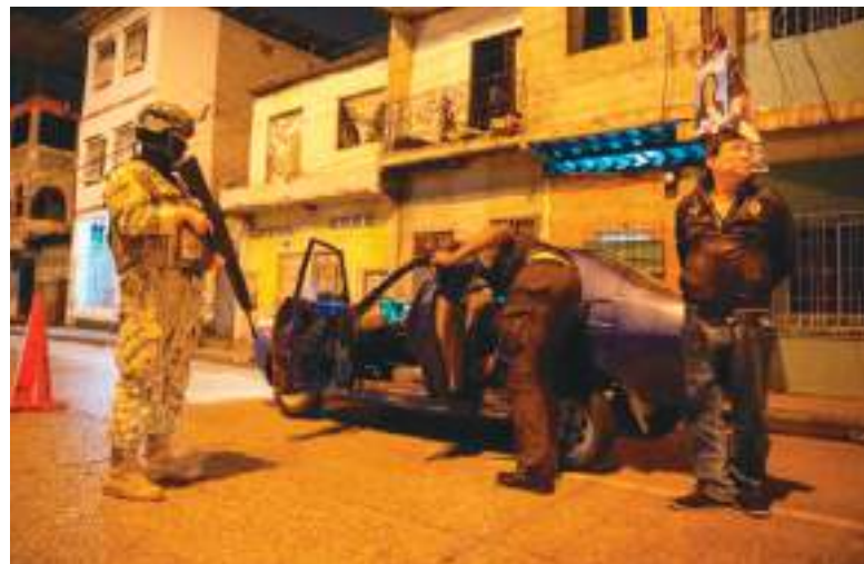
Hasta los vehículos y sus ocupantes no se salvaron de la acción.

estadounidense Donald Trump, a quien ha ofrecido ayuda para las deportaciones masivas de migrantes.