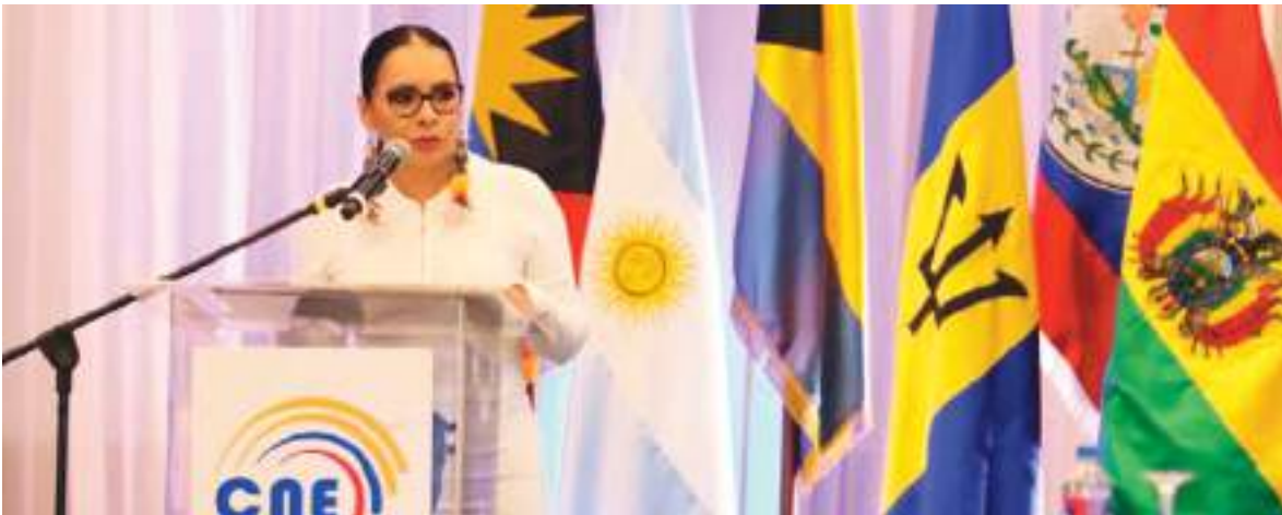
La presidenta del CNE, Diana Atamaint, enfrenta un importante compromiso de mantener la transparencia.

"anticorreísmo", es decir al conservadurismo ecuatoriano. Sin embargo, también podría afectar a los seguidores moderados de Noboa que si bien han votado contra el correísmo, no se alistan en la matriz trumpista. Esto, recordando que el joven empresario ganó en 2023 declarándose de "centroizquierda".