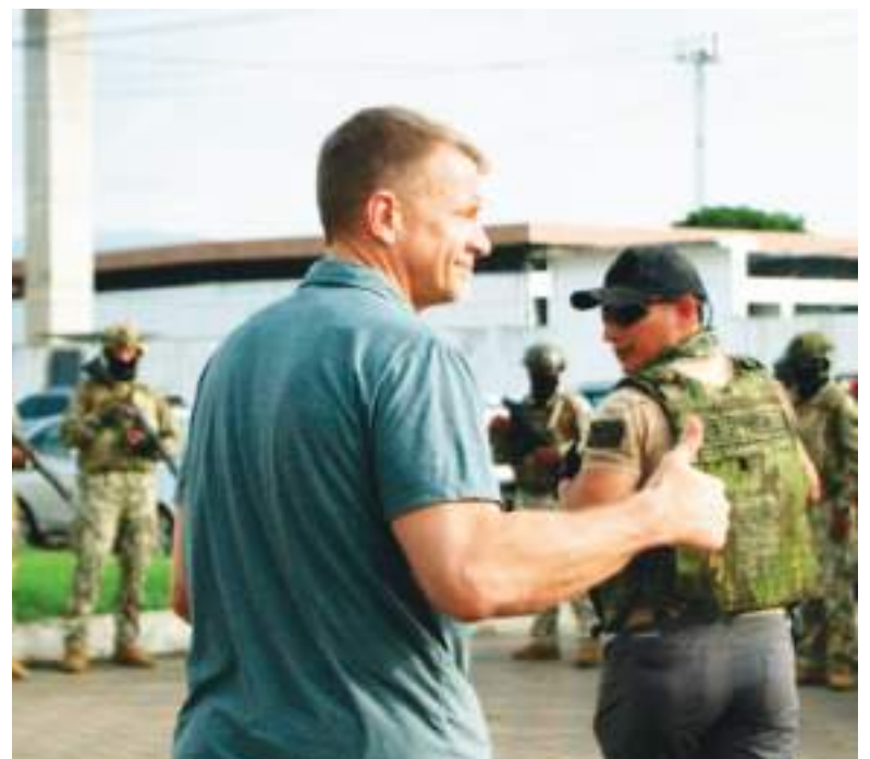
Algún sector del país criticó la llegada de Prince y "sus muchachos".