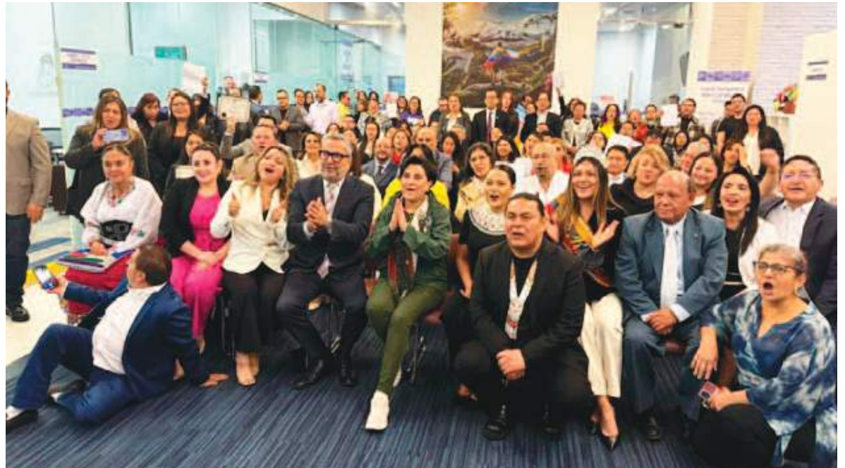
La Canciller junto a la comunidad que la recibió en la Agencia Consular del Ecuador en Queens-Nueva York.

• Particularmente al Ecuador esto no le ha impactado de una forma dramática, si vemos las estadísticas de las deportaciones forzosas, el peor año en las últimas décadas fue el año 2023 con 18.000 deportaciones desde los Estados Unidos hacia el Ecuador, el 2024 estas se redujeron a 13.000, y en lo que se mantiene del 2025 está siguiendo la tendencia de lo que se mantiene del 2024, es decir, dos vuelos semanales y no se han incrementado.