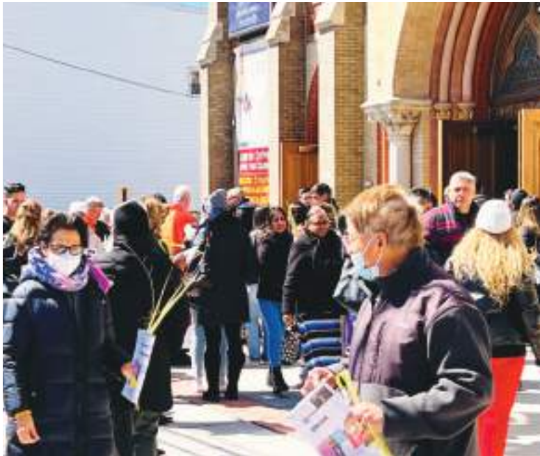
La Semana Mayor iniciando con el Domingo de Ramos en la Iglesia de San José y San Miguel de calle 13 en Unión City.

En el estado de New Jersey, el Viernes Santo es de descanso obligatorio para que puedan disfrutar con sus familias especialmente la hispana en