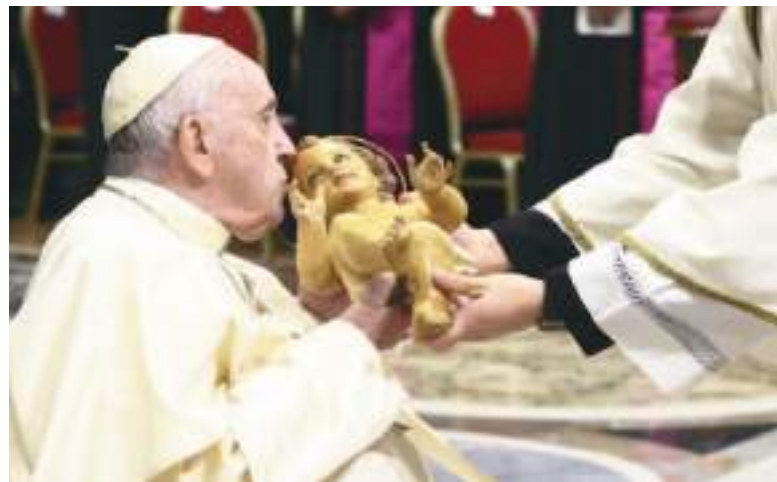
Francisco siempre fue un gran devoto del Divino Niño.

Es la primera vez que el cardenal Cabrera será parte de un cónclave y que, por lo tanto, es elegible para dirigir a la iglesia Católica, y, aunque no cerró las puertas a una posible designación,