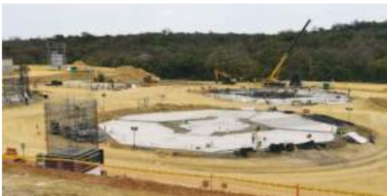
La "Cárcel del Encuentro" está en sus bases preliminares pero no avanza al ritmo prometido.

Si de la primera cárcel se ve poco, de la segunda no hay nada. El terreno destinado está lleno de maleza, constató la AFP.