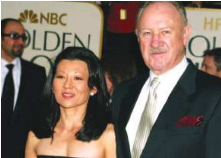
Gene Hackman y su esposa Betsy Arakawa, muerta por el terrible virus.

"En las primeras etapas, entre el primer y el segundo día, se produce el contagio interhumano", explicó el infectólogo Hugo Pizzi.