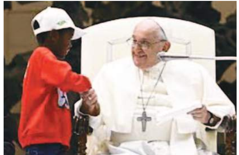
Francisco jamás le negó la sonrisa a un niño.

Entonces, el protodiácono anuncia desde el balcón central de la basílica de San Pedro la elección diciendo Habemus Papam . Por último, el Papa electo sale a dar un discurso y una bendición especial a los fieles.