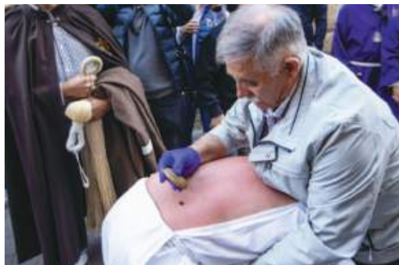
Las picadas son reales y dolorosas.

El práctico es el que pincha la espalda del penitente en seis ocasiones para que salga la sangre. El utensilio que se usa se llama esponja aunque, en realidad, se trata de una bola de cera con seis cristales incrustados de dos en dos. En total, el "picao" recibe 12 pinchazos, en memoria de los 12 apóstoles. "Podría parecer que le