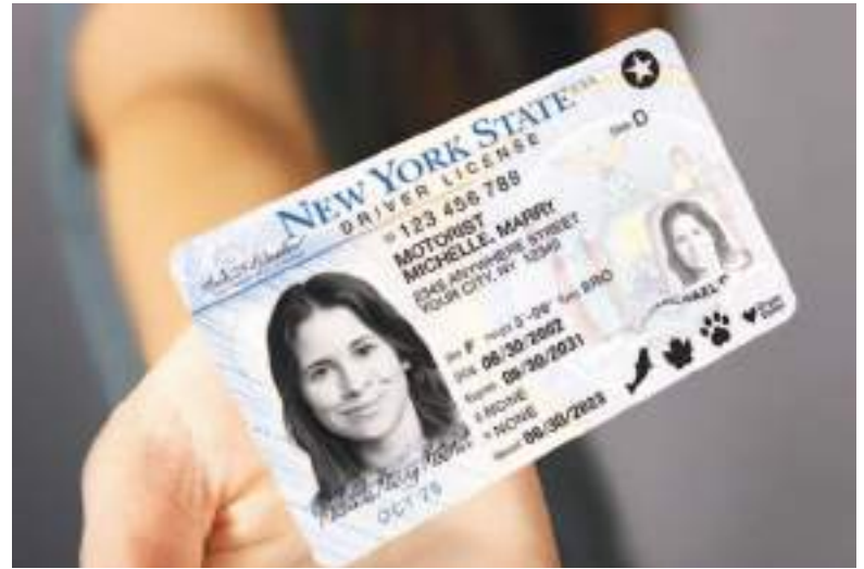
El Real ID se hace indispensable en los actuales tiempos.

ya no aceptará identificaciones estatales que no cumplan con la Ley REAL ID en los controles de seguridad de los aeropuertos.