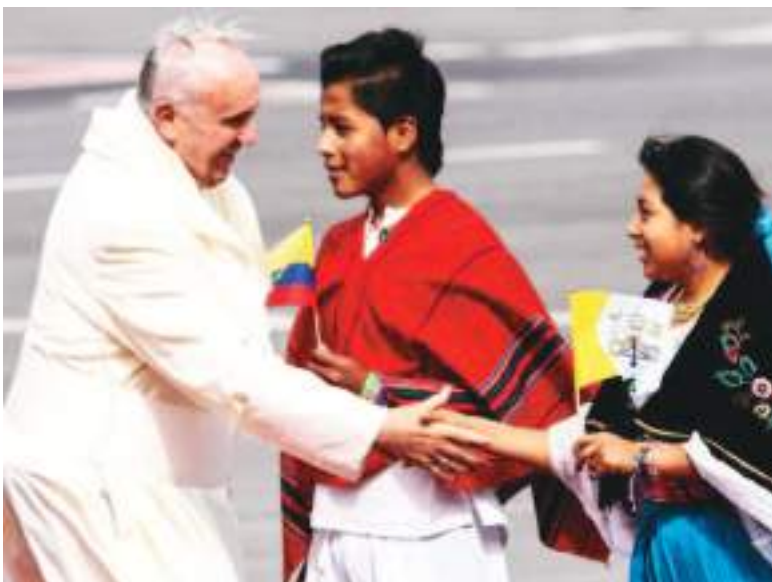
Jóvenes ecuatorianos reciben en su país al Papa Francisco.

Cabrera, que fue designado en octubre como cardenal por Francisco, recordó que Ecuador fue uno de los primeros países latinoamericanos que visitó el papa, en 2015, y que durante su estadía dejó "palabras de esperanza" para la nación.