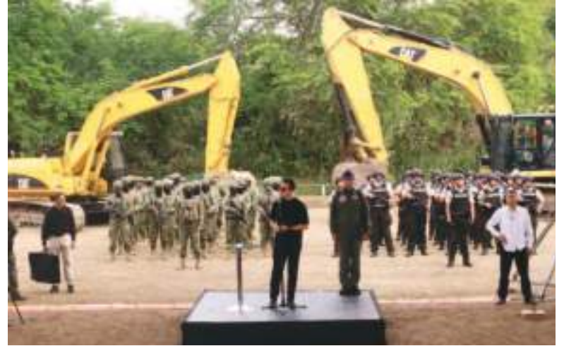
El presidente Daniel Noboa durante el comienzo de las obras.

"A raíz de la explosión se paró todo, pero desde febrero vemos a cuatro o cinco carros ir y venir con material y con militares cada día",