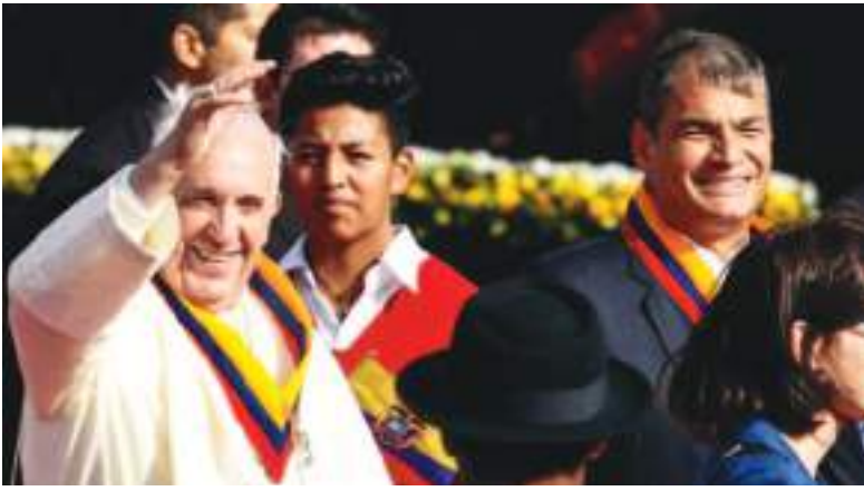
Francisco fue recibido en Ecuador por el entonces presidente Rafael Correa.