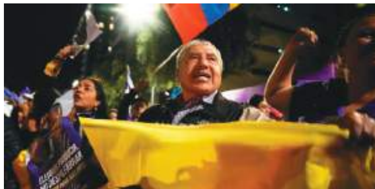
Simpatizantes del presidente Daniel Noboa celebraron en las calles su triunfo electoral, avalado por la Unión Europea y la OEA.

a leer los resultados de cada provincia y ninguno de los cinco consejeros presentes tuvo alguna observación.