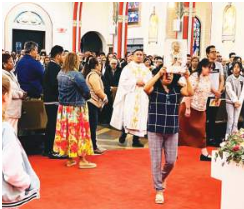
En la iglesia de San Antonio de Padua, calle 8 en Unión City: Fervor religioso el Domingo de Pascua de Resurrección, es la fiesta central del cristianismo