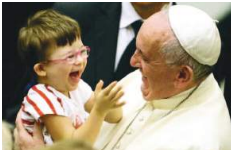
A donde quiera que iba, el Papa Francisco mostraba especial cariño con los niños, cuyas sonrisas para él constituían el mejor premio.