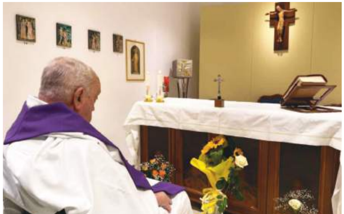
Este fue el comienzo del fin. En su primer día de hospitalización, oró durante muchas horas.

Lo primero que se hace para elegir a un Papa es solicitar la presencia de todos los cardenales en una misa, dada en la basílica de San Pedro por el decano del Colegio Cardenalicio. Luego, cantan el “ Veni Creator ” en la Capilla Paolina para invocar al