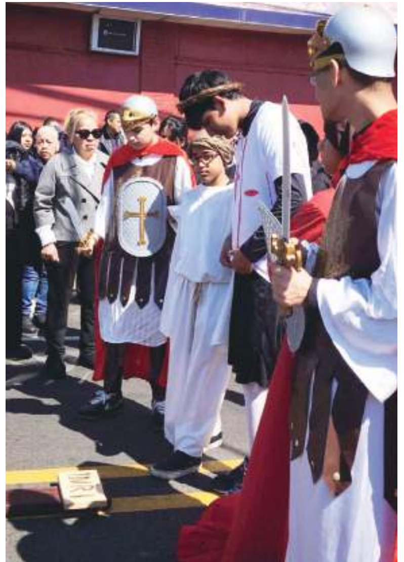
En la ciudad de Passaic: escenificando el Viacrucis en una de las calles de la ciudad, caminando con el Señor en la Semana Santa, evento religioso a cargo de la iglesia San Antonio de Padua.

general quienes son católicos, mientras que en algunas ciudades las escuelas cerraron para el receso de primavera y durante la Semana Santa, para el Domingo de Pascua, las grandes tiendas como Walmart, Macy's, Kohl's, Target, Cotsco, JCPenney, etc. cerraron sus puertas al público.