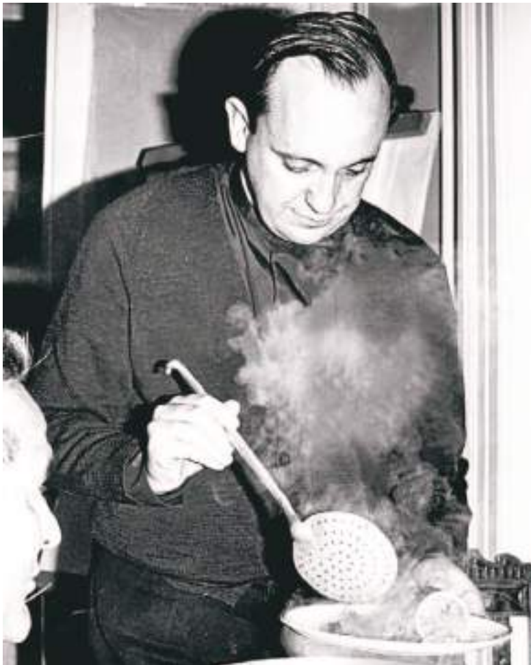
De joven, el padre Bergoglio le cocinaba a la gente pobre.