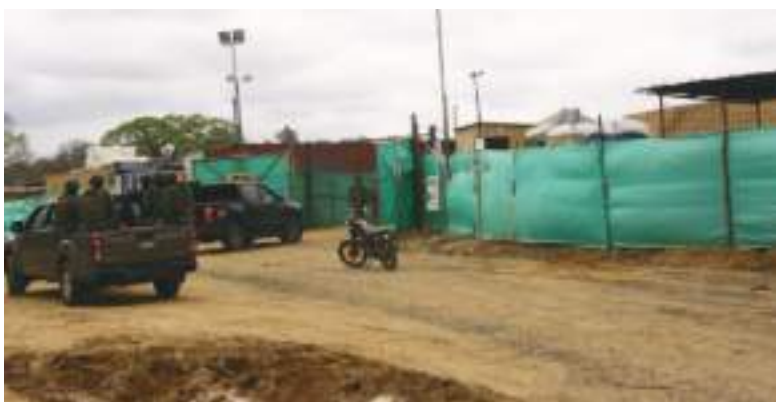
Los lugareños han criticado la construcción de la "Cárcel del Encuentro".