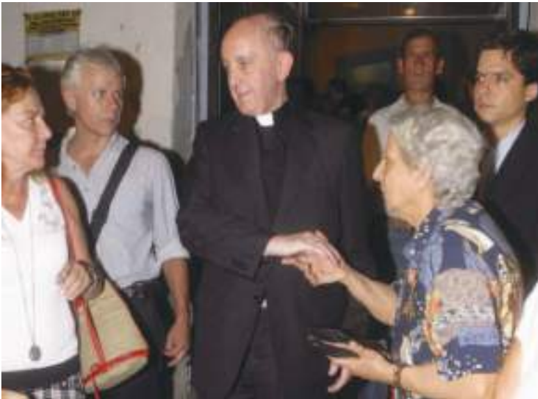
La gente mayor y los inmigrantes eran personas a la que él brindaba la mejor atención, por eso todos lo van a extrañar.

vota al nuevo pontífice, tal como explica la Agencia Católica de Informaciones- ACI Prensa.