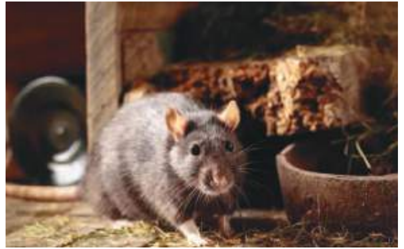
El contagio se produce por contacto con roedores, pero también entre humanos. Una enfermedad de la que apenas ahora sabemos.

El 'hantavirus' es una peligrosa afección causada especialmente por el contacto con ratones. Vino a conocerse debido a la muerte por esa causa de Betsy Arakawa, la esposa del reconocido actor Gene Hackman, quien también perdiera la vida horas después que ella. La nueva noticia es que en Argentina se han detectado rastro del letal virus.