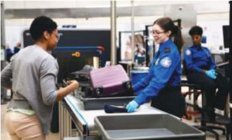
Los oficiales del TSA tienen instrucciones precisas.

"Cuando un agente fronterizo decide que alguien no es admisible, no significa necesariamente que una persona tenga antecedentes penales o sea un riesgo para la seguridad pública; más bien, a menudo significa que el individuo simplemente no tiene una visa vigente u otros documentos que cumplan con el estándar para hacerlos admisibles", indica el reporte.