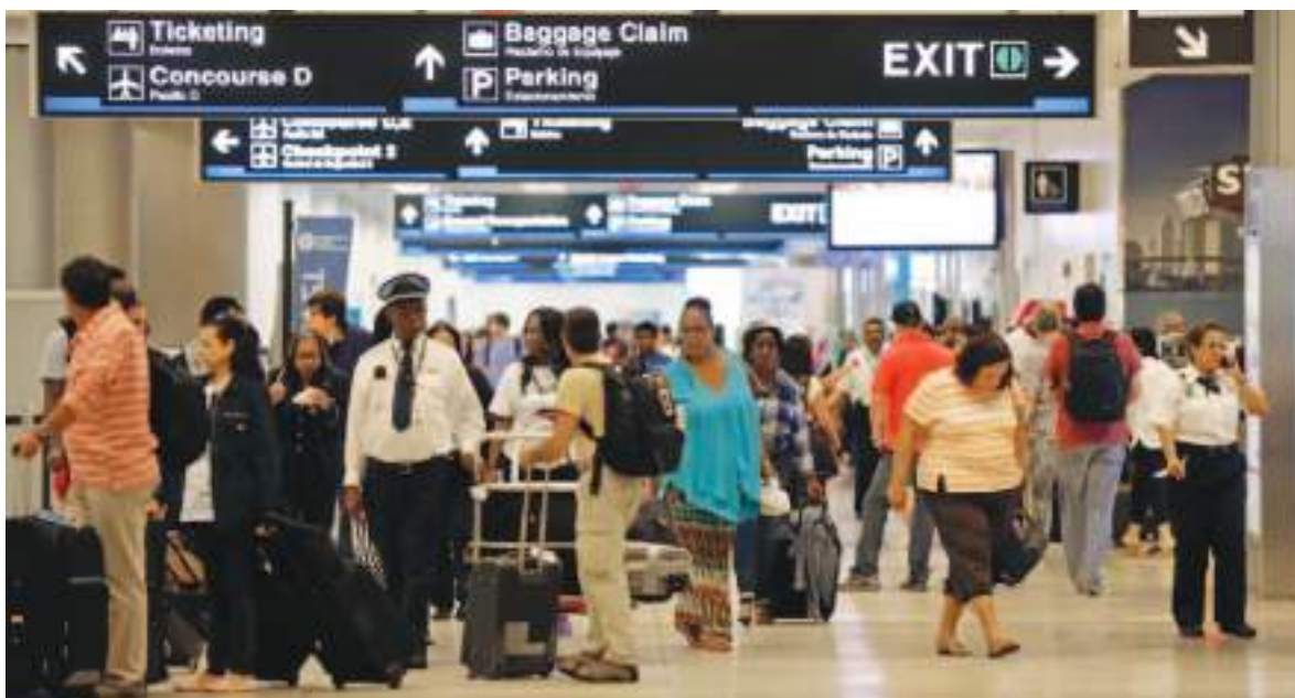
El aeropuerto internacional de Miami lidera con más casos de "inadmisibilidad" de extranjeros.