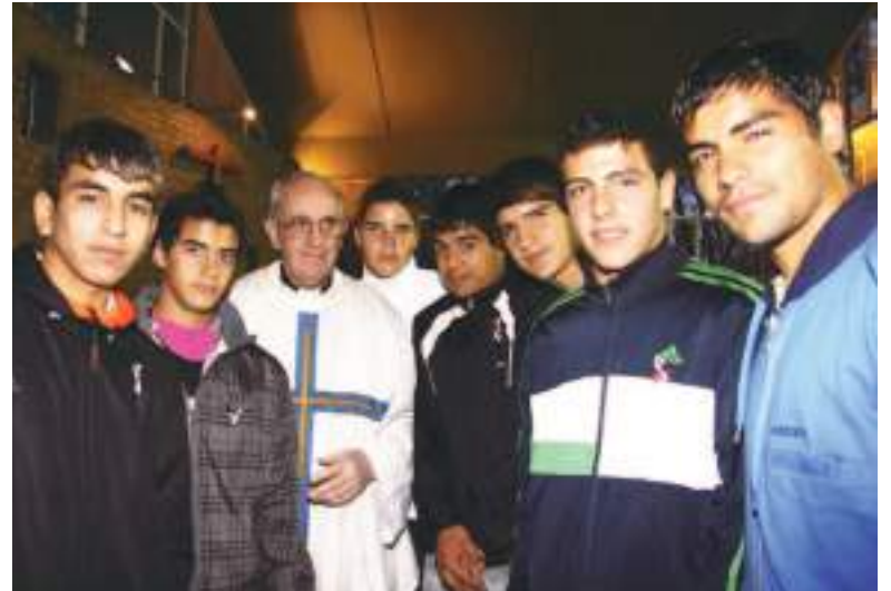
El fútbol fue otra de sus grandes pasiones. Cuando podía, visitaba a los integrantes de San Lorenzo, el equipo de sus amores.

como ocurrió con Francisco, que falleció este lunes 21 de abril a los 88 años. ¿Cómo es el proceso que tiene esta elección?