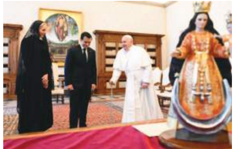
El presidente Daniel Noboa visitó recientemente al Sumo Pontífice.