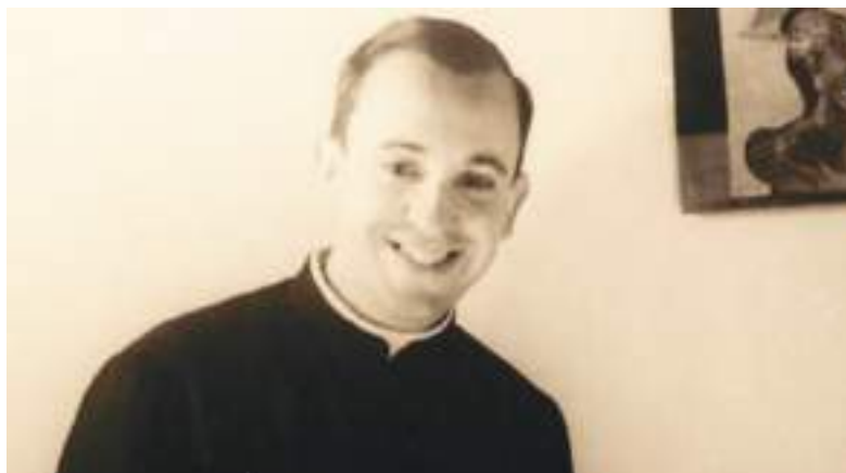
Jorge Mario Bergoglio recién ordenado sacerdote.

Reemplazar a Francisco no será tarea fácil, todos estaremos atentos a los resultados del Cónclave, de donde saldrá el humo blanco para anunciar quien es el sucesor de Pedro y regirá los destinos de la iglesia.