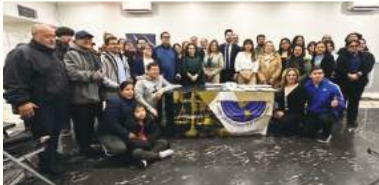
Jueces, estudiantes, abogados, invitados especiales y comunidad migrante que se hicieron presentes.