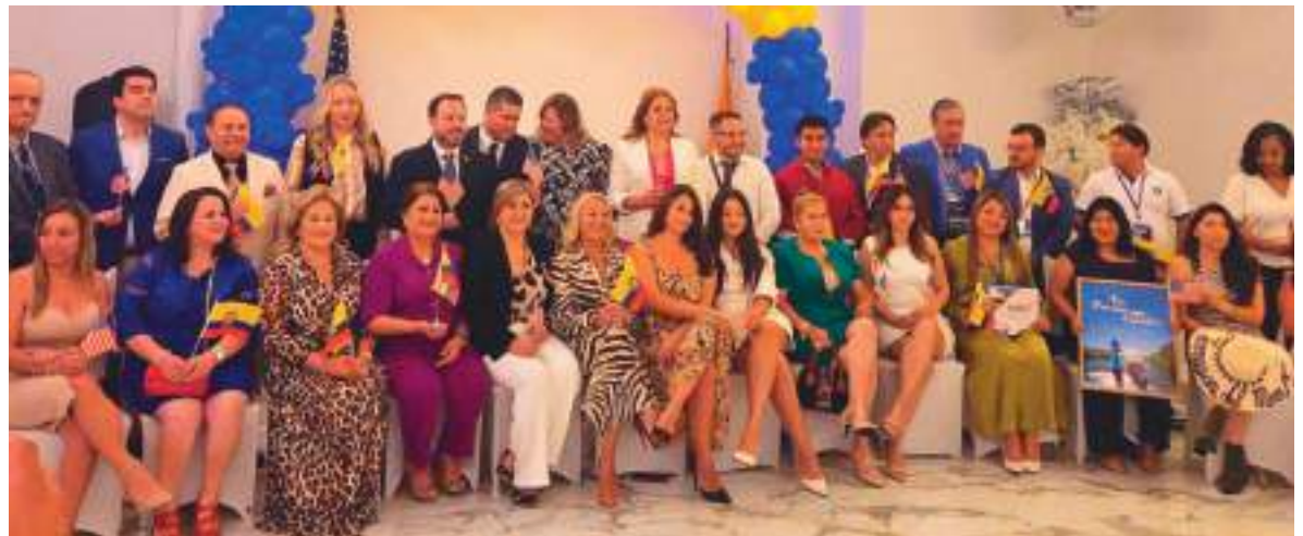
Posan para la cámara de Ecuador News los asistentes a la inauguración de la Feria Inmobiliaria 2025.

Cabe destacar que, entre los auspiciadores y participantes de la feria, de los cuales muchos estuvieron presentes en la misma, entre ellos, UPS, Millenium Grupo Campana, URBAPRO S.A., F & F Construc-