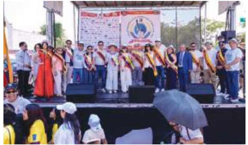
Invitados especiales al Desfile.