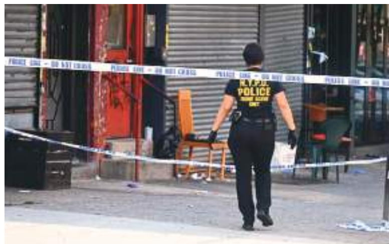
Al menos tres personas murieron y ocho más resultaron heridas cuando varios hombres armados abrieron fuego dentro de un restaurante de Brooklyn la madrugada del domingo.

Las estadísticas de asesinatos y tiroteos están cerca de mínimos históricos en la Gran Manzana; sin embargo, los delitos graves