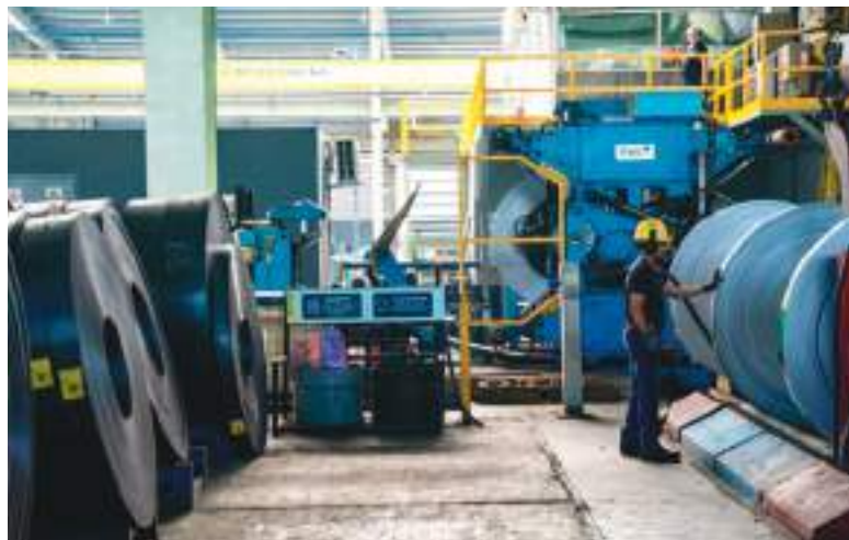
El montaje del proyecto empezó en febrero de este año, y desde hace una semana generan su propia energía.

Garzón explicó que, tras una reciente regulación gubernamental, han podido colocar medidores bidireccionales. Dicha decisión les permite incluso entregar al sistema eléctrico nacional el exce-