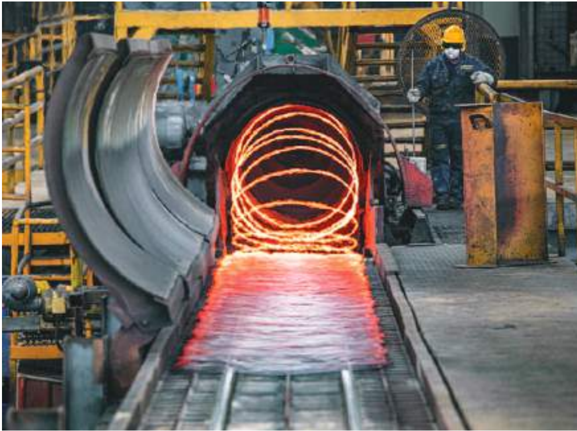
La instalación que, en su pico del sol, estaría produciendo los 4,23 megavatios, es beneficiosa para Ecuador.

dente de energía en las horas del día en las que generan más de lo que consumen.