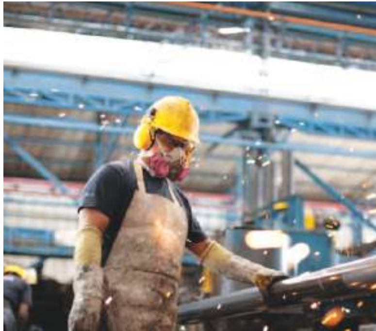
Se busca ser responsable con el medio ambiente.

Según los cálculos de Novacero, durante el primer año de funcionamiento del sistema se evitará la emisión de 1.000 toneladas de dióxido de carbono. Asimismo, las proyecciones apuntan a un crecimiento que alcance las 10.000 toneladas en