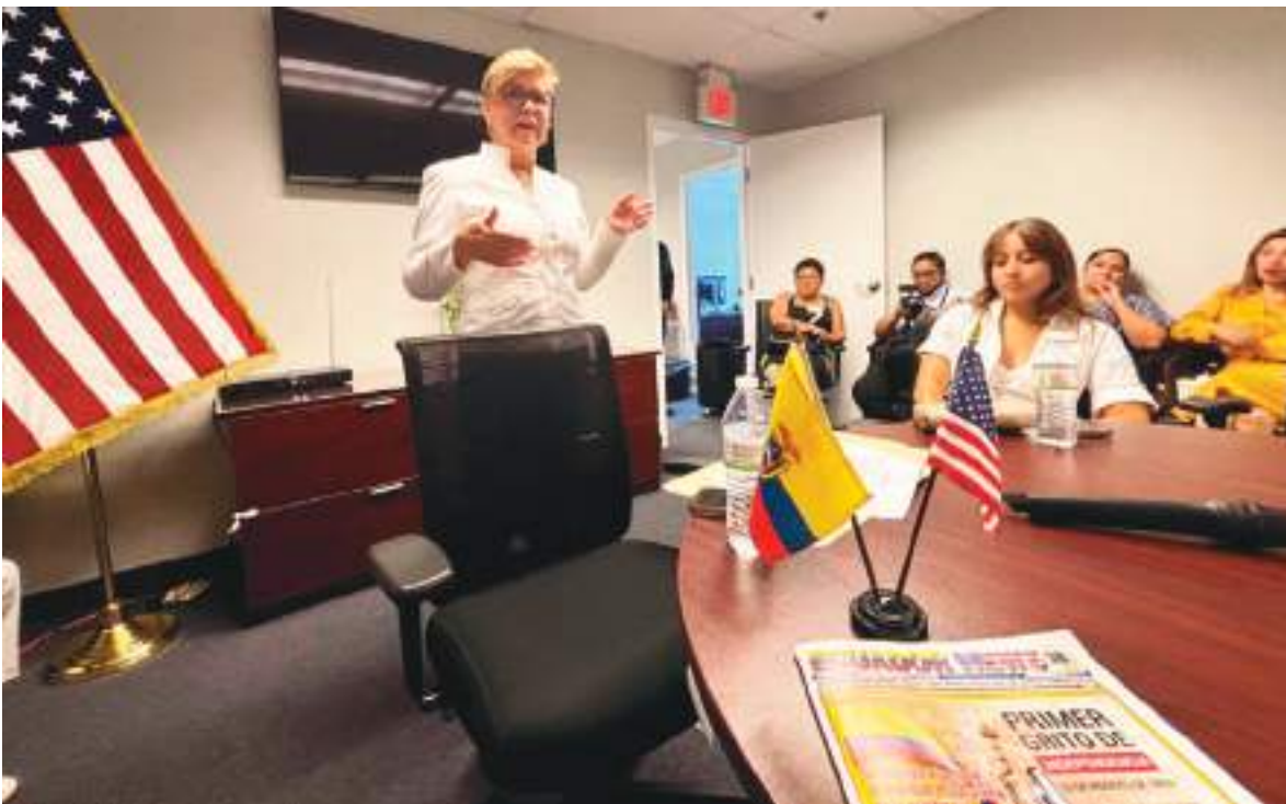
Congresista Nellie Pou se mostró muy receptiva a todas las inquietudes de la comunidad ecuatoriana y ratificó su respaldo incondicional a los migrantes ecuatorianos destacando su valioso aporte al desarrollo de Estados Unidos.