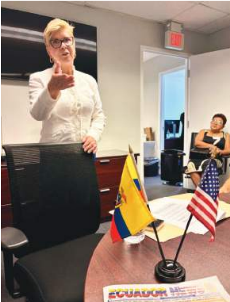
Honorable Congresista Nellie Pou respondió varias preguntas de los líderes de la comunidad ecuatoriana invitados a esta importante reunión.