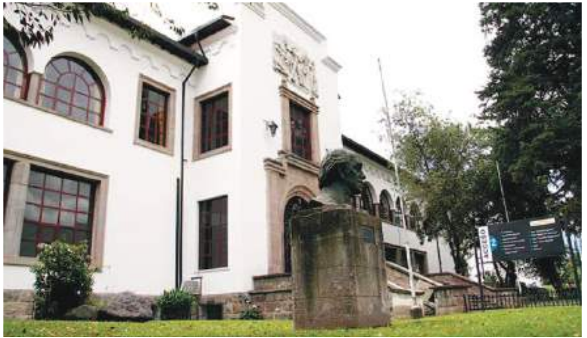
La tradicional Casa de Cultura Ecuatoriana podría afectarse por lo que se acaba de ordenar.