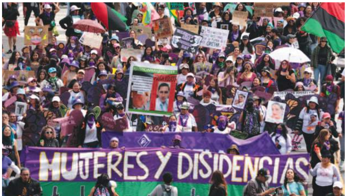
Las mujeres han sido las primeras en protestar por las nuevas medidas del ejecutivo.

"Es un retroceso. Debe haber un organismo independiente que realice el control ambiental. Esto responde a una estrategia para desarmar los escasos controles ambientales e incidir sobre las