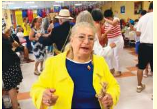
Con mucho entusiasmo se festejó al Ecuador en su día de independencia en Diana Jones.