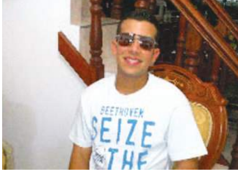
Una de las más recientes fotos del Niño Guerrero.

Niño Guerrero se hizo cargo de la pandilla carcelaria del Tren de Aragua reclutando reclusos y convirtiendo Tocarón en un cuartel general criminal y una ciudad fortificada. La prisión contaba con algunas comodidades lujosas, como una piscina, un campo de béisbol, una discoteca, restaurantes