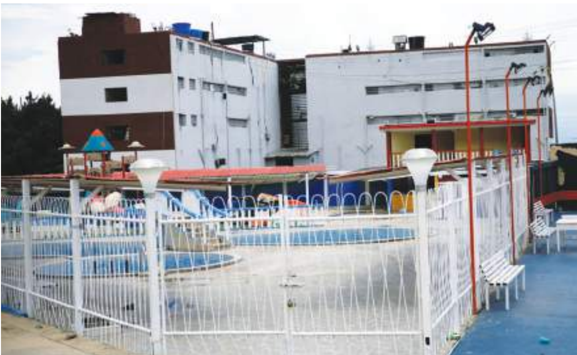
Cárcel de Tocarón en Venezuela, donde el Niño Guerrero inició su imperio criminal.

Hasta el día de hoy, permanece prófugo, y solo hay rumores sobre su paradero. Su férreo control sobre el Tren de Aragua ha disminuido a medida que el grupo se descentraliza.