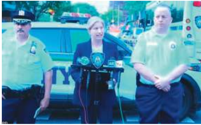
La comisionada del Departamento de Policía de Nueva York, Jessica Tisch (en la foto), declaró en una conferencia de prensa que las víctimas de Brooklyn fueron identificadas como tres hombres de 27 y 35 años.

El alcalde de la ciudad de Nueva York, Eric Adams, y el candidato a la alcaldía, Zohran Mamdani, aún no se han pronunciado sobre el tiroteo. El