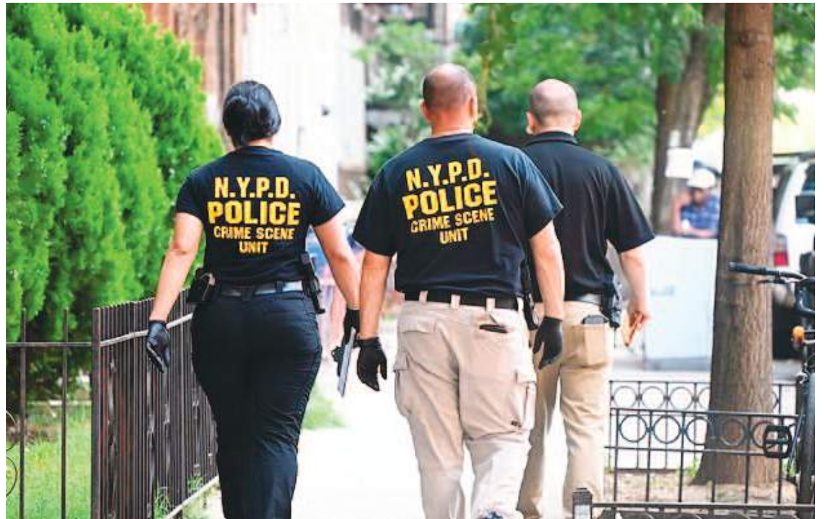
Se ve a los agentes en el exterior del Taste of the City Lounge, donde se produjo el tiroteo, en plena investigación.

La comisionada del Departamento de Policía de Nueva York, Jessica Tisch, declaró en rueda de prensa que las víctimas fueron identificadas como tres hombres de 27 y 35 años, de edad desconocida. Se esperaba que en esta