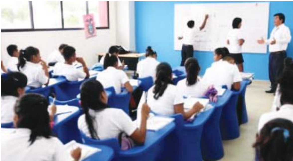
La educación debe empezar desde bien abajo para asegurar un buen número de profesionales en el futuro.

En Ecuador, la educación secundaria y universitaria muestra brechas críticas: baja calidad, limitada cobertura y poca oferta en carreras STEM (ciencia, tecnología, ingeniería y matemáticas). Solo 17% de los graduados universitarios provienen de estas áreas, empatando con África Subsahariana en el último lugar global. Apenas 2% se gradúa en ciencias puras, y menos del 8% opta por