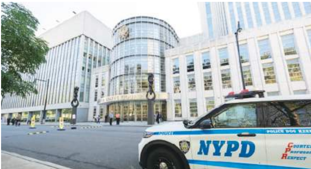
Tribunal de NY a donde deberá presentarse el famoso capo mexicano.

'El narco de narcos' fue transferido desde México a EE.UU. junto a otros 28 cabecillas de distintos carteles mexicanos, entre los que también se encontraban Vicente Carrillo Fuentes y los hermanos Treviño Morales (cofundadores del Cartel de los Zetas).