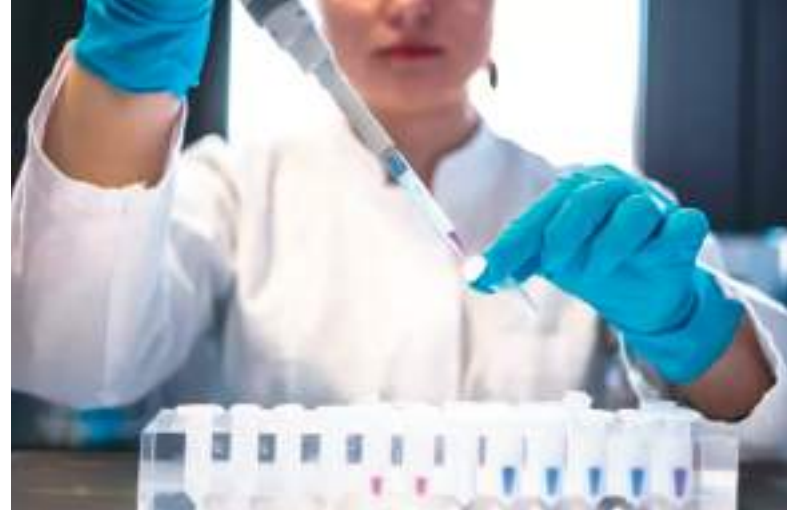
Ecuador no logró convertirse en una sociedad capaz de “aprender a aprender”.

El contraste es brutal con Corea del Sur, que en la década de 1960