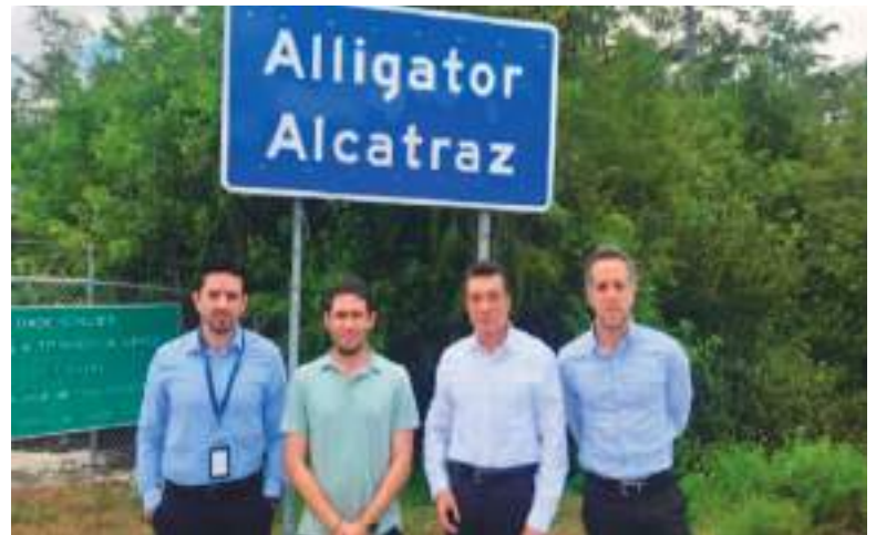
Varios funcionarios mexicanos han visitado Alligator Alcatraz.

El Departamento de Seguridad Nacional (DHS) dijo en un correo electrónico que “el número de detenidos en Alligator Alcatraz