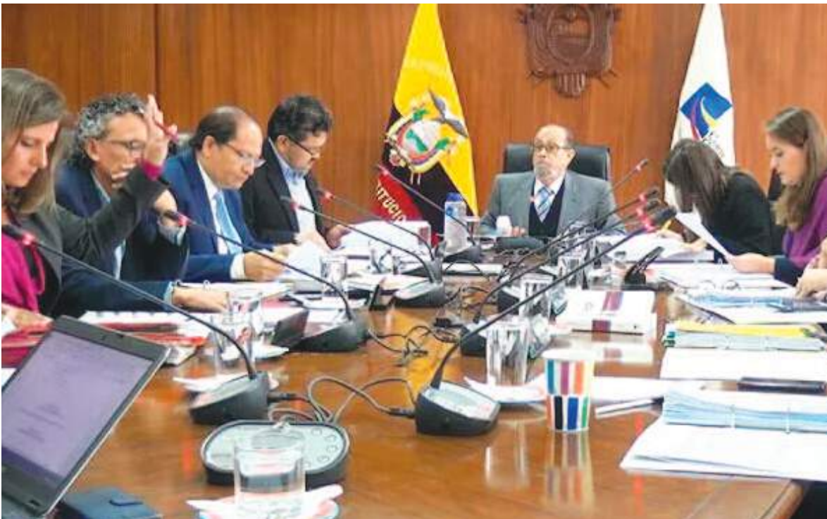
La Corte Constitucional de Ecuador le puso el “freno” al Presidente, aunque ya hay dos preguntas aceptadas.