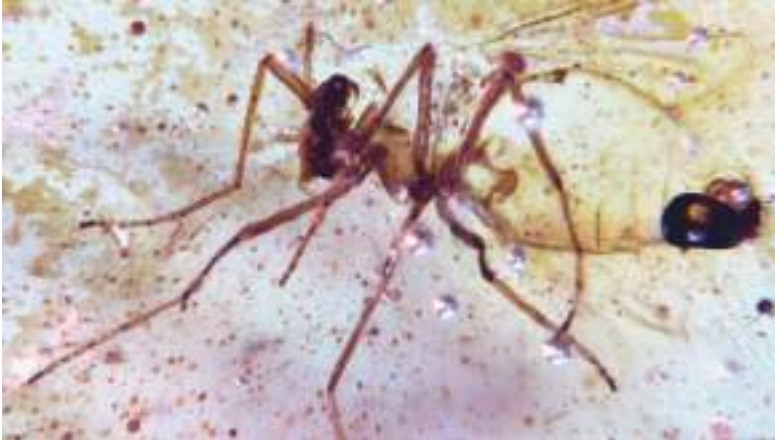
Algunos de los mosquitos atrapados en el ámbar probablemente se alimentaban de la sangre de los dinosaurios.