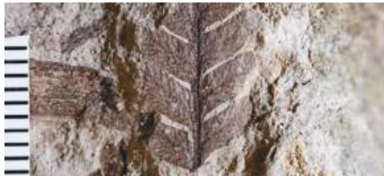
Los investigadores también encontraron plantas fosilizadas que entregan nuevos datos sobre la vida del Cretácico.

El descubrimiento "abre una ventana a cómo ocurrió la transición de la plantas de los bosques antiguos a los bosques actuales dominados por las denominadas angiospermas", concluye Delclòs.