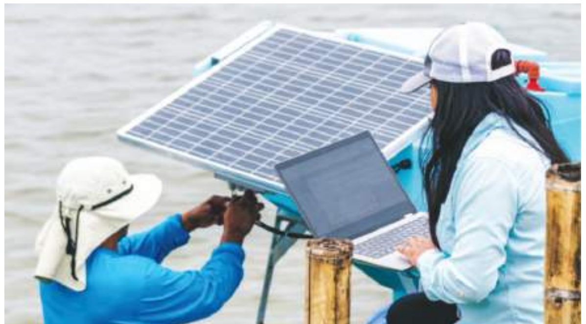
El Banco Mundial sugiere invertir más en tecnología.