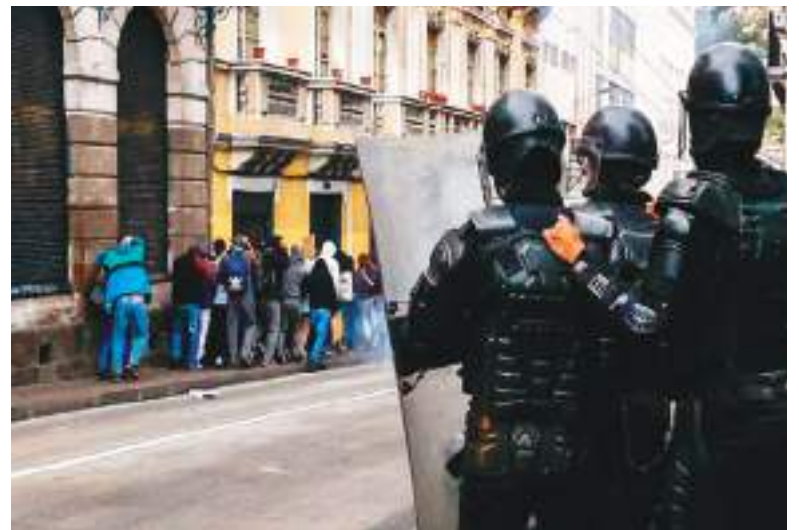
La tensión se vive en todos los rincones del país.

El paro y las protestas actuales tienen como causa más clara y concreta la subida del precio del diésel tras retirar el subsidio; ese es el detonante. La constituyente es parte del telón político y está generando tensión institucional, pero no es el motivo central por el que la gente está en la calle ahora mismo.