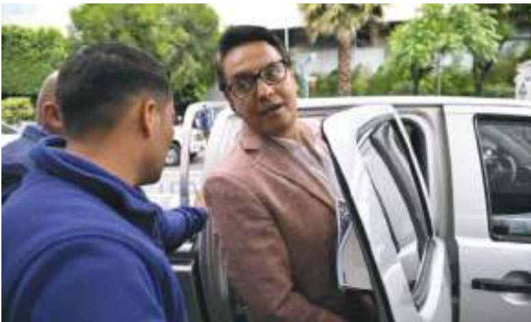
A Los Lobos se les atribuye el plan para asesinar al candidato Fernando Villavicencio, quien murió tiroteado en un acto de campaña en 2023.

Noboa se ha declarado "en guerra" contra el crimen y en una entrevista con la BBC en marzo pidió el apoyo de los ejércitos de Estados Unidos y los países europeos. También promueve un cambio en la Constitución para