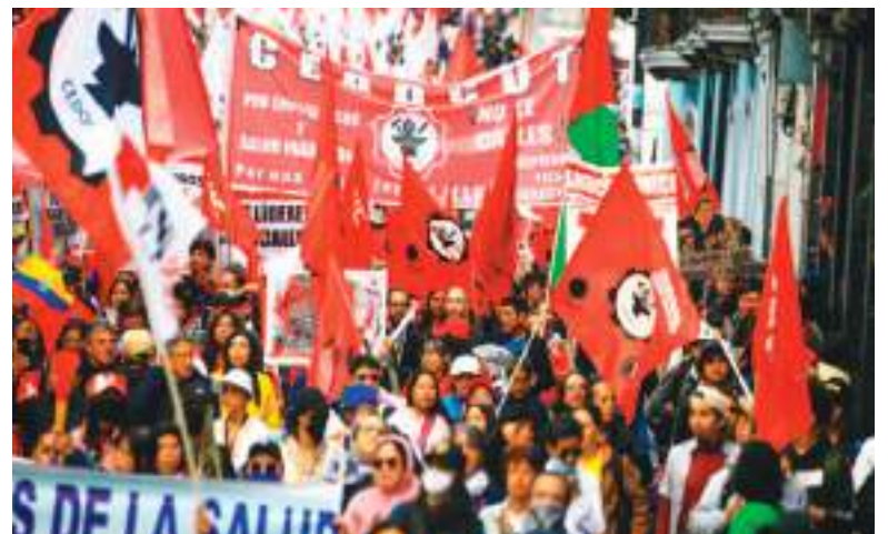
Marcha contra el Gobierno del presidente de Ecuador, Daniel Noboa, en Quito.