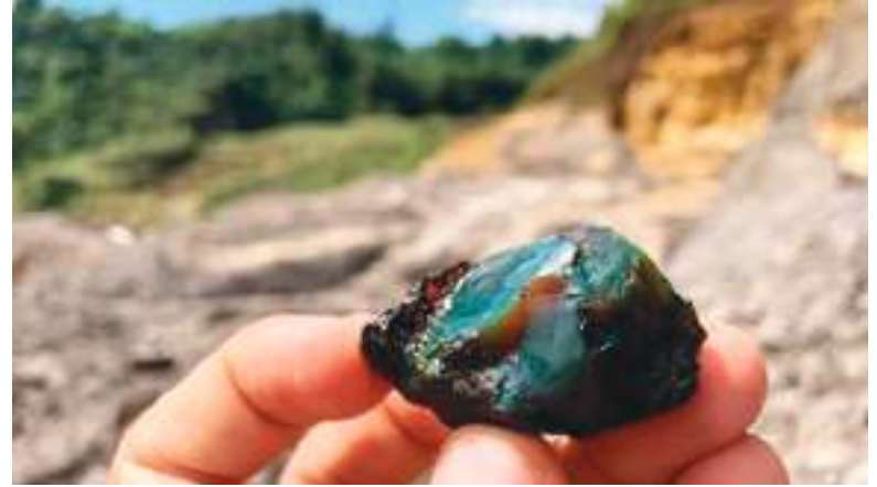
En las muestras de ámbar se identifican diferentes tipos de insectos como moscas, escarabajos o avispas.