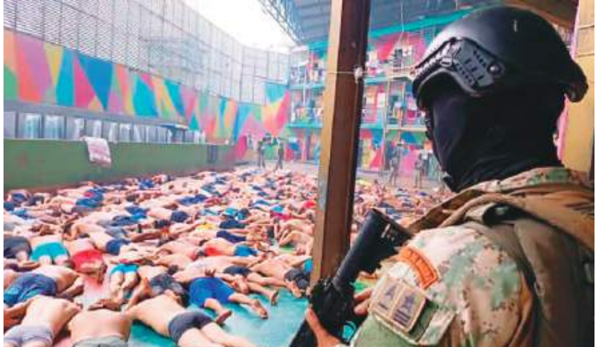
La banda de Los Choneros fue responsabilizada de un gran motín en la Penitenciaría del Litoral, en Guayaquil.

El anuncio llegó solo unos días después de que Washington informará de que sus barcos militares