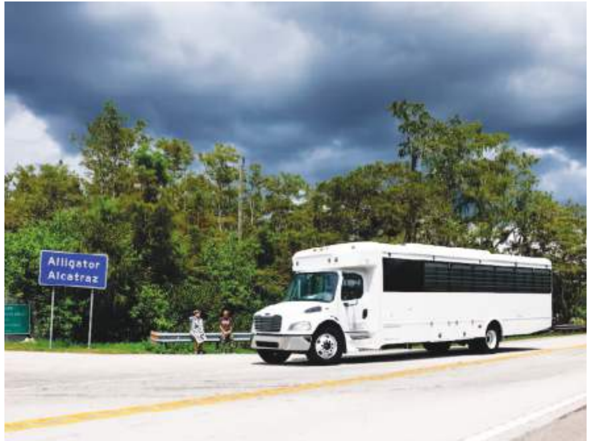
Un autobús con detenidos llega a Alligator Alcatraz, el famoso lugar que sigue causando polémicas.

“Cuando se busca a personas detenidas allí, el localizador del ICE ahora indica: ‘Llame al Departamento de Correcciones de