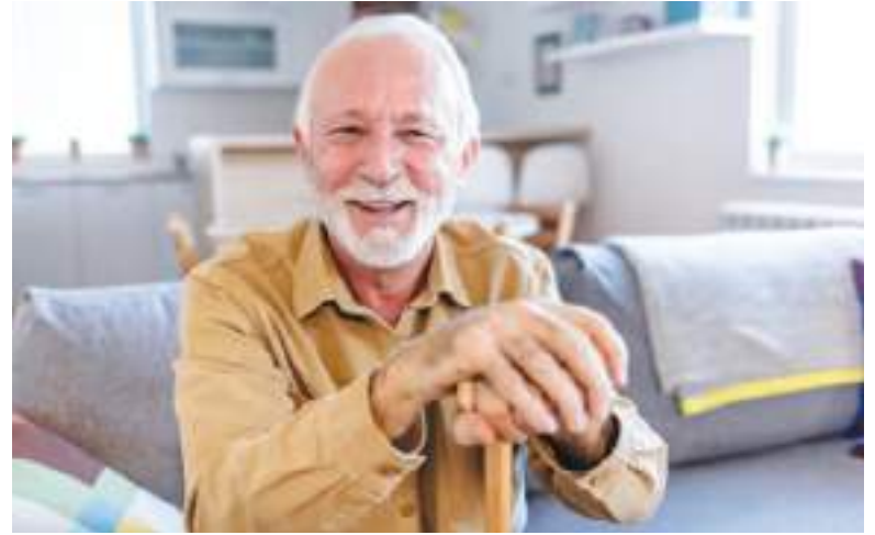
El “superanciano” tiene actitudes maravillosas.

Al mismo tiempo, se ha visto que son personas tremendamente sociales. Las personas estudiadas