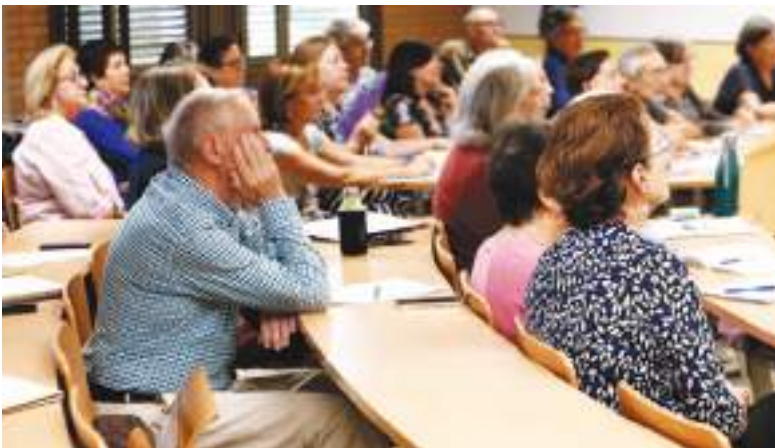
Un “superanciano” se mezcla sin problemas con personas más jóvenes.

En esa línea, los investigadores agradecen y animan las donaciones de cerebro a la ciencia para su estudio postmortem.