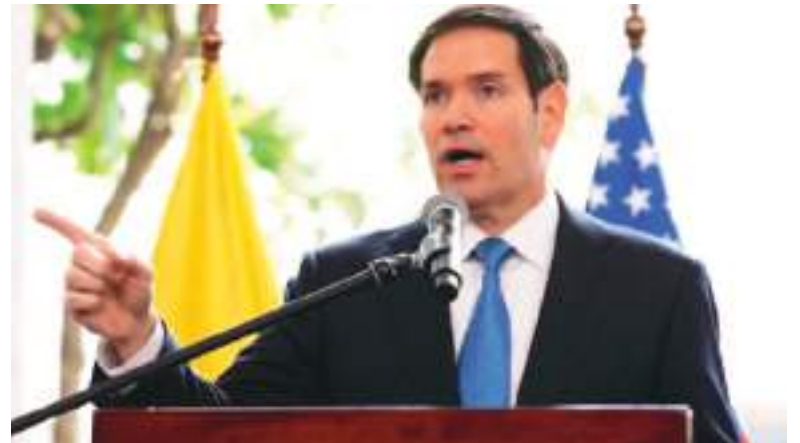
Marco Rubio anunció en Quito la designación de Los Lobos y Los Choneros como organizaciones terroristas.

Rubio anunció que su país suministrará US$13,5 millones en ayuda de seguridad y US$6 millones en tecnología de drones para apoyar a las autoridades ecuatorianas en la lucha contra el narcotráfico.