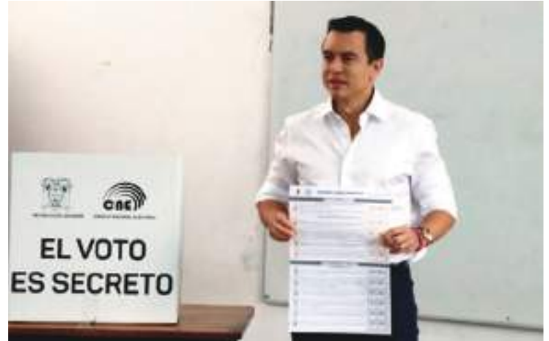
Presidente Daniel Noboa impulsando la Constituyente.

En respuesta, el mandatario derogó el decreto impugnado y emitió uno nuevo: el Decreto 153. Este mantiene la pregunta sobre la Constituyente, pero detalla además la organización del eventual proceso: número de escaños,