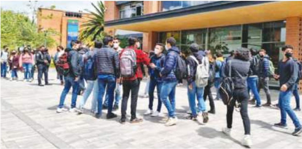
Varias universidades aisladas del sector productivo, lo que se traduce en fracaso.

programas técnicos cortos, frente a más del 30% en Norteamérica y Asia Oriental.