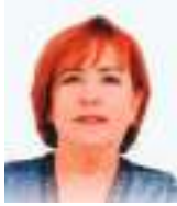
MARIANA VELASCO Especial para Ecuador News

E cuador vive una confrontación de insultos, agresiones, amenazas y muerte, tan deleznable como temerarias. La corrupción, el narcotráfico, el crimen organizado, ciertos dirigentes indígenas y sindicales que - cuándo les quitan privilegios - ponen en jaque a un Estado y a una débil democracia para deslegitimarla, minar su marco jurídico, administrativo y social.