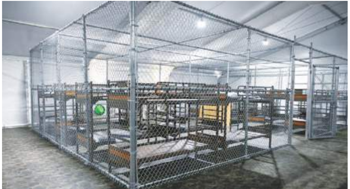
Muchos misterios se han producido en esa prisión y ahora se agrega uno más, el de las desapariciones.

No obstante, no está claro cuántas personas han sido deportadas desde el sitio, o transferidas a otros centros de detención para inmigrantes. Algunos detenidos dijeron a ese periódico que las autoridades los presionan para que acepten ser deportados voluntariamente, y el gobernador de Florida, Ron DeSantis, dijo a finales de julio que un centenar había sido deportado desde el sitio.