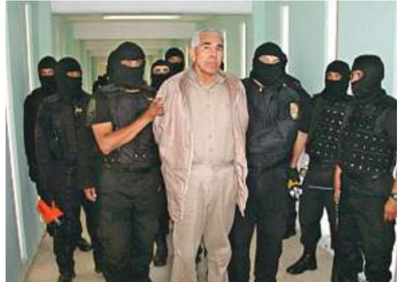
Caro Quintero cuando fue finalmente apresado en México.