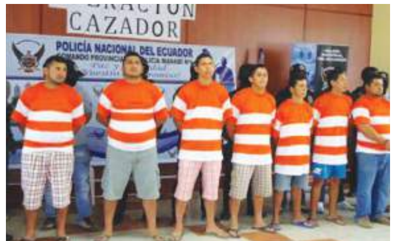
Captura de varios miembros de Los Choneros.

Finalmente, fue extraditado a Estados Unidos en medio de un enorme despliegue de seguridad en julio de este año para responder por varios delitos ante un tribunal de Nueva York. Su extradición marcó un hito en la nueva senda de refuerzo de la colaboración con Estados Unidos que el presidente Noboa quiere incluir como parte de su estrategia de mano dura contra las bandas.