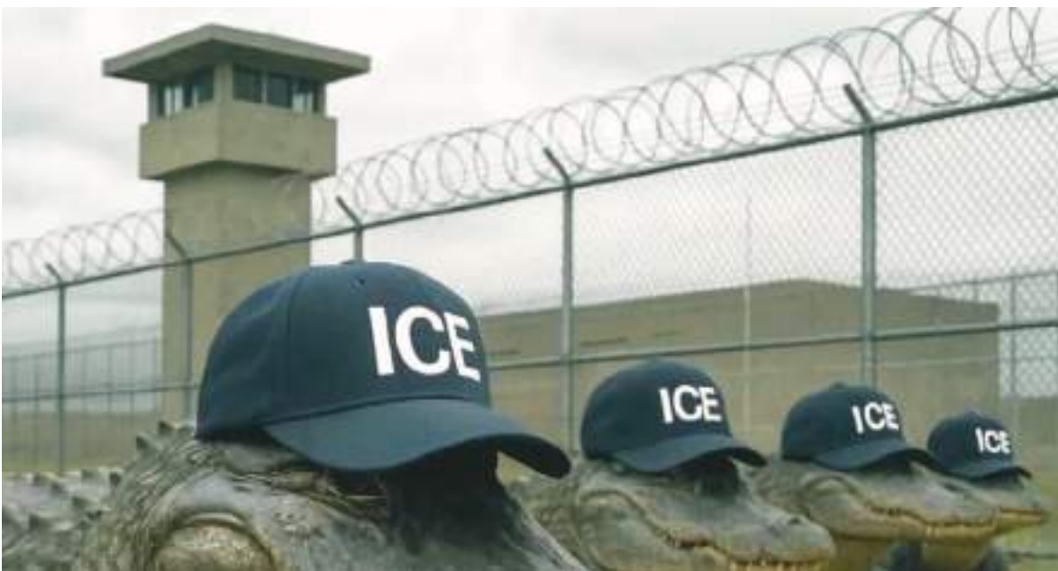
El ingenio popular creó muchas ilustraciones con lo que se sabía de la famosa prisión,

El Departamento de Manejo de Emergencias de Florida administra la instalación. El Estado implementó otro centro para detener inmigrantes al norte de la península, en una antigua cárcel de hombres, al que bautizó como Deportation Depot.