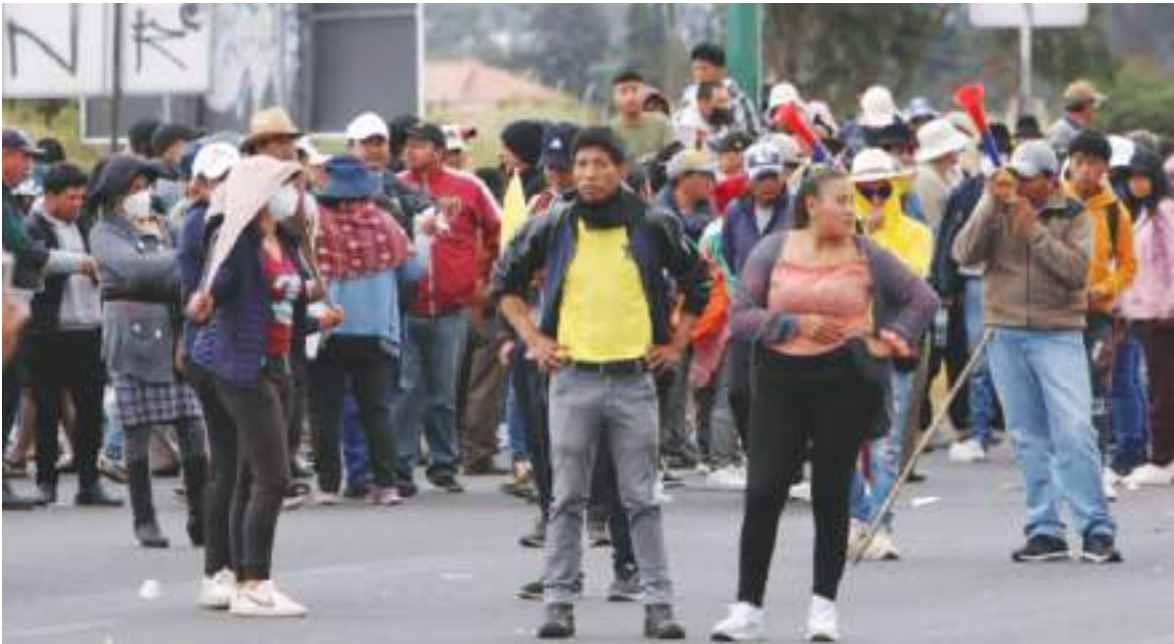
En el marco del paro nacional, un grupo de indígenas de la Conaie bloqueó momentáneamente la Panamericana E35.