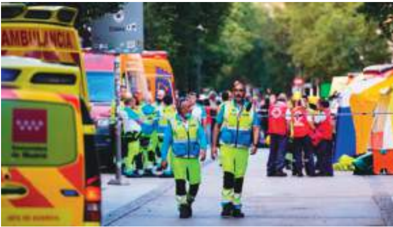
Llegada del personal de emergencia al lugar.

mente a uso hotelero: allí funcionó uno de los hoteles de la cadena One Shot , denominado One Shot Plaza Mayor por su cercanía con el lugar, con más de 1.000 metros cuadrados. En el subsuelo existían zonas de garaje y un almacén que sumaban más de 800 metros cuadrados, además de 1.147 metros cuadrados de elementos comunes.