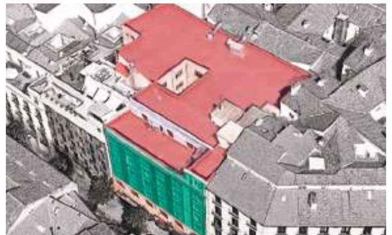
A color se aprecia el edificio siniestrado.