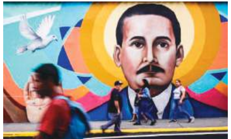
Murales de José Gregorio se aprecian por todas partes de Venezuela.

"Tal vez no soy un gran seguidor de José Gregorio como tal, pero entender que es venezolano y que su canonización en torno a toda la situación geopolítica es importante", indicó.