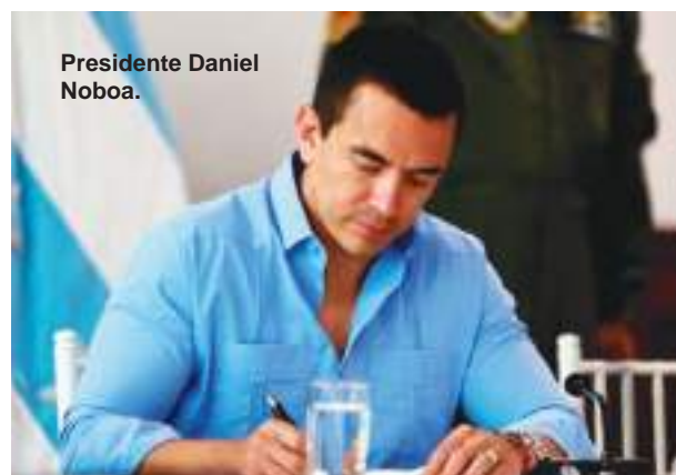
Presidente Daniel Noboa.

El Gobierno añadió que los acuerdos asumidos no se han cumplido, ya que "las vías no han sido despejadas, los manifestantes no se han retirado y se mantienen acciones violentas". En ese contexto, el Ministerio advirtió que el Ejecutivo no cederá a presiones ni chan-