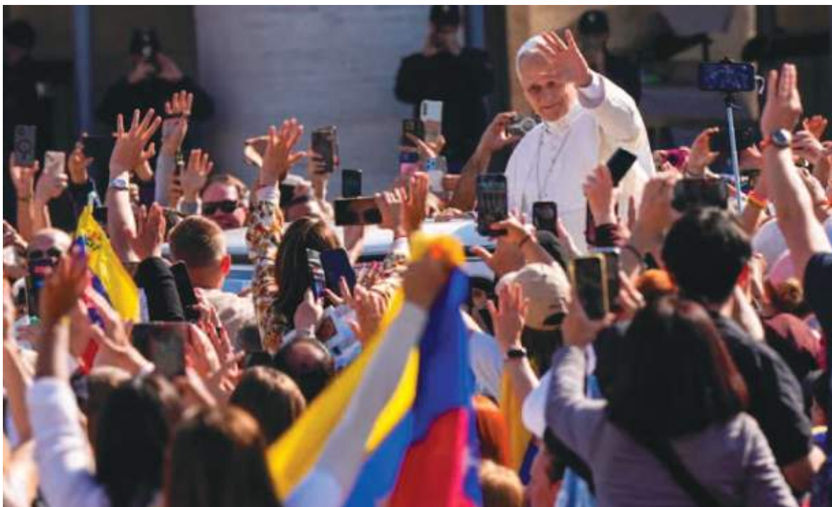
Ya son nueve los santos que ha exaltado este año el Papa norteamericano Leon XV.

En su homilía, León reconoció la importancia de los "tesoros materiales, culturales, científicos