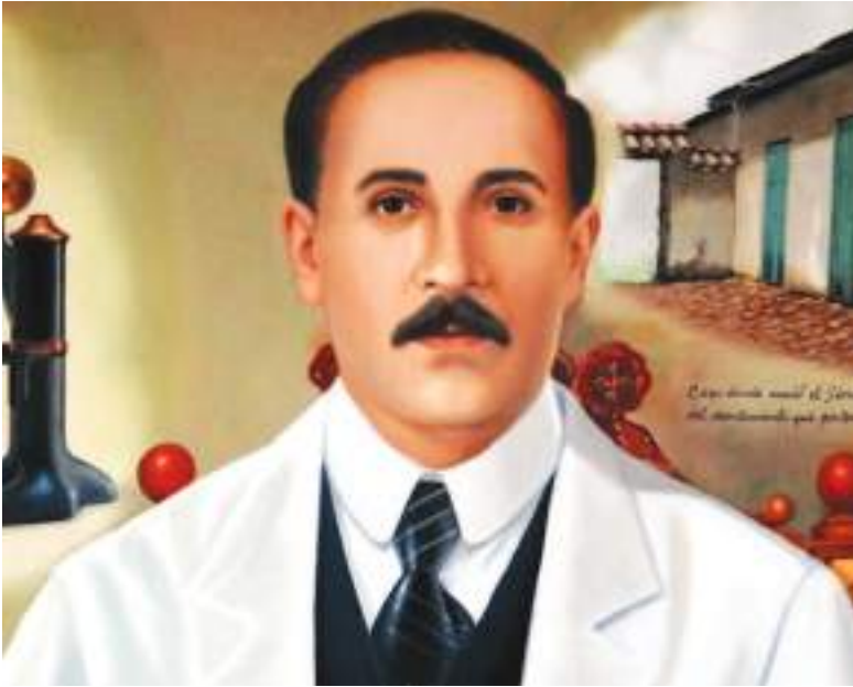
El médico venezolano José Gregorio Hernández fue también exaltado.

y artísticos" del mundo, pero afirmó que "su verdadero significado se pierde sin la fe", según el Vaticano. Al describir a los nuevos santos como "mártires de la fe", "evangelizadores y misioneros", "fundadores carismáticos" de congregaciones o "benefactores de la humanidad", el papa también animó a sus seguidores a apoyarse en la fe en momentos en que el sufrimiento que los rodea pudiera suscitar dudas.