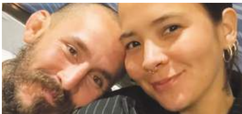
Esposa de Chito Vera responde a los haters del ecuatoriano