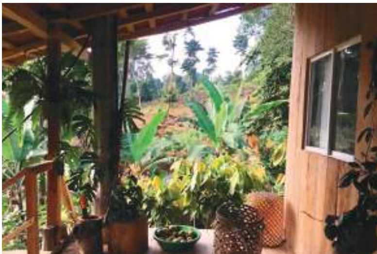
El viaje a Esmeraldas y el tiempo que pasó con la madre de su amiga confirmaron que quiere seguir viviendo felizmente en Latinoamérica.

Después de vivir y trabajar tanto en Ecuador como en