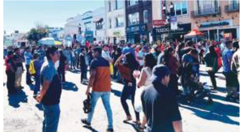
Un desfile especial por sus 50 Años y la comunidad hispana asistiendo masivamente a la avenida Bergenline.