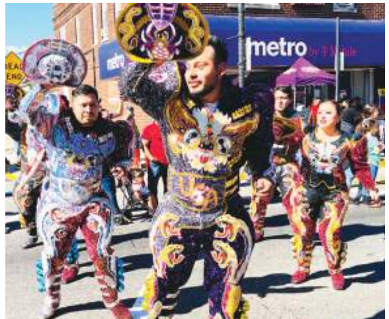
La fuerza y fortaleza de la danza boliviana con sus Caporales.