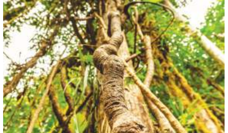
Ayahuasca, la planta medicinal sagrada de la Amazonia.

El año pasado, una propuesta electoral del estado buscaba legalizar y regular el uso, la posesión y la venta con supervisión de sustancias psicodélicas naturales para adultos mayores de 21 años. La medida fue derrotada: cerca del 57% de los