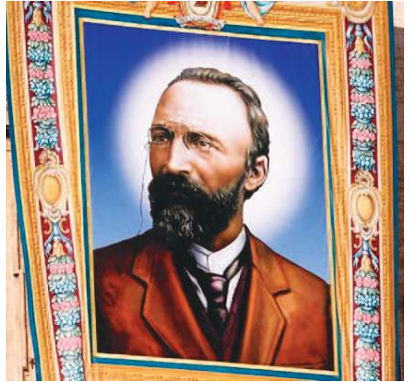
Bartolo Longo fue satánico antes de abrazar la fe católica.

"Hoy tenemos ante nosotros a siete testigos, los nuevos santos, quienes, con la gracia de Dios, mantuvieron encendida la lámpara