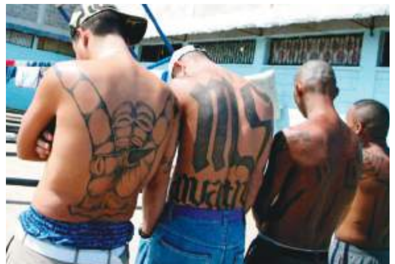
Miembros de la ganga Mara Salvatrucha han tenido mucha presencia en las calles de Hempstead, pero están siendo derrotados.

• Identificar redes comunitarias: la presencia de ONGs, iglesias y asociaciones vecinales facilita apoyo inmediato ante una detención.