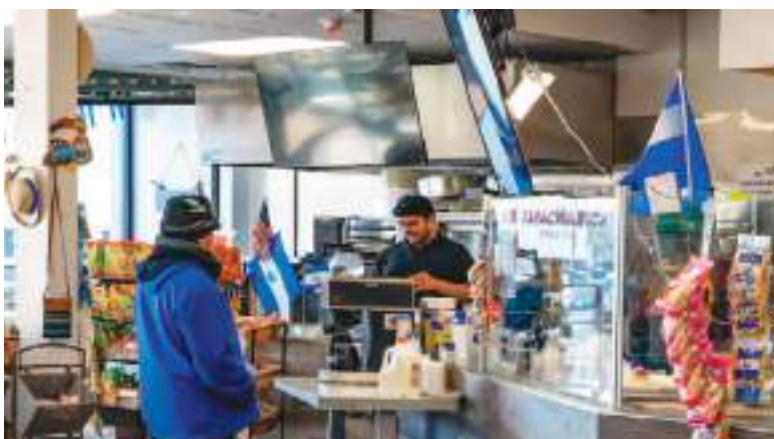
Muchos latinos, especialmente centroamericanos, viven en la zona.

Además, en el sitio CrimeGrade , el delito violento alcanza una tasa de 5,65 por cada 1000 habitantes, lo que le otorga una calificación D- y lo posiciona en el percentil 15 en términos de seguridad (es decir, más inseguro