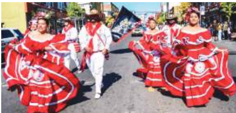
El folclor, las tradiciones y las danzas de Colombia brillando en el Mes de la Herencia Hispana, en la avenida Bergenline.