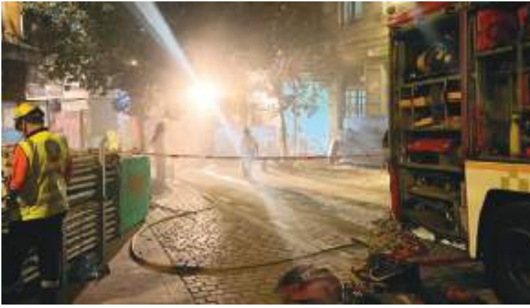
Los bomberos debieron trabajar doble turno para rescatar a los fallecidos.