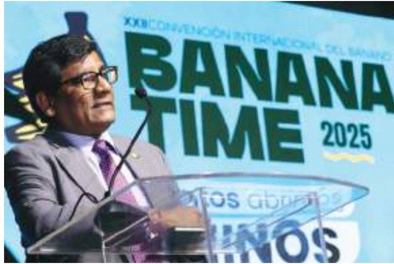
Ministro de Producción, Comercio Exterior e Inversiones de Ecuador, Luis Alberto Jaramillo aseguró que se tiene una propuesta a EE.UU.

Si bien el acuerdo todavía no está cerrado, Jaramillo anticipó esta propuesta de Estados Unidos durante la inauguración -en la víspera- del 'Banana Time 2025', la mayor convención de América Latina sobre banano, del que