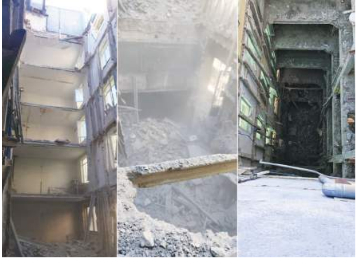
La construcción que se vino abajo ya había sido revisada por las autoridades, sin embargo, sucedió la tragedia.

Se habían recibido numerosas advertencias de antemano de que el edificio podría convertirse en una trampa mortal. Había recibido una inspección técnica desfavorable con fecha del 8 de marzo de 2022, relativa al estado general de fachadas, muros exteriores y medianeras, así como al manteni-