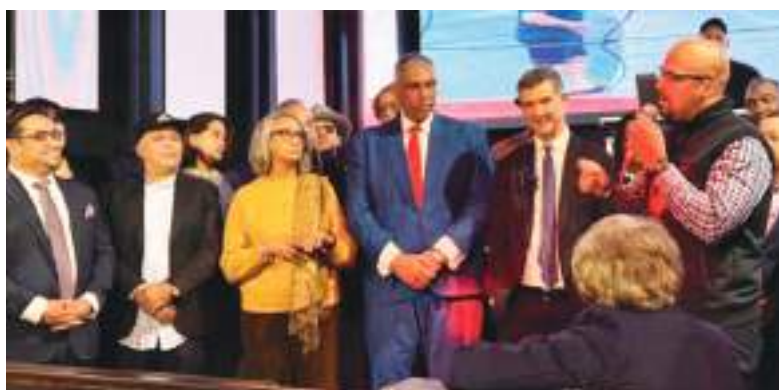
Presentación del Cónsul General de la República Dominicana en New York, Jesús Vásquez.