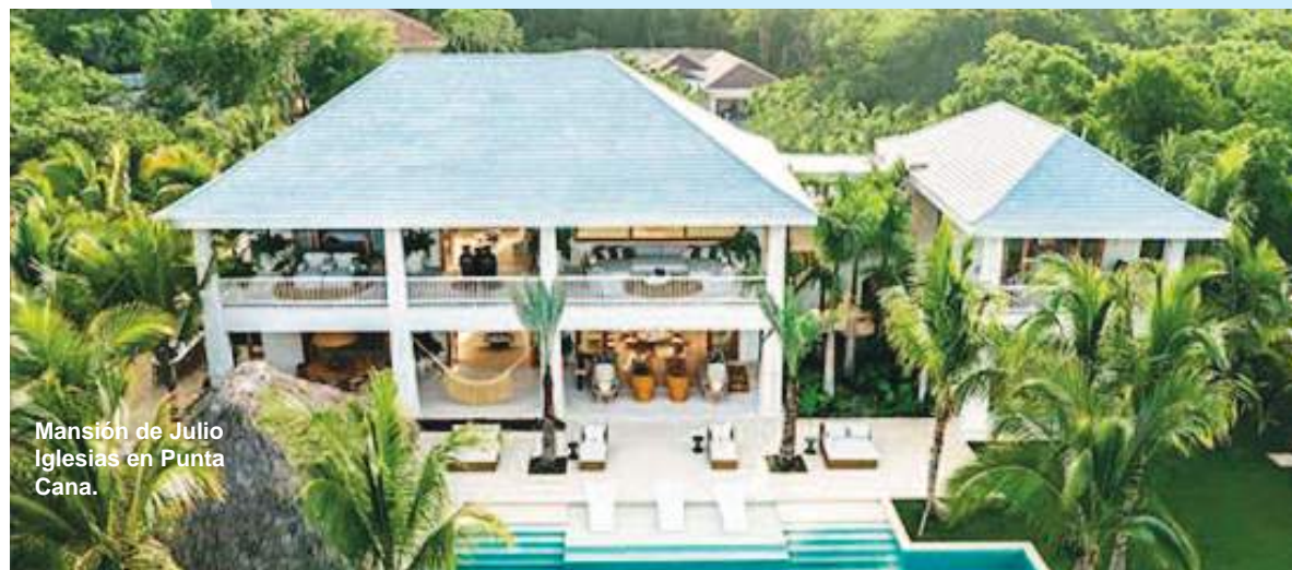
Mansión de Julio Iglesias en Punta Cana.

El relato de ambas describe agresiones sexuales como penetraciones sin consentimiento, bofetadas, vejaciones y humillaciones laborales sistemáticas a ellas y a otras empleadas.