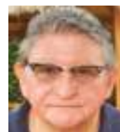
DAVID SAMANIEGO TORRES Especial para Ecuador News

E stamos muy a tiempo para sanear nuestro entorno, para analizar correctivos, evaluar resultados y, quizá, modificar políticas de corto y largo plazo. El viejo adagio: “Amigo de Platón sí, pero más amigo de la verdad”, es imperioso que lo hagamos nuestro. Me uno a pensadores ecuatorianos que de un tiempo acá muestran su inconformidad sobre la manera en la que estamos enfrentando nuestros problemas. Me refiero al Ecuador en general. Es menester identificar los problemas y abordarlos con ganas de hallar la solución. Hace unos días abrí un video que mostraba formas de impedir que se hable de nuestros problemas para encontrar soluciones. Encima del tablero de una mesa grande de trabajo, se veía, extendido, el cuerpo exánime de un caballo. Quienes analizaban el hecho decían: 1) Hay que esperar un poco de tiempo porque posiblemente no esté del todo muerto el animal. 2) Es urgente comprar una nueva montura y estribos porque la antigua se ha perdido. 3) Es necesario tener lista yerba fresca como alimento. No se quería declarar muerto al animal para sustituirlo por uno sano y analizar las causas del mal y algo más, porque estas acciones presuponían nuevas normas y renovación urgente de personal.