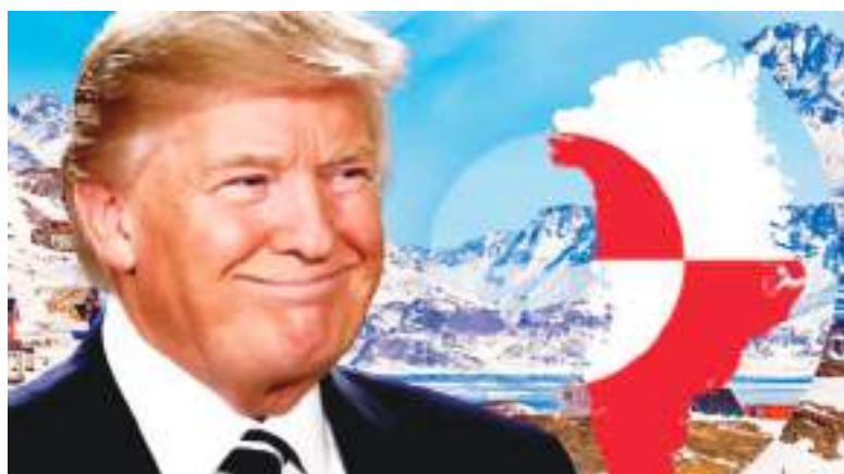
Donald Trump ha reafirmado su deseo de que Groenlandia pase a estar bajo control estadounidense.

Y su polémica ambición atizó los temores en Europa, luego de