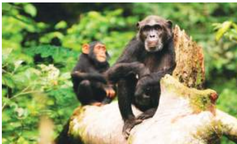
Chimpancés y bonobos.