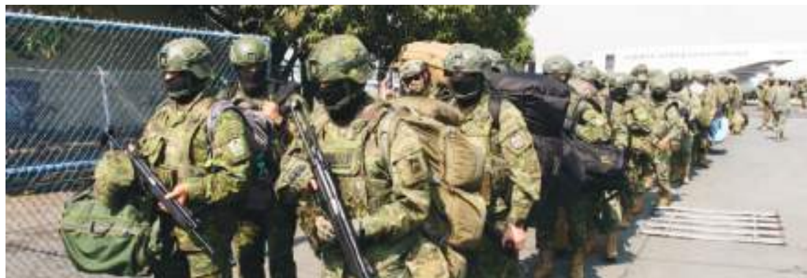
Ecuador refuerza la seguridad con un amplio despliegue militar basado en inteligencia estratégica.

La medida ha sido presentada por el Ministerio de Defensa, que aboga por hacer frente a supuestas "estructuras criminales" que ope-