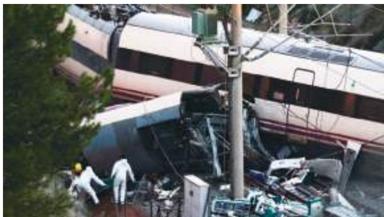
Los investigadores están tratando de dictaminar las causas de la tragedia.

De acuerdo con el último recuento de la Agencia de Emergencias de Andalucía (EMA), 39 personas continúan ingresadas en hospitales andaluces, mientras que 83 de los 122 heridos atendidos inicialmente ya han sido dados de alta. En estos momentos, 13 pacientes permanecen en unidades