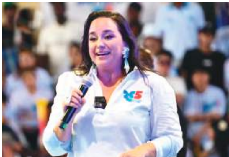
Gabriela Rivadeneira, la nueva líder de Revolución Ciudadana.

• La cita del correísmo busca cerrar las brechas internas acumuladas en los últimos años dentro del movimiento, especialmente tras las derrotas en las segundas vueltas de las tres últimas elecciones presidenciales, celebradas en 2021, 2023 y 2025.