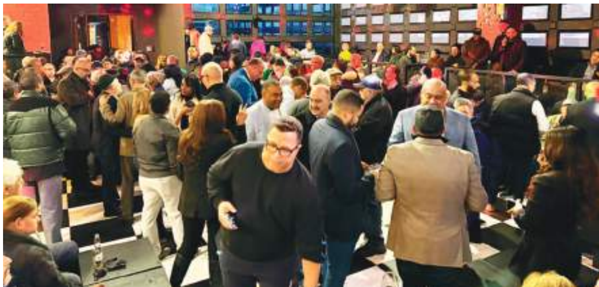
Amigos y familiares del ex comisionado llegaron a decir gracias y a desearle lo mejor en su próximo capítulo.