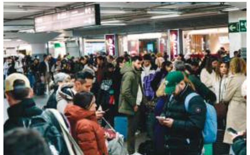
Se produjo el normal problema en las estaciones de trenes tras el accidente.

Según el último balance de la Agencia de Emergencias de Andalucía (EMA), 39 personas afectadas en el siniestro permanecen ingresadas en hospitales de Andalucía, 35 adultos y cuatro