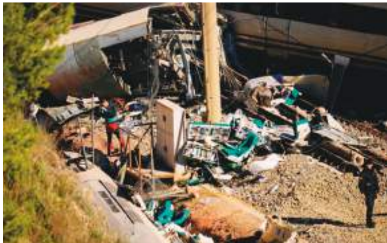
Rastros del accidente férreo en una provincia española.

Miembros de la comunidad ecuatoriana han indagado si alguno de sus connacionales estaría entre los desaparecidos. Hasta la fecha no se puede confirmar o negar nada porque aún avanza la investigación y el reconocimiento de las víctimas.