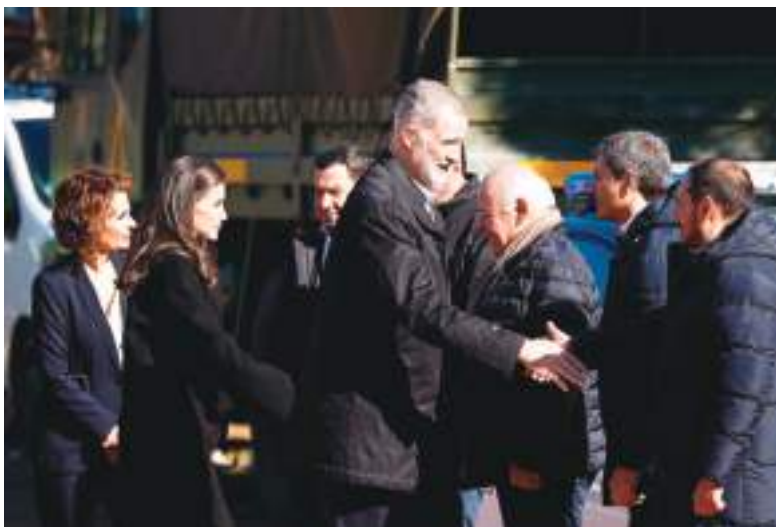
El Rey Juan Carlos de España y la Reina Leticia, estuvieron en el lugar del siniestro y dialogaron con familiares de las víctimas.

¿DÓNDE Y A QUÉ HORA SE PRODUJO EL ACCIDENTE? El descarrilamiento se