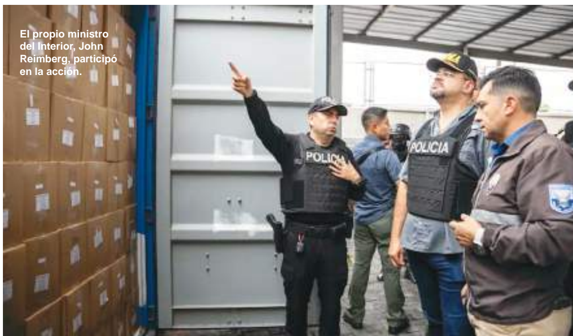
El propio ministro del Interior, John Reimberg, participó en la acción.

Rodeado por Colombia y Perú, los dos mayores productores mundiales de cocaína, y con varios puertos en sus costas y una economía dolarizada, Ecuador se ha convertido en los últimos años en un paso importante para el tráfico de esa droga que se dirige mayormente a Europa y Norteamérica.