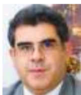
CÉSAR MONTAÑO GALARZA Especial para Ecuador News

E s importante tener claro el rol del Estado y el espacio que ocupa el sector privado en la economía nacional. Esto depende de cómo la Constitución traza la cancha para la participación de cada uno, asunto relevante en extremo porque de ello puede depender la producción y el empleo, la inversión, el posicionamiento internacional y la generación de tributos para el presupuesto. Esto a propósito de la Sentencia Constitucional 112-21-IN/25 relacionada con la discusión sobre reformas a la Ley Orgánica de Servicio Público de Energía Eléctrica, cuestión vinculada con la inversión privada y la posibilidad de impulsar proyectos en el campo eléctrico.