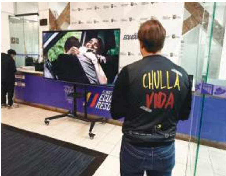
Los usuarios pudieron ver el primer capítulo de la serie “Chulla Vida”.

- Nos sentimos muy agradecidos de estar aquí, visitar restaurantes icónicos como Donde Rossy, la Hueca Manabita,