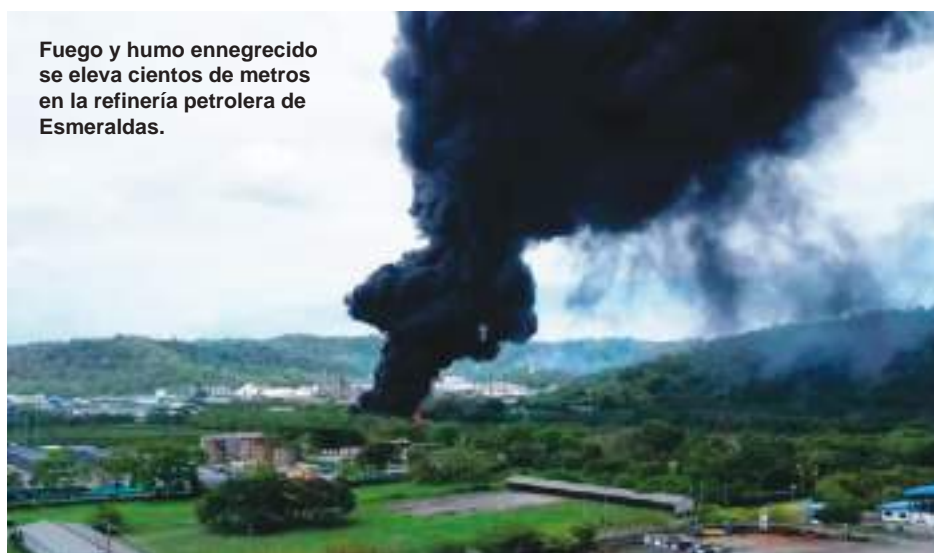
Fuego y humo ennegrecido se eleva cientos de metros en la refinería petrolera de Esmeraldas.

Sin embargo, se registró la fuga de "una mínima cantidad de hidrocarburo (mayormente lodo)" que sobrepasó la barrera de contención hacia el río