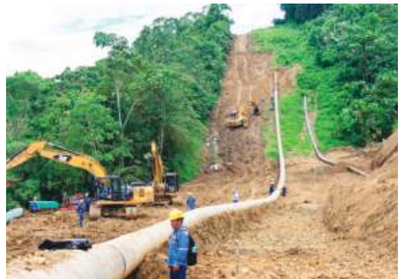
Colombia dejó de bombear petróleo por territorio ecuatoriano.

En síntesis, lo que comenzó como una medida arancelaria con fines aparentemente comerciales y simbólicos, ha mutado hacia una crisis política y diplomática con efectos estructurales que aún no encuentran una salida negociada clara.