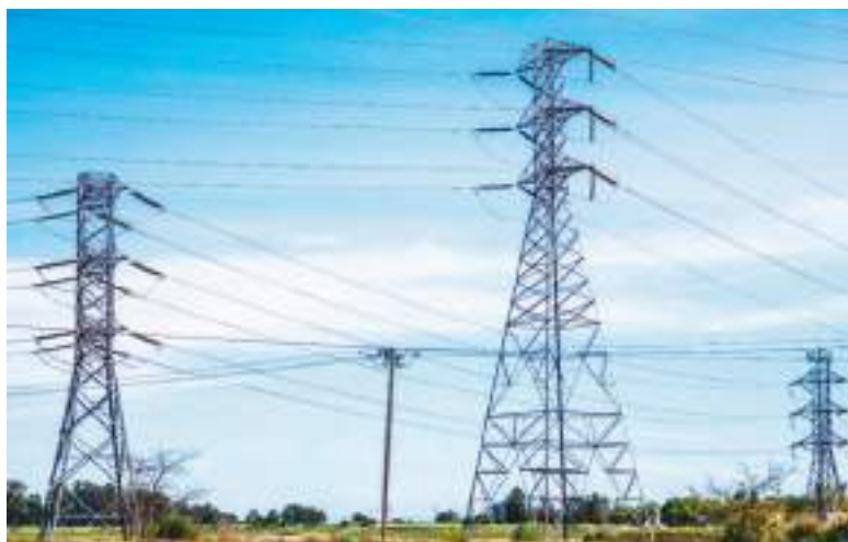
Por ahora la energía ecuatoriana no enfrenta problemas peligrosos.

ciones colombianas superando a las exportaciones ecuatorianas. El arancel del 30 % se aplicó a una amplia gama de productos, con efectos directos en bienes de