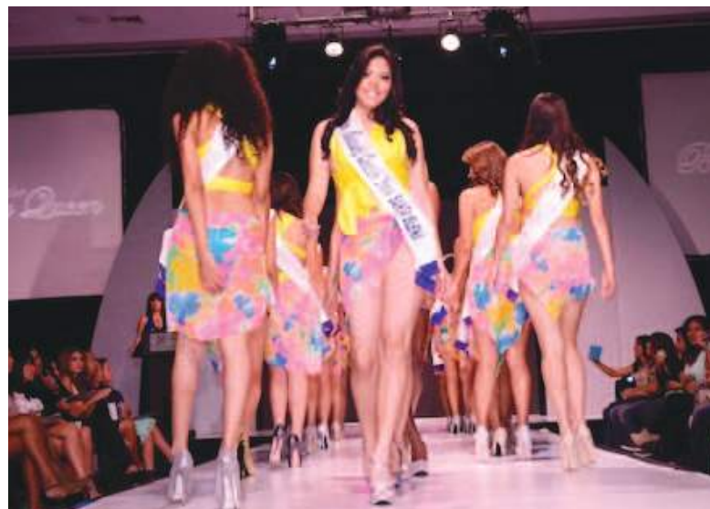
Un asociado de Epstein estuvo en varios concursos de belleza en Ecuador.

Brunel actuó como juez en concursos de modelaje en Guayaquil (2004) y Quito (2006), eventos que reunieron a jóvenes de entre 14 y 19 años y que fueron