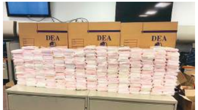
Uno de los muchos cargamentos de droga incautados a Wedding.

Clark fue arrestado previamente en México en 2024 y extraditado a Estados Unidos. Se declaró inocente de cuatro asesinatos en Ontario, Canadá.