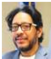
JOSÉ M. VANTROI REYES T. Especial para Ecuador News

El mundo de los liderazgos insuficientes y las normas a la carta