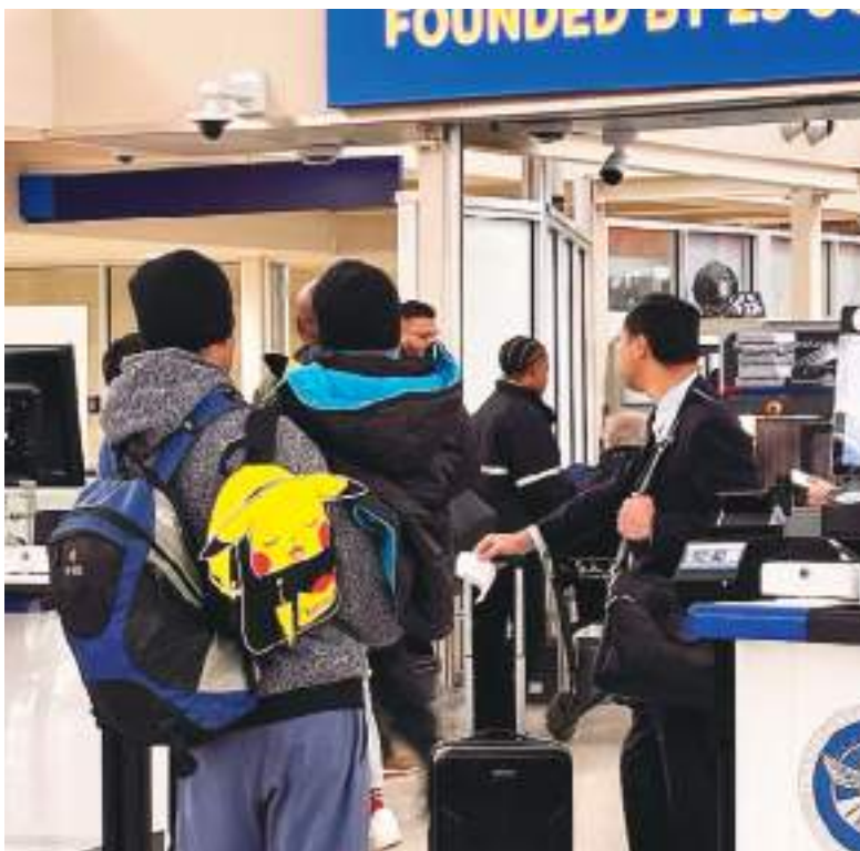
El padre y el hijo aparecen aquí en un aeropuerto de San Antonio, Texas, antes de abordar su vuelo.