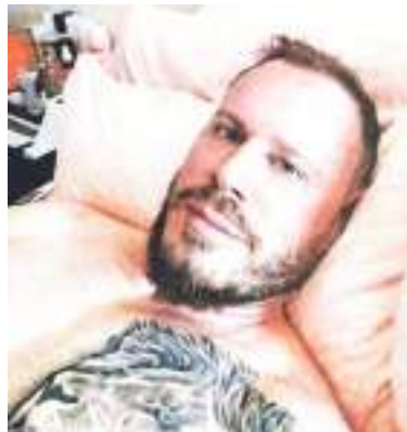
Wedding al parecer estuvo enfermo recientemente.

El Departamento del Tesoro de Estados Unidos afirmó reciente-