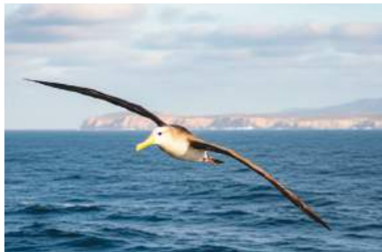
El albatros es la única especie que vive exclusivamente en regiones tropicales. Anida casi exclusivamente en las Islas Galápagos.

En la comunidad científica, las aves que migran mucho más allá de su hábitat habitual se denominan "aves errantes". Sin embargo, la pregunta más importante es por qué una especie de ave acostumbrada únicamente a