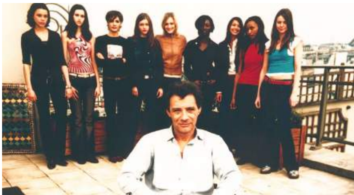
Se informó que el agente de modelaje francés Jean-Luc Brunel le ofreció a Epstein chicas ecuatorianas.

Investigadores y periodistas han destacado que muchas de las teorías que circulan sobre “listas de clientes” o conexiones profundas entre figuras públicas y Epstein carecen de respaldo en documentos verificables o han sido