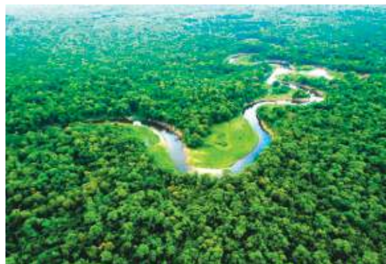
El bosque Atlántico, un sitio predilecto para los insectos.

“Nos permite implementar acciones de vigilancia y prevención focalizadas”, señaló Alencar. Además, indicó que a largo plazo, esto podría derivar en “estrategias de control” que tengan en cuenta el equilibrio de los ecosistemas.