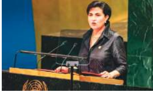
Gabriela Sommerfeld, ministra de Relaciones Exteriores.

"Desde 2024, la Embajada de Ecuador en Estados Unidos mantiene contacto con la ORR, la cual ha indicado que la reunificación de menores no acompañados tiene tres fases: la detención que realiza la Patrulla Fronteriza; la transferencia que realiza el Departamento de Seguridad Nacional al