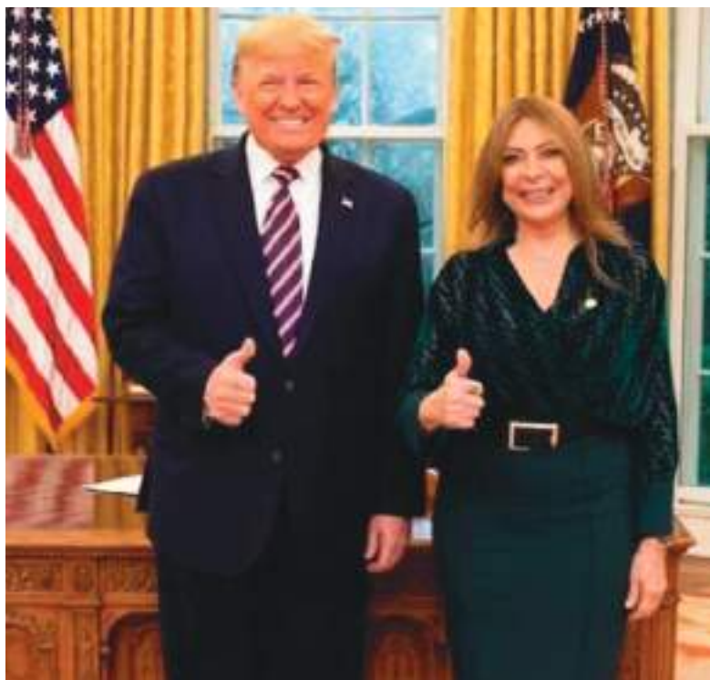
Embajadora Ivonne Baki junto al Presidente de los Estados Unidos de América Donald J. Trump en reunión protocolaria en representación de Ecuador.