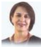
ROSALÍA ARTEAGA SERRANO

Ex Presidenta Constitucional de la República del Ecuador