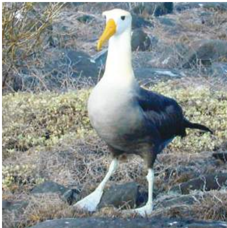
Su hábitat natural es Galápagos.

Con una envergadura que puede alcanzar los 2,4 metros, esta especie pasa la mayor parte de su vida planeando sobre el océano. Por lo tanto, su aparición en aguas templadas como las de California es un fenómeno científico excepcionalmente raro.