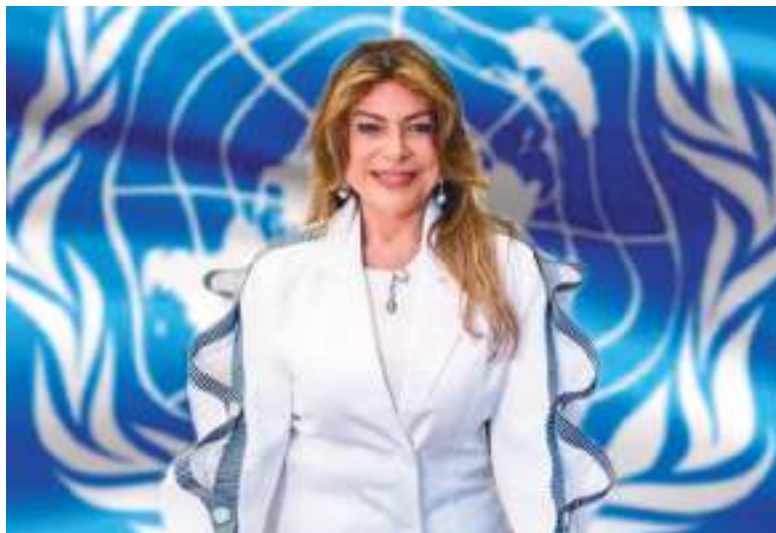
Embajadora Ivonne Baki Candidata a Secretaria General de las Naciones Unidas habla en exclusiva para Ecuador News.

“Tengo el reto de restablecer la confianza global en las Naciones Unidas, mediante el fortalecimiento de la paz, la aceleración de la acción climática y de biodiversidad, la ampliación de