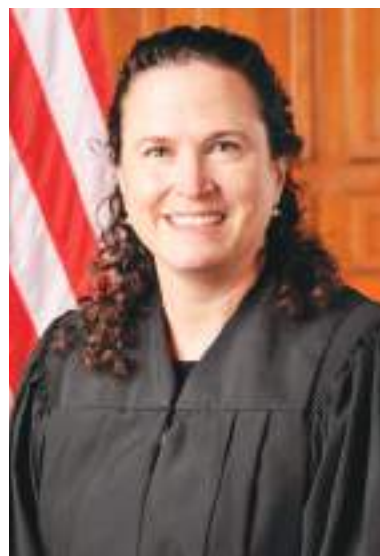
Juez Katherine Menéndez

"Los demandantes piden al Tribunal ampliar la jurisprudencia existente en un nuevo contexto en el que su aplicación es menos directa: un despliegue sin precedentes de agentes federales de inmigración armados para aplicar agresivamente la normativa de inmigración", explica la jueza en un documento de 30 páginas en