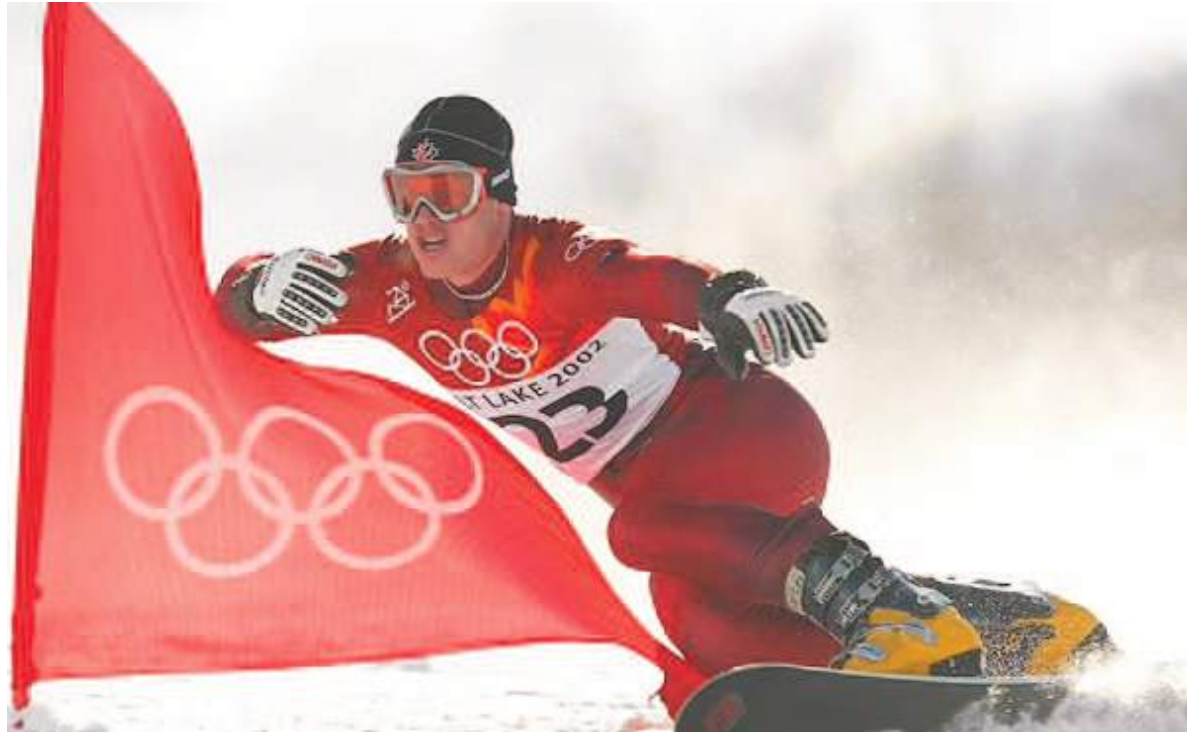
Wedding representó a Canadá en los Juegos Olímpicos de Invierno de 2002.

La acusación contra el detenido fue presentada por la Fiscalía del