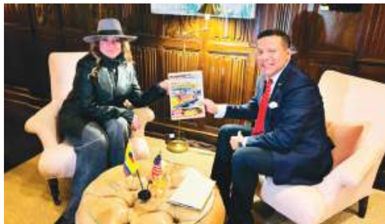
Embajadora Ivonne Baki, felicitó a Ecuador News por sus 30 años de servicio a la comunidad ecuatoriana en los Estados Unidos de América.

Con la candidatura de Ivonne Baki (nominada por Líbano), Ecuador tiene una oportunidad histórica que ubica al país en un sitial privilegiado en la Diplomacia Mundial. Mas allá de los enormes aportes que por cerca de 4 décadas ha venido realizando en beneficio del pueblo ecuatoriano de forma eficaz y magistral haciendo uso de su gran capacidad gracias a sus extraordinarias relaciones que ha construido a lo largo de su deslum-