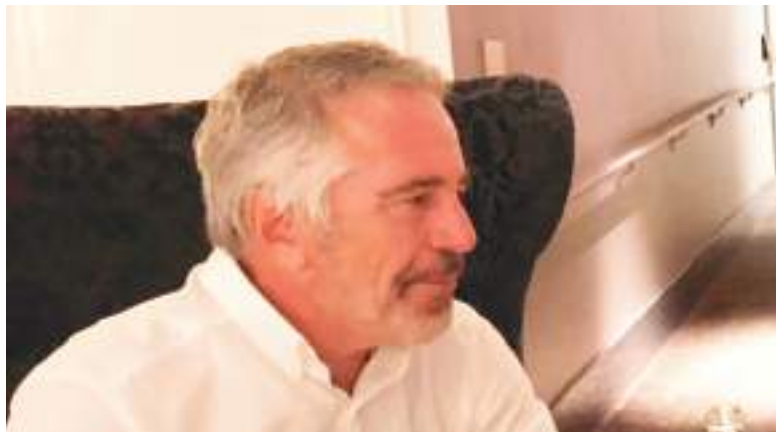
Personalmente, Jeffrey Epstein estuvo en Ecuador al menos dos veces.

Jeffrey Epstein fue un magnate con una considerable fortuna —cercana a los 578 millones de dólares al momento de su muerte,