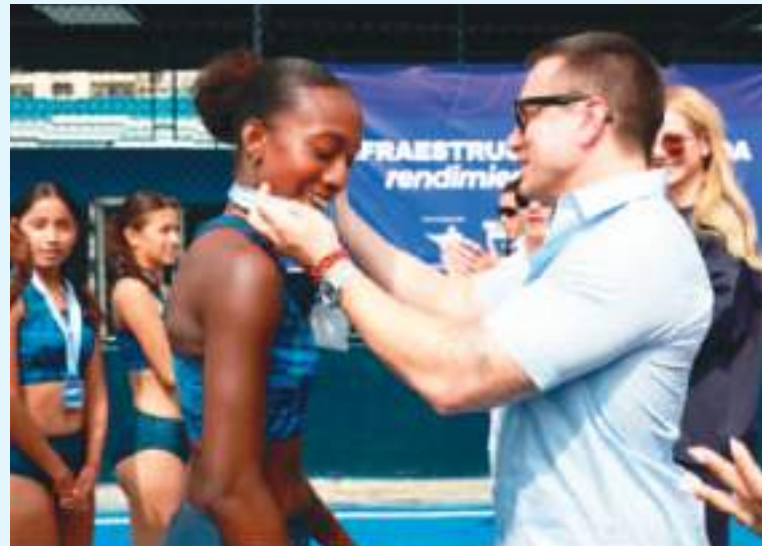
El presidente Daniel Noboa condecorando a una deportista ecuatoriana.

enemigos de su gobierno, así mismo ordene al ministro y subministro del deporte, que no estén pensando en querer apropiarse del Comité Olímpico Ecuatoriano, porque el COE no necesita personas mal intencionadas