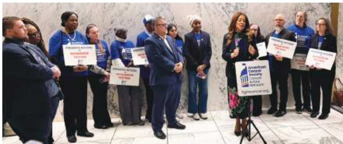
Sobrevivientes de cáncer se hicieron presentes en Albany para pedir impedir que Medicaid rebierta la cobertura para las pruebas de biomarcadores.

Además de su mensaje sobre las pruebas de biomarcadores, los activistas destacaron la importancia de mantener las inversiones en programas comprobados de prevención y detección temprana del cáncer, incluidos el Programa de Control del Tabaco de Nueva York y el Programa de Servicios contra el Cáncer.