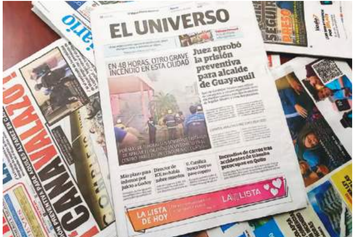
'El Universo' de Guayaquil se convirtió en el diario más influyente de Ecuador.

La nueva etapa de 'El Universo' estará "enfocada en fortalecer su liderazgo periodístico,