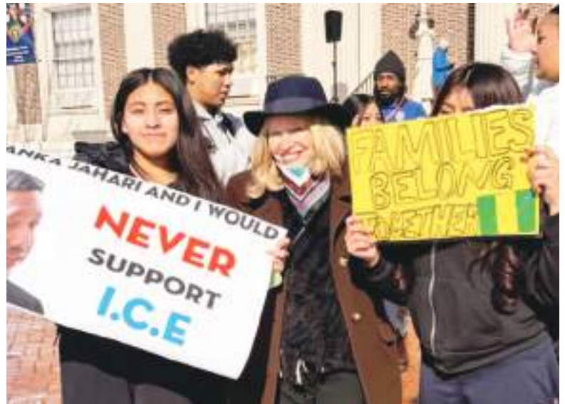
La juventud expresa su sentir con pancartas alusivas al rechazo que tiene el ICE, en las distintas comunidades de New Jersey.