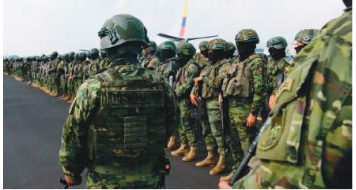
Soldados ecuatorianos en formación en la base militar Simon Bolivar de Guayaquil, listos para una acción.

CNN accedió a los documentos citados por Ecuavisa. Uno de ellos se titula “Informe para la coordinación, acreditación y gestión