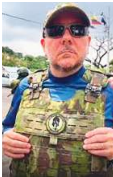
Ministro de Defensa, Gian Carlo Loffredo.

En un mensaje enviado a periodistas, el Ministerio dijo que las Fuerzas Armadas son una “institución apolítica” y que, en el marco de la declaración de conflicto interno armado que se mantiene desde enero de 2024 en