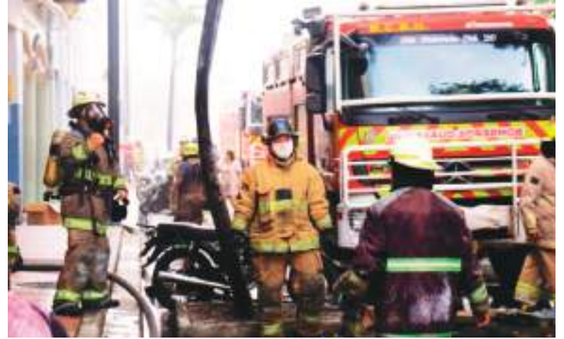
Los bomberos de Guayaquil están teniendo un trabajo exhaustivo.

En un comunicado señaló que ante «los graves y reiterados incendios» registrados en Guayaquil, solicitó de manera «inmediata y formal» a la Fiscalía el inicio de una «investigación exhaustiva» para determinar el origen de estos hechos y establecer responsabilidades penales, administrativas y