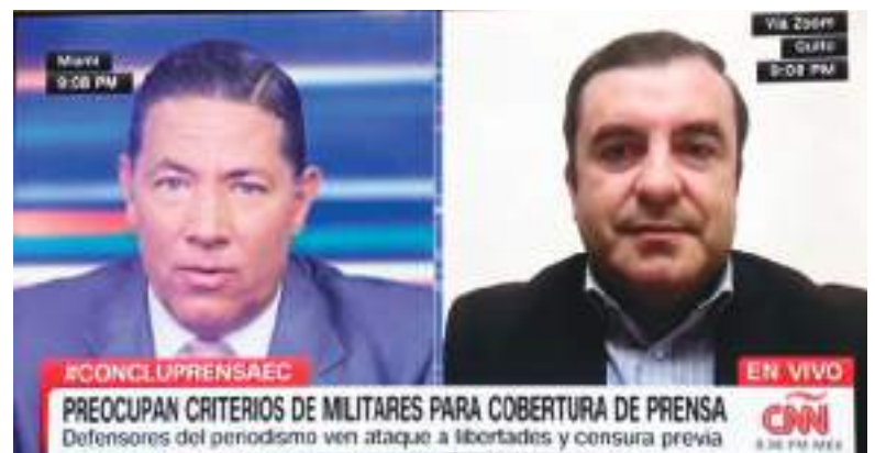
La cadena CNN se ha preocupado de la situación de periodistas en Ecuador.

Los lineamientos del Comando Conjunto de las Fuerzas Armadas de Ecuador tienen parecido con las reglas que el Departamento de Defensa de EE.UU. difundió en 2025 para la cobertura de sus actividades. Entre otras cosas, el Pentágono estableció que los periodistas no podrán publicar información que previamente no haya sido autorizada por la propia institución, una medida que generó molestia entre reporteros e hizo que algunos entregaran sus acreditaciones.