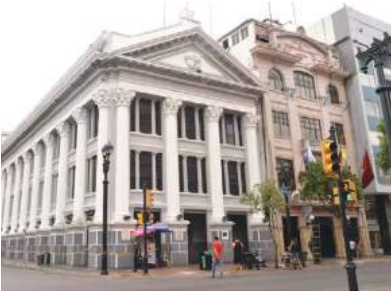
Sede de 'El Universo' en Guayaquil en la Av. Domingo Comín y Ernesto Albán.

socio gerente de Pardini Brokers & Advisors, una firma especializada en servicios de consultoría estratégica, fusiones/adquisiciones y mercados de capitales.