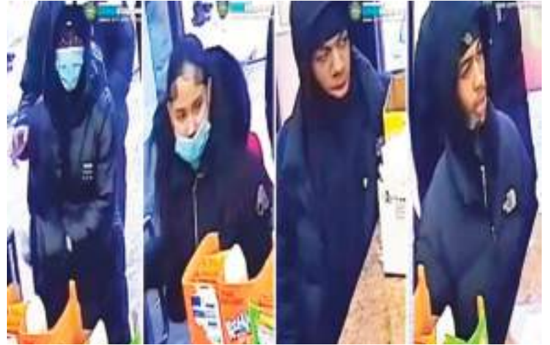
Sospechosos de haber estado en el problema que quitó la vida a Reddin.