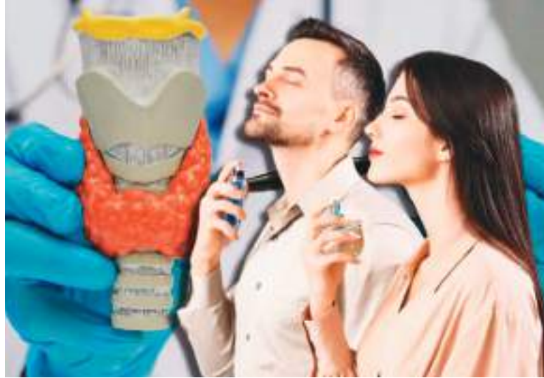
Los perfumes contienen ‘ftalatos’, sustancias potencialmente dañinas, pero aplicarlos en el cuello no representa riesgo.

Oler bien, ¿pero a qué costo? Recientemente, inició en redes sociales un debate con relación al uso de perfume y lociones corporales sobre el cuello, pues presuntamente causarían problemas de salud a nivel tiroideo.