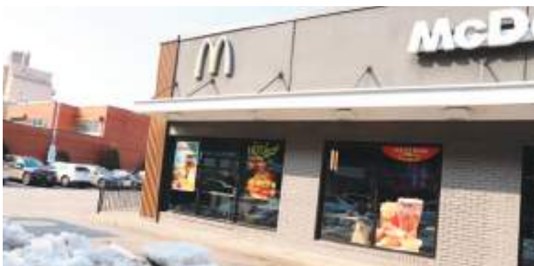
En este McDonald's, fue donde comenzó el problema del grupo de jóvenes.

Se solicita a cualquier persona que tenga información sobre los demás sospechosos que llame a la línea directa de Crime Stoppers del NYPD al 1-800-577-TIPS. La investigación continúa.