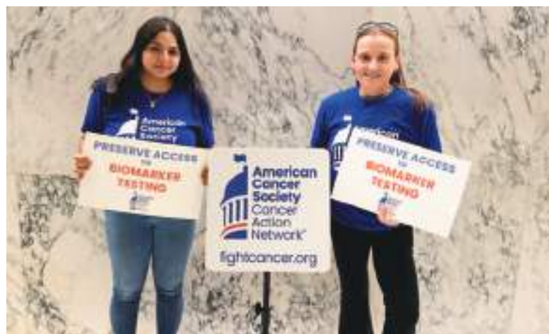
Las pruebas de biomarcadores ayudan a los profesionales e salud a decidir cual es el mejor tratamiento para el paciente afectados por el cáncer.

Tan solo en enero pasado, entró en vigor una legislación histórica