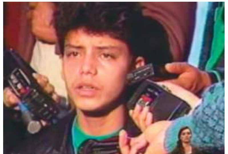
Ante la prensa se portaba como una estrella... Una mente retorcida.

La policía allanó la casa del joven, dejándose caer por una claraboya mientras dormía en la