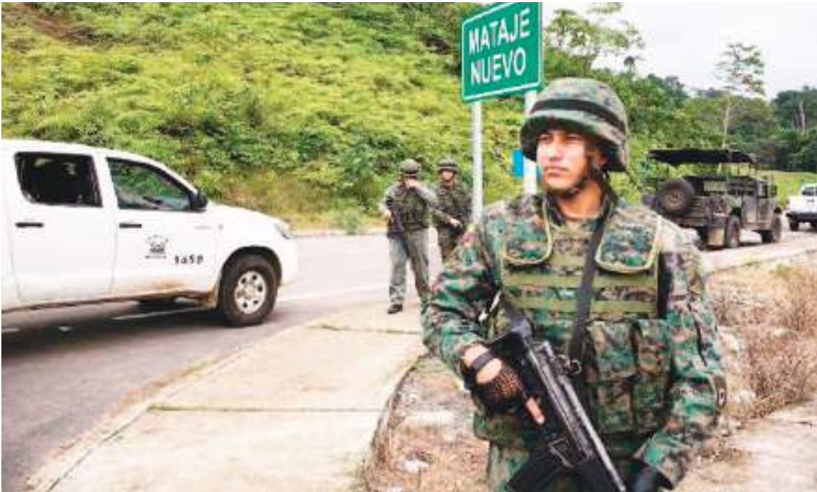
La medida podría ser un problema para la labor de prensa en las acciones militares en Ecuador.

el país, “tiene la facultad para emitir sus propios lineamientos de comunicación”. La institución agregó que ese criterio “no les exime de informar de manera transparente y oportuna las acciones en defensa del país” y dijo estar comprometida con la libertad de prensa.