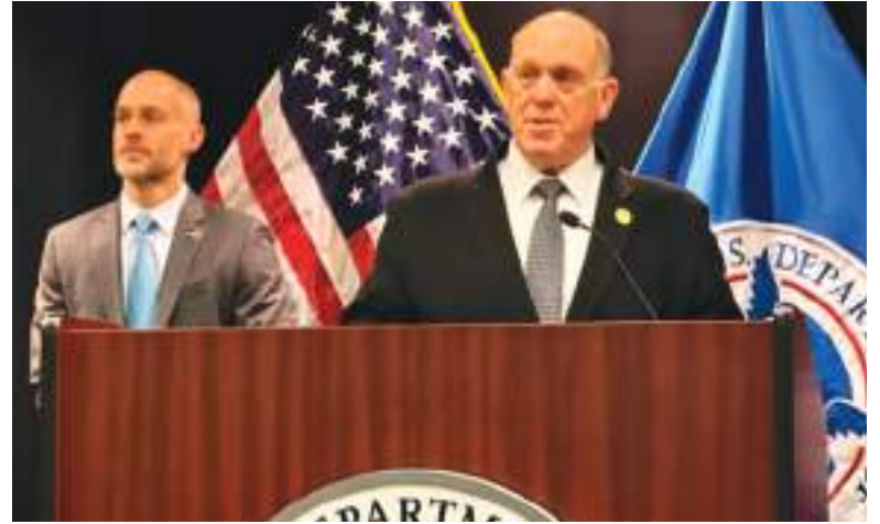
Tom Homan, zar fronterizo de EE.UU. anunciando la decisión.

“Será un camino largo”, expresó Walz en conferencia de prensa. “Los habitantes de Minnesota son vecinos decentes, cariñosos y amorosos y también son algunas de las personas más