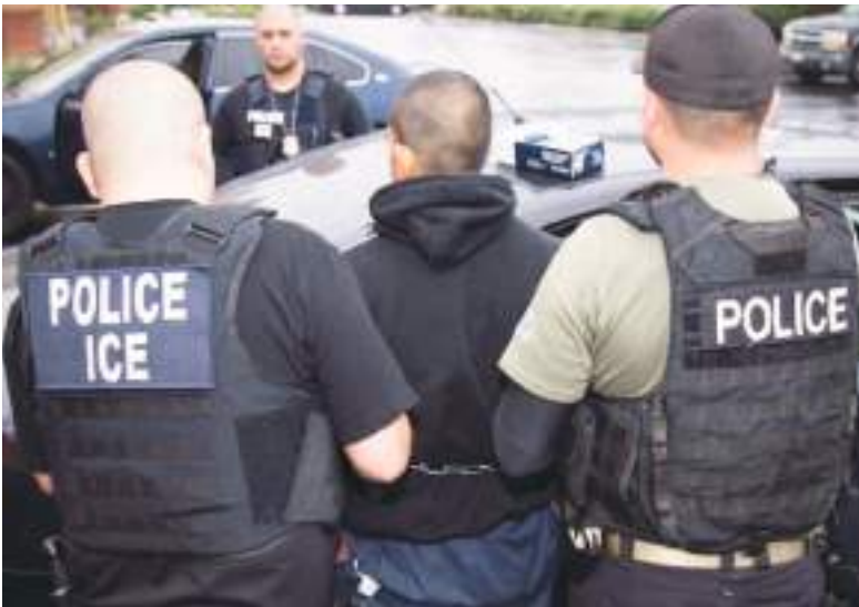
New Jersey, pese a ser considerado un estado santuario, no se escapa de la presencia de ICE y sus consecuencias para los inmigrantes detenidos.

La gobernadora Sherrill, junto con la Fiscal General vigente, Jennifer Davenport, y el comisionado