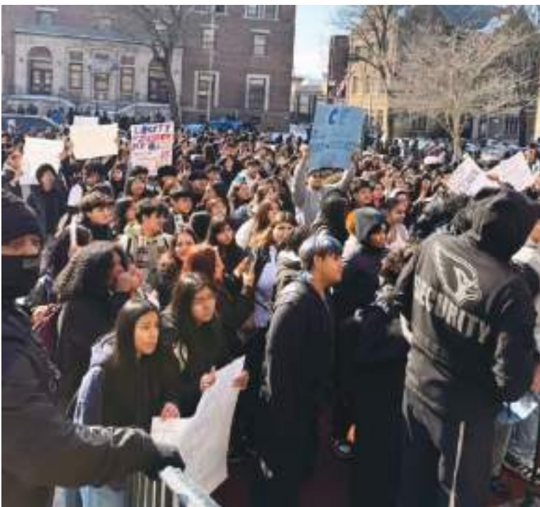
En Plainfield, los estudiantes de 'high school' realizaron una gran marcha días atrás e hicieron sentir su protesta en contra del gobierno federal.