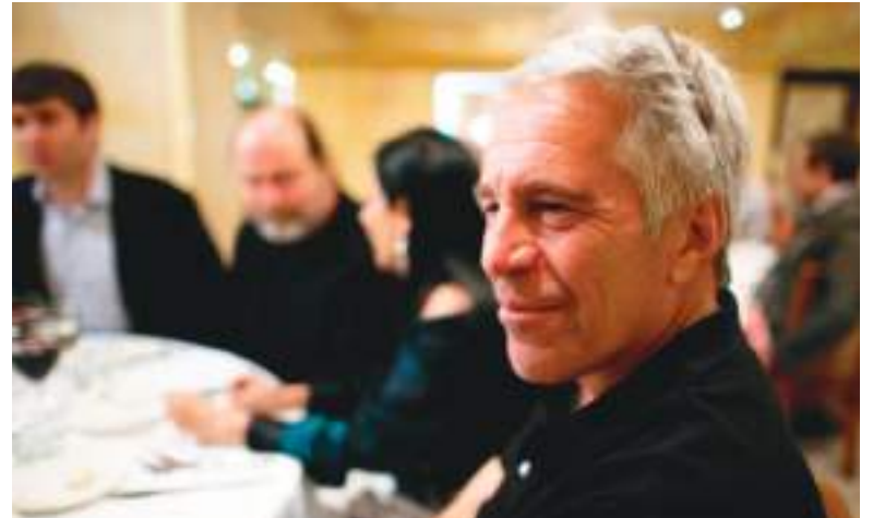
La sombra de Jeffrey Epstein sigue proyectada hacia Ecuador, pero hasta ahora nada vergonzante se menciona en los archivos desclasificados.

Las referencias ubican al país como destino frecuente de viajes privados, pero sin evidencia de