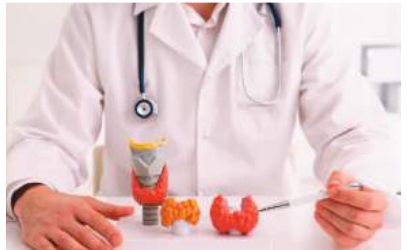
El sistema hormonal se regula en gran medida mediante la tiroides. La aplicación tópica de perfume no tiene la capacidad de producir daños a la salud.

Por tanto, ninguna autoridad científica establece que aplicar perfume en el cuello sea dañino para la tiroides o el sistema hormonal a niveles de uso normal. El riesgo potencial más discutido es de exposición acumulativa a múltiples productos que contengan esos mismos químicos, no del acto de aplicarlo en el cuello.