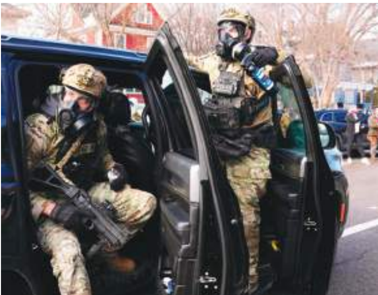
Para la comunidad de Minneapolis ha terminado lo que era una pesadilla.

“Pensaron que podían quebrarnos, pero el amor por nuestros vecinos y la determinación de resistir pueden durar más que una ocupación”, expresó el alcalde de Minneapolis, Jacob Frey, en redes sociales. “Estos patriotas de Minneapolis están demostrando que no se trata solo de resistencia: apoyar a nuestros vecinos es profundamente estadounidense”.