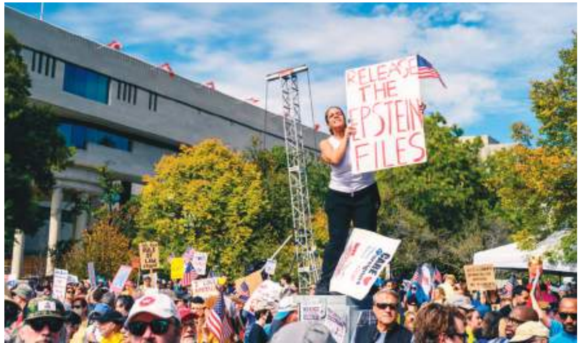
Mucha gente ha pedido la liberación total de los Archivos Epstein. Políticamente aun existen dudas de hacerlo.

Desde 2025, bajo la llamada Epstein Files Transparency Act, el DOJ ha identificado más de 1.200 víctimas a nivel global. Frente a ese volumen, las