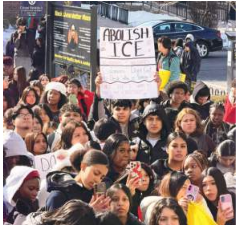
Estos estudiantes en la ciudad de Plainfield, salieron apoyar a los inmigrantes en días recientes, piden abolir el ICE.