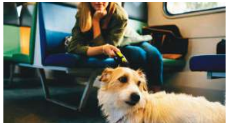
Cuidar de un perrito durante un vuelo es muy importante.

El perro ya encontró un hogar, hecho que alegró a miles de personas. Sin embargo, quienes siguieron su caso a través de las noticias y redes sociales hicieron el llamado a la tenencia responsable y a rescatar animales necesitados de ayuda: “Hay muchos perros que necesitan ayuda”.