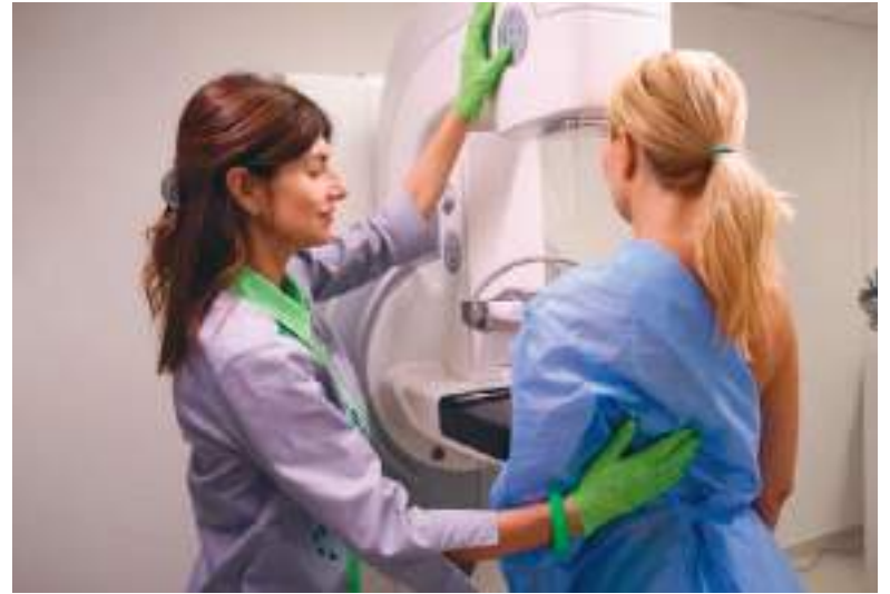
La integración de la inteligencia artificial en el sistema sanitario ha superado una prueba de fuego definitiva.

la inteligencia artificial es especialmente eficaz en la identificación de subtipos de cáncer clínicamente relevantes.