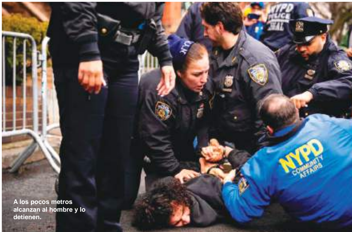
A los pocos metros alcanzan al hombre y lo detienen.

El enfrentamiento verbal entre ambos grupos derivó en incidentes cuando uno de los participantes encendió y lanzó un artefacto hacia una zona cercana a los agentes desplegados para controlar la protesta.