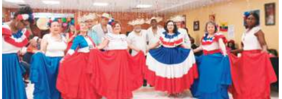
Los bailes que presentaron pusieron la alegría a este evento.

Los bailes y música tradicional de este país pusieron la alegría a este evento y motivó a que muchos los asistentes bailen acorde a estas melodías.