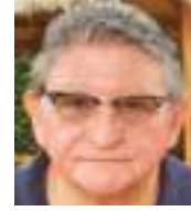
DAVID SAMANIEGO TORRES Especial para Ecuador News