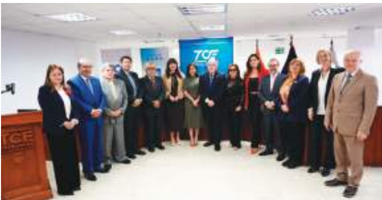
Miembros del Tribunal que tomaron la medida de suspender a RC.