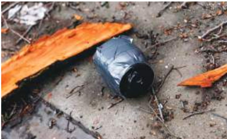
Varios explosivos como este fueron lanzados.

o incluso la muerte si hubiera detonado correctamente. El dispositivo estaba compuesto por un recipiente con tornillos, tuercas y otros fragmentos metálicos, además de una mecha para su activación.