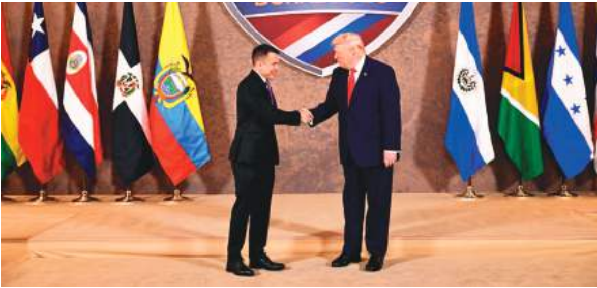
Donald Trump ha sido siempre muy afectuoso con el presidente de Ecuador, Daniel Noboa.