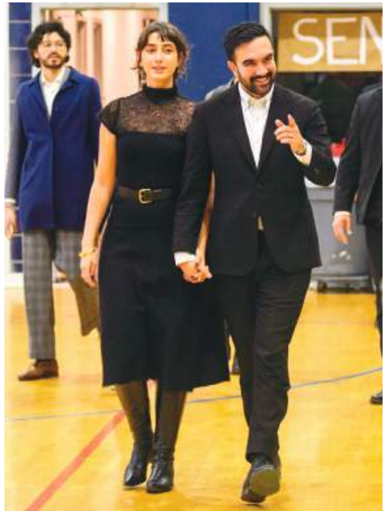
El alcalde Mandani y su esposa no se encontraban en el lugar.

Para la policía de Nueva York, el incidente ha servido como recordatorio de que incluso protestas aparentemente pequeñas pueden escalar rápidamente hacia situaciones de riesgo mayor si intervienen actores radicalizados o dispuestos a emplear violencia.