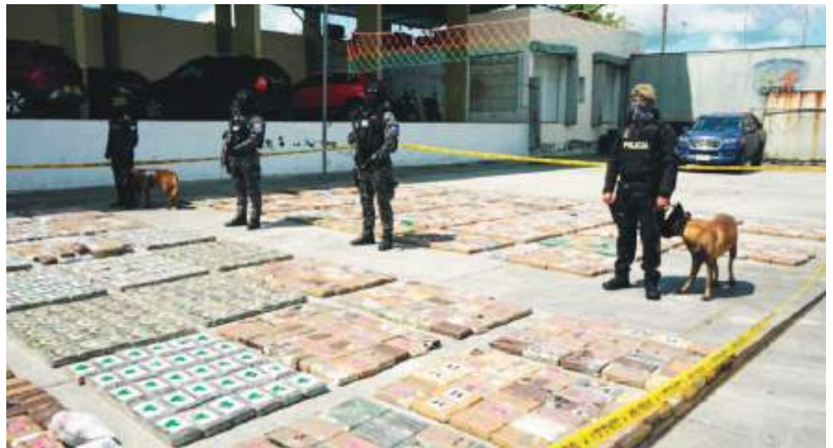
Ecuador ha luchado siempre con todas las fuerzas para vencer el flagelo de las drogas.

Trump confirmó lo dicho previamente por otros funcionarios de su administración respecto a que la coalición también se enfocará en combatir "la inmigración ilegal y masiva".