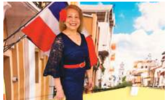
Hermosa representante de la comunidad Dominicana posando para nuestras cámaras.