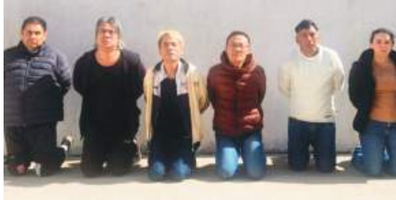
Las autoridades detuvieron seis personas, entre ellas tres ciudadanos de nacionalidad china y tres ecuatorianos

La organización operaba con una estructura organizada que incluía contratos de trabajo simulados, listados de víctimas y registros de pagos y transferencias, documentos que evidenciarían el funcionamiento de la red.