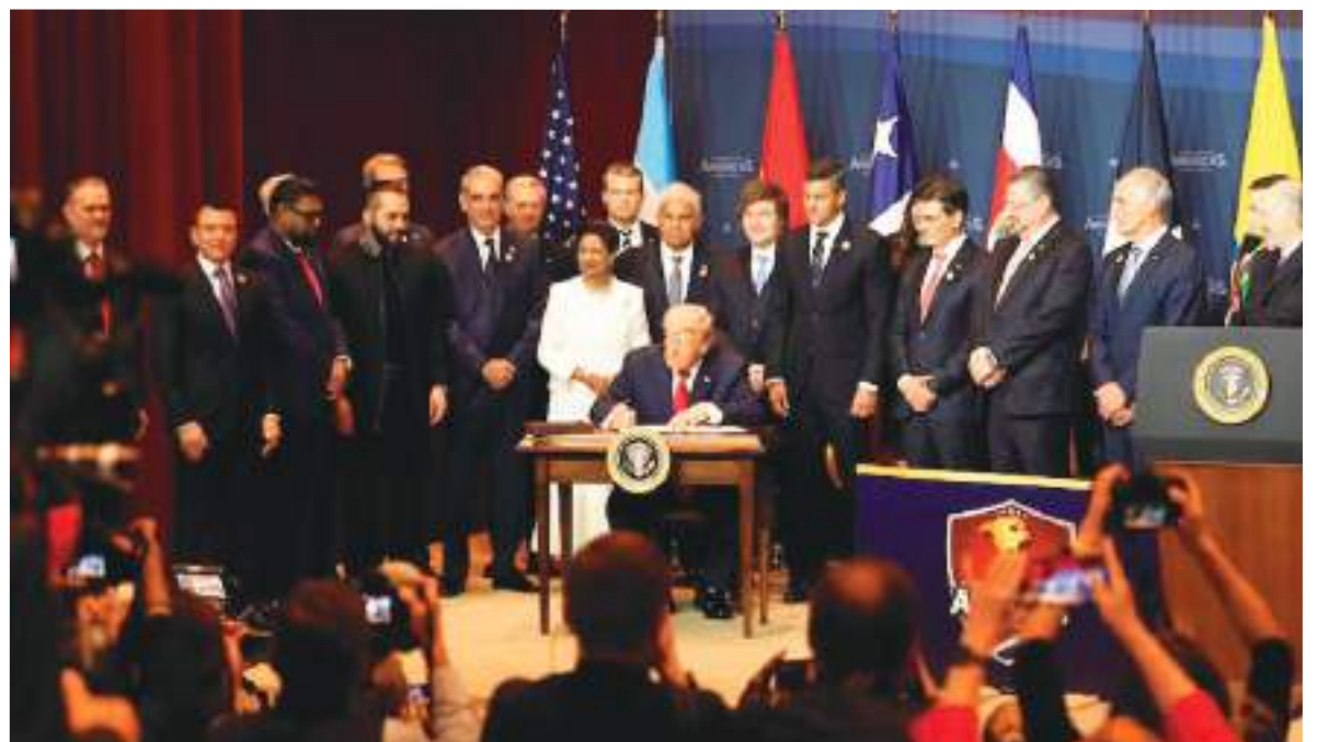
La reunión se enfocó en la creación de una Coalición Anticarteles de las Américas.

Después de firmar el documento que pone en marcha la Coalición Anticarteles de las Américas, Donald Trump les entregó un lapicero a cada uno de los 12 presidentes de América