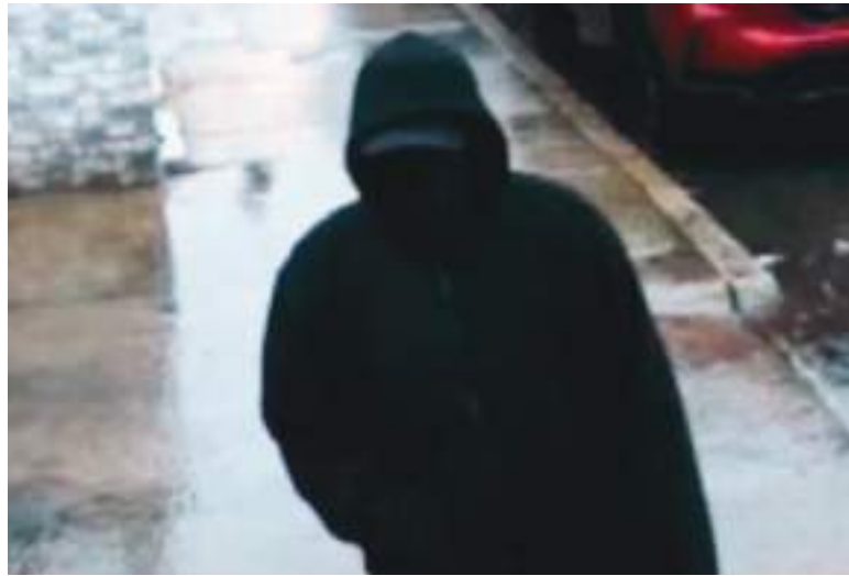
Imagen de una cámara de seguridad del sospechoso que, según la policía, utilizó Google Translate durante un intento de robo en un restaurante ecuatoriano en el barrio Ironbound de Newark, NJ.

El sospechoso habría utilizado la aplicación para traducir sus palabras del inglés al español, aunque no era necesario, ya que la cajera también hablaba inglés, según