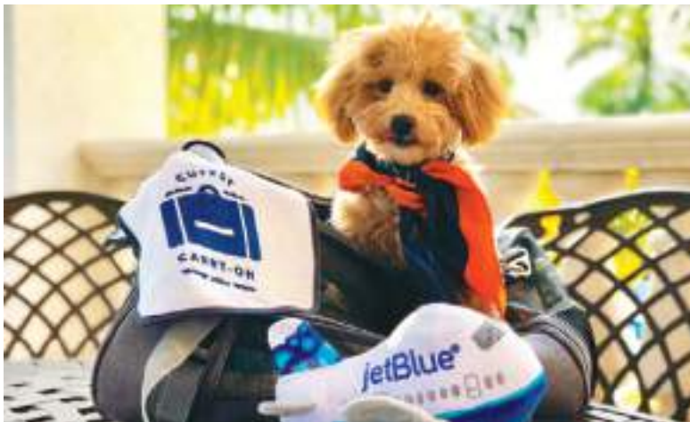
JetBlue ha recibido numerosos regalos de la gente.

su mascota, al aeropuerto a registrarse para tomar un vuelo. Al llegar al mostrador del recinto, el empleado de la aerolínea JetBlue que se encargó de atenderla, le pidió a la mujer la documentación requerida que exigen las aerolíneas para volar con perros.