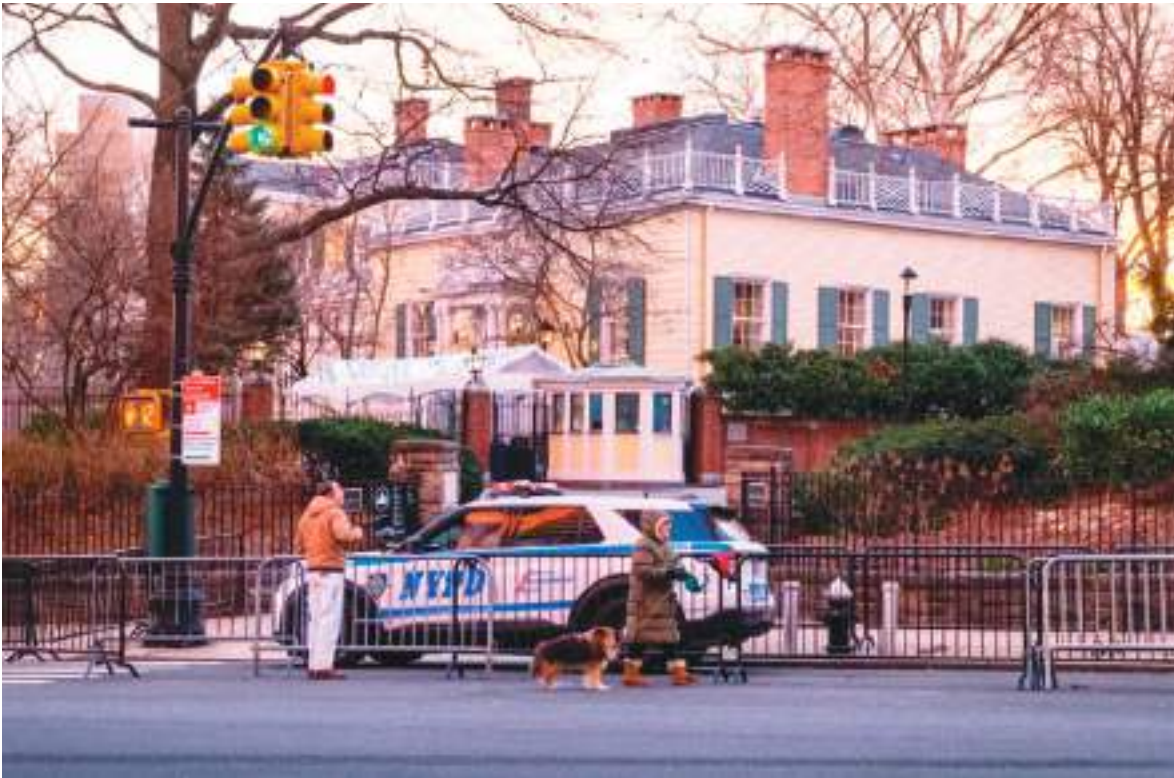
Por estos días de tensión por lo que ocurre en Irán, Gracie Mansion mantiene estricta vigilancia.