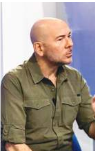
Ministro de Defensa ecuatoriano, Gian Carlo Loffredo.