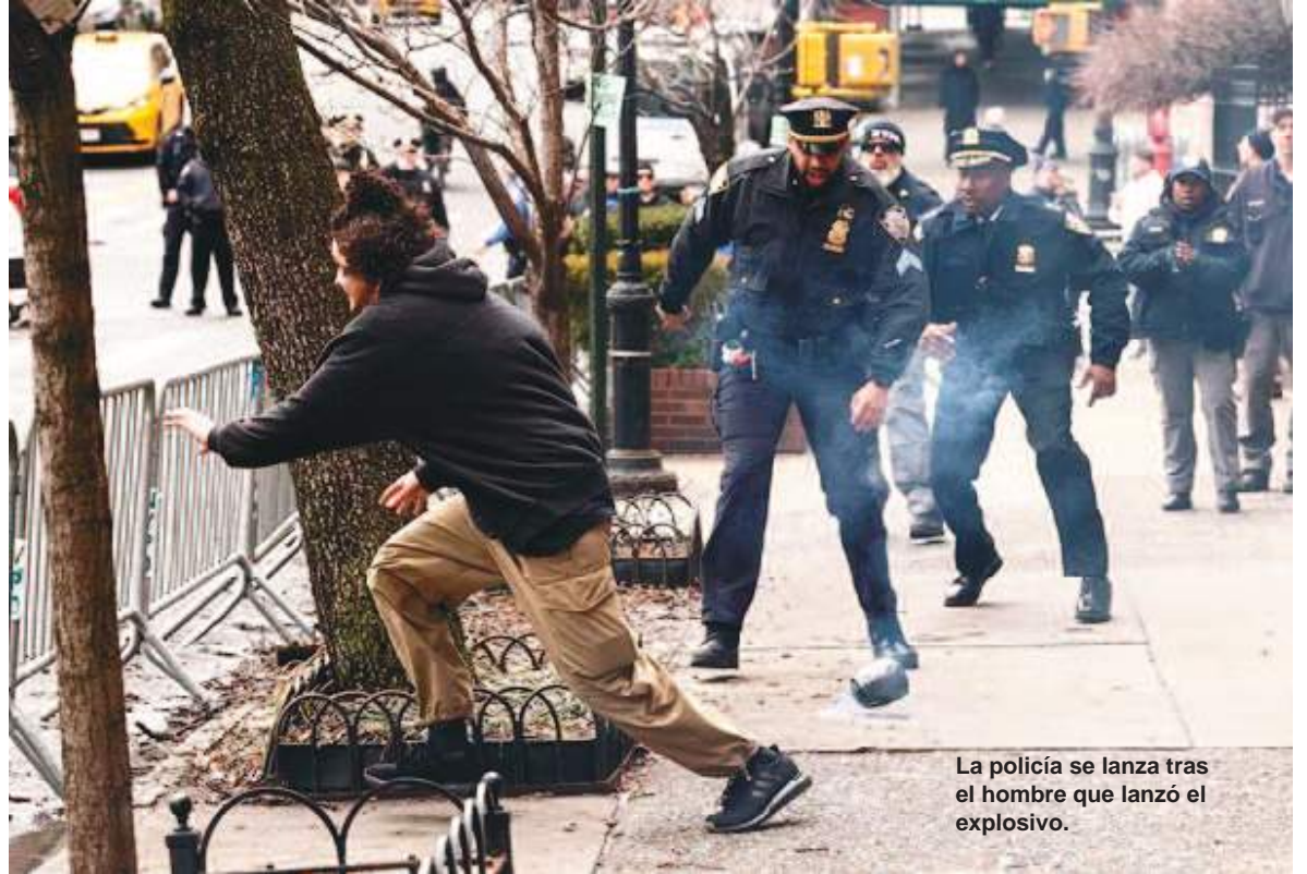
La policía se lanza tras el hombre que lanzó el explosivo.

Los hechos se produjeron durante una manifestación organizada frente a la residencia del alcalde, situada en el Upper East Side de Manhattan. El acto había sido convocado por un pequeño grupo de manifestantes de extrema derecha que denunciaban lo que calificaban como una supuesta "islamización" de la ciudad. A la protesta acudieron también nume-