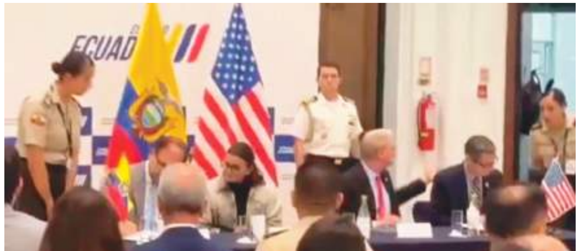
Representantes de la Oficina Federal de Investigaciones (FBI) y del gobierno de Ecuador, inauguraron las primeras oficinas de la dependencia en la ciudad de Quito.

Aunque esta es la primera oficina física, la FBI ya ha colaborado previamente en casos críticos en Ecuador. Entre ellos, la investigación del asesinato del candidato presidencial Fernando Villavicencio, en agosto de 2023 y el peritaje tras el atentado con coche bomba en San Lorenzo, Esmeraldas, en 2018.