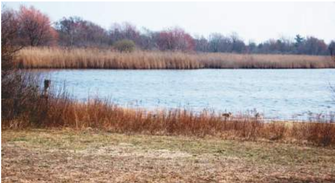
Refugio de Vida Silvestre de Jamaica Bay donde hallaron parte del cuerpo de la occisa.