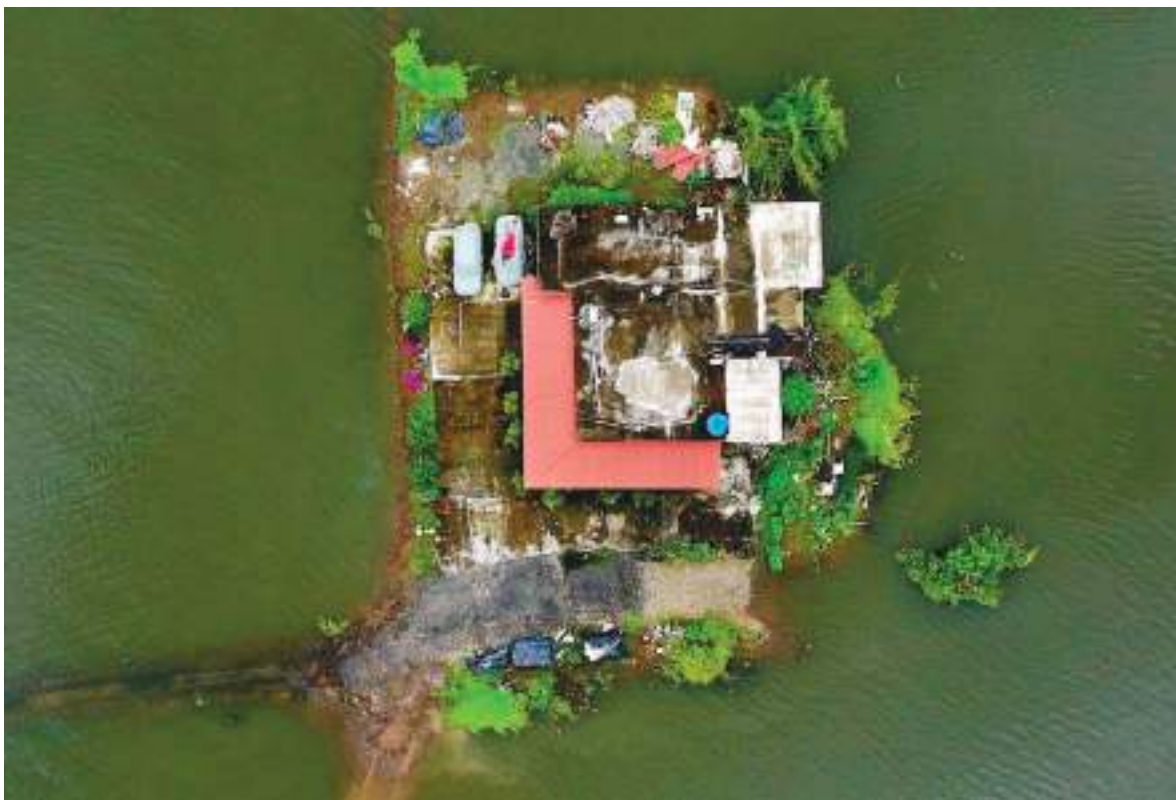
Esta vista aérea muestra una casa inundada luego de fuertes lluvias.

"Estamos inundados, no hay trabajo, no tenemos agua, no tenemos luz porque incluso ya cortaron la energía", dijo a la agencia de noticias AFP Mariuxi Morales, una de las afectadas que caminaba con el agua a la cintura en Babahoyo (suroeste), capital