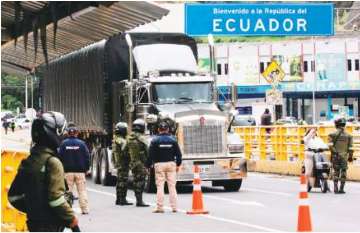
El paso fronterizo es estrictamente vigilado. Las pérdidas van en aumento para los dos países.

que refleja el descontento de varios gremios frente a la situación.