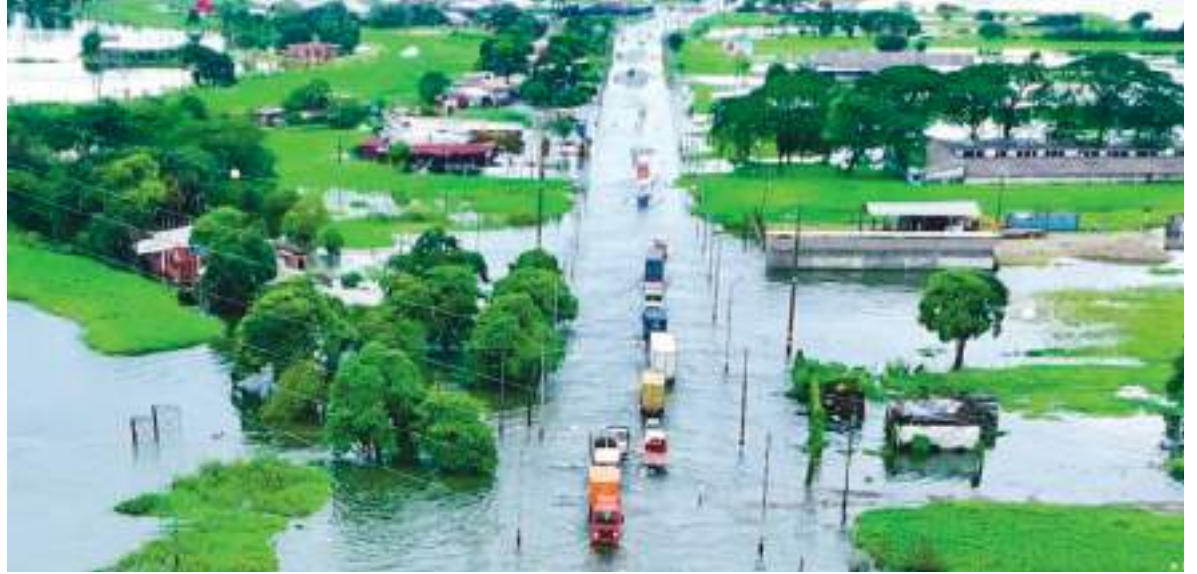
Vehículos circulan por la carretera inundada Jujan-Babahoyo, luego de fuertes lluvias en Jujan, provincia de Guayas.

Ecuador declaró la emergencia nacional por 60 días para hacer frente a una dura temporada de lluvias que desde enero deja 11 muertos y más de 50.000 afectados, según las autoridades.