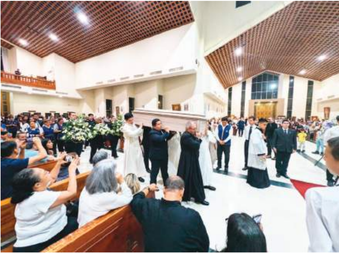
Hermanos sacerdotes y fieles en su hogar: la Parroquia San Alberto Magno. Todos acudieron la despedida.

quia, deja un legado de fe, cercanía y amor por la comunidad”, resaltó la parroquia.