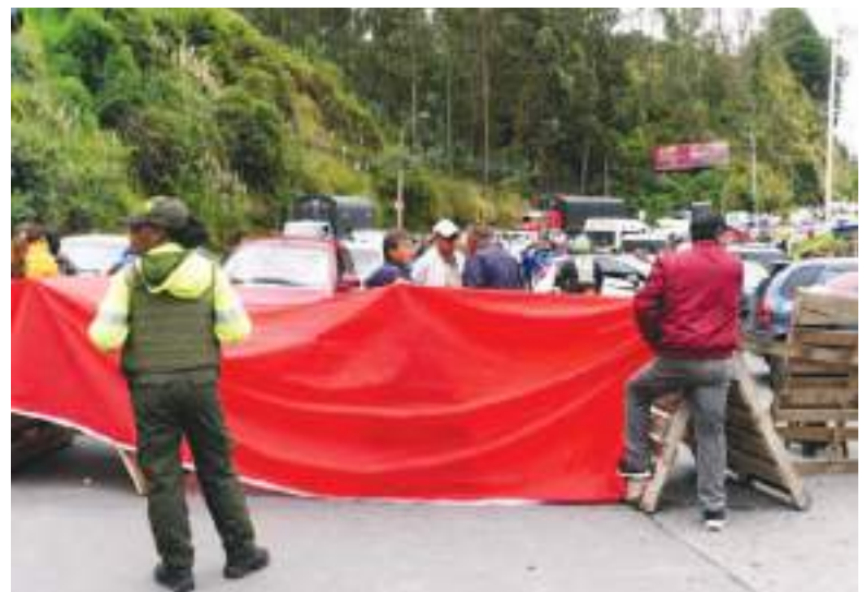
Gremios de comerciantes y transportistas bloquean la carretera que cruza la frontera entre Colombia y Ecuador para protestar contra la guerra comercial.

El futuro de la relación binacional dependerá en gran medida de la capacidad de ambos gobiernos para priorizar el bienestar económico y social sobre las tensiones políticas, y para encontrar soluciones que permitan restablecer la confianza y la cooperación en la región andina.