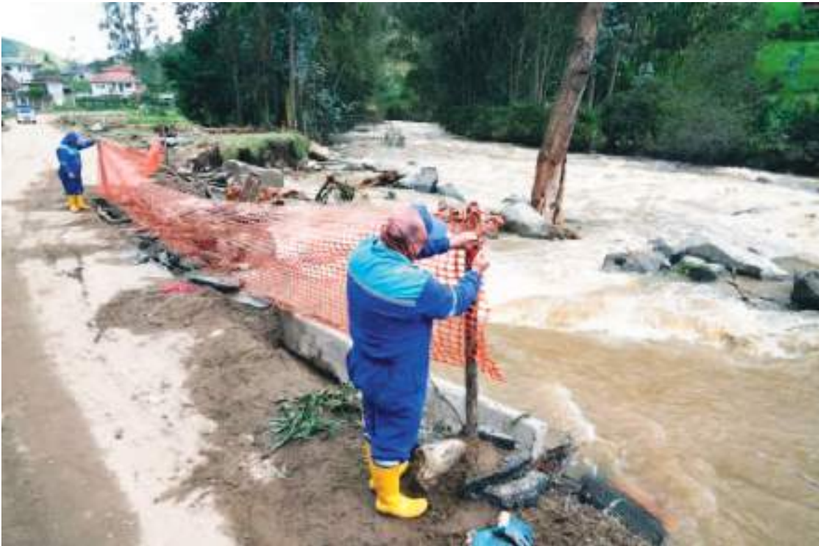
Unos operarios acordonan una carretera dañada por el desbordamiento del río Yanuncay en el área de Barabón de la ciudad ecuatoriana de Cuenca el 13 de marzo de 2026