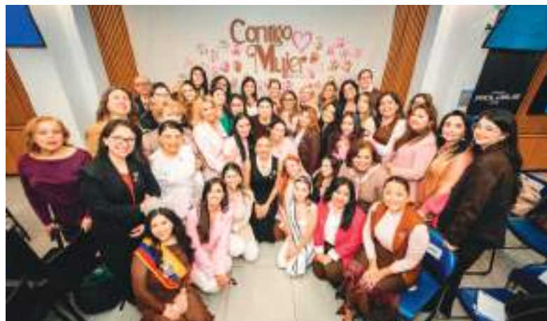
El grupo de mujeres que forman parte de este proyecto Contigo Mujer.