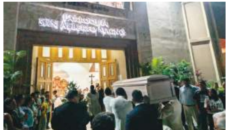
En la parroquia de San Alberto Magno se congregaron los fieles.

“Frente a esta noticia tan triste, tan impactante, nosotros solamente podemos decir, creo en ti Señor Jesús. Confío en ti Jesús. Y confío que lo que tú me ofreces como una enseñanza, a través también de algunos acontecimientos impactantes, es para mi bien”, agregó.