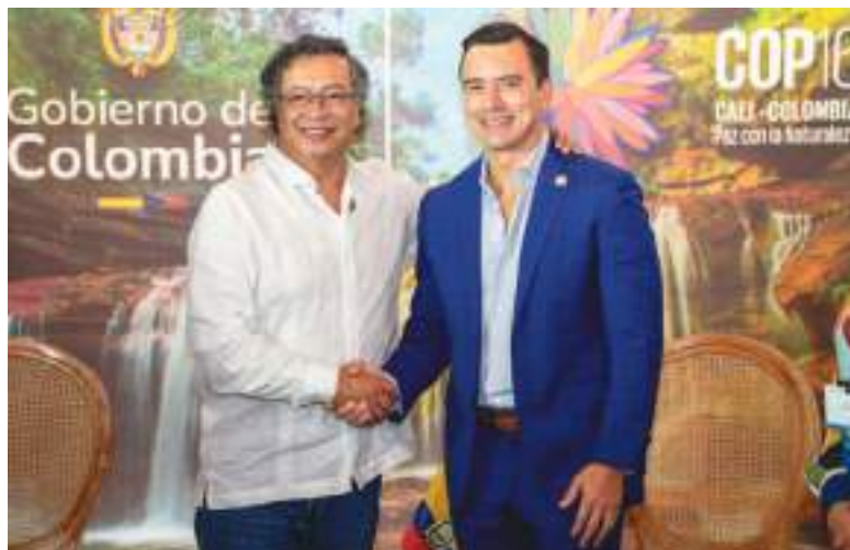
Presidentes Gustavo Petro y Daniel Noboa en la COP16, en Cali (Colombia), el 29 de octubre de 2024. Una relación que de repente se rompió.

-En el lado colombiano, camioneros iniciaron un paro indefinido y bloqueos en el puente de Rumichaca, paralizando el tránsito comercial en un gesto de protesta