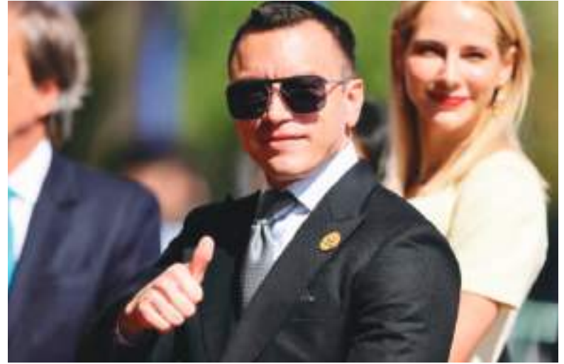
Daniel Noboa, asiste a la ceremonia de investidura de su homólogo de Chile, José Antonio Kast, el 11 de marzo de 2026 en Valparaíso.

Agregó que "Ecuador tenía dos caminos: quedarse quieto o ir a buscar mejores condiciones.