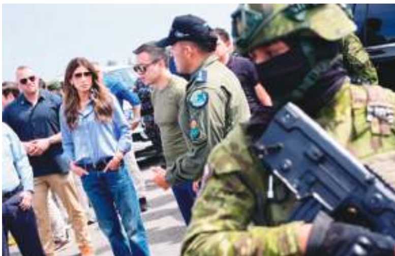
Noem y Noboa han construido una destacada amistad.

Esta condecoración se dio en medio de la polémica surgida por las informaciones periodísticas que apuntan a que el supuesto campamento de los Comandos de la Frontera, un grupo disidente de la guerrilla de las Fuerzas Armadas Revolucionarias de Colombia (FARC), atacado recientemente por las Fuerzas Armadas de Ecuador era, en realidad, una granja.