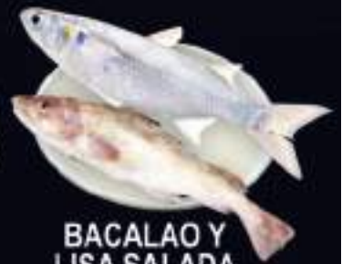
BACALAO Y LISA SALADA

102-05 Roosevelt Ave, Corona New York 11368