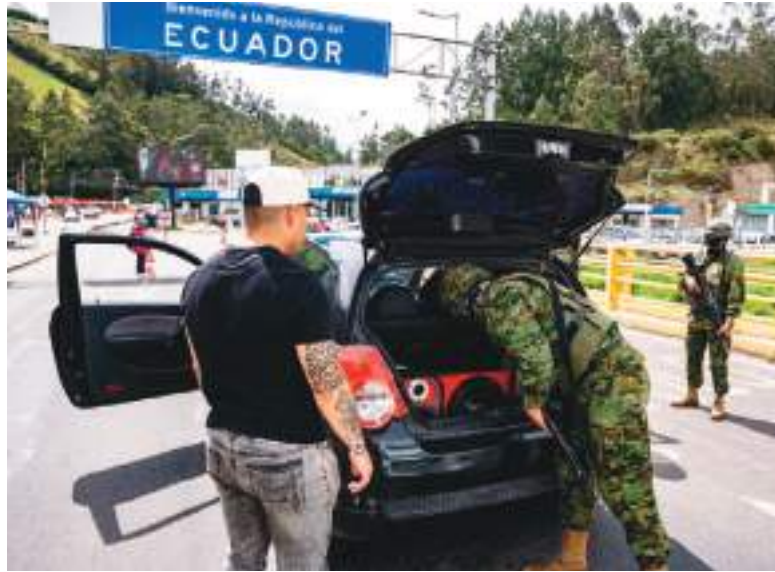
Las medidas de precaución son estrictas en la zona.

Flores anotó que a diario atraviesan el paso fronterizo 250