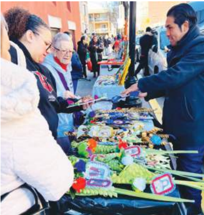
Iglesia de San Agustín en Unión City: Artesanos emprendedores demuestran sus habilidades artísticas confeccionando alegorías relacionadas con el Domingo de Ramos.

de la tradicional fanesca y mantienen vigentes las costumbres en esta época del año.