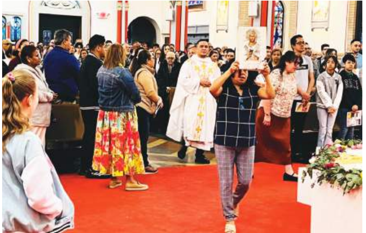
Los católicos demuestran su fe religiosa acudiendo masivamente a las iglesias, especialmente la comunidad ecuatoriana e hispana en general.

La arquidiócesis de Newark y parroquias locales ofrecen servicios litúrgicos durante esta semana. Además, muchos distritos escolares en el Estado Jardín tienen su receso de primavera durante estas fechas, nuestra comunidad ecuatoriana residente en varias ciudades, se unen con profunda tradición católica, mismos que acuden a las misas y procesiones con mucha fe; además, disfrutan