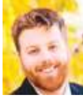
JON HOCHSCHARTNER Especial para Ecuador News

E l ataque imperialista del presidente Donald Trump contra Irán, que ha cobrado innumerables vidas inocentes y se cobrará muchas más antes de terminar, es una guerra de agresión no autorizada y sin provocación. Además de ser inmoral e ilegal, tanto según el derecho interno como el internacional, el conflicto también representa un derroche colosal de dinero.