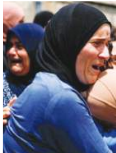
Las verdaderas perdedoras.

En paralelo, la seguridad se ha convertido en otra preocupación. Las autoridades estadounidenses