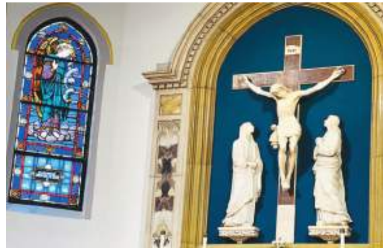
La Crucifixión de Jesús: Poncio Pilato, ordenó colocar un letrero que decía "Jesús Nazareno, Rey de los Judíos", INRI, en hebreo, latín y griego. Este hecho es histórico y central en el cristianismo.

La Semana Santa culminará este domingo de Pascua, siendo un día festivo y de unidad familiar en el que se festejan con juegos y otras actividades, antes se celebra el sábado de Gloria.