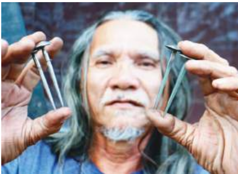
Enaje muestra los clavos con los que ubican en una cruz de madera.

carpintero— que pusiera fin a este espectáculo anual debido al debilitamiento de sus pulmones.