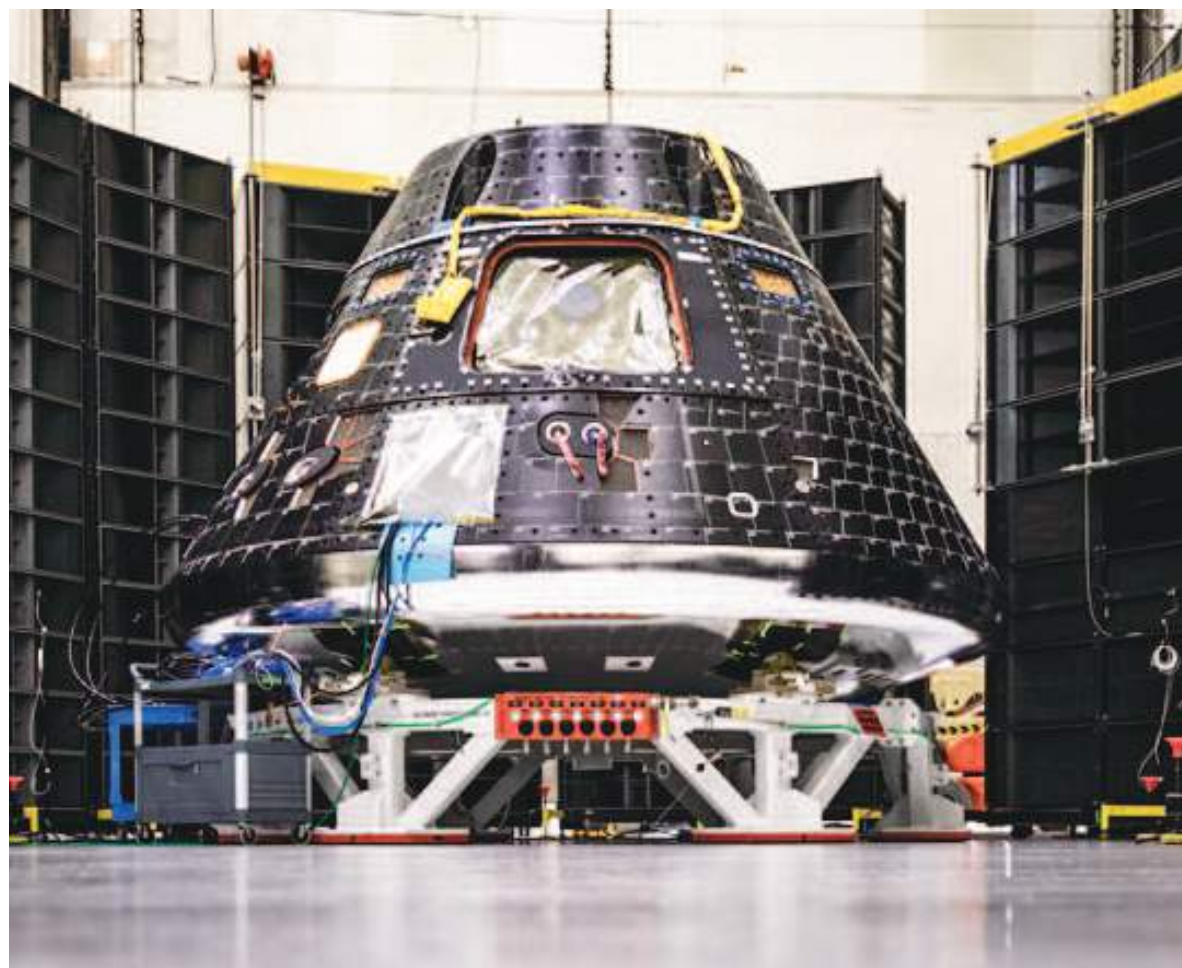
Orion, la cápsula de Artemis II que lleva a los astronautas en su viaje.

Las respuestas son variadas, pero todas coinciden en que de algo le servirá a la humanidad este tipo de misiones.