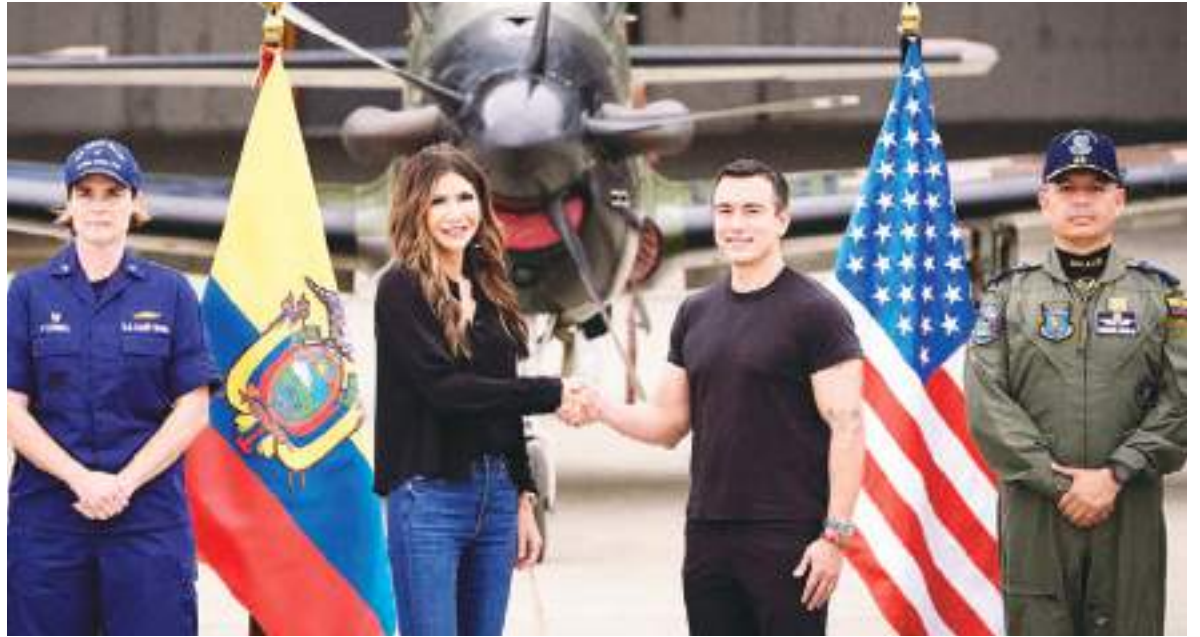
El presidente Noboa se reúne con la ex secretaria de Seguridad Nacional de EE. UU., Kristi Noem, en Manta, Ecuador.

Estas medidas surgen en un momento en que Noboa enfrenta presiones para dar respuesta a los crecientes niveles de violencia en Ecuador. Su administración ha logrado capturar a los líderes de los grupos de crimen organizado más poderosos del país: Los Lobos, Los Choneros, Los Tiguerones y Los Chone Killers. Sin embargo, estas