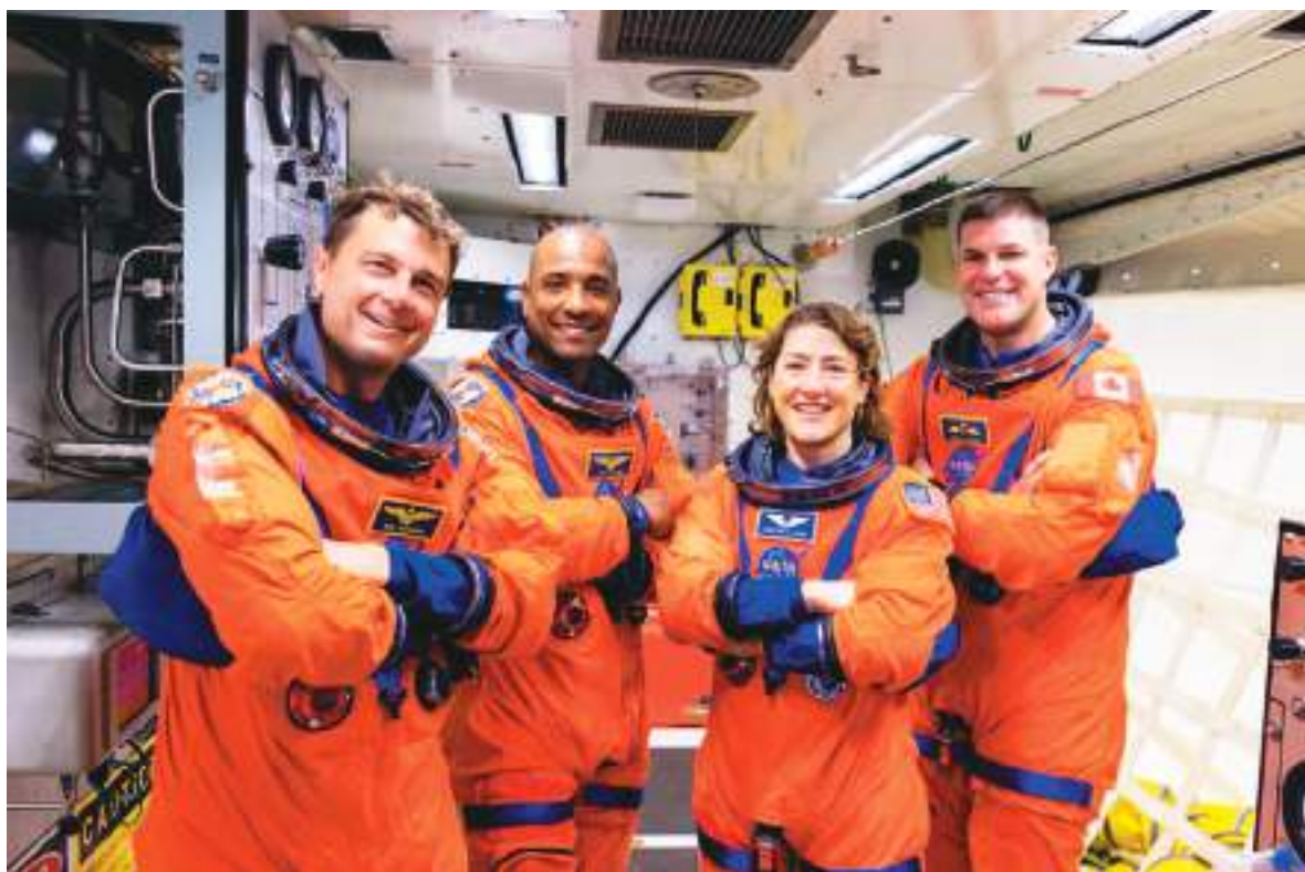
Los astronautas de la misión Artemis II de la NASA, de izquierda a derecha, Reid Wiseman, Victor Glover y Christina Koch, y el astronauta de la CSA (Agencia Espacial Canadiense) Jeremy Hansen.

para el futuro de la exploración humana.