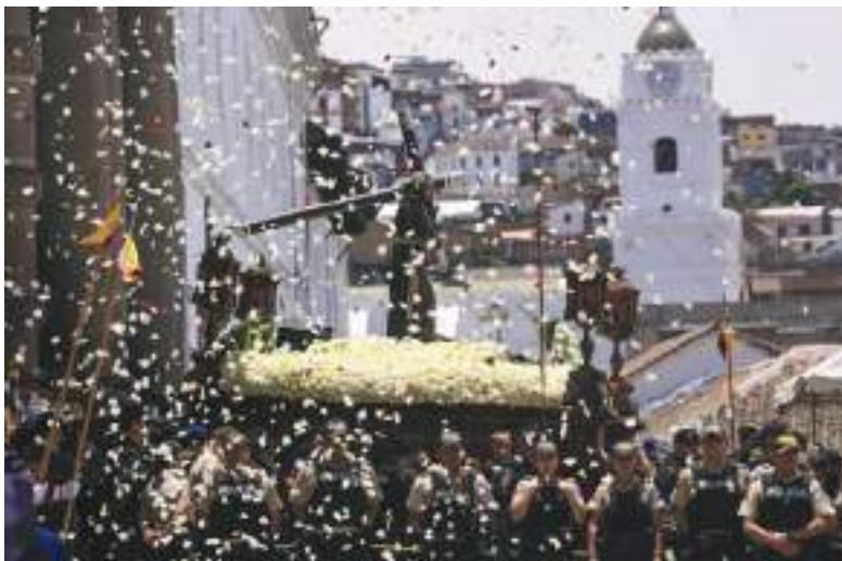
Esta procesión fue declarada como Patrimonio Cultural Intangible de Quito.