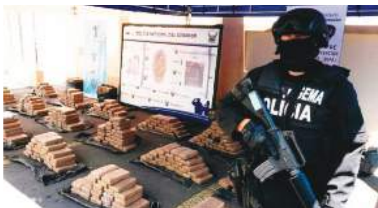
La incautación es permanente en Ecuador, pero hay otros frentes de lucha.

«Deberíamos aspirar a ver ese tipo de intercambio de inteligencia, capacitación y enjuiciamiento de delitos», afirmó Bosworth en referencia al anuncio del FBI. «Eso es mucho mejor que lanzar bombas sobre los criminales y tiene muchas más probabilidades de tener éxito a largo plazo».