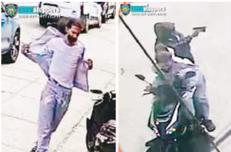
Dos individuos son buscados en relación con el tiroteo mortal de un bebé de 7 meses. Uno de ellos ya fue capturado.

«Estaba abrazando (a mi hijo) y, de repente, cuando miré a mi