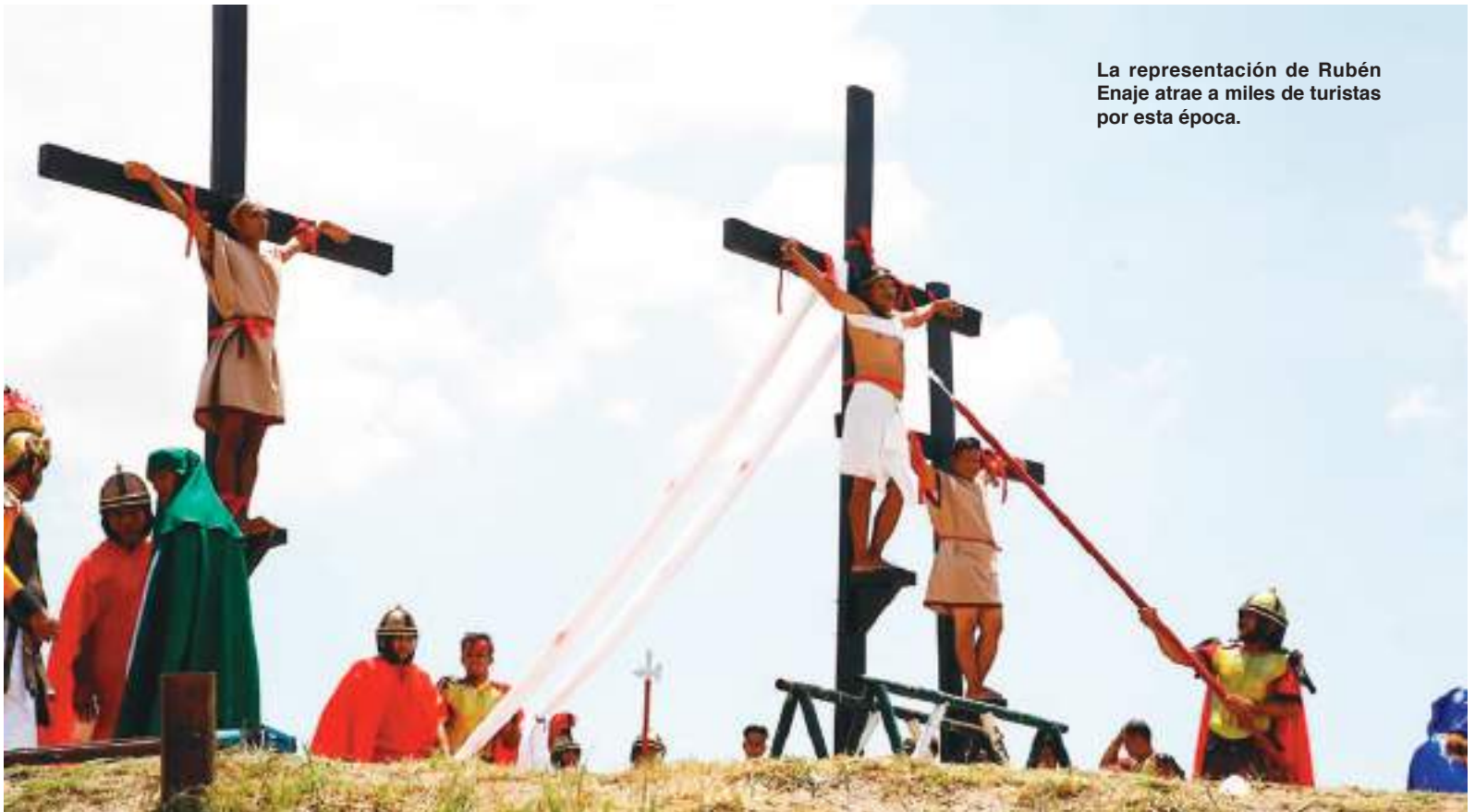
La representación de Rubén Enaje atrae a miles de turistas por esta época.