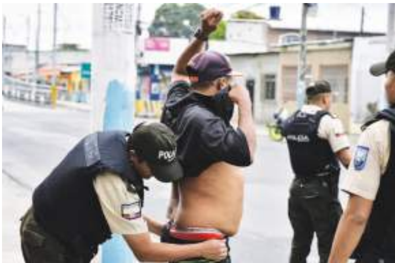
El gobierno ha endurecido mucho más las medidas preventivas.

El 3 de marzo, el Comando Sur de los Estados Unidos anunció que estaba llevando a cabo operaciones conjuntas con Ecuador contra «narcoterroristas». El gobierno estadounidense considera a dos grupos criminales ecuatorianos —Los