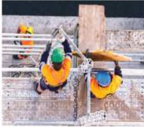
El papel que juega Ginarte en la protección de los trabajadores lesionados

En medio de esta controversia se encuentra el abogado Ginarte, que es reconocido por su