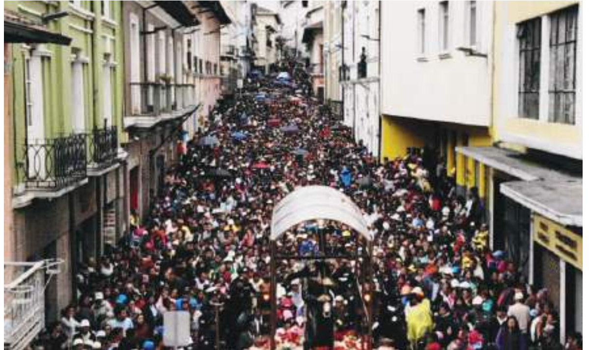
Es una bonita tradición que se niega a desaparecer en Ecuador, por el contrario, cada día se fortalece.

Miles de devotos de distintas edades recorrieron el viernes santo el centro histórico de Quito, la capital de Ecuador, para renovar su fe en la procesión de Jesús del Gran Poder, uno de los eventos más emblemáticos de la Semana Santa en el país andino y también de los más tradicionales de América Latina.