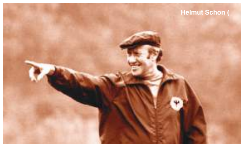
Helmut Schön (

Helmut Schön mantiene este registro desde hace más de medio siglo, cuando se lo arrebató a su mentor, Sepp Herberger. Didier Deschamps lo igualaría si conduce a Francia hasta los cuartos de final y lo superaría en caso de avanzar una ronda más. Además, el actual seleccionador francés necesita tres victorias para batir también la marca de Schön como el técnico con más triunfos en la historia de la Copa Mundial.