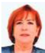
MARIANA VELASCO Especial para Ecuador News

D udas y cuestionamientos no hacen bien a la democracia. Actuar con transparencia es imperdible. El juego político del Consejo Nacional Electoral-CNE- es de vieja data. Cual plastilina se ha moldeado a los gustos e intereses de los gobernantes de turno, mientras sus integrantes disfrutaban de una auto prórroga, al parecer indefinida.