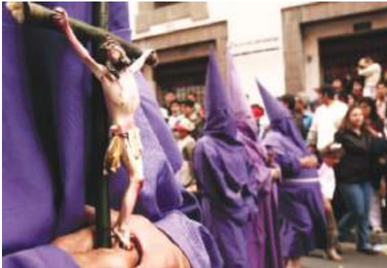
El fervor es total, lo que es admirado por los turistas que llegan a participar.

El recorrido de este año tuvo algunos cambios, pero eso no impidió que los fieles llenaran las calles para mantener viva una tradición transmitida de generación en generación.