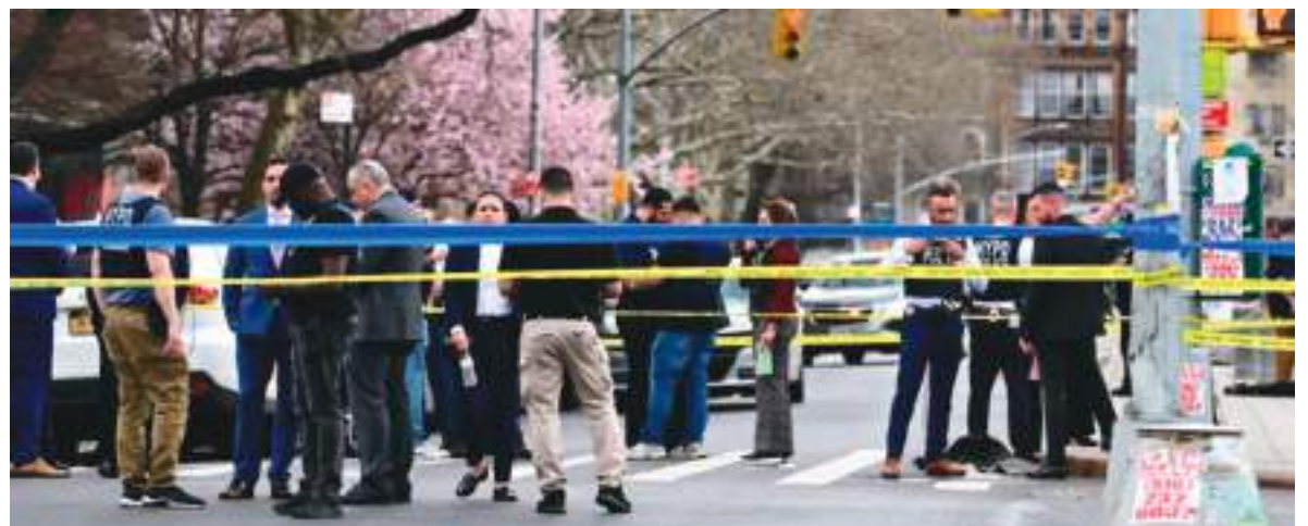
La Unidad de Escenas del Crimen del NYPD recolecta pruebas en la calle Seigel.

Actualmente se lleva a cabo una intensa búsqueda del segundo sospechoso.