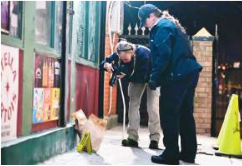
Agentes del NYPD trabajan en la escena.