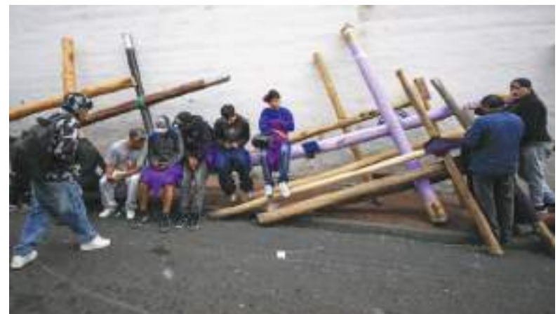
Hay también espacio para el negocio: se venden o alquilan cruces.