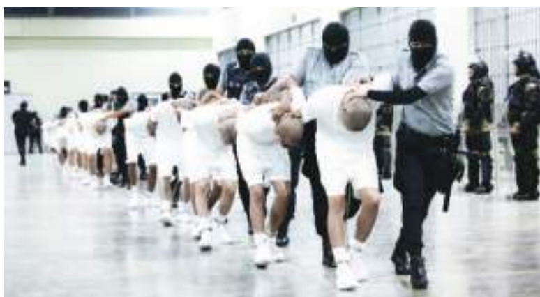
El modelo Bukele es complicado aplicarlo en Ecuador.

Las operaciones de seguridad destinadas a combatir el crimen organizado han generado conflictos tanto internos como intergrupales, a medida que las organizaciones