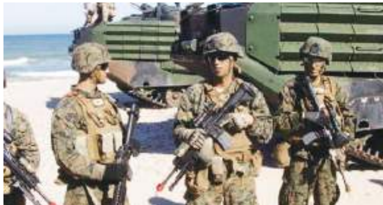
Comando Sur de los EE.UU. lleva a cabo operaciones conjuntas con Ecuador.

Lobos y Los Choneros— como «organizaciones terroristas extranjeras». Días después, funcionarios de ambos países difundieron un video en el que se observaba a las fuerzas ecuatorianas realizando ataques aéreos contra una estructura situada en una zona boscosa, cerca de un río.