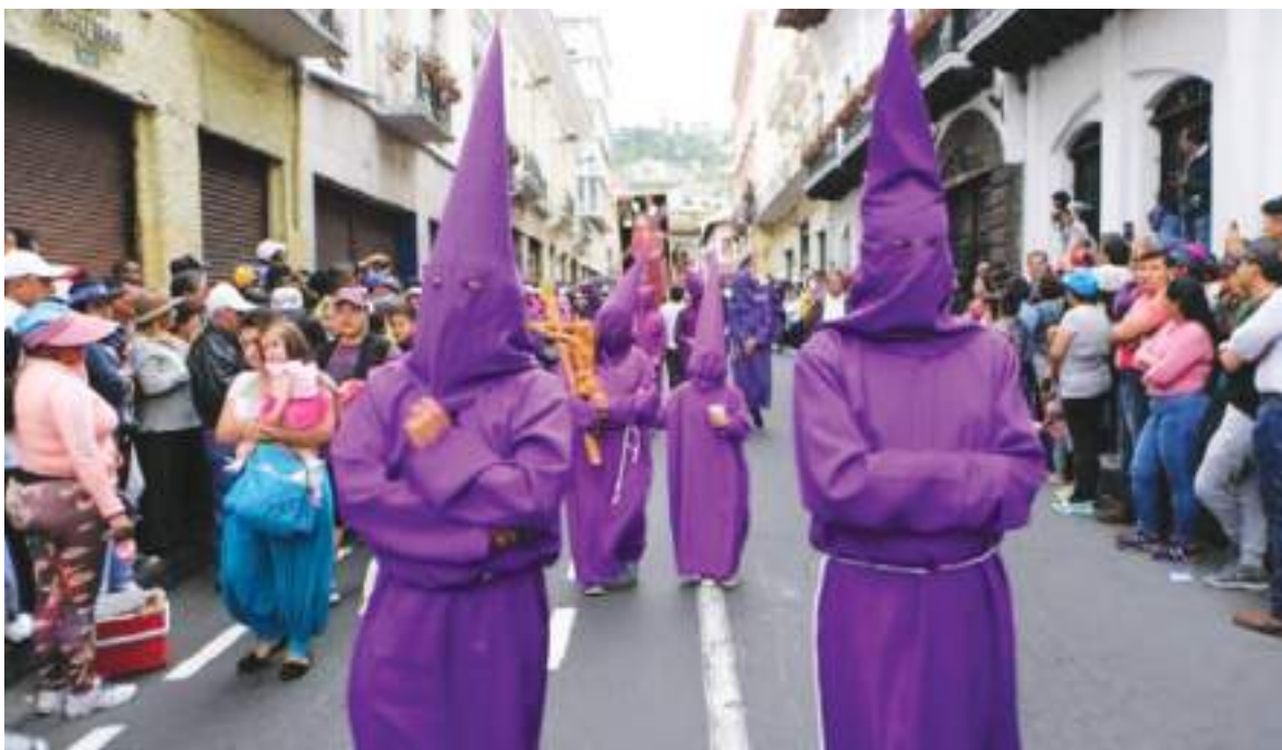
Todos quieren participar, de una manera u otra, lo importante es exteriorizar la fe.

Previo a esa salida ya había iniciado el recorrido con las