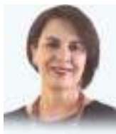
ROSALÍA ARTEAGA SERRANO

Ex Presidenta Constitucional de la República del Ecuador