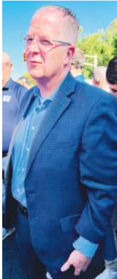
El alcalde de Unión City Brian P. Stack, aspira la reelección por cuatro años más al igual que sus comisionados.

Por su parte el alcalde Brian P. Stack, alcalde de la ciudad manifestó que “servir a la gente de Unión City es el mayor honor de mi vida, junto con nuestros comisionados hemos trabajado incansablemente para impulsar el progreso de nuestra ciudad mediante la construcción de ocho nuevas escuelas, el cierre de decenas de bares y establecimientos de venta de bebidas alcohólicas que afectan negativamente nuestra calidad de vida, el asfaltado de innumerables calles y la instala-