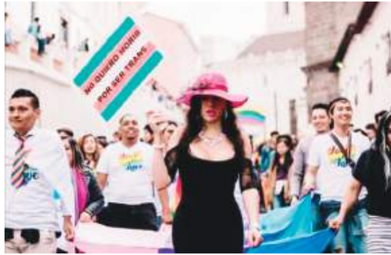
En Ecuador se organizan permanentemente marchas trans.

Silueta X publica un informe anual de asesinatos de personas LGBTQ+ en Ecuador. El primer reporte en 2013 documentó dos asesinatos y los números crecen cada