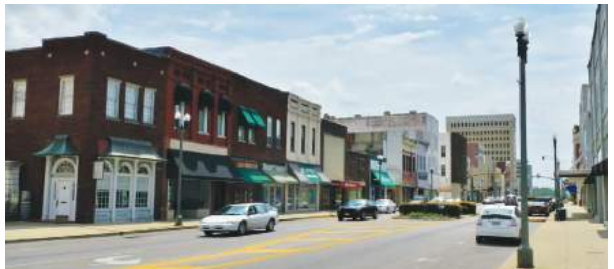
La mujer viajó a Anniston, en Alabama, en junio de 2025 con muchas ilusiones.