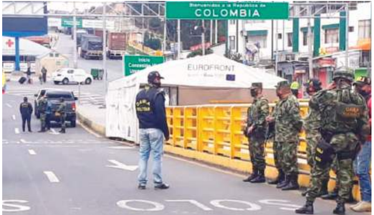
La frontera sigue relativamente vacía y la gente de ambos países acumulando pérdidas económicas fuertes.

El nuevo choque entre Gustavo Petro y Daniel Noboa de nuevo pone en estado de alerta a los ciudadanos de ambos países, cuyo tradicional entendimiento y fraternidad para resquebrajarse. Hemos realizado un resumen de informadores especializados en los últimos días.