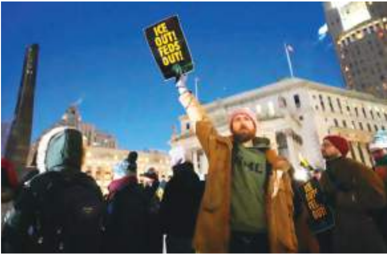
Por casos semejantes se han producido manifestaciones en EE.UU.