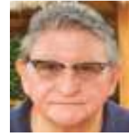
DAVID SAMANIEGO TORRES Especial para Ecuador News

Un Ecuador que avanza al vaivén de las circunstancias, ajustado a cosmovisiones dispares y egoístas, es un pueblo que dejó de ser nación, que también ha dejado de honrar el tricolor nacional. Nuestra patria se ha convertido en un día a día de impredecibles horas, nos movemos al vaivén de algunos medios de información que se sienten a gusto porque tienen material sensacionalista al escoger: en las calles, en las tertulias, en el día a día. La curiosidad nos anima y mima, lo sustantivo y de larga duración ya no es alimento para nuestras mentes.