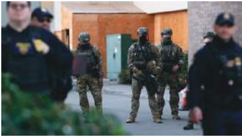
Cuando la anciana salió para París, la vigilancia fue estricta.

incierto que desembocó en su detención por la ICE en Luisiana. Según los medios estadounidenses, su muerte desencadenó además un conflicto sucesorio entre la viuda y los hijos del primer matrimonio de su marido.