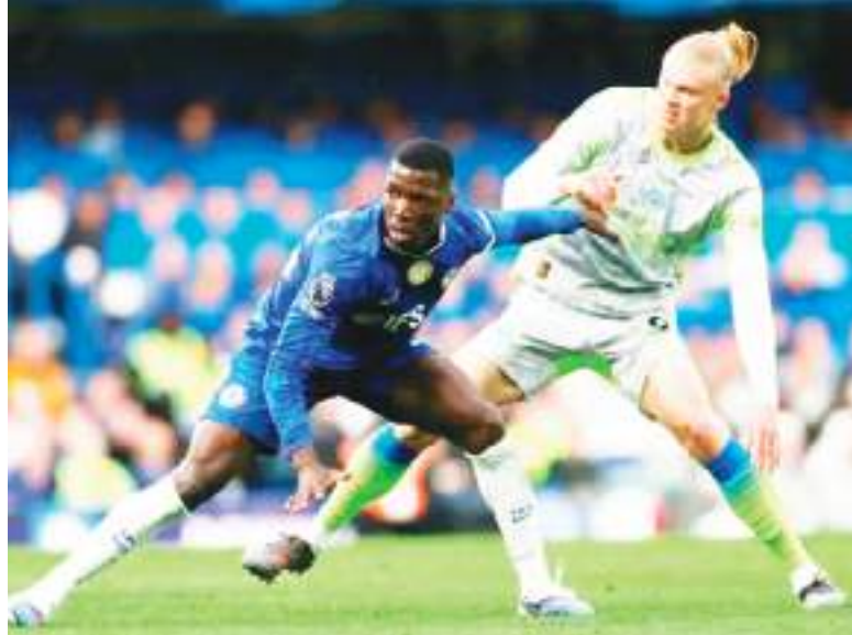
El centrocampista del Chelsea Moisés Caicedo (izquierda) lucha en una acción con el delantero noruego del Manchester City Erling Haaland, en un partido de la Premier League disputado en Stamford Bridge, Londres.

El internacional ecuatoriano le costó al Chelsea 115 millones de libras (156 millones de dólares), un récord entonces para el fútbol inglés, y Caicedo se ha convertido desde entonces en "una figura clave" de los Blues y "uno de los