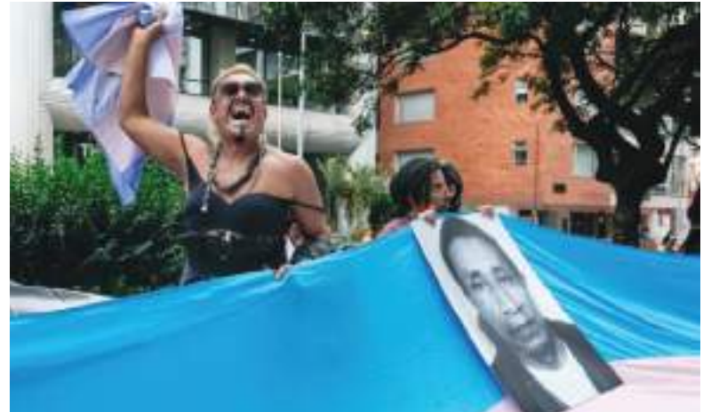
La lucha de las personas transgénero en Ecuador ha sido complicada.

“Los poderes Legislativo y Ejecutivo representan a las grandes mayorías nacionales, pero las personas LGBTI no somos tomadas