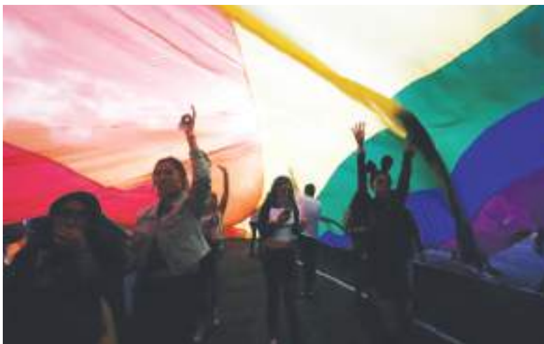
El único recurso que tienen los trans en Ecuador es la protesta en grupo.

Entre los avances más importantes para la comunidad LGBTQ+ ecuatoriana, tres se han logrado a través de las cortes: la despenalización de la homosexualidad en 1997, un fallo que permitió a la primera mujer trans cambiarse el nombre en 2009 y la aprobación del matrimonio igualitario en 2019. Estas decisiones, sin embargo, también han encon-