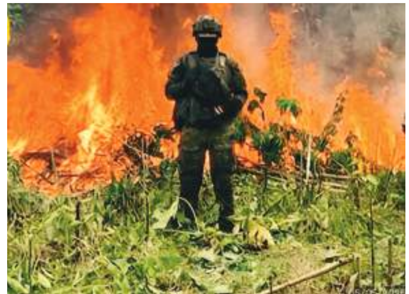
Muchas plantaciones de sustancias prohibidas se han destruido a lo largo del río Putumayo, en la zona de Sucumbíos.

registrado episodios de violencia, atentados y expansión de redes criminales en provincias fronterizas. Las autoridades ecuatorianas sostienen que la falta de control