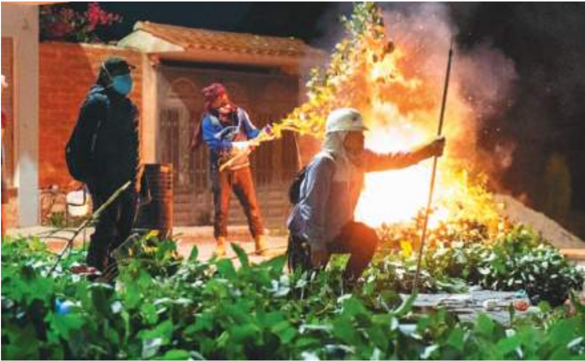
No ha sido fácil para las autoridades ecuatorianas el ingreso a la zona. Hay protestas por muchos motivos que influyen en la inseguridad y que el ejército ecuatoriano intenta aplacar.

de carga, consolidando un intercambio bilateral clave para las economías locales.