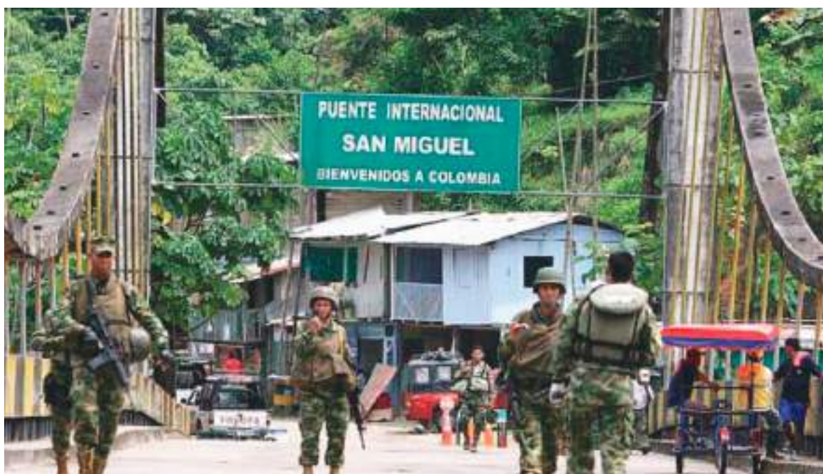
El Puente Internacional San Miguel queda en la frontera entre Ecuador y Colombia, conectando la provincia de Sucumbíos (Ecuador) con el departamento del Putumayo (Colombia) sobre el río San Miguel.

El comercio fronterizo es intenso, aunque no siempre formal. Por el paso de Rumichaca circulan diariamente alimentos, textiles, productos industriales y transporte