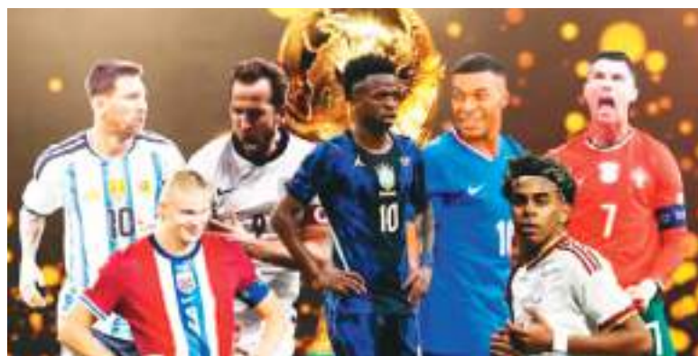
Son numerosas las figuras a seguir durante el Mundial 2026.

No sólo las personas que viven en Estados Unidos son objetivo de las políticas del gobierno estadounidense. En junio de 2025, la Casa Blanca emitió una orden ejecutiva que prohíbe la entrada al país a ciudadanos con pasaportes de 12 países, incluidos Irán y Haití, cuyos equipos nacionales participarán en la cita futbolística. En diciembre, el Departamento de Estado anunció una extensión del veto viajero que incluyó a Senegal y Costa de Marfil, cuyos ciudadanos afrontan restricciones parciales que aplican para visados no residentes. En ambos casos, los atletas están exentos de dichas medidas, pero no así los aficionados al fútbol, que se verán impedidos de asistir al Mundial para apoyar a su selección. Además, personas de 50 nacionalidades deberán pagar una tarifa de entre 5,000 y 15,000 dólares para recibir el visado de entrada a la Unión Americana.