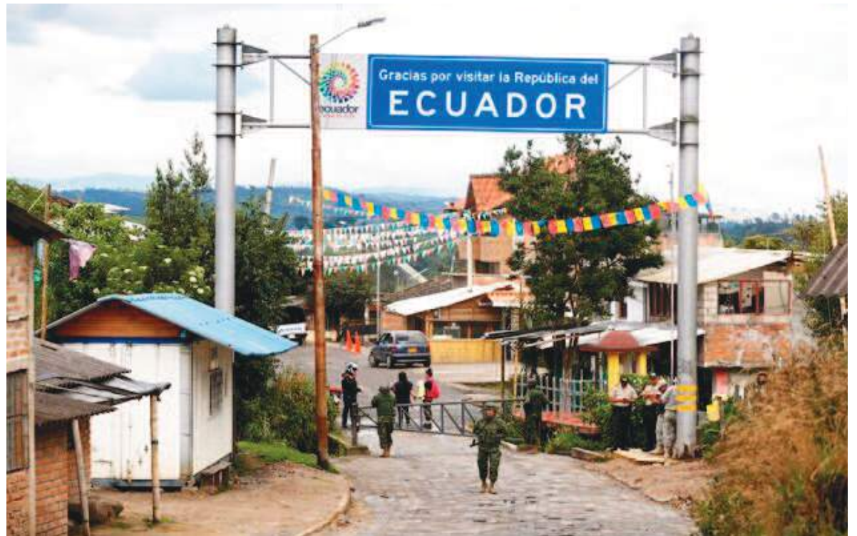
Paso por Tufiño, una parroquia rural perteneciente al cantón Tulcán, en la provincia del Carchi, Ecuador. Se ubica la zona en la frontera norte que es el motivo de las polémicas con su vecino Colombia.

El trazado fronterizo atraviesa tres zonas bien diferenciadas. En