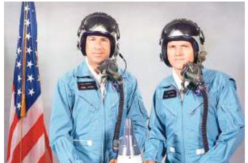
Gemini VII fue una pionera misión espacial tripulada de la NASA, de 14 días de duración, lanzada el 4 de diciembre de 1965 y protagonizada por los astronautas Frank Borman (a la derecha) y James Lovell, quienes en aquel momento establecieron un récord por el vuelo espacial más largo. Ahora se ha conocido un detalle sorprendente.

Los escépticos, sin embargo, señalaron que los astronautas observaban con frecuencia escombros, partículas de hielo y equipos desechados durante las primeras misiones de vuelo espacial, particularmente durante las maniobras orbitales y las separaciones de los propulsores.