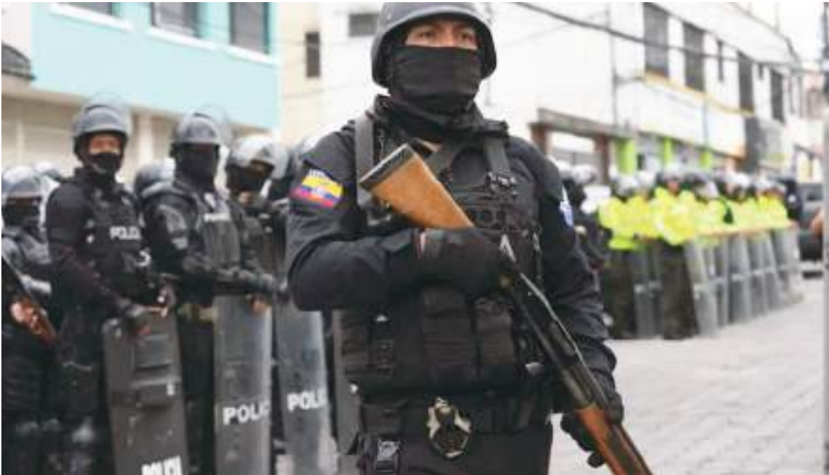
La policía y los soldados se paran fuera de la prisión de El Inca después de que los disturbios comenzaron dentro en Quito, el 8 de enero, 2024. El motín se produjo un día después de que las autoridades ecuatorianas informaron que, en una prisión diferente de la ciudad de Guayaquil, el líder de la banda Los Choneros, Adolfo Macías, alias "Fito", no estaba en su celda.

un radio perimetral de seguridad, en un intento por combatir la planificación de crímenes desde las celdas. Paralelamente, la normativa autoriza el reconocimiento de voz para los contactos autorizados en las llamadas.