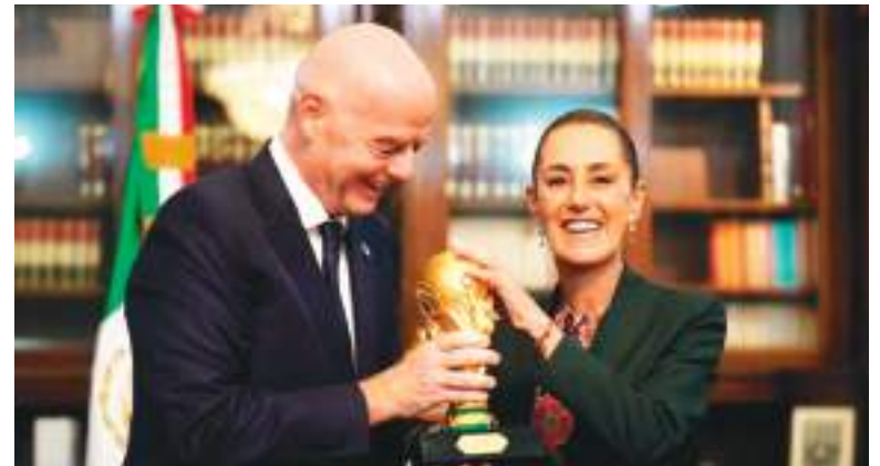
La presidenta Claudia Sheinbaum y el presidente de FIFA Gianni Infantino han sostenido numerosas reuniones y están optimistas.

El asesinato de una turista canadiense en el complejo arqueológico de Teotihuacán a manos de un tirador solitario y el informe de Naciones Unidas sobre las desapa-