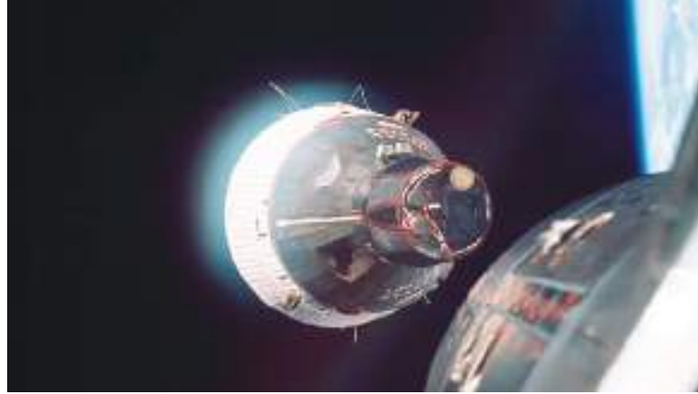
Los astronautas comunicaron al control de la misión que, mientras se encontraban en órbita, vieron lo que parecía ser la trayectoria de otro vehículo. El hecho fue desclasificado la semana anterior.

El astronauta continuó describiendo lo que parecía ser «cientos de pequeñas partículas» que se desplazaban a una distancia aproximada de tres a cuatro millas de la nave espacial, añadió Borman, mientras el control de la misión