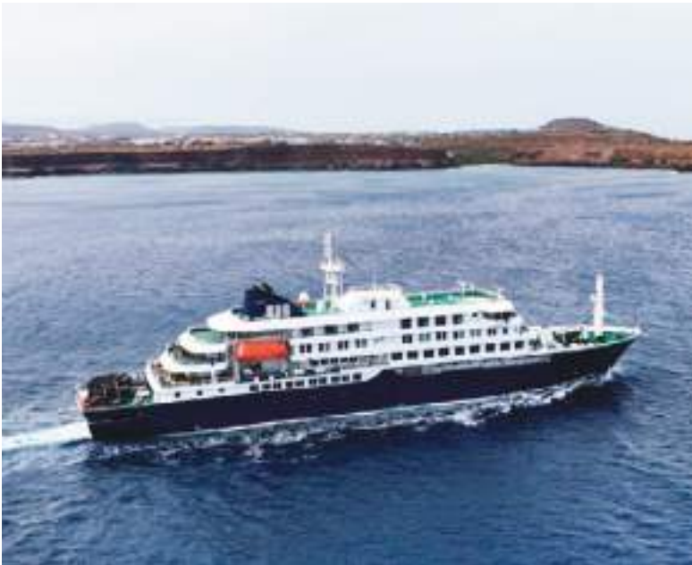
El crucero donde se descubrió el problema que hoy asusta al mundo. Se llama 'MV Hondius', un barco de expedición operado por la compañía Oceanwide Expeditions, zarpó de Ushuaia (Argentina).

jeros de un crucero internacional, que zarpó de Argentina con rumbo a Europa, presentaron síntomas compatibles con enfermedades virales respiratorias durante una travesía turística.