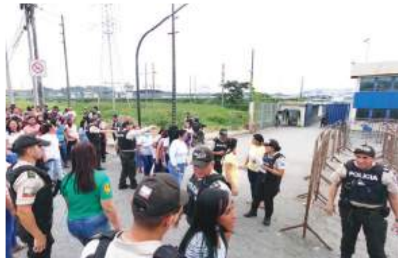
Algunas visitas podrán ser restringidas con el nuevo reglamento.

Con estos nuevos parámetros, el Ejecutivo ecuatoriano busca aliviar la crisis de inseguridad que ha golpeado por años a la nación latinoamericana, con especial incidencia al interior de los penales, desde donde continúan delinquiendo las bandas criminales.