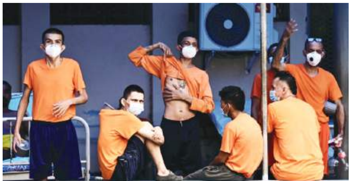
Los reclusos que necesitan atención médica son retenidos en un pabellón de la Penitenciaría del Litoral, en medio de un brote de tuberculosis en la instalación, en Guayaquil, Ecuador, 9 de abril de 2025.

políticos como el exvicepresidente correísta Jorge Glas, condenado por corrupción; y el alcalde de Guayaquil, Aquiles Alvarez, uno de los principales opositores de Noboa y procesado por casos vinculados a la comercialización de combustibles, su negocio familiar.