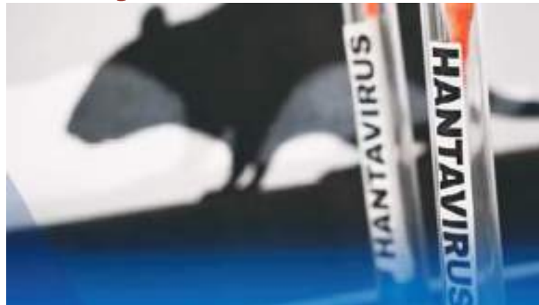
Los ratones son los principales causantes del hantavirus.

Desde entonces, distintas variantes del hantavirus fueron detectadas en Asia, Europa y