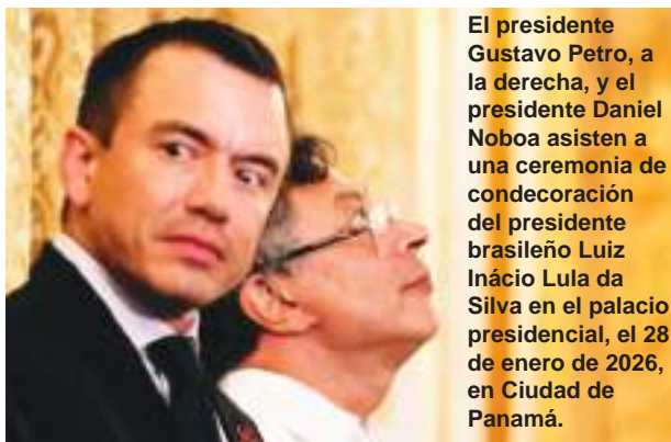
El presidente Gustavo Petro, a la derecha, y el presidente Daniel Noboa asisten a una ceremonia de condecoración del presidente brasileño Luiz Inácio Lula da Silva en el palacio presidencial, el 28 de enero de 2026, en Ciudad de Panamá.

Acerca de la tasa vigente del 75% impuesta por