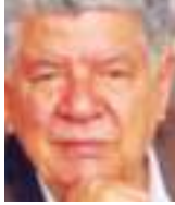
RODOLFO BUENO Especial para Ecuador News

E n la India hay religiones, como el Jainismo, cuyos acólitos son ateos. Fue fundada por Nataputta, o Jina. En ella sus fieles han renunciado a pensar en Dios porque no quieren deformar con el pensamiento, cuya lógica es incompleta y contradictoria, la imperecedera sustancia del Arquitecto Supremo. Eso es no creer en Dios.