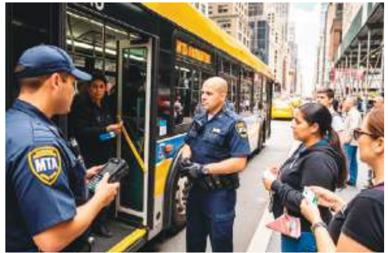
La Metropolitan Transportation Authority de Nueva York pierde 700 millones de dólares al año por evasión tarifaria en sus autobuses.

La adopción del modelo europeo de control y la discusión sobre la tarifa cero marcan una nueva etapa en la gestión del transporte urbano de la ciudad.