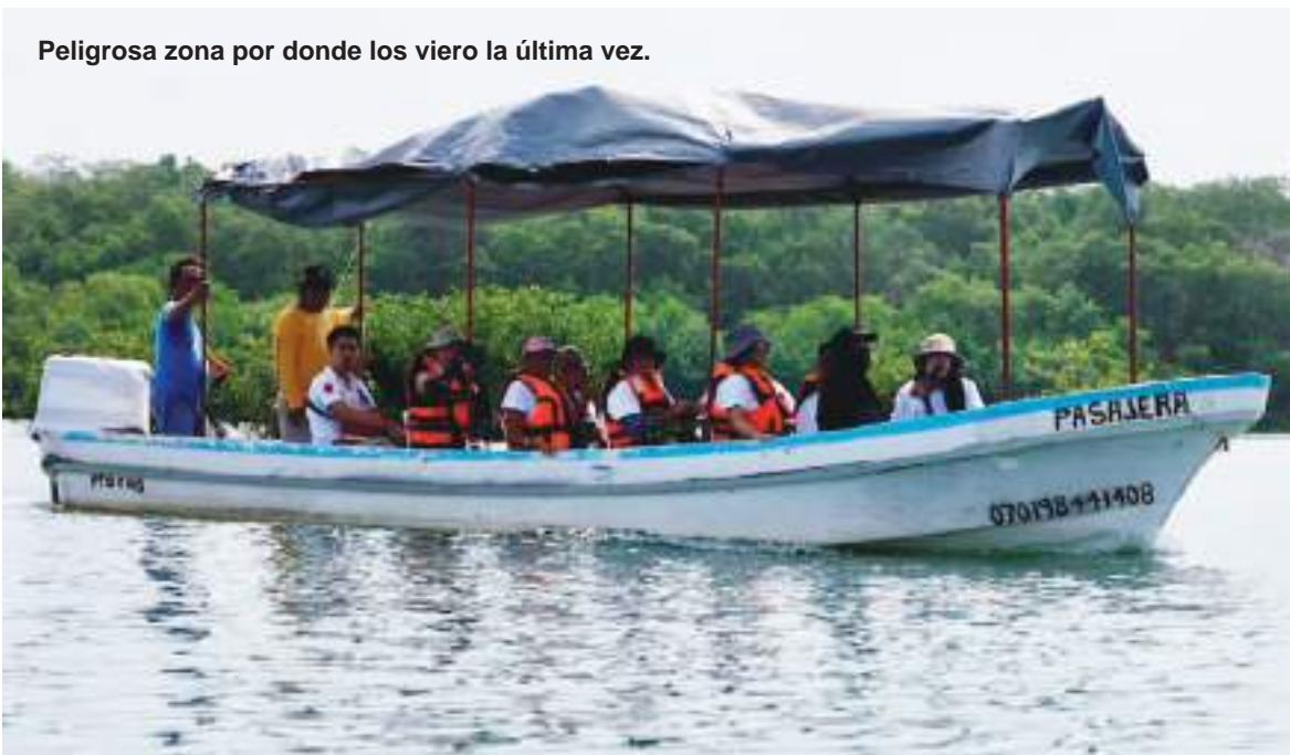
Peligrosa zona por donde los vieron la última vez.

Ese flujo migratorio se desplomó el año pasado cuando Estados Unidos intensificó las deportaciones, enviando a los migrantes a sus países de origen o a terceros países dispuestos a recibirlos.