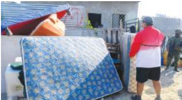
Electrodomésticos, sillas y hasta una mesa de billar que no le pertenece. Una familia ecuatoriana pone en orden su casa en el suroeste del país recién rescatada de los narcos, que imponen una cruel extorsión: pagar para conservar la vivienda.

En 2025, la policía llevó a cabo operaciones casi constantes dirigidas contra las redes de extorsión,