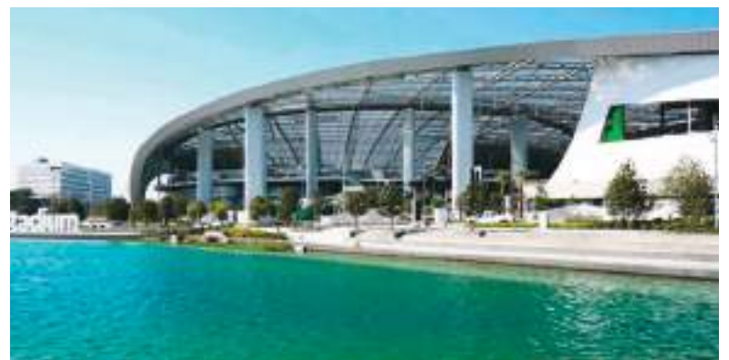
El SoFi Stadium, en Los Ángeles, va a ser sede de ocho partidos durante el Mundial 2026. Allí se aumentarán las medidas preventivas.

medidas como la agilización de visas y el interés global por el fútbol mitiguen las preocupaciones de los visitantes. A pesar de esa confianza, las organizaciones civiles de derechos humanos insistieron en que no existen garantías para los visitantes.