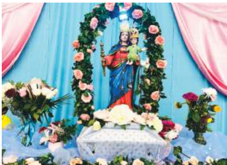
Mayo es declarado el Mes Mariano en gran parte del mundo, por ello el 24 de Mayo es declarado el Día de María Auxiliadora, los Sigseños en New York festejan con mucha fe y religiosidad.

liadora. Los presentes también disfrutaron de deliciosos platos típicos y chicha de jora, etc.