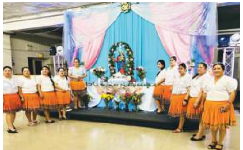
Las "floreras" con sus trajes típicos, formaron la corte de honor y escoltaron a la Virgen María Auxiliadora, su participación fue una muestra de fe, cultura y devoción.