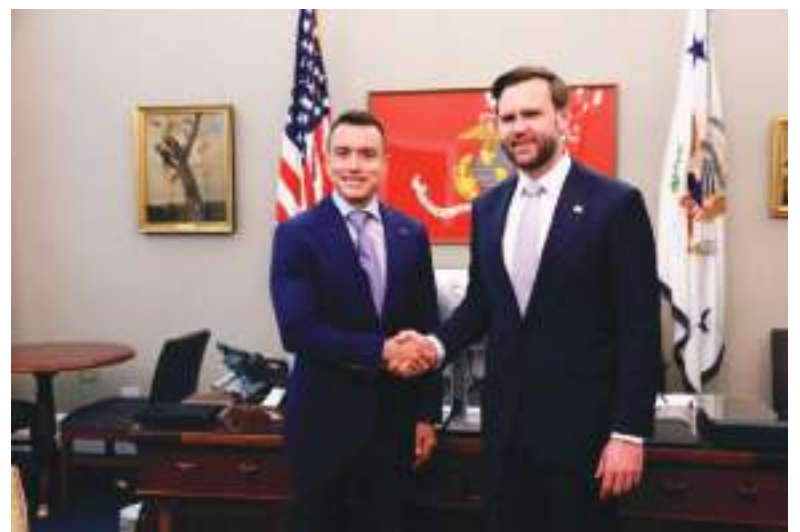
Daniel Noboa se reunió con el Vicepresidente de EE.UU. JD Vance.

El viaje de Daniel Noboa arroja un saldo positivo en términos de consolidación de imagen internacional y posicionamiento político bipartidista en el Congreso de EE.UU. El mandatario logró revalidar el soporte táctico de la Casa Blanca y mantener abiertas las líneas de financiamiento del BID. El verdadero desafío tras este viaje será traducir estos consensos de alto nivel en Washington en desembolsos económicos inmediatos y equipos militares tangibles en el territorio ecuatoriano para contener la persistente crisis de seguridad interna.