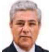
MAURICIO RIOFRÍO CUADRADO Especial para Ecuador News

H ay oficinas públicas donde todavía se escucha el rumor noble del deber, lugares donde un técnico honesto revisa expedientes como quien revisa el pulso de un país enfermo, donde una secretaria amable, con gesto educado, salva la dignidad de una institución con un “buenos días” sincero, donde un funcionario competente entiende que cada trámite tiene detrás una angustia humana, una deuda, una esperanza o una tragedia.