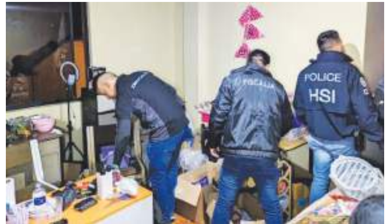
La policía viene realizando un gran trabajo, son muchos los delincuentes extorsionadores que han sido capturados.

La extorsión se ha disparado en los últimos cinco años, aumen-