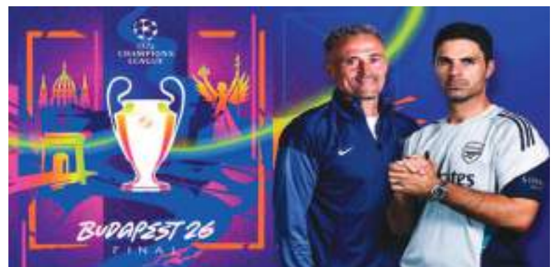
Luis Enrique y Mikel Arteta tienen sus propias claves de triunfo.

Luis Enrique ha convertido al París en uno de los grandes equipos de la era moderna.