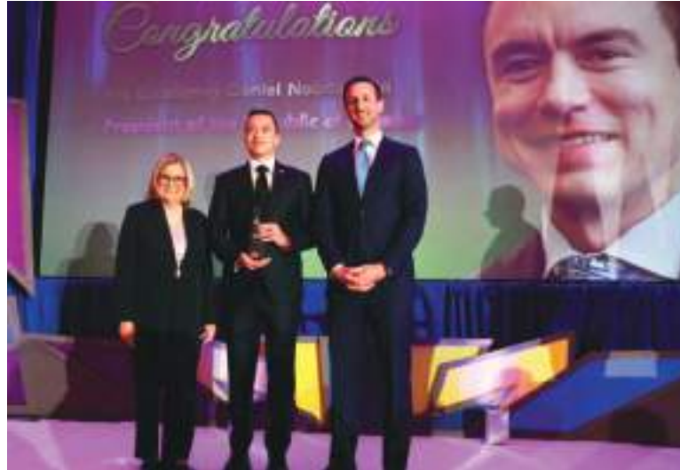
En Washington, el Congressional Hispanic Leadership Institute reconoce al Presidente Daniel Noboa y destacó su visión, sus decisiones firmes y su compromiso con el futuro y el bienestar de su país.

No obstante, la visita coincidió con la publicación de la Estrategia Nacional de Control de Drogas 2026 de la Casa Blanca, la cual omitió menciones directas a Ecuador. Ante esto, Daniel Noboa aprovechó su intervención en el