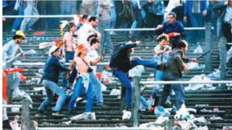
De sobra es conocido el comportamiento de algunos fanáticos. En USA esto se castiga severamente.

Según el informe, las ciudades donde se tienen programados partidos del Mundial 2026, como en el caso de Los Ángeles, registraron un aumento en el número