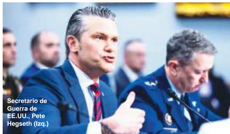
Secretario de Guerra de EE.UU., Pete Hegseth (Izq.)

"Estamos profundamente preocupados por los informes sobre graves violaciones de los derechos humanos y el bombardeo de lo que parecen haber sido instalaciones civiles durante las operaciones militares conjuntas entre Estados Unidos y Ecuador, llevadas a cabo en el norte de Ecuador a principios de marzo", arranca la misiva, que se ha enviado coincidiendo con la visita a EE.UU. del presidente ecuatoriano,