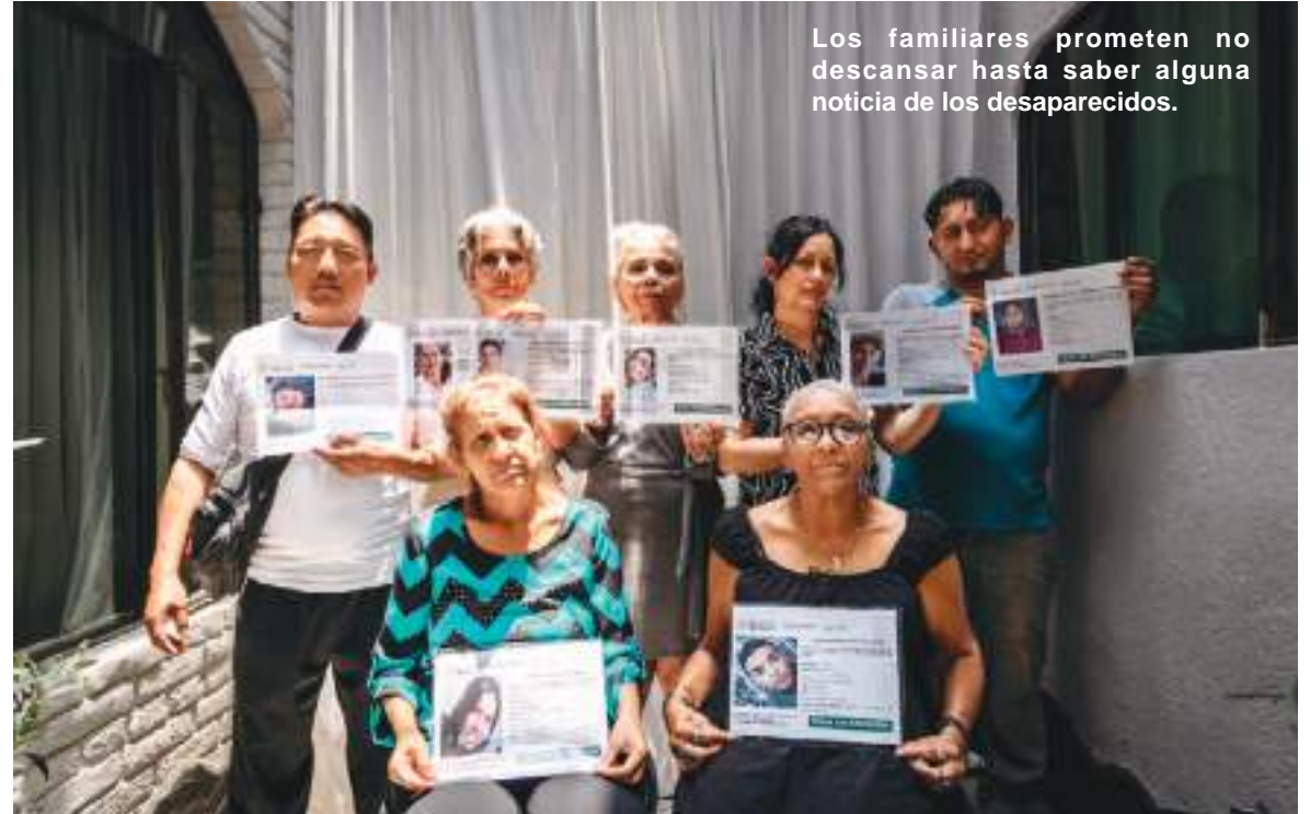
Los familiares prometen no descansar hasta saber alguna noticia de los desaparecidos.