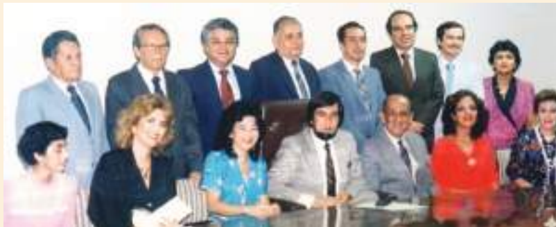
DIRECTORIO DEL COLEGIO DE PERIODISTAS DEL GUAYAS -1987-

Es importante puntualizar estos logros, porque: “La verdad, pone todo en su lugar”.