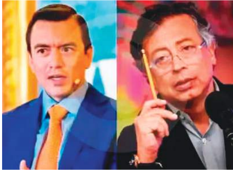
Los presidentes de Ecuador y Colombia, Daniel Noboa y Gustavo Petro, respectivamente, por ahora no han obedecido el mandato de la CAN, un ente regional que gestiona el entendimiento de todos.

Según la CAN, las restricciones y aranceles implementados en la frontera afectan el intercambio de bienes en la subregión y van en contra del Programa de Liberación Comercial, mecanismo