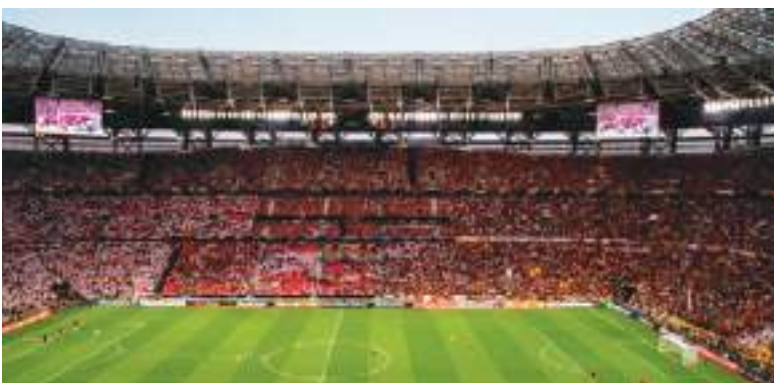
Puskas Arena, aquí se jugará la final de Champions.

Tal vez esa sea la verdadera victoria ecuatoriana. Haber dejado atrás el complejo de inferioridad futbolística. La final tendrá un campeón y un derrotado. Así funciona el deporte. Pero Ecuador, pase lo que pase, ya ganó algo mucho más importante: demostrar que sus futbolistas pueden competir de igual a igual en el escenario más grande del mundo.