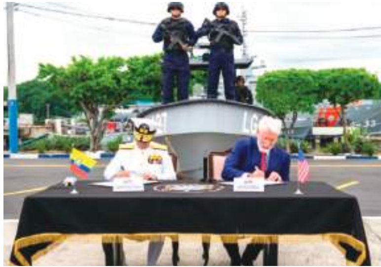
Acto de entrega de las tres primeras lanchas.

Las Type 380 , son lanchas tácticas de interdicción de cerca de 38 pies de eslora, construidas en fibra de vidrio reforzada y concebidas para operaciones de reacción rápida en entornos marítimos y fluviales. Según el fabricante, estas plataformas pueden superar velocidades de 45 nudos, ofreciendo alta maniobrabilidad y capacidad de persecución contra embarcaciones de bajo perfil.