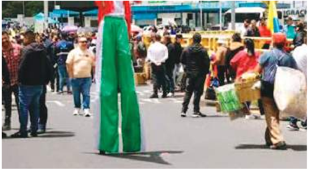
Los afectados realmente con la tensión comercial, son los residentes en la frontera de Ecuador y Colombia.

El problema es que la disputa actual tiene un fuerte componente político. Las diferencias ideológicas entre Noboa y Petro, sumadas a los recientes roces diplomáticos en materia de seguridad y relaciones regionales, han contaminado la relación comercial. En este contexto, desmontar los aranceles puede interpretarse internamente como una concesión política, algo incómodo para ambos gobiernos.