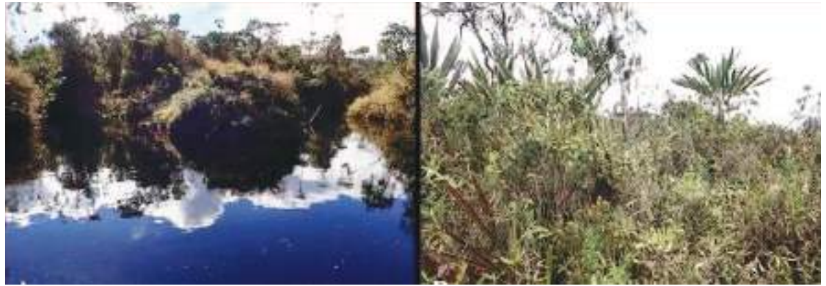
La Reserva Natural El Quimi, donde se descubrió la nueva especie de rana de cristal.

El primer ejemplar de la rana de cristal de Dajomes fue avistado a tan solo unas pocas millas de una operación minera a gran escala, en una región de carácter agrícola. La actividad minera en la zona ha provocado un declive general en la población local de anfibios; no obstante, se desconoce de qué manera se ve afectada la rana de cristal de Dajomes. Para los investigadores, aún no está