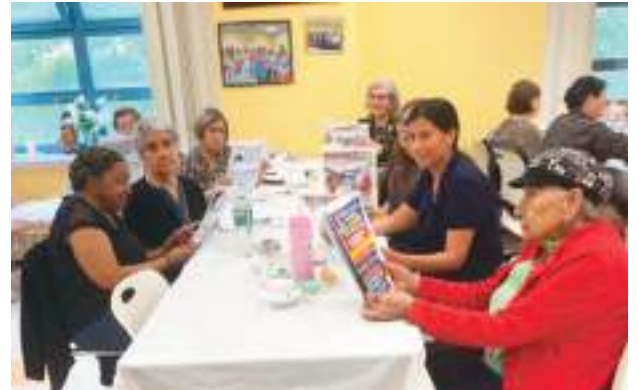
Disfrutando del homenaje efectuado por el Día de la Madre y leyendo nuestro semanario, integrantes del Centro Diana H. Jones posan para Ecuador News.