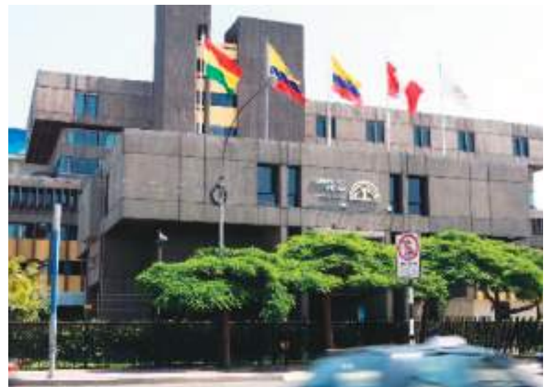
Sede de la Comunidad Andina (CAN), en Lima, Perú.