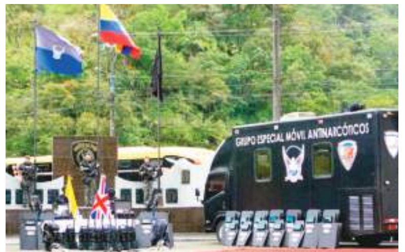
Material donado por el Reino Unido a Ecuador.

El material donado está compuesto por 50 cámaras corporales ( body cam ) destinadas a mejorar el registro y control operativo en procedimientos de alto riesgo, dos detectores portátiles de trazas para identificación de sustancias ilícitas y explosivos, diez equipos de brecheo (ingreso a sitios bloqueados) táctico empleados en operaciones de ingreso e intervención, un videoscopio articulado para inspecciones en espacios confinados, equipos de buceo táctico especializados para operaciones subacuáticas,