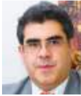
CÉSAR MONTAÑO GALARZA Especial para Ecuador News

La peor tragedia del Ecuador no es solamente la violencia. Es habernos acostumbrado a ella. Hace apenas una década, escuchar sobre sicarios, vacunas o coches bomba era algo ajeno, propio de otros países que se desenvolvían en graves conflictos internos. Hoy esos episodios son pan del día, puesto que ya no sorprende enterarse de niños y jóvenes desaparecidos, ver guardias armados en todo tipo de espacio público y privado, padres con miedo de dejar salir a sus hijos, universidades y otras instituciones convertidas en bunkers o negocios quebrando y cerrando por extorsión. El miedo, algo otrora excepcional, se volvió rutina.