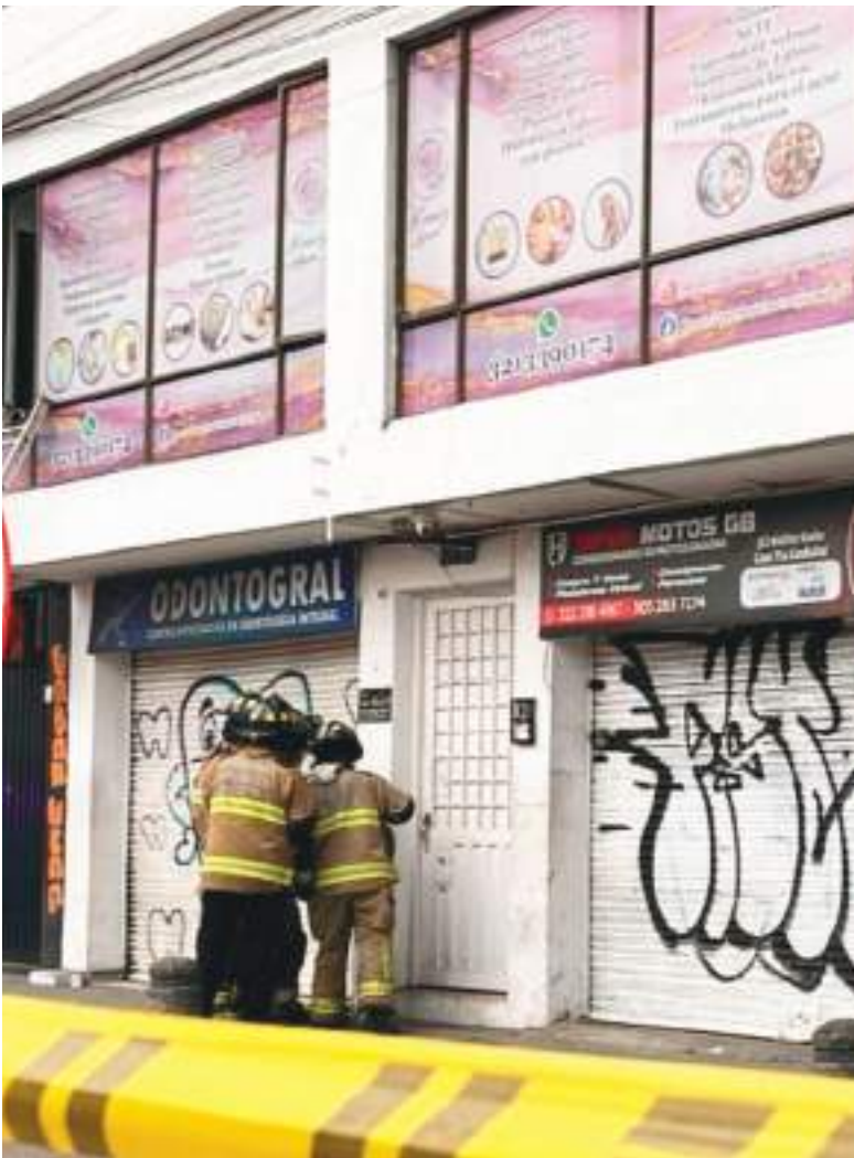
Momento en que los bomberos fuerzan la entrada de la clínica de garaje que funcionaba en una zona de clase media y concurrida.

funcionando con publicidad abierta en redes sociales, promociones agresivas y hasta recomendaciones de influencers. Eso no ocurre por casualidad. Ocurre porque los sistemas de control sanitario suelen actuar tarde, mal o simplemente no actúan.