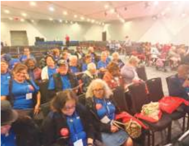
Gran número de seniors, se dieron cita en Albany para solicitar más beneficios que les ayuden a tener una mejor calidad de vida.