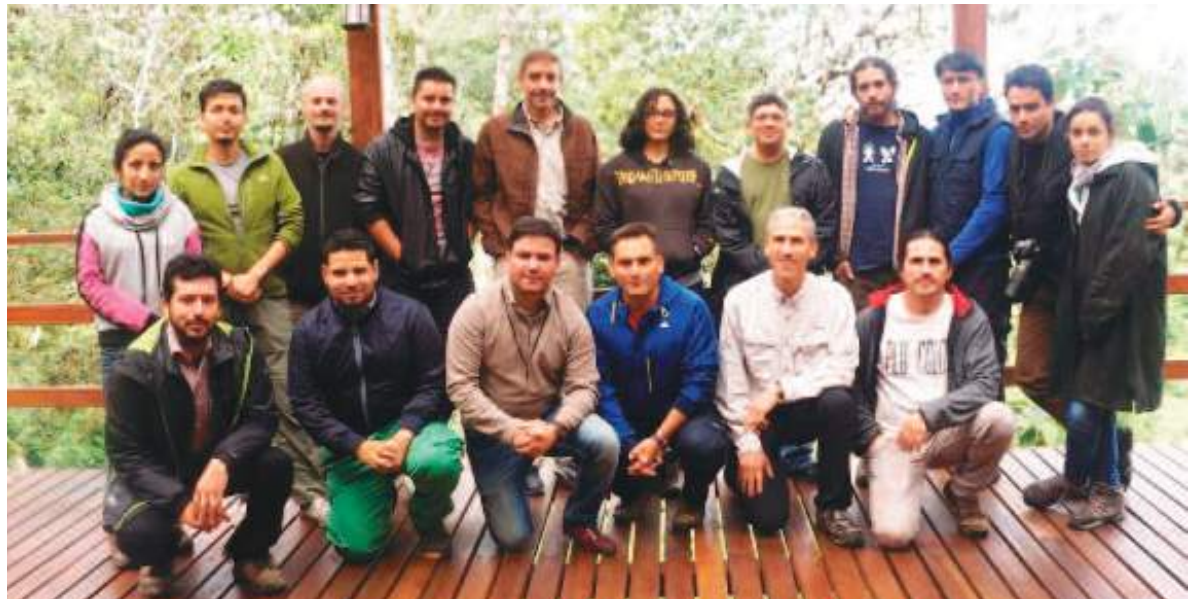
Equipo de investigadores ecuatorianos que laboran arduamente y consiguen muchos resultados.

claro si esta rana debería ser clasificada como especie amenazada o en peligro de extinción.