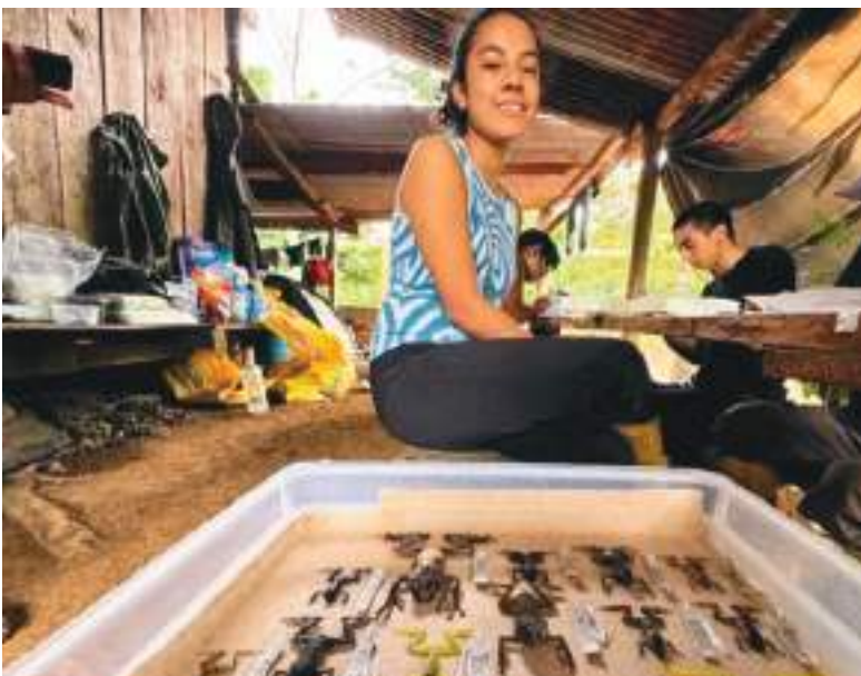
Investigadores estudiantes clasifican una variedad de anfibios recolectados durante los estudios de biodiversidad.