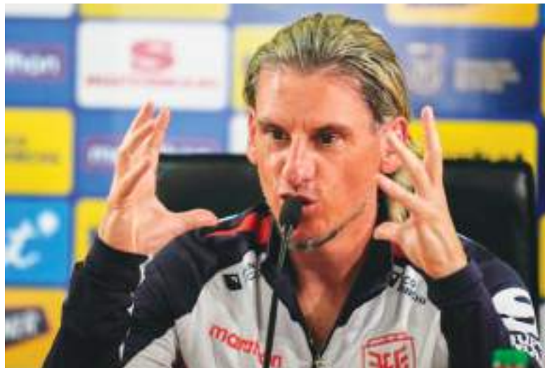
Sebastián Beccacece durante una rueda de prensa.

dores, para los dos últimos amistosos en Estados Unidos —contra Arabia Saudita el 30 de mayo y ante Guatemala el 7 de junio— Beccacece pondrá en cancha a juveniles que han sido parte del proceso de 22 meses en que ha estado frente al equipo.