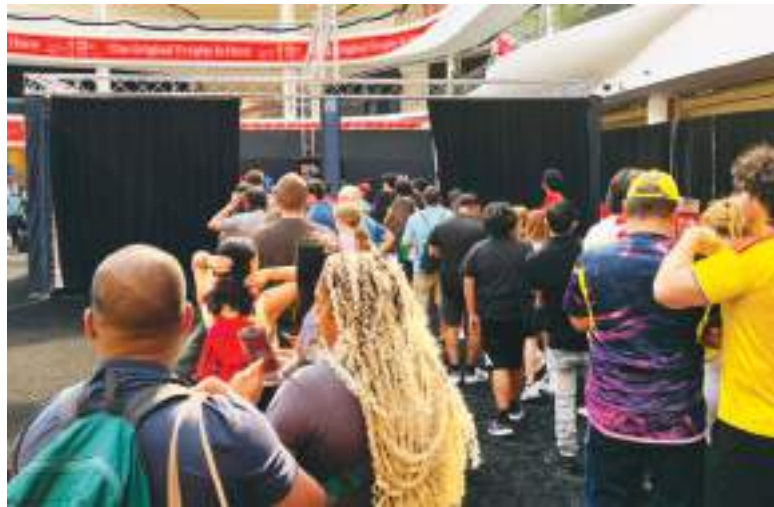
Largas filas de aficionados al futbol de todo el mundo para mirar la original Copa del Mundo.

La Copa del Mundial, que tiene un peso de 6,175 kilogramos y una altura de 36.8 centímetros, continuará con su itinerario de exhibición por los países sedes del mundial como: Canadá, México