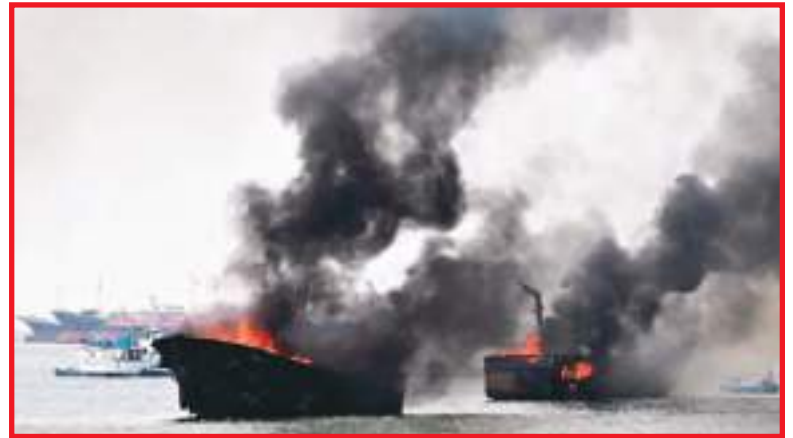
Gigantescas lenguas de fuego y densas columnas de humo se elevaron sobre las embarcaciones afectadas.

Durante la emergencia también se registraron varias explosiones presuntamente asociadas a tanques de combustible o cilindros de gas, lo que elevó el riesgo para los equipos de medidas de rescate y