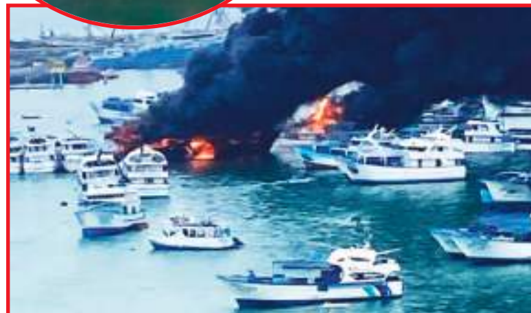
Se siguen evaluando no sólo las causas, sino las consecuencias del pavoroso incendio que alarmó a Manta y Ecuador.