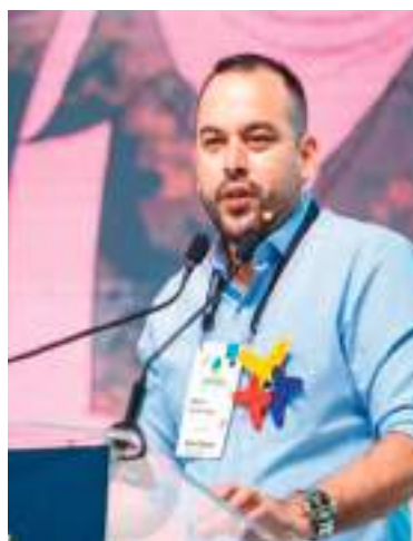
Ministro de Energía de Colombia, Edwin Palma.

favorable para el diálogo bilateral y tras el levantamiento de las restricciones comerciales ecuatorianas, el Ejecutivo colombiano considera viable retomar gradualmente la cooperación energética.