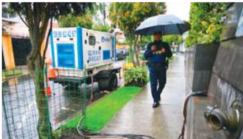
Ecuador solventa problemas energéticos con generadores móviles.

La decisión marca un nuevo capítulo en la relación energética entre Colombia y Ecuador, luego de varios meses de tensiones