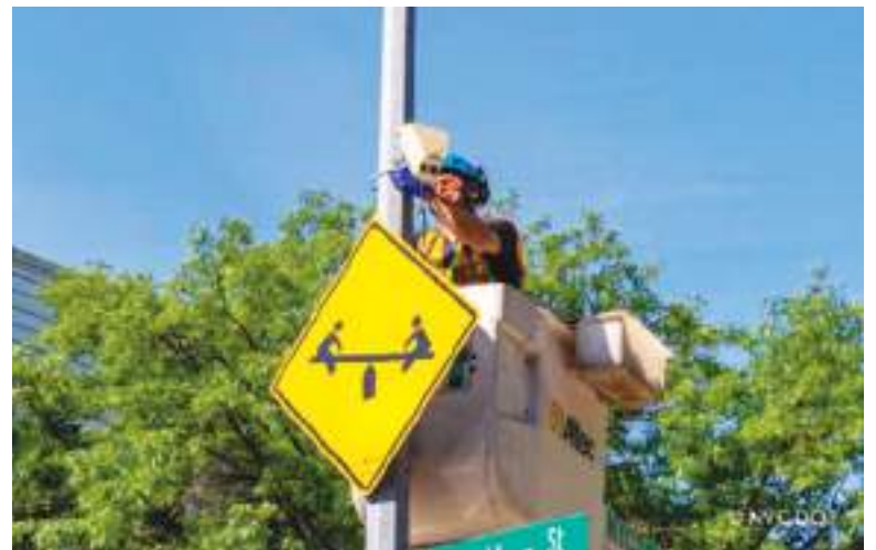
Un operario del Departamento de Transporte de la Ciudad de Nueva York (NYC DOT) instala un nuevo sensor de actividad en Greenpoint, Brooklyn.

Instalados en la infraestructura vial del Departamento de Transporte de la Ciudad de Nueva York (NYC DOT), los sensores analizan de forma anónima la actividad en