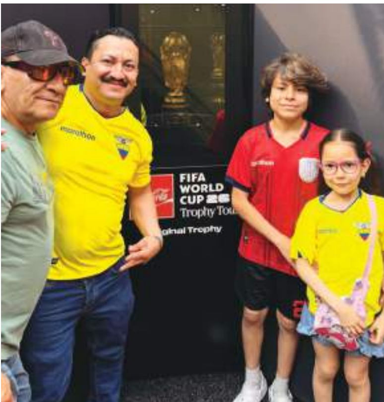
La familia Vega, identificados con los colores de nuestra selección ecuatoriana y haciendo realidad un sueño, mirar la original Copa de la FIFA 2026.

Fue custodiada. El evento es denominado Trophy Tour , al mismo que acudieron cientos de aficionados al fútbol quienes se identificaban con camisetas de las selecciones que participan en el mundial de fútbol. Sin embargo,