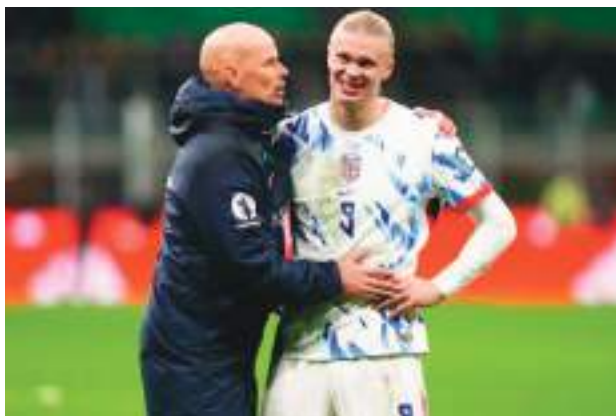
Erling Haaland, ariete de Noruega y gran figura.

El mediocampista del Chelsea, Moisés Caicedo, el defensa del Arsenal, Piero