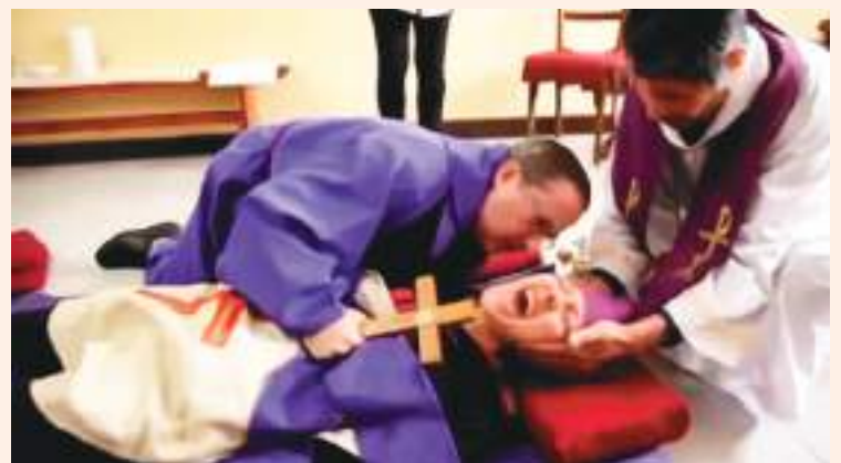
Recreación de un exorcismo.