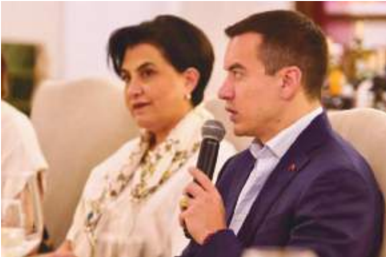
Acompañó siempre al presidente Daniel Noboa.