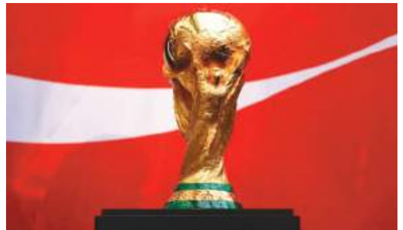
La Copa de la FIFA que será entregada al Campeón del Mundo el 19 de Julio en el Met Life Stadium se exhibió durante dos días en New Jersey, tiene un peso aproximado de 12 libras y bañado en oro puro de 18 kilates .