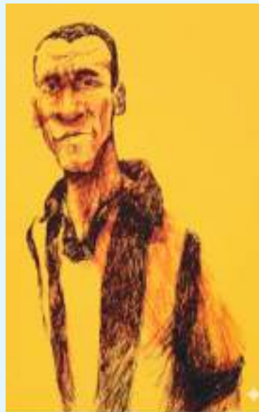
ALBERTO SPENCER NUESTRO ÍDOLO

Estimados lectores de Ecuador News, para mí es como un sacri-