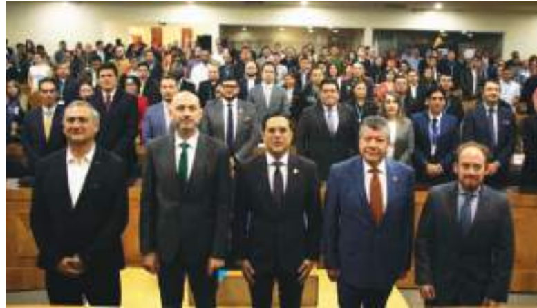
Asistentes a este importante evento de ciberseguridad.