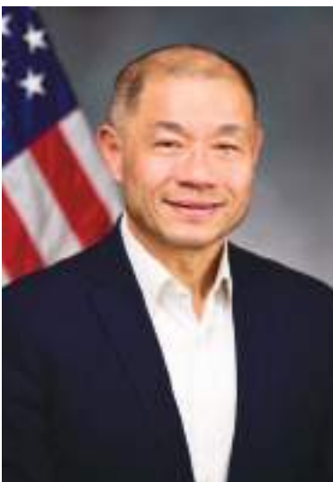
Senador estatal John Liu.

Los dominicanos habían ostentado el puesto de mayor grupo de origen extranjero en la ciudad de Nueva York desde 1990. La población china de la ciudad incluye a neoyorquinos que se trasladaron allí desde China continental, Taiwán y Hong Kong, según el informe.