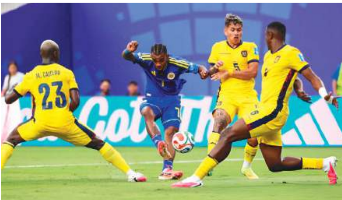
Ecuador defiende bien, pero en el Mundial algunos jugadores parecen incómodos y les generan ocasiones.