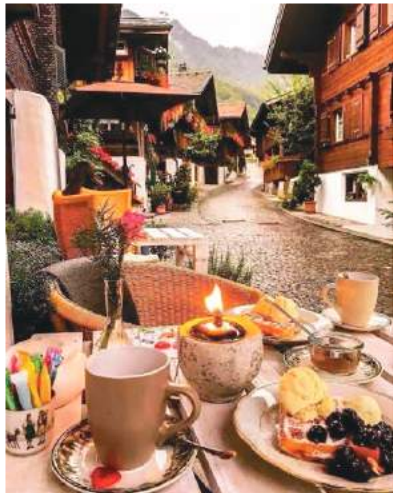
El concepto de beber café en la calle es de los suizos.

La mirada a la industria cafetera suiza y a la historia del café en el país revela también las complejas interdependencias globales de este negocio, cuyos efectos siguen presentes hasta hoy y continúan alimentando las críticas. El último capítulo de la saga del café suizo, por tanto, está aún lejos de escribirse.