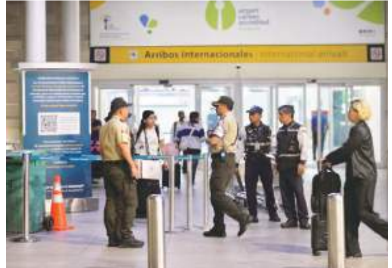
En pleno aeropuerto de Guayaquil se produjo un lamentable hecho que motivó la "guerra total" a la inseguridad.

En ese marco, el jueves 18 de junio, el mandatario declaró la "guerra total" contra esos grupos,