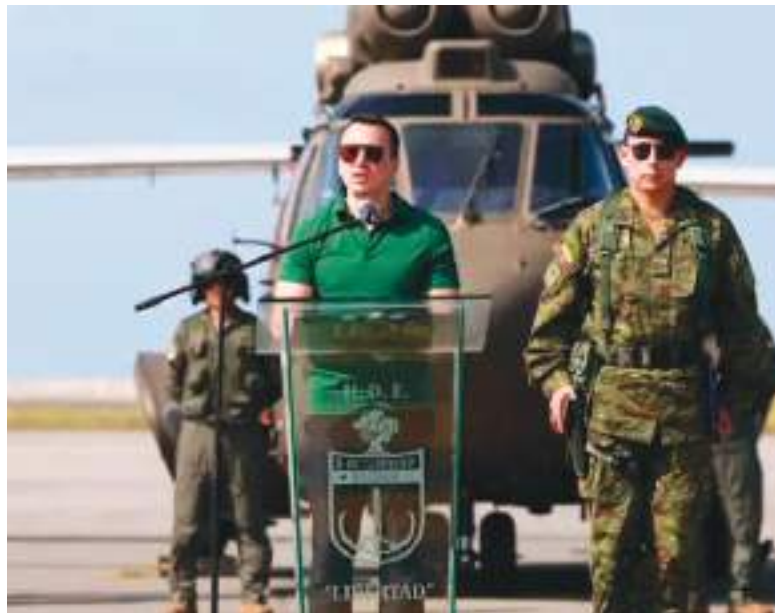
El presidente Daniel Noboa hizo el trascendental anuncio.

En ninguno de estos casos, aclara el medio 'Primicias', se