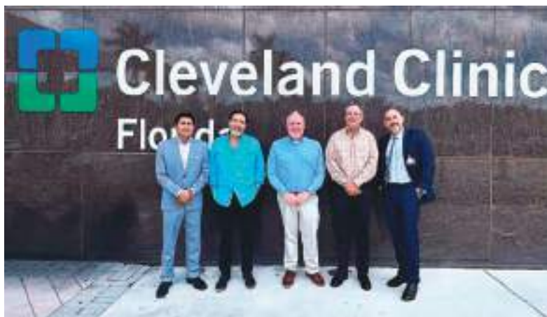
Posan para la cámara de Ecuador News funcionarios de Cleveland Clínica de Florida.

En un escenario donde las enfermedades cardiovasculares continúan aumentando en personas jóvenes y económicamente activas, expertos consideran fundamental que las empresas incorporen una visión más integral del bienestar laboral, impulsando políticas preventivas y profesionales capacitados que permitan anticiparse a riesgos que afectan directamente la salud y productividad de los trabajadores.