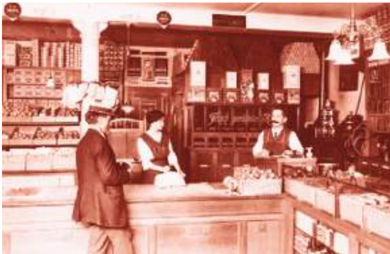
Suiza ha sido líder en lo que signifique preparación de buen café.

fue propietaria de una plantación cafetera en Cuba «donde esclavos vigilados por perros trabajaban 14 horas al día», según recoge la Revista Suiza Enlace. Alfred Escher está considerado como uno de los arquitectos de la Suiza moderna.