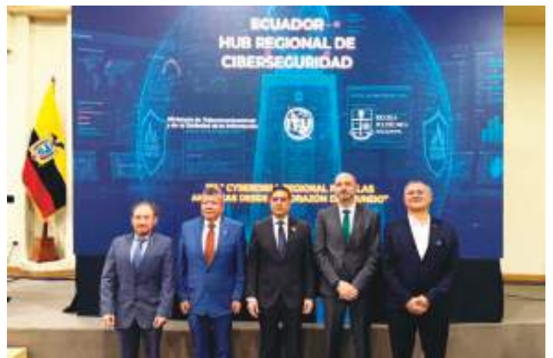
La mesa directiva.

El Cyberdrill es un ejercicio regional técnico y estratégico que simula ciberataques e incidentes de seguridad informática en ambientes controlados, permitiendo evaluar la capacidad de detección, respuesta, recuperación y continuidad operativa de las organizaciones participantes. Asimismo, fortalece la colaboración regional y el intercambio de conocimientos entre los equipos especializados.