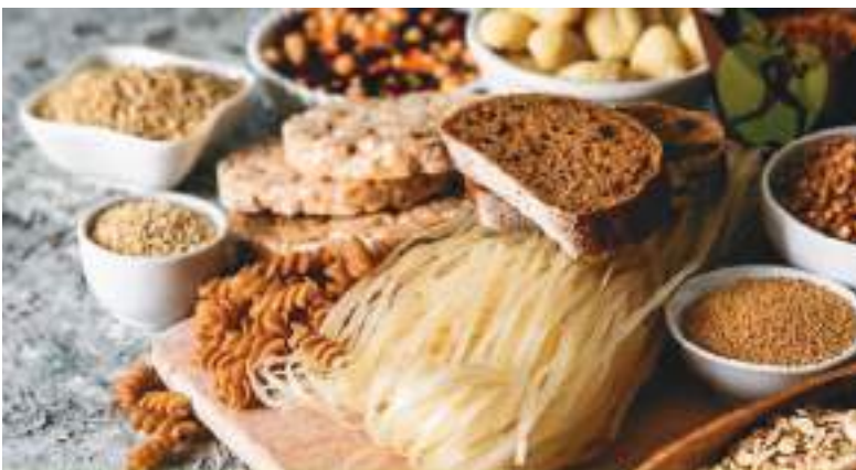
La mayoría de supermercados anuncian varios de sus productos como “libres de gluten”, para evitar problemas en la gente.

Como subrayan los especialistas “el desafío es continuar dando a conocer entre los profesionales de la salud las características clínicas que permitan sospechar la enfermedad y clarificar las mejores herramientas de diagnóstico”. Solo así se podrá garantizar que los millones de personas que hoy viven con celiarquía sin saberlo reciban el tratamiento oportuno y eviten las complicaciones a largo plazo que puede acarrear esta enfermedad silenciosa.