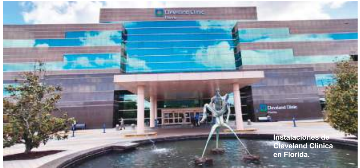
Instalaciones de Cleveland Clínica en Florida.

En este contexto, UEES-CLINIC, centro médico vinculado a la Universidad Espíritu Santo (UEES), impulsa espacios de colaboración médica internacional y actualización científica junto a Cleveland Clínica, institución reconocida mundialmente por su liderazgo en cardiología, cirugía