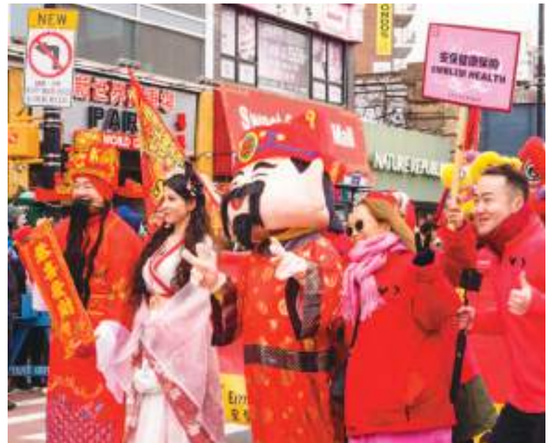
Las actividades organizadas por los chinos en NY siempre están llenas de colorido y alegría.

• Al mismo tiempo, el informe señala que han surgido nuevos núcleos de inmigrantes en East New York (Brooklyn); Springfield Gardens y St. Albans (Queens); Grasmere y New Springville (Staten Island); y Westchester Square y Bedford Park (El Bronx).