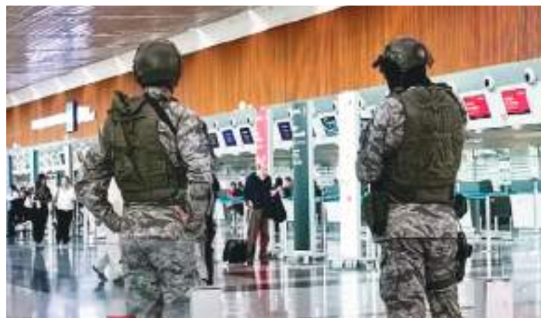
Fuerzas militares tienen mayor presencia en las terminales de transporte.

de una investigación coordinada con el Ministerio del Interior y la agencia estadounidense Homeland Security Investigations (HSI), especializada en delitos transnacionales vinculados al tráfico de personas, migración irregular y crimen organizado.