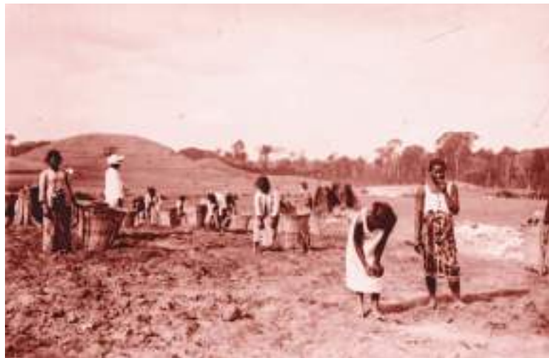
En la historia cafetera de Suiza, hay aspectos sombríos.

Además, el país es un importante exportador de café instantáneo y de otras especialidades altamente procesadas, posicionadas globalmente en los segmentos prémium .