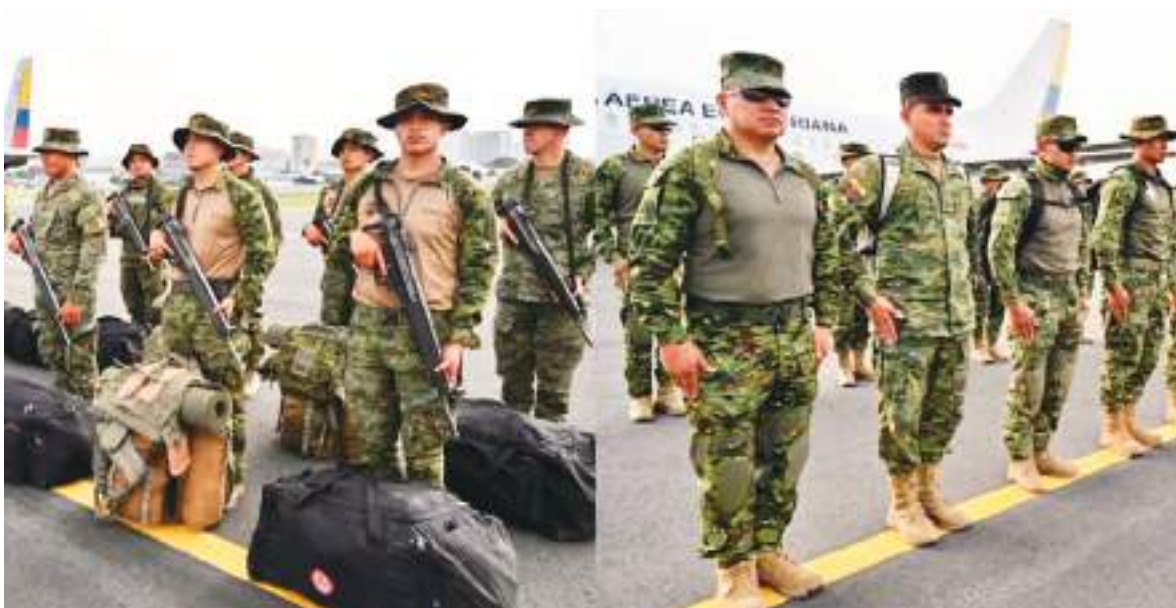
Soldados ecuatorianos montan guardia en la Base Aérea Simón Bolívar antes de ser desplegados en la provincia de Guayas para reforzar las operaciones de seguridad contra grupos criminales.

La medida, añadió el mandatario, es "fruto de meses de trabajo, especialmente con la última reunión en el Pentágono", ocurrida el pasado 15 de junio, junto al