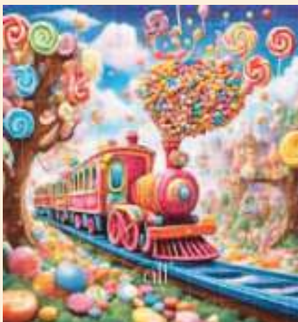
EL HISTÓRICO TREN. RECUERDOS DE MI NATAL MILAGRO