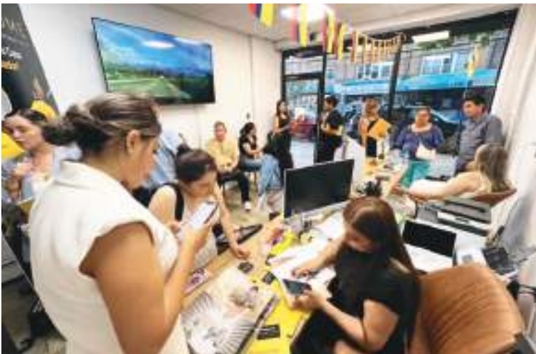
La comunidad se hizo presente en esta noche de inauguración.

Me gusta mucho venir acá, cada vez que he tenido la oportunidad de hacerlo se siente el afecto y el cariño de nuestra gente, que a pesar de las distancias y vivir en otro país no se pierde esa esencia, y me