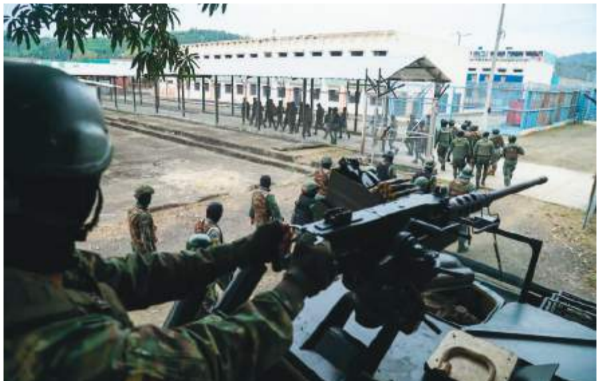
Algunas dudas se han exteriorizado respecto a la medida con respecto a militares extranjeros.

Por último, la propia efectividad de las medidas, del uso de la fuerza y del lenguaje bélico es cuestionada cuando Ecuador mantiene una tasa de más de 50 homicidios por cada 100.000 habitantes, una de las más altas de América Latina.