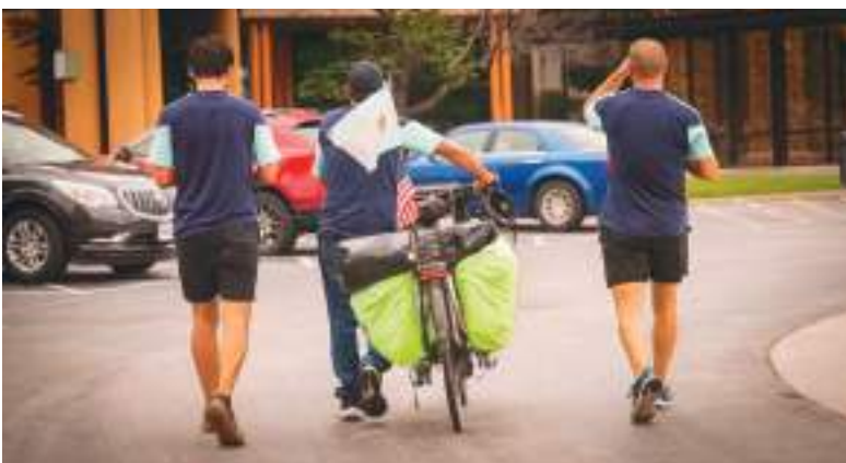
Rumbo a la concentración de sus paisanos.

El mano a mano con el cuerpo técnico de la Selección argentina y las remeras del equipo no fueron los únicos regalos que recibieron los argentinos, que no quieren ser llamados "ciclistas", sino que se definen a sí mismos como "cicloviajeros". Desde el condado de Johnson les regalaron las entradas para el debut ante Argelia, en tanto que la AFA los invitó a los siguientes partidos de la fase de grupos ante Austria y Jordania en Dallas. "Ahí estaremos alentando", contaron con alegría.