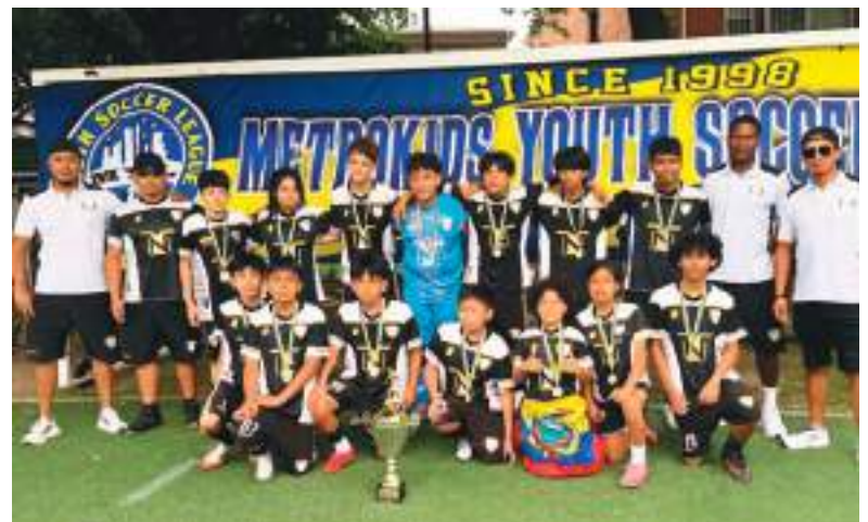
Top Notch Soccer Academia, campeón de la Liga MetroKids

Notice is hereby given that a License number, NA-0340-25-129072 has been applied for by the undersigned to sell Liquor, Wine, Beer and Cider at retail in a restaurant under the Alcoholic Beverage Control Law: TIERRA LINDA LLC 1079 MANHATTAN AVE BROOKLYN NY 11222 For On-premises consumption