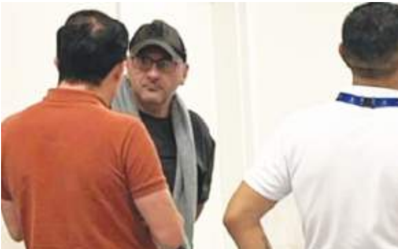
Momento que el sindicado es enviado de Ecuador a Bogotá.

Este caso guarda semejanzas con el feminicidio de Valentina Trespacios, una DJ colombiana asesinada en 2023 por John Poulos, un estadounidense que, luego de matarla, metió su cuerpo en una maleta y lo abandonó cerca del aeropuerto de Bogotá. Por este crimen fue condenado a 42 años. En la capital colombiana el Concejo ha alertado que una mujer es violentada cada 15 minutos y más de 800 están en riesgo de feminicidio.