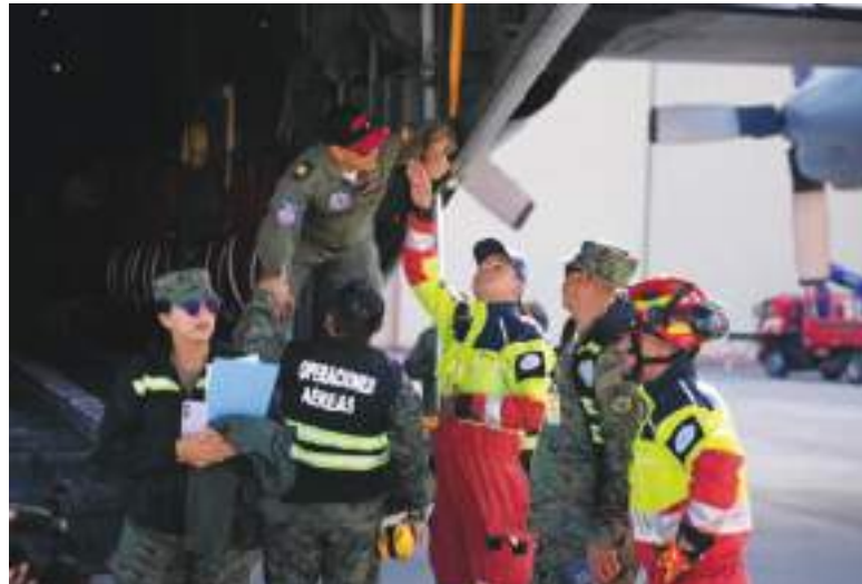
Rescatistas ecuatorianos emprenden su viaje a Venezuela.

A ello se suman, además, varios equipos de corte y perforación, cámaras con sensores sísmicos y dispositivos de detección acústica para localizar posibles víctimas bajo escombros, según ha detallado el cuerpo de Bomberos agregando que el objetivo es brindar "apoyo especializado" en las labores de