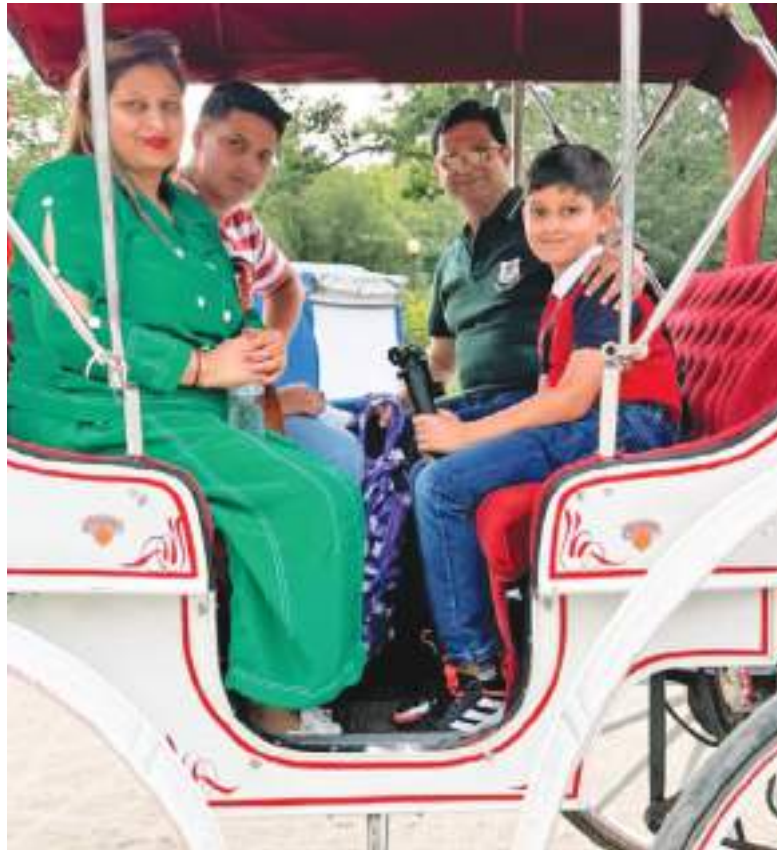
Foto de la familia poco antes del fatal accidente.