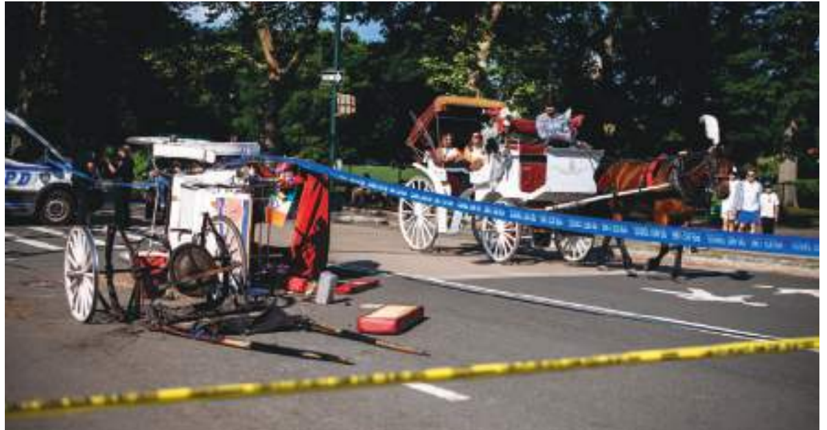
El lamentable hecho se produjo en el interior del Central Park, durante un paseo familiar.

La tradicional actividad turística vuelve a ser cuestionada en NY. En apenas una semana se presentaron dos problemas con los caballos y un joven ha perdido su vida. Ocho colisiones, fugas, colapsos y muertes relacionados con estos carruajes han sucedido en los últimos tiempos en la ciudad, por ello se pide prohibirlos definitivamente.