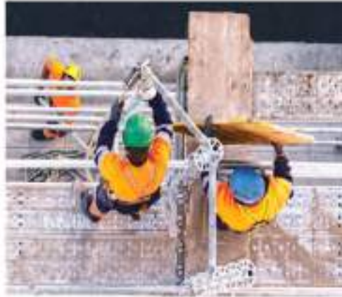
El papel que juega Ginarte en la protección de los trabajadores lesionados

En medio de esta controversia se encuentra el abogado Ginarte, que es reconocido por su