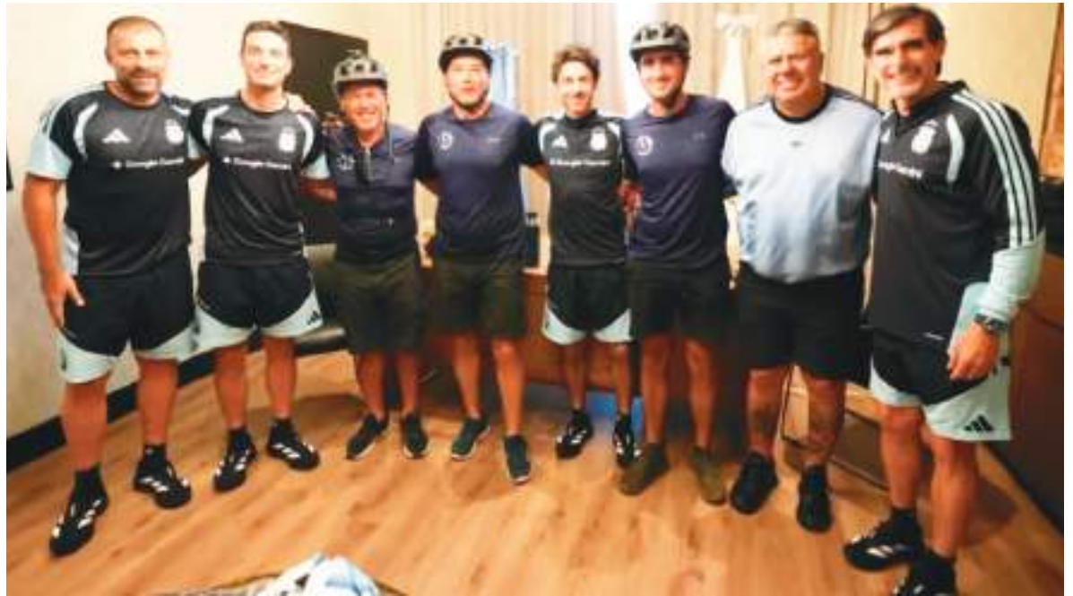
Los "cicloviajeros", de casco, fueron recibidos por el cuerpo técnico de la selección de Argentina.

El día que llegaron a Kansas, los tres viajeros integrantes del grupo @enbiciandoalmundo generaron una revolución. Fueron recibidos por un grupo local que los acompañó pedaleando en los últimos 40 kilómetros de su recorrido con